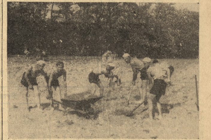
Śmigają łopaty — wylaniają się prostokąty boisk sportowych w cieniu sierakowskich lasów