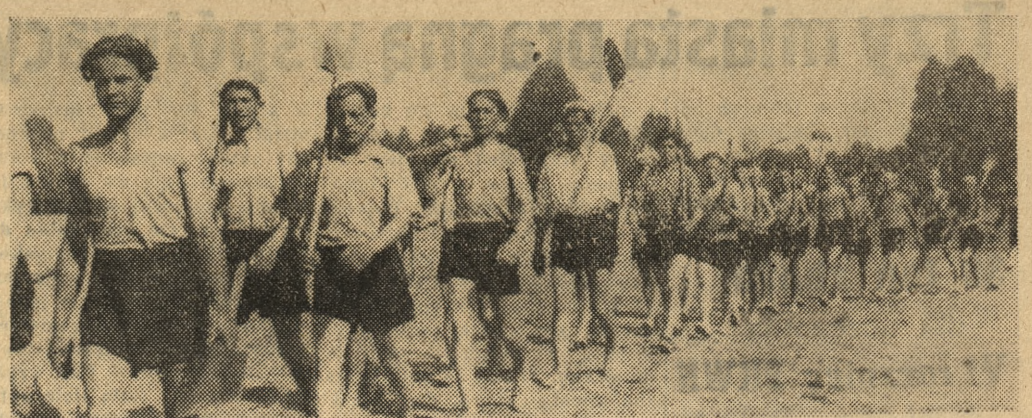
Wymarsz do prac ziemnych odbywa się w uporządkowanym szyku

Koszt wycieczki do Szczecina 950 zł od osoby, do Gdyni — 1200 zł. Suma ta obejmuje opłatę biletu kolejowego, przewodnika i zwiedzanie portów. Zgłoszenia przyjmuje „Orbis”. Uczestnicy wycieczki z powincji korzystają w drodze powrotnej z Poznania do miejsc zamieszkania z 66-proc. zniżki kolejowej.