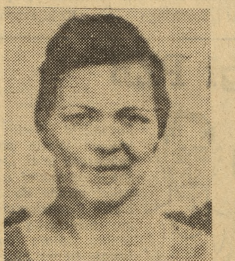
TOCZENOWA, rekordzistka w pchnięciu kulą. Wynik jej 14,86 m jest najlepszym na świecie.