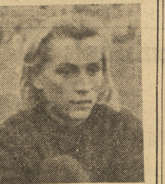
CZUDINA ALEKSANDRA, uzyskała w pięcioboju 4.934 pkt., co jest rekordem świata. Czudina znana jest z występów w Polsce. Na igrzyskach w Budapeszcie zdobyła 8 medali.