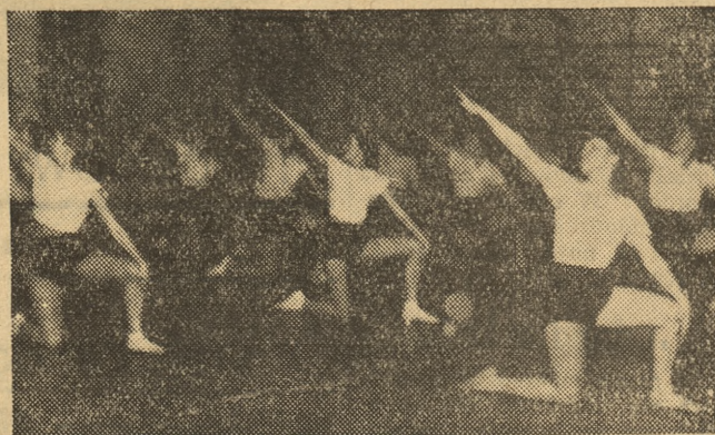
Słuchaczki Studium w efektywnym ćwiczeniu gimnastyki estetycznej

Obserwując ćwiczącą grupę słuchaczek, zgadzamy się w zupełności z tym zapewnieniem, nie możemy się jednak zgodzić z twierdzeniem, że zamężność przeszkadza w pracy instruktorskiej, że eliminuje kobiety całkowicie z życia spor-