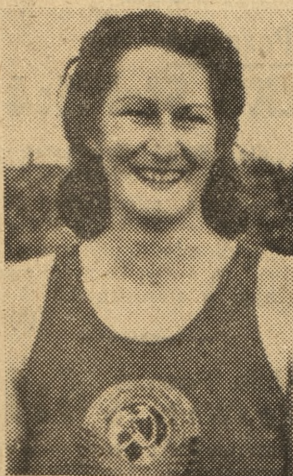
DUMBADZE NINA, fenomenalna dyskobolka, która wielokrotnie ustanawiała rekord światowy w swej specjalności, bijąc — ...własne rekordy. Żadna inna motaczka nie może nawet myśleć o poprawieniu w najbliższym czasie jej fantastycznego wyniku — 53,25 m.