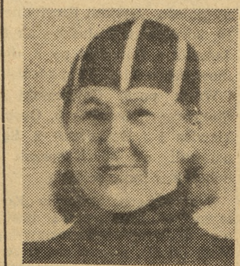
CHOLSZCZEWNIKOWA, druga obok Isakowej, najznakomitsza łyżwiarka radziecka, uzyskała rekord świata w biegu na 3.000 m.