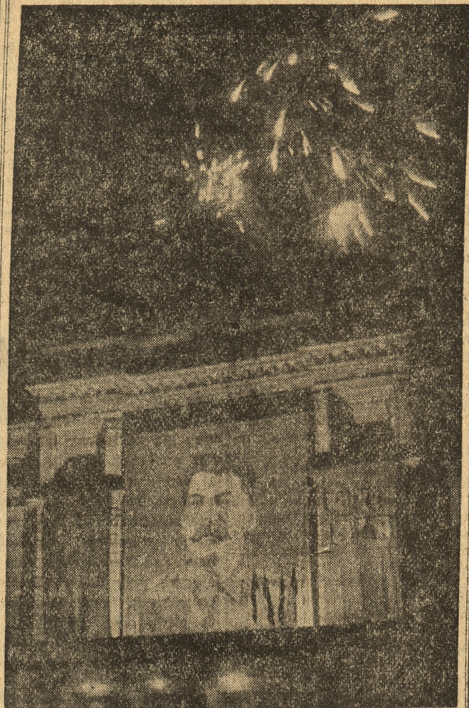
W dniu 70 rocznicy urodzin Generalissimusa Stalina odbyły się w Poznaniu piękne pokazy sztucznych. Przez półtorej godziny rozpryskiwały się nad miastem piękne kaskady kolorowych gwiazd. Na zdjęciu — gmach Teatru Polskiego w oświetleniu ogni bengalskich