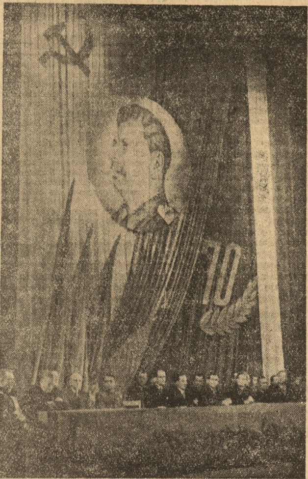
Prezydium akademii, jaka odbyła się w poznańskim Teatrze Wielkim z okazji 70 rocznicy urodzin Józefa Stalina

Nasilenie choroby stoi w odziedziczonej nie daje się ona tak