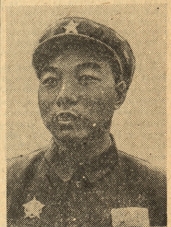
Gen. Hsiao Hua

wojny, młodzież polska wraz z całym narodem rozpoczęła pod przewodnictwem b. Polskiej Partii Robotniczej i Rządu Ludowego pracę nad odbudową zniszczonego kraju w niespotykanym dotąd tempie i z niespotykanym wstępnym.