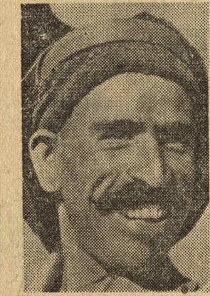
Tacy są Azerbajdżanie