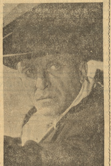
Spotkanie na Łabie

Gdyby wszyscy zdolni artyści europejscy zdobyli się na taką postawę jak James Mason, nie mielibyśmy tylu szmir amerykańskich filmowanych przez znane i cenione nazwiska i tyle zmanierowanych talentów aktorskich.