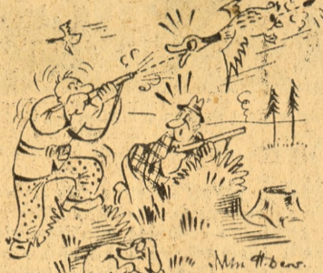
— Mówiłem ci lamago... żebyś nie strzelał, gdy ma dziób otwarty!!