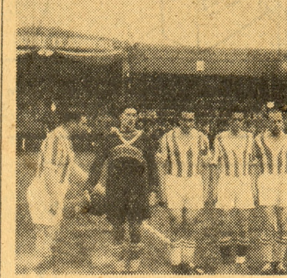
Drużyna piłkarska Jubilatów — Ostrowia, która w ostatnim meczu uległa liderowi grupy północnej — Garbarni z Krakowa w stosunku 0:5. Ostrowiaczy ukończyli pierwszą rundę rozgrywek o mistrzostwo II Ligi, plasując się na piątym miejscu.