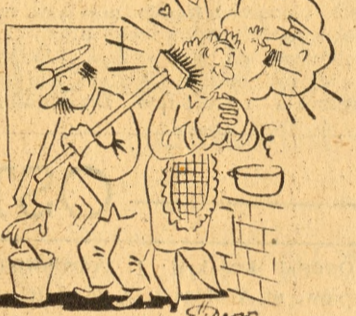
— ...Ależ?! Janie! Przecież już raz mnie pocałowałeś na pożegnanie!!