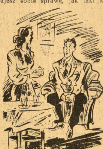
Wylali! — rzeki wreszcie grobowym głosem.

bieży pogardliwie uśmiechały się, jednak ja postanowiłem ów klej wypróbować. Kupiłem tubkę za 40 zł i., jazda do domu. Klej okazał się idealnym. Cały zabieg trwał pięć minut: biorę skarpetkę z dziurą, nakładam na grzybek, czyszczę ze stwardnienia gładką papierem, wycinam z byle czego łatkę, smaruję brzegi klejem, nakładam, przyklepuję młotkiem, cyk... i już gotowe. Trzyma jak żelazo — be — ton. Na drugi dzień zaopatrzyłem się w większą ilość drogiego kleju na tymże Rynku Łazarskim i z politowaniem spojrziałem na owe panusie nieświadome doniosłości chwili. Bo czy zdajesz sobie sprawę, jak taki klej