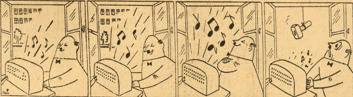
Lato. Cisza w powi etru. Otwarte szeroko okno... W taki to cichy wieczór Płyś galki radiowej dotknął