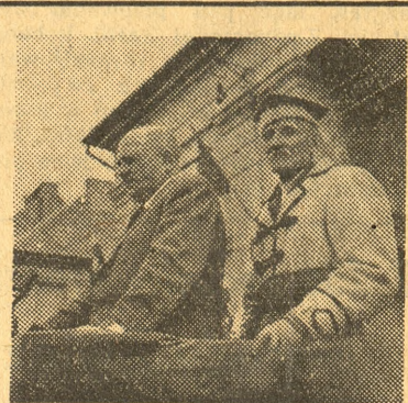
Marsz. Kowalski przemawia na uroczystościach Święta Ludowego w Rawie Mazowieckiej

Powiat rawski ma tradycje radykalnego ruchu chłopskiego. Z tego powiatu pochodzą wybitni działacze ludowi: marszałek Sejmu Władysław Kowalski i wicepremier Antoni Korzycki. Tu obok innych działaczy jeden z najbardziej radykalnych ludowców — Tomasz Nocznicki.