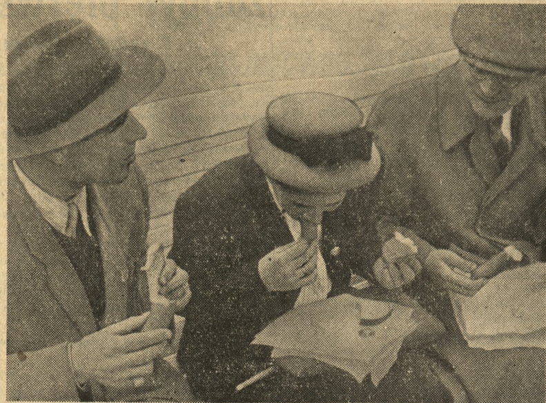
— Przy tym stoisku czujemy się najlepiej! — myślą sobie w duchu uwidocznieni na zdjęciu amatorzy ciepłej kiełbasy z musztardą i bułeczką. Nic dziwnego! Po dłuższej przechadzce wśród pawilonów MTP śniadanko takie, choć spożyte w pośpiechu, smakuje przewybornie.