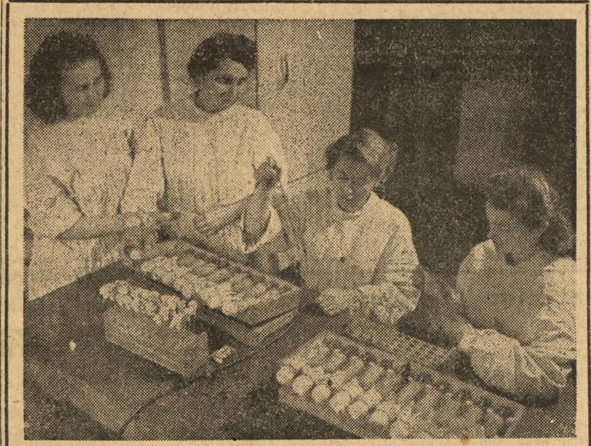
Oddział Państwowego Zakładu Higieny w Krakowie produkuje wyłącznie najnowocześniejszy typ szczepionki przeciw durowi brzuszemu „Endodur”. Poza tym Oddział produkuje szczepionkę przeciw czerwonemu, tyfusowi plamistemu, szczepionkę gonokokową i szczepionkę węgla, przeciw schorzeniom ropnym oraz szczepionkę przeciwgruźliczą BCG dla województw krakowskiego, kieleckiego i śląsko-dąbrowskiego. Zdjęcie przedstawia kontrolowanie na jałowość szczepionki przeciwgruźliczej BCG dla noworodków.

Gdy myślimy o czasach... „MODA I ŻYCIE PRAKTYCZNE” NR 12 d47