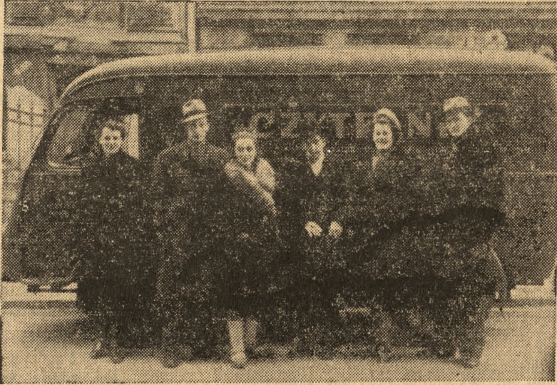
Oto grupka artystów spod znaku „Żywego słowa“ ze swym wiernym przyjacielem - samochodem „Czytelnika“.

polksi i niesie z sobą muzykę, recytację, taniec i śpiew. Woli tej nie uszczerbił niepogoda, zie drogi, męczące podróże, bo zespół chce zanieść robotnikom i chłopom swoją pielegnowaną pieczołowicie — sztukę. Dwadzieścia kilka występów miesięcznie, to owoc