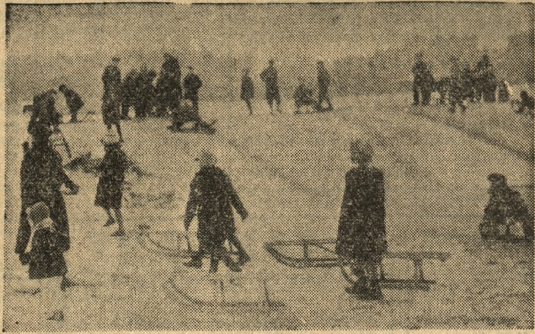
Wielotygodniowe marzenia naszej dzieciarni spełniły się. Pierwszy śnieg, choć skąpy w swej ilości, pokrył ziemię na tyle, że można było po raz pierwszy w tym roku wybrać się na saneczki. Dzieci poznańskie nie ominięły tej okazji. Na torze saneczkowym przy ul. Jarochońskiego gwarło od młodych, radosnych okrzyków. Młodzież przeżywa tu najprzyjemniejsze godziny zimowego okresu.