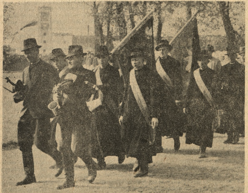
Z sztandarami na Święto Ludowe