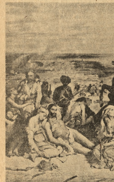
Eugene Delacroix (1797-1863) „Masakra w Chios”

lata wędrówek już o ściśle ziemioznawczych podstawach. Wincenty Pol marzy o naukowym opisie całości ziem polskich. Zawija kontaktami osobistymi i przyjacielski w wielu uczonymi polskimi. Od każdego z nich uczy się metod badawczych. Jego geografia ma silnie podrysony aspekt przyrodniczy...