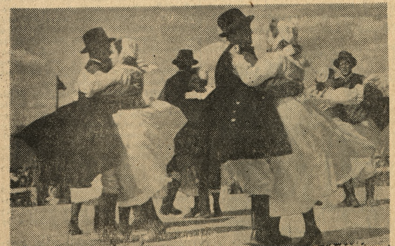
Tańcami kończą się uroczystości ludowe