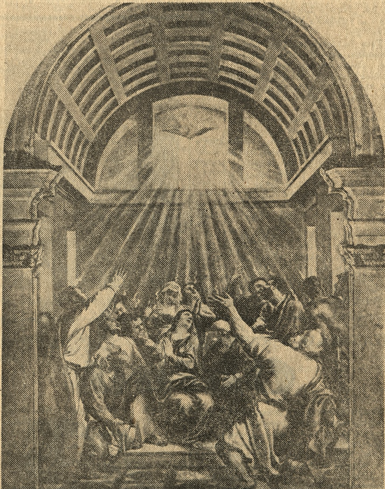
Tycjan — zesłanie Ducha Świętego

Do XIV wieku wyobrażenia Zesłania Ducha Świętego występują prawie wyłącznie w sztuce drobnej,