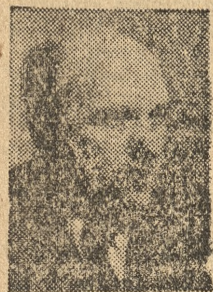
Marszałek Sejmu Władysław Kowalski

Rządowe projekty ustaw o ratyfikacji polsko-radzieckich umów granicznych uchwalone jednomyślnie