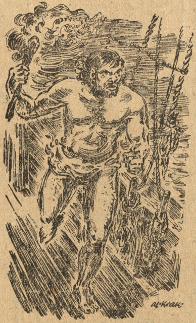
Ilustr.: Al. Krakowski

Gdyby „Salvador” był należycie stawiał czoło niebezpieczeństwu, i w ten sposób dodał odwagi innym dwóm okrętom, które zdolne były jeszcze do walki, Hiszpanie może, mimo wszystko, wyszłyby zwycięsko z tej potrzeby. Ale niestety chcieli, że „Salvador” właśnie wiozł cały skarb floty, wynoszący jakich 50 000 dukatów w złocie. Chciwy, jak wszyscy Hiszpanie, Don Miguel przede wszystkim dbał o to, by skarb nie dostał się w ręce piratów, skierował więc statek ku wyspie Palomas i fortowi, stojącemu na straży cieśniny. (Ciąg dalszy nastąpi)