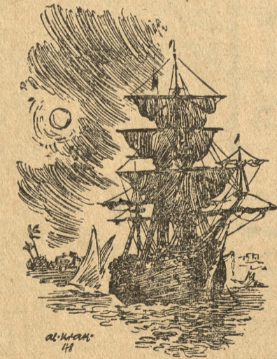
Ilustr.: Al. Krakowski. Około połowy grudnia okręt ich zrzucił kotwicę w zatoce Carlisle.

Około połowy grudnia okręt ich zrzucił kotwicę w zatoce Carlisle i wysadził na ląd pozostałych przy życiu około 42 skazanców.