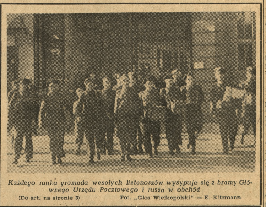
Każdego ranka gromada wesółych listonoszów wysypuje się z bramy Głównego Urzędu Pocztowego i rusza w obchód

Katastrofa wydarzyła się w pobliżu linii oddzielającej brytyjską część Berlina od sowieckiej w chwili, gdy samolot brytyjski krążąc, przygotowywał się do lądowania na lotnisku. Samolot ten odbywał regularne loty z Londynu do Berlina przez Hamburg. W czasie katastrofy niebo było zachmurzone i mżył drobny deszcz. Wśród pasażerów samolotu brytyjskiego był jeden z wyższych urzędników ministerstwa spraw zagranicznych. (p. r.)