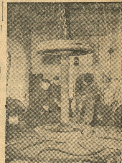
Wagony chore i okaleczone przychodzą szybko do zdrowia w gliwickich Warsztatach Głównych. Oto gwizdek robotników przy naprawie kół wagonowych.

Brak czasu nie pozwala uczestnikom ogólnopolskiej wycieczki dziennikar-