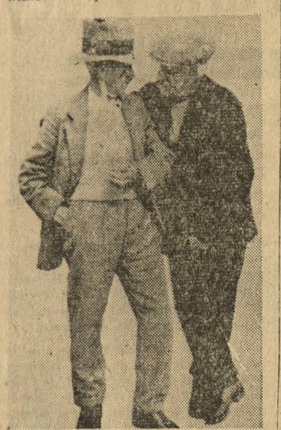
Słyszales? mamy płacić za nowe zbrojenia.

London, w październiku This is London calling... This is London calling... Radiosłuchacze brytyjscy z przyjemnością słuchają milego głosu niewidzialnego gentlemana z BBC. Budzi ich rano, wieczorem do snu układa. Podaje dziennik wieczorny, zapowiada pogodę i programy muzyczne. Ostatnio jednak audycje stały się dla każdego muzycznego ucha jeżdżącym pasmem zgrzytów. Najbardziej nawet ciepłego radiosłuchacza mogą one wyprowadzić z narodowej flegmy. Kto winien? Oczywiście nie wielka orkiestra symfoniczna Londyńskiej Filharmonii.