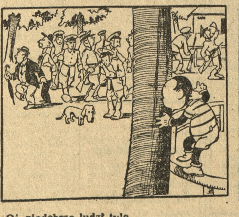
Oj, niedobrze ludzi tyle, gdzie ja się przed nimi skryję!