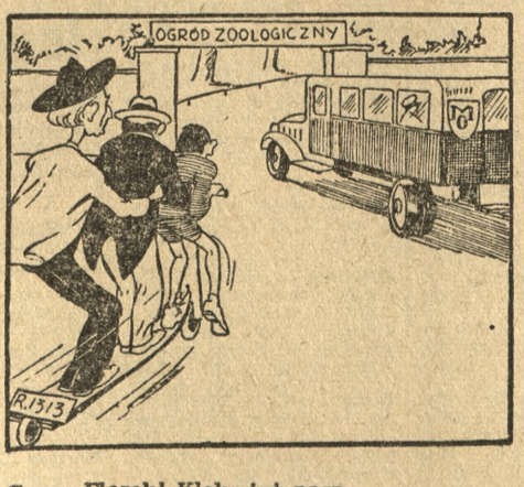
Gazu, Florekl Kleks już nasz. Patrzcie, tam nadjeżdża straż.