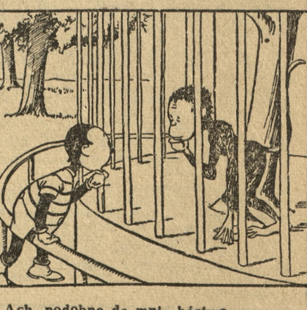
Ach, podobne do mnie bóstwo, całkiem jak bym patrzył w lustro!