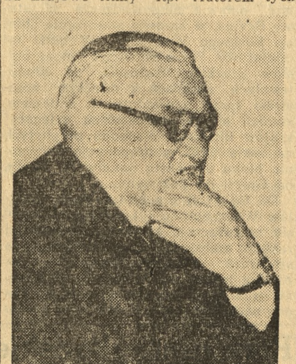
Nie ból zębów — lecz brak pieniędzy trapi min. Bevina

„Pal tylko krajowy tytoń”, „Popieraj tylko krajowe wyroby”, „Chodź tylko na krajowe filmy” itp. Autorem tych