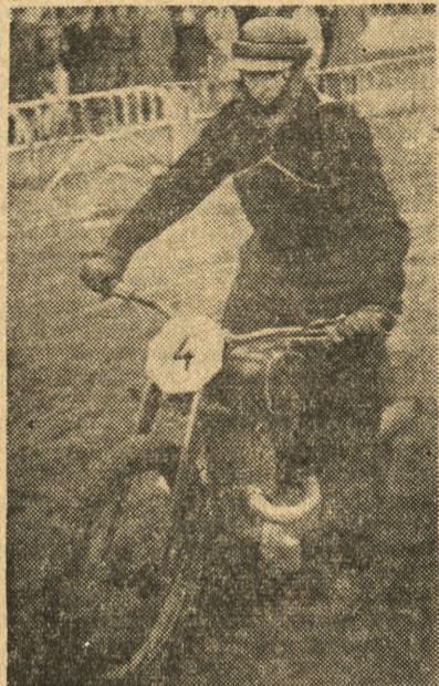
Smoczyk LKM Leszno — bohater wczorajszego międzynarodowego meczu motocyklowego na żużlu Polska — Czechosłowacja

Spotkanie trzymało widzów w napięciu. Walka była b. zacięta i z trudem zdobywano każdy punkt.