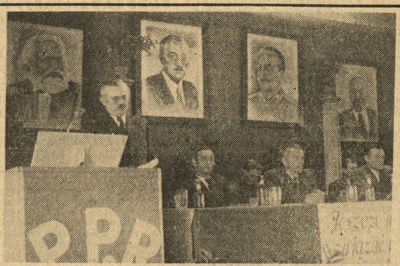
W ubiegłą sobotę w stołowce zakładów H. Cegielskiego w Poznaniu odbyło się ogólne zebranie partyjne, na którym min. Minc, członek CK i Biura Politycznego PPR wygłosił referat o potrzebie krytyki i samokrytyki. Zdjęcie przedstawia min. Minc'a w czasie przemówienia.