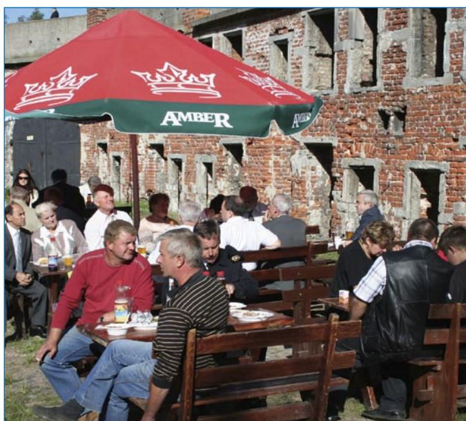
Spotkanie na poczęstunku i kuflu piwa w Twierdzy Wisłoujście.