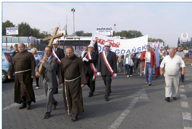
Pielgrzymi z Portu Gdańskiego w drodze na wały klasztoru.

Tradycyjnie, w trzecią niedzielę września odbyła się na Jasnej Górze Pielgrzymka Ludzi Pracy. Uroczystości rozpoczęły się już w sobotę 16 września w intencji Ludzi Morza. Także Apel Jasnogórski o 21,00 a później były ze Świętem Pracy.