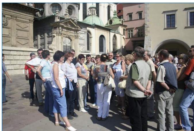
... i Wawelu w Krakowie.