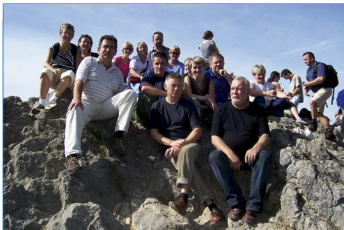
Grupa pielgrzymów na szczycie Nosala.