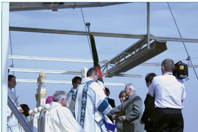
Delegaci „Solidarności” Portu Gdańskiego przekazują sztandar Związku jako dar ołtarza.

nej Górze w Częstochowie XXIV Ogólnopolska Pielgrzymka rześnia 2006 r. „, Mszę Świętą odprawioną na szczycie otem Droga Krzyżowa na Wałach tematycznie związane