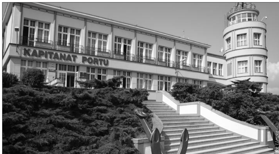
Siedziba Kapitanatu w Porcie Gdańskim oraz spółki „WUŻ” Port and Maritime Services Ltd Sp. z o.o.