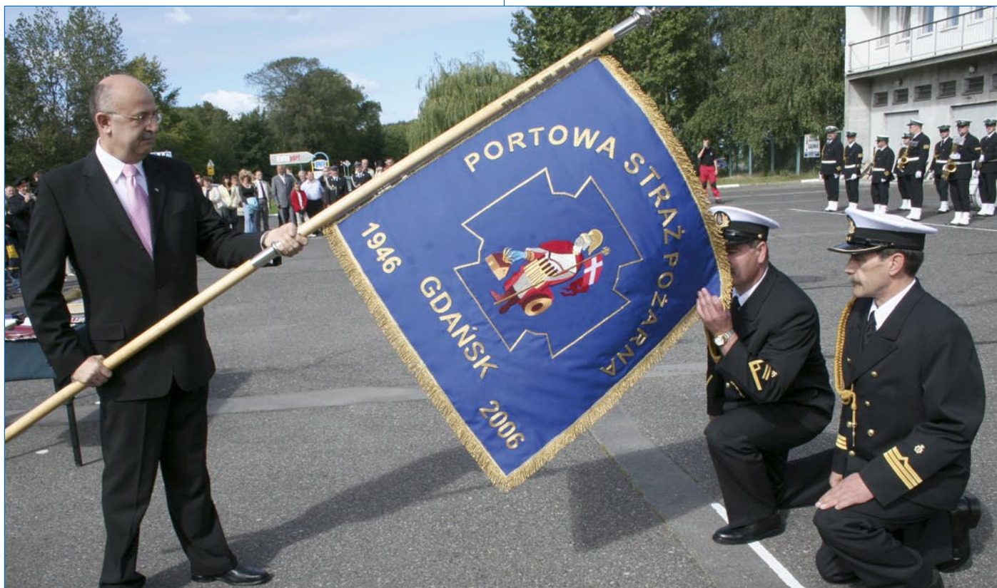
Przekazanie sztandaru portowym strażakom.

We wrześniu br. mija 60 lat od utworzenia w Porcie Gdańskim Portowej Straży Pożarnej. Chcąc uświetnić to wydarzenie portowi strażacy zorganizowali 9 września br. rocznicową uroczystość.