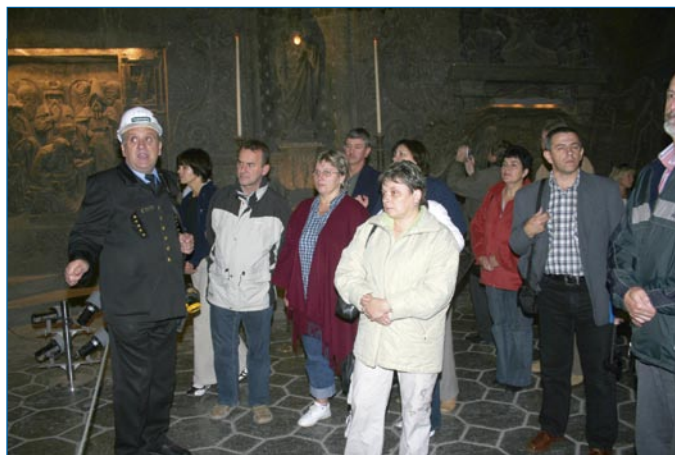
Zwiedzanie kopalni soli w Wieliczce...