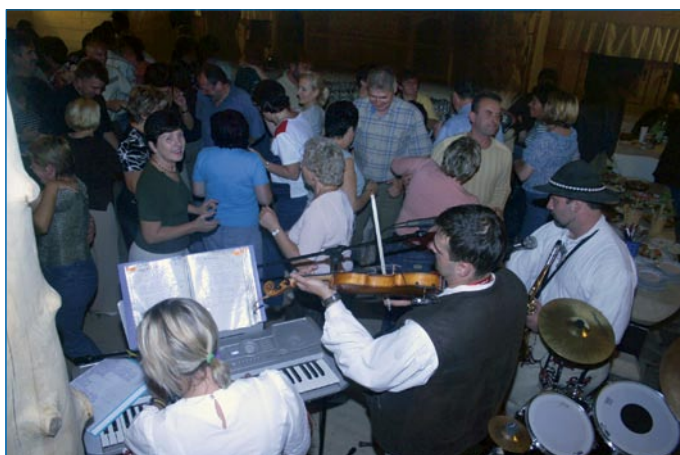
W trakcie 3-dniowej pielgrzymki był też czas na chwilę rozrywki.

z góralami z Murzasichle mogliśmy poczuć prawdziwy klimat górskiego biesiadowania. W sobotę po śniadaniu autokarami udaliśmy się do Zakopanego na kilka godzin. We własnym zakresie mogliśmy zwiedzać Krupówki, uroczne stare kościoły, cmentarz na Pęksowym Brzyzku. Niektórzy z nas byli też na Gubałówce, gdzie z tarasów podziwialiśmy skąpane w słońcu szczyty naszych Tatr z Giewontem i jego krzyżem na czele.