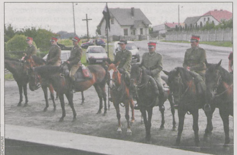
Podczas mszy św. w Starymgradzie, 2014 r.

23 lipca, w piątą rocznicę swego istnienia, Stowarzyszenie Rodzina Ułańska z siedzibą w Krotoszynie obchodzić będzie Święto 25 Pułku Ułanów Wielkopolskich, czyli jednostki, której tradycje kontynuuje.