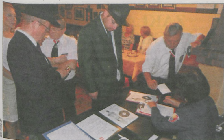
Chętnych do rywalizacji nie brakowało