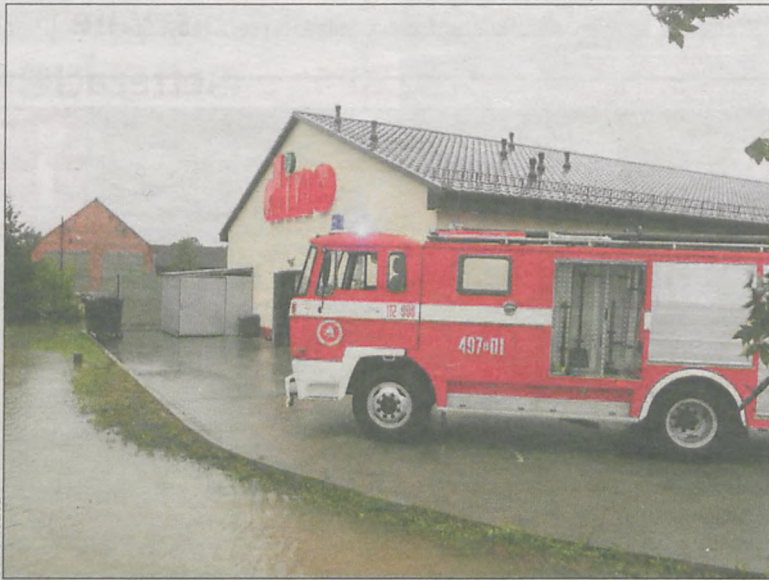
Akcja przy markecie

14 lipca był niezwykle pracowitym dniem dla strażaków z Ochotniczej Straży Pożarnej w Smolicach. Wszystko przez deszcz i silny wiatr, szalejące nad powiatem krotoszyńskim. Z ich skutkami walczyli 7 godzin.