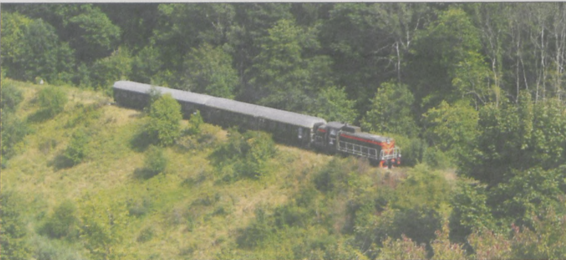
Turkol na szlaku wśród lasów