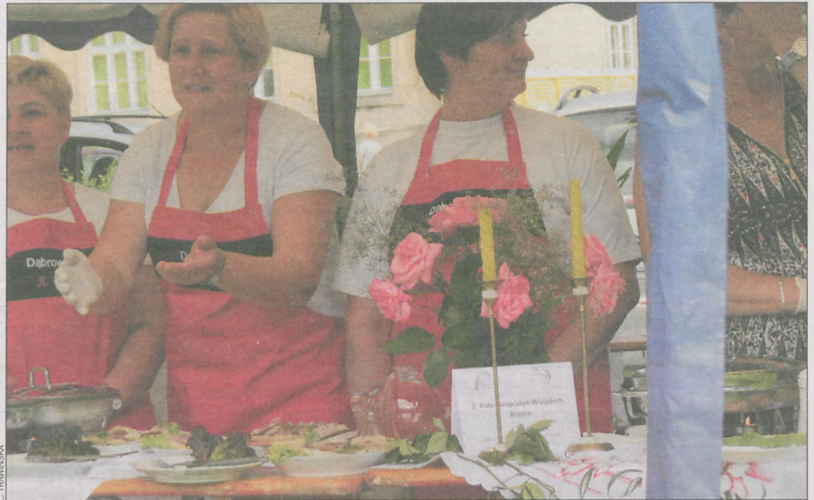
Panie z Koła Gospodyń Wiejskich z Brzozy dawały z siebie wszystko

10 lipca koźmińskie podzámce stało się miejscem degustacji potraw i dobrej zabawy. Tego dnia zorganizowano bowiem czwarty już z rządu Ogólnopolski Festiwal Wieprzowiny. Wybornych dań wieprzowych próbowali wszyscy przybyli na imprezę.