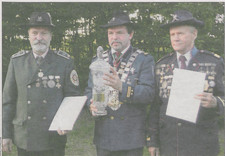
Najlepsi w strzelaniu o Puchar Prezydenta RP

17 lipca na strzelnicy krotoszyńskiego bractwa kurkowego rozegrano turniej strzelecki. Rywalizowano m.in. o Puchar Prezydenta RP, a także o Tarczę Charytatywną i Sponsorowaną.