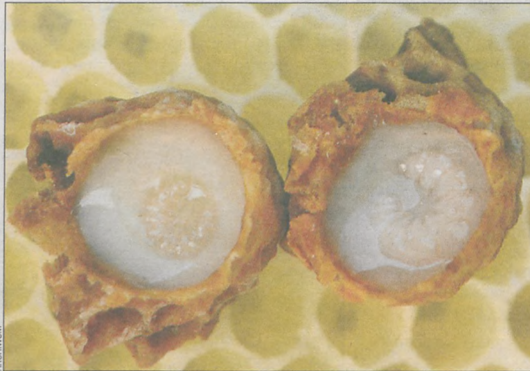
Tak wygląda mleczo pszczele

Ma stymulujący wpływ na centralny układ nerwowy, bo usuwa zmęczenie, podwyższa efektywność pracy i powoduje przyływ sił witalnych. Z tego względu stosowanie mlecza pszczelego jest także w stanach wyczerpania, osłabienia i napięcia mięśniowego, a także w bezsenności. Mleczo