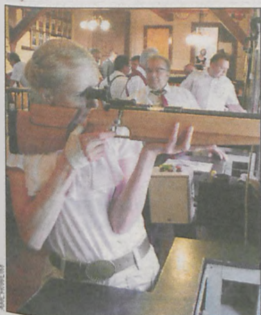
Najważniejsze było skupienie