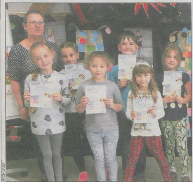
Dzieci każdego dnia poznawały nowy świat

Zdunowska biblioteka zakończyła wakacyjne spotkania z grupą dzieci w wieku od 6 do 10 lat.