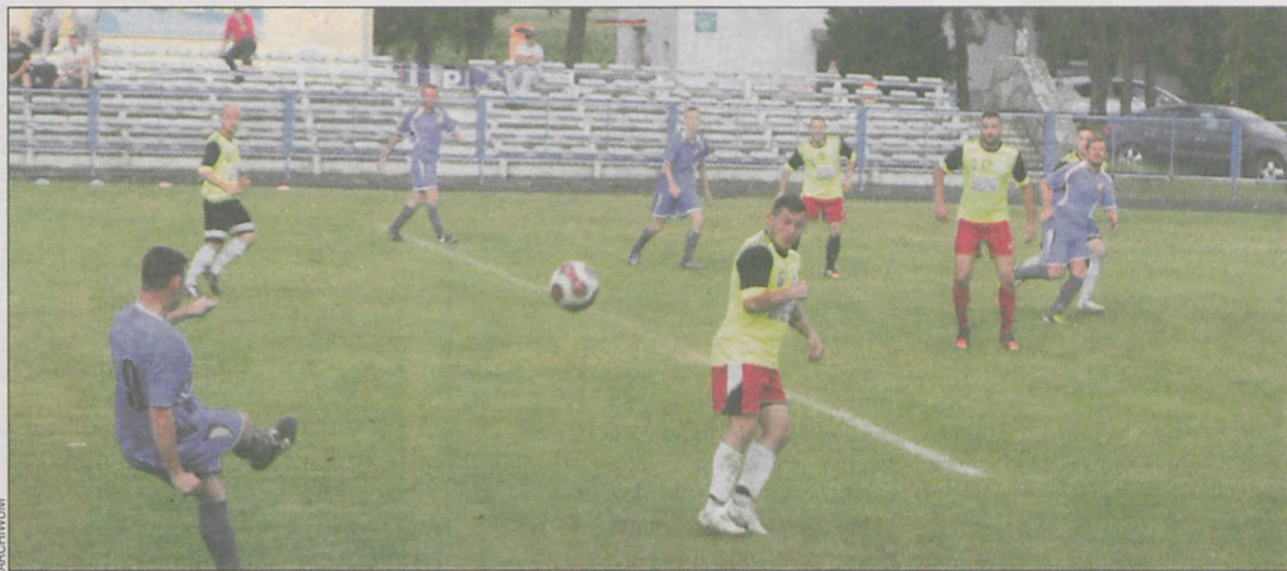
Mecz obfitował w kontry