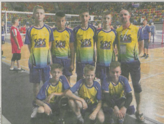
Zawodnicy UKS Piast Krotoszyn w Częstochowie