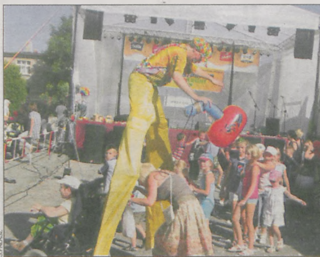
Jarmark na ul. Łacnowej z okazji Pogranicza Kultur (2011 r.)