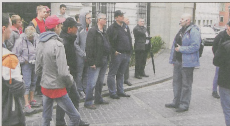
Druhowie (teraz na sportowo) z uwagą słuchali przewodnika