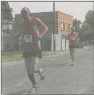
Bieg Piłsudskiego 2015

Imprezę zorganizowali: gmina Kobylin, rada sołecka Kuklinowa, tamtejsze stowarzyszenie kuKLIŃÓW oraz szkoła podstawowa. (mal)