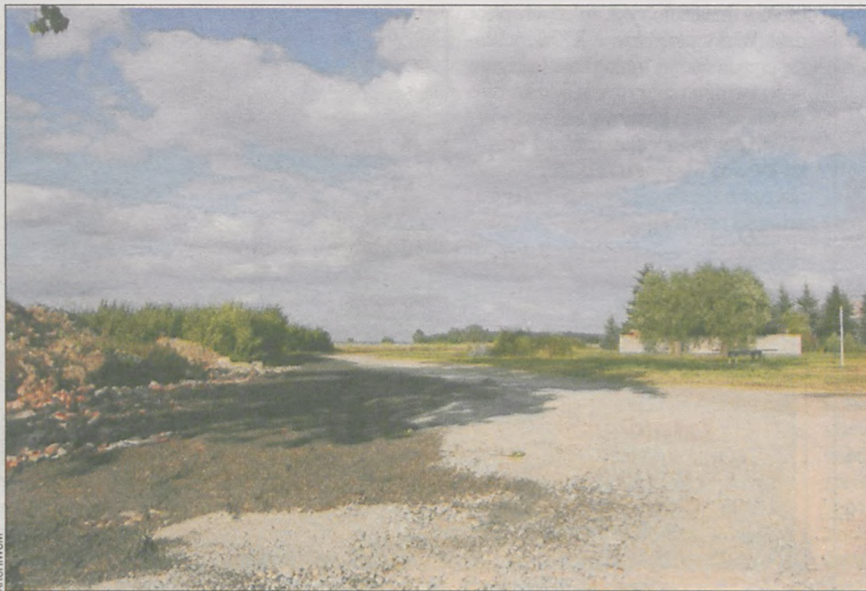
Teren wokół stawu został utwardzony