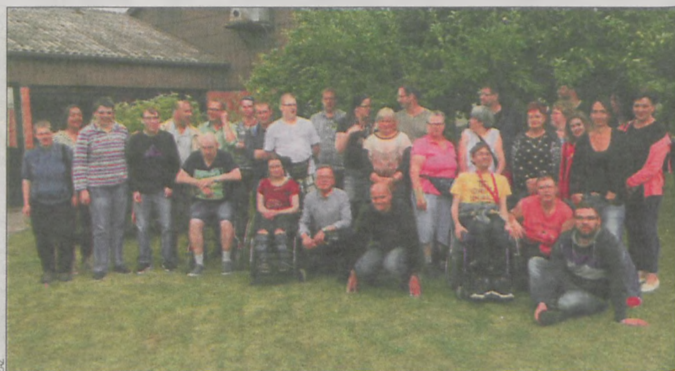
To spotkanie sprzyjało integracji

Zarząd niemieckiego zakładu przygotował dla gości z Koźmina wiele atrakcji, m.in. odwiedzenie największego w Dolnej Saksonii parku rozrywki, turniej gry