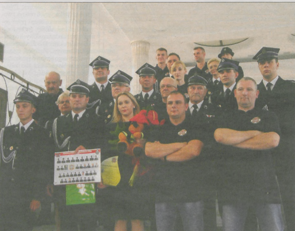
Strażacy wręczyli pani poseł upominki