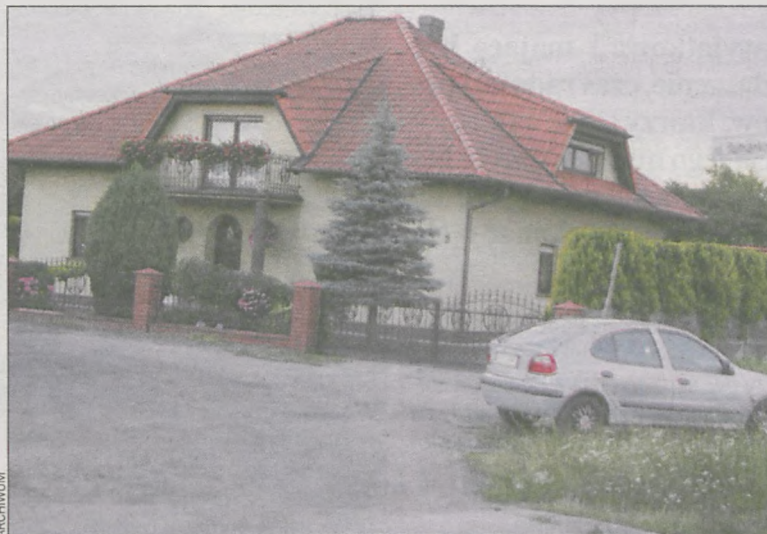
Fragment ulicy Rumiankowej

Jak mówi Franciszek Marszałek, burmistrz Krotoszyna, magistrat pokryje większość kosztów przebudowy ulicy. Wkład mieszkańców wyniesie więc 34 proc. – Myszę, że mieszkańcy nie są w stanie zwiększyć kwoty swojego dofinansowania. Zrealizujemy tę inwestycję – zapewniam . Termin zakończenia prac wyznaczony został na koniec września. (mal)