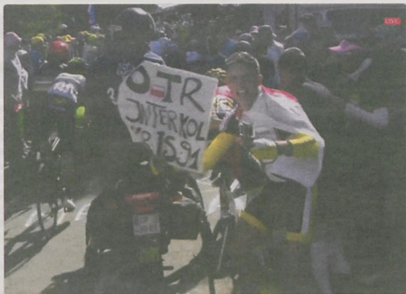
Na Twitterze o incydencie z Kubikiem dyskutowali nie tylko Polacy i nie przebiegali w słowach

Who Is This IDIOT? #froome #tourdefrance #crash