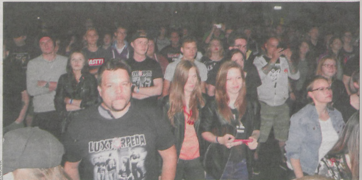
Wiele osób przyszło na koncert z koszulkami z logo zespołu

Więcej zdjęć na www.rzeczkrotoszynska.pl