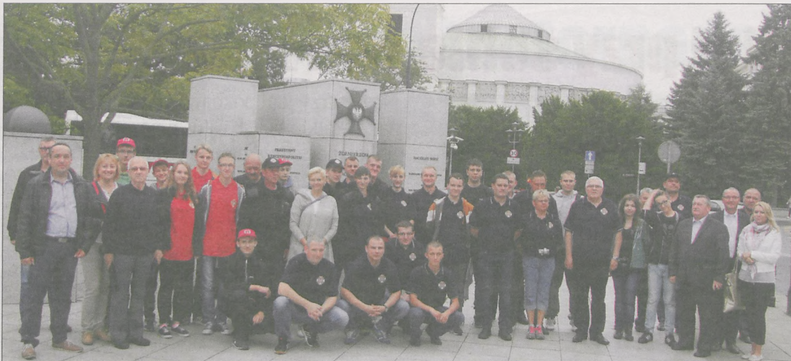
Zwiedzanie rozpoczęliśmy od parlamentu