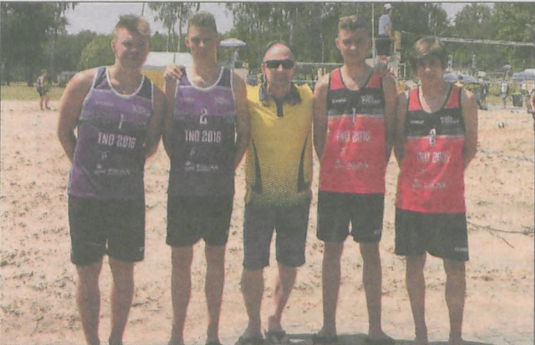
Pary z siatkarzami Piasta Krotoszyn z trenerem