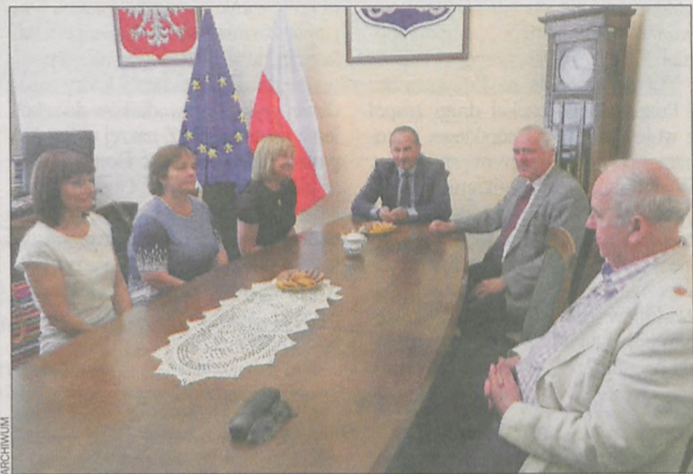
Współpraca z Mejszagotą trwa od wielu lat

Podczas spotkania u wójdarza Krotoszyna rozmawiano o sytuacji polskiego szkolnictwa na Litwie i planach dalszej współpracy, wspieranej przez projekty unijne. (lg)