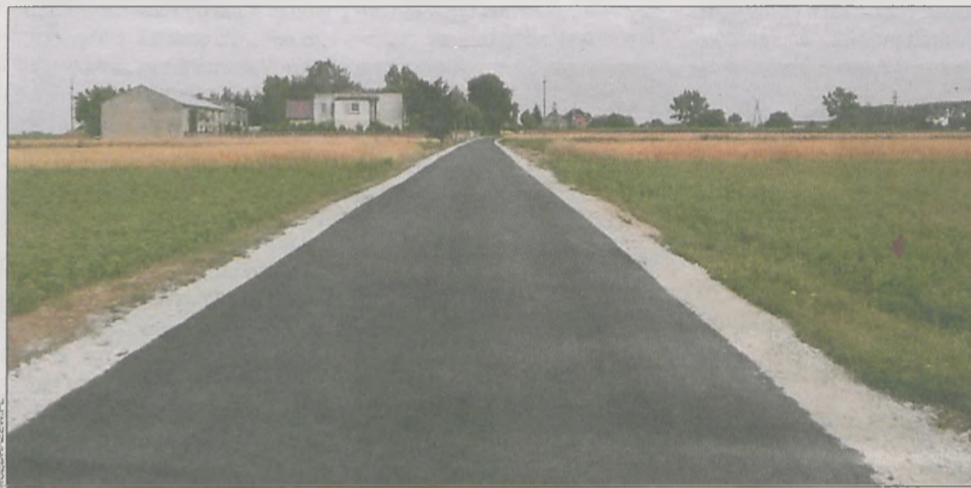
...i po renowacji

ostatniego odcinka (134 m) ulicy Parkowej w Rozdrażewie.