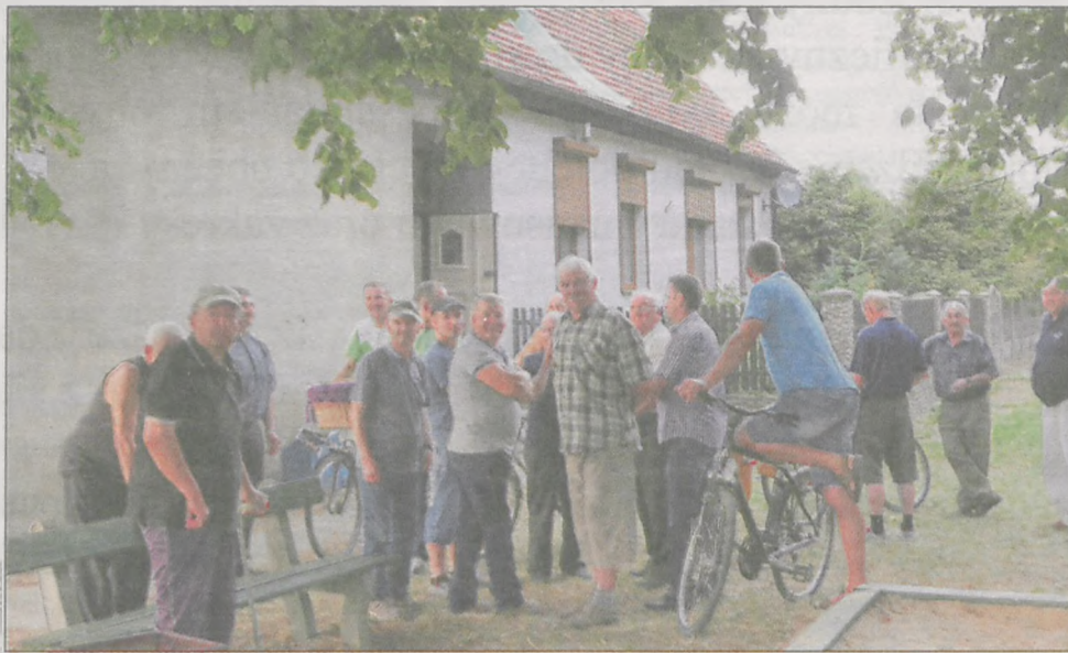
Uczestnicy zebrania przed budynkiem, w którym znajduje się świetlica

W związku z tym, że rodzina zamieszkująca budynek ponawia wnioski do gminy, ta musiała zająć stanowisko. Burmistrz Maciej Bratborski zawsze kon-