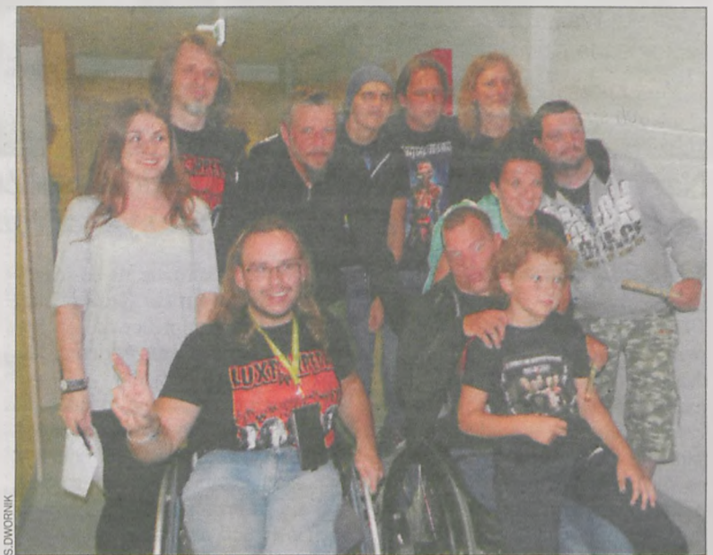
Po koncercie robiono sobie zdjęcia z artystami