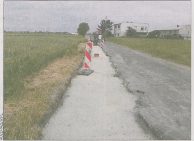
Droga w Budach przed...