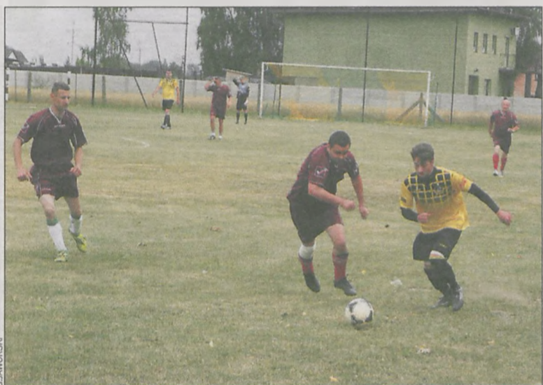
Mecz rozegrano na odnowionym boisku