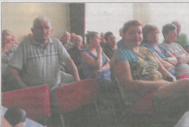
Chęć oddania głosu była bardzo duża

Przygarnij psa. Urząd Miasta i Gminy Koźmin Wlkp. informuje, że osoby zainteresowane adopcją bezdomnych psów mogą za pośrednictwem konta facebookowego Psy Bezdomne-Koźmin Wlkp. obejrzeć zdjęcia tych zwierzątek. Wspomniane konto polecane jest też osobom, którym przez chwilową nieuwagę uciekł pupil i nie mogą go samodzielnie znaleźć.