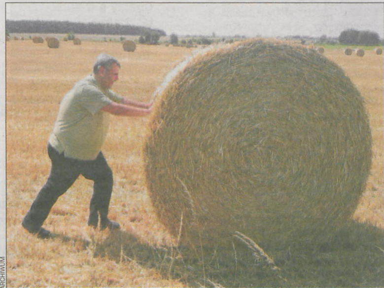
Takie zachowanie może być niebezpieczne

Wzmoczoną uwagę należy zachować przy obsłudze maszyn. Ważne też, aby czynności te wykonywały osoby dorosłe z wymaganymi kwalifikacjami. – W żadnym wypadku nie należy przystępować do napraw i regulacji maszyn rolniczych przy włączonym zasilaniu – apeluje w napisanym przez siebie liście do gospodarzy