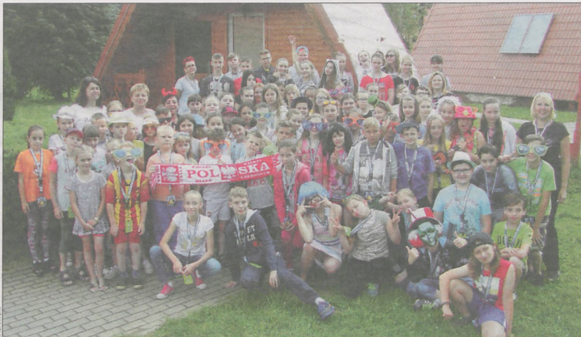
Uczestnicy wyjazdu mieli dobre humory

Zarządzenie Burmistrza Krotoszyna nr 780/2016 z dnia 14.07.2016 r.