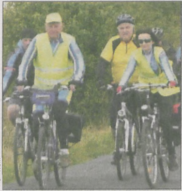
Już warto zacząć przygotowania

Dystans zaplanowanego na 17 września rajdu to 101 km. Wpisowe dla członków PTTK wynosi 35 zł, dla pozostałych osób 45 zł. Trzeba je uiścić do 7 września. W wyjeździe mogą