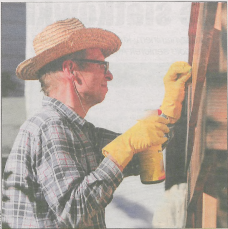
Remontować czy wypoczywać? – dylemat niejednej osoby

Dobra pogoda i wolne od pracy dni. Dla jednych to idealny czas na wyjazd, by wypocząć i naładować baterie. Dla innych – dobra okazja do wyremontowania mieszkania. Każdy ma wybór. Na ten temat rozmawialiśmy z naszymi Czytelnikami i przedstawicielami firm budowlanych.