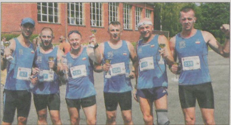
Ekipa Krotosza w Sławnie, po biegu na 7,5 km