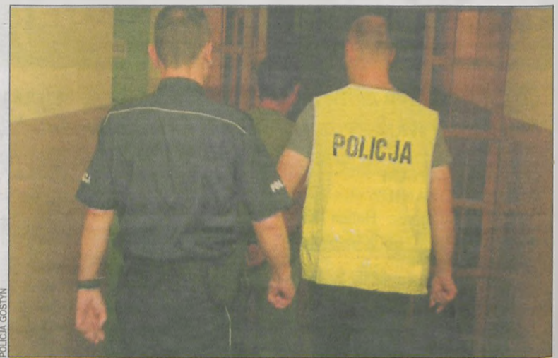
Policja zatrzymała sprawców kradzieży

W toku śledztwa ustalono, że do kradzieży doszło w dwóch etapach. W pierwszej kolejności złodzieje wynieśli mniejszy silnik, o mocy 7 KW. Kilka dni później wrócili, by ukraść większy (50 KW), ważący prawie pół tony. Zabrali również 2 stalowe wózki. W załadunku najcięższego hupu