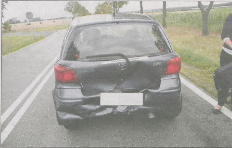
Pasażerów toyoty odwieziono do szpitala

Do zderzenia trzech samochodów osobowych doszło na drodze krajowej pomiędzy Cieszkowem a Miliczem, przy skrzyżowaniu z drogą do Guzowic.