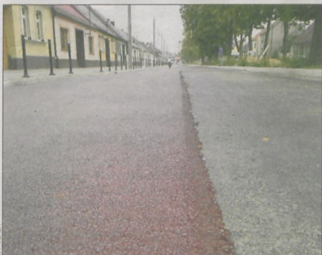
Czerwony asfalt powstaje

targu brały udział 4 przedsiębiorstwa – dwa z Ostrowa, po jednym z Kobyli i Kępna. Jedna oferta została odrzucona ze względów formalnych. Termin wykonania robót wyznaczono na 25 listopada. (spm)