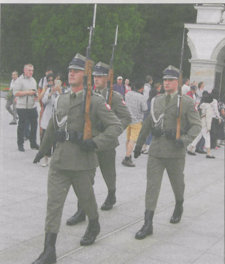
Byliśmy świadkami zmiany warty przy Grobie Nieznanego Żołnierza