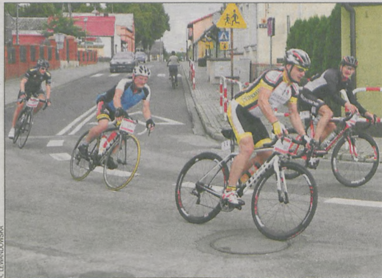
Były ucieczki i pościgi, zmęczenie i radość z przejechanego dystansu

kacji generalnej, zakończył maraton z czasem 7:22:47. Jechał ze średnią prędkością 35,8 km na godzinę. W kategorii wiekowej M4 (40-49 lat) stanął na najniższym stopniu podium. W klasyfikacji generalnej maratonów rowerowych rozgrywanych w różnych miastach Polski zajmuje obecnie 39.