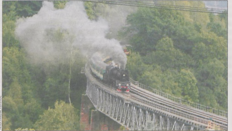
„Kilof” na jednej z piękniejszych wizualnie linii kolejowych w Polsce