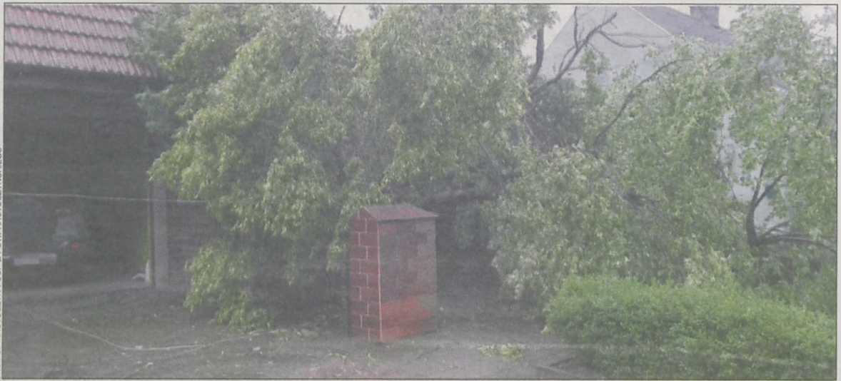
Jedno z powalonych drzew

wają jeszcze pojedyncze zgłoszenia wiatrołomów, ale zagrożenia likwidowane są na bieżąco. (popi)