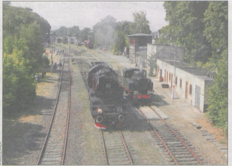
Parada Lokomotyw w Międzychodzie

Pociąg Kilof zabierze nas w pełną wrażeń podróż po jednej z piękniejszych wizualnie linii kolejowych w Polsce (odcinek Wałbrzych Gł.-Nowa Ruda). Start 27 sierpnia o godz. 05.44 z Leszna (powrót 22.25). Na trasie, oprócz imponujących widoków ze wspaniałych wiaduktów, dodatkowe atrakcje w postaci gaszenia parowozu, spaceru po Nowej Rudzie oraz wizyty