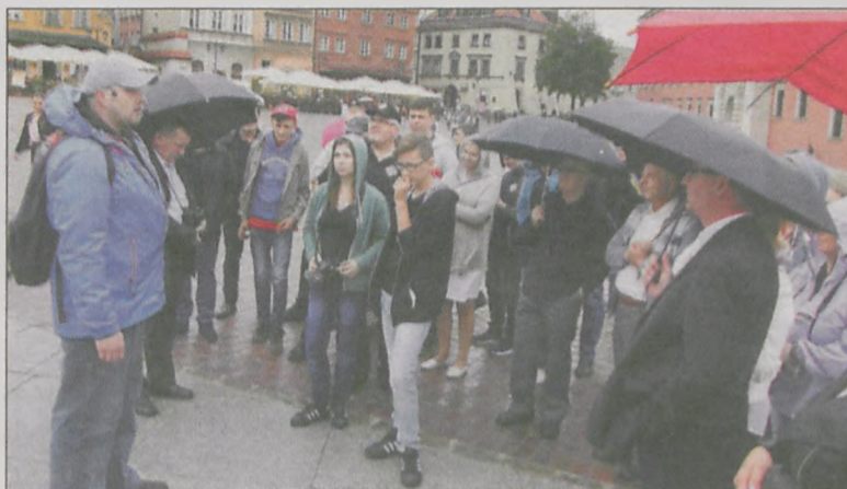
Mimo kapryśnej pogody, nastroje były bardzo dobre