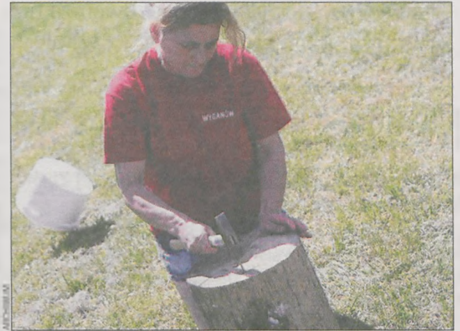
Wbijanie gwoździ to poważna sprawa

zł to trochę za mało na taki zakup. Będziemy rozmawiali z gminą, czy nie mogłaby trochę dołożyć – mówi sołtys Kuklinowa.