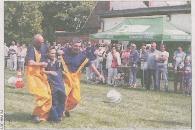
Konkurencje wymagały sporej sprawności fizycznej

Nagrody od gminy Kobylin to 3 tys. zł za pierwsze miejsce, 2 tys. zł za drugie, 1 tys. zł za trzecie. Rady sołeckie będą musiały podjąć decyzje, jak te pieniądze zostaną spożytkowane. – Chcielibyśmy kupić klimatyzację do naszej świetlicy, ale 3 tys.