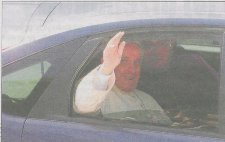
Już niedługo przyjedzie do Polski papież Franciszek

Światowe Dni Młodzieży to wyjątkowe i mające być umocnieniem dla młodych wydarzenie, czas radości i poznawania ludzi z innych krajów, którzy – tak jak my – wierzą w Jezusa. W dniu wyjścia tego numeru gazety będzie jeszcze możliwość zdecydowania się na wyjazd do Krakowa bądź Kalisza, dlatego chcemy przekonać tych, którzy może jeszcze się wahają.