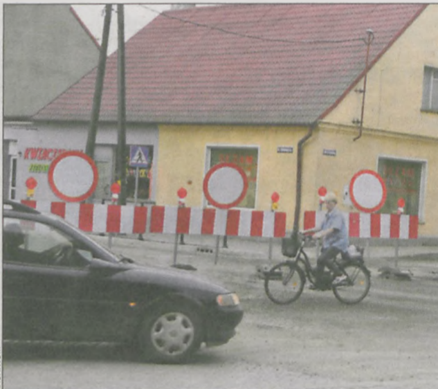
Aleja Klonowicza nadal jest zamknięta

Radni zauważyli, że krawężniki od strony Rynku, na placu przy przystanku autobu-