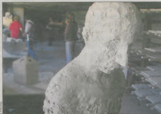
Jedna z rzeźb, która powstała podczas festiwalu

szyna. – Kilku dідeжeжów wyszło z inicjatywą, żeby zorganizować taką imprezę. Przychyliłiśmy się do ich pomysłu, będziemy go wspierać – poinformowała dyrektorka ZOK.