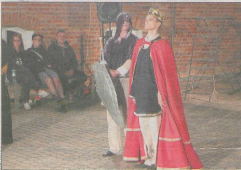
Historyczne przedstawienie wzbudziło duże zainteresowanie