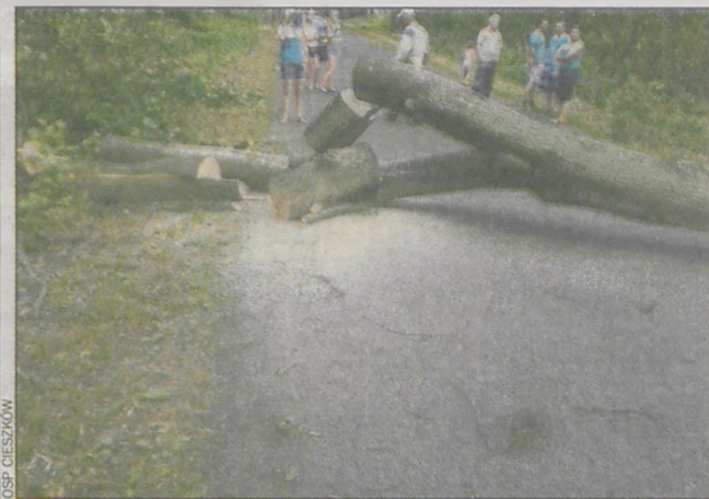
Pomoc strażaków była niezbędna

Klasyfikacja końcowa finału MP (rocznik 2004): 1. UKS SET Starogard Gdański, 2. Lechia Tomaszów Mazowiecki, 3. Plas Kielce, 4. MKS Bzura Ozorków, 5. KS Metro Warszawa I, 6. PSP 11 Kędzierzyn-Koźle, 7. UKS Plas Warszawa, 8. Metro Warszawa II, 9. Volley SP 3 Gubin, 10. UKS Volley Brzesko, 11. UKS Piast Krotoszyn.