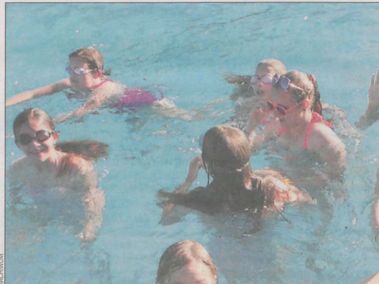
Był też czas na pływanie w basenie