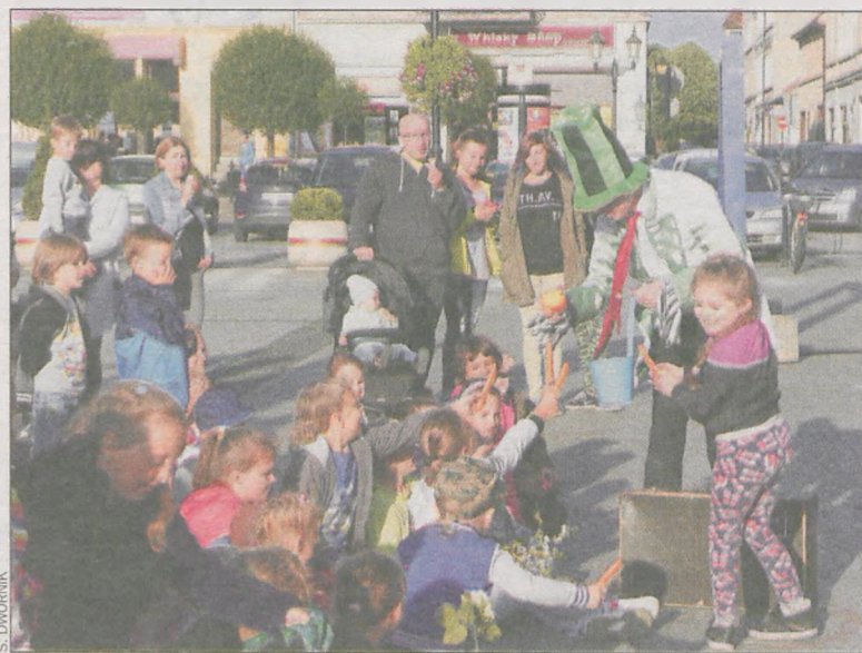
Dzieci reagowały żywiołowo

W tym samym dniu, w przerwie koncertów podczas drugiego tegorocznego Więc Wiecu , ze względu na pogodę przeniesionego do hali sportowo-widowiskowej, można było obejrzeć spektakl historyczny dla dorosłych Zapomniana historia . Opowiadał o życiu rzymskiego cesarza, który uważał się za następcę Chrystusa, a biskupów i opatów traktował jak swoich urzędników, którzy powinni