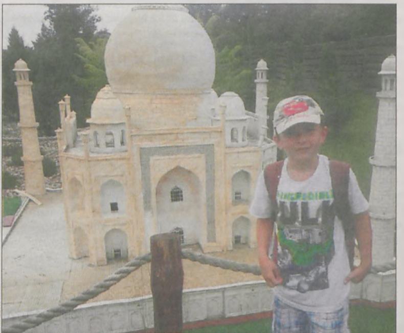
Podziwiano miniatury ciekawych budowli