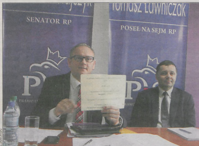
Senator Mikołajczyk mówił o zmianach w oświacie

Poseł Ławniczak wspominał o tym, że miasta mniejsze od Krotoszyna mają obwodnice, a u nas wciąż jej nie ma. Jak podkreślił, zamierza zabiegać o to, ażeby Krotoszyn trafił do krajowego programu budowy obwodnic, gdzie aktualnie go nie ma. (ej)