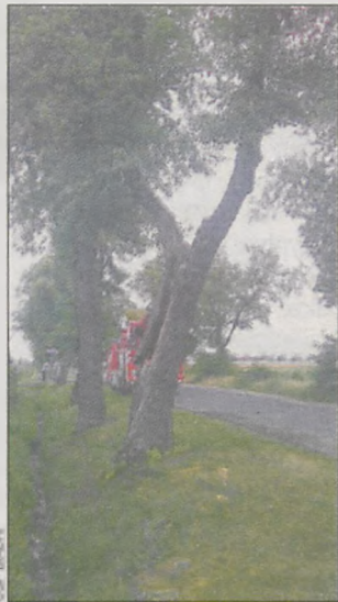
(mal) Drzewo zostało zabezpieczone

Drzewo pękło 8 lipca tuż przed godz. 20.00. Na miejsce zdarzenia przyjechali druhowie z Ochotniczej Straży Pożarnej w Biadkach oraz pogotowie energetyczne, które odłączyło napięcie w sieci. Potem strażacy odcięli nadłamane części drzewa. Przez cały czas zabezpieczali teren przed osobami postronnymi. Droga była zamknięta dla ruchu. Akcja trwała ponad 3 godziny.