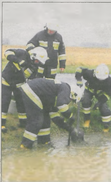
Udrażnianie odpływu wody