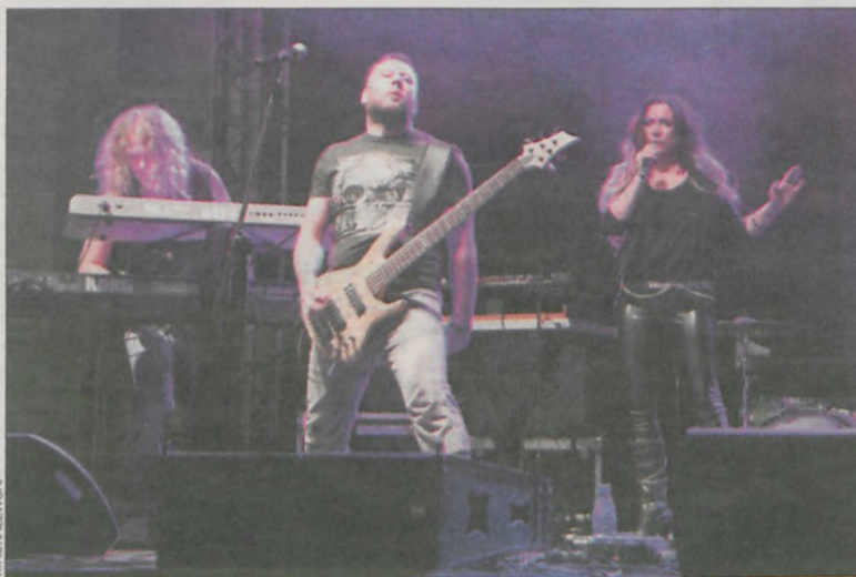
Trwa występ SonusVena

Drugi tegoroczny koncert z cyklu „Więc Wiec” zorganizowano nie na krotoszyńskim Rynku, a w hali sportowo-widowiskowej.