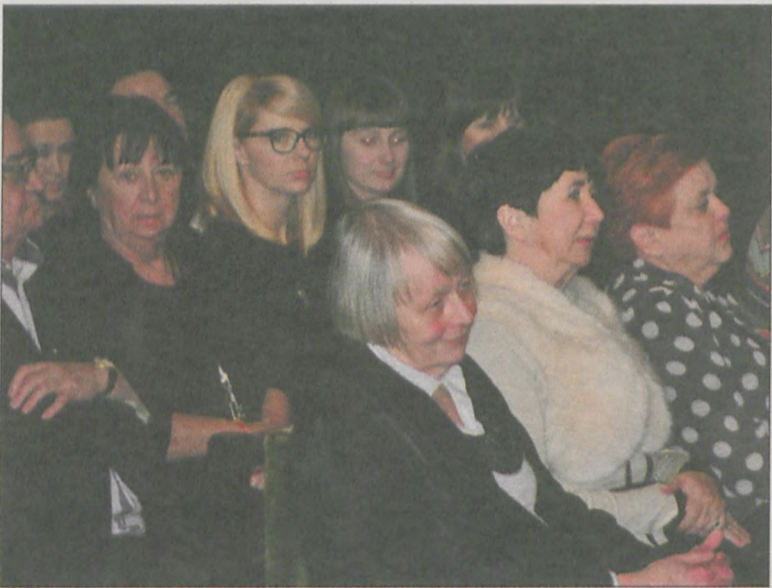
Na sali była najbliższa rodzina, a także goście spoza Krotoszyna

Uroczystość jak zawsze zakończył szpaler osób, które osobiście składały Profesorowi gratulacje. (wil)