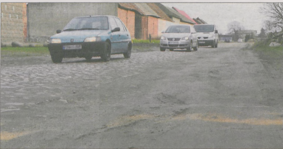
Na ul. Rolniczej panuje wzmożony ruch

Tymczasem wielu kierowców wybiera drogę przez Rolniczą. Również ci przyjeżdżają od strony Odolanowa nie stosując się do znaku zakazu, paku-