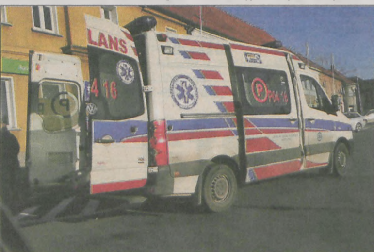
61-letnia kobieta została odwieziona do oddziału ratunkowego w Krotoszynie

11 grudnia o godz. 18.50 w Koźminie na ul. Kobylińskiej kierowca opła omegi nie zachował odpowiedniej ostrożności podczas wymijania i zderzył się z renaultem clio. – Został ukarany mandatem w wysokości 400 zł – mówi Piotr Szczepaniak, rzecznik policji. (it)