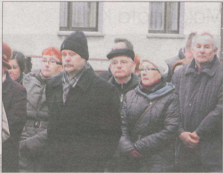
Po poświęceniu wspólnie odmówiono Koronkę do Miłosierdzia Bożego