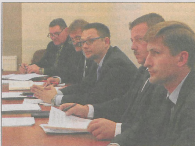
Decyzję podjęli radni