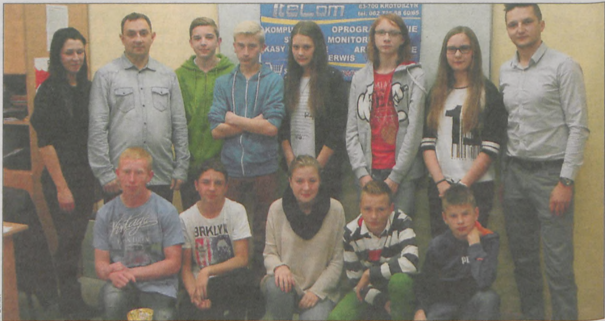
Gimnazjaliści z opiekunami

nr 1 i ZSP nr 2. Kolejny raz zabrakło reprezentantów krotoszyńskiego ogólniaka. Najlepsi informatycy otrzymali dyplomy i nagrody rzeczowe. (ola)