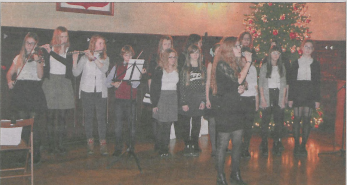
Utalentowana muzycznie młodzież z Gimnazjum nr 4