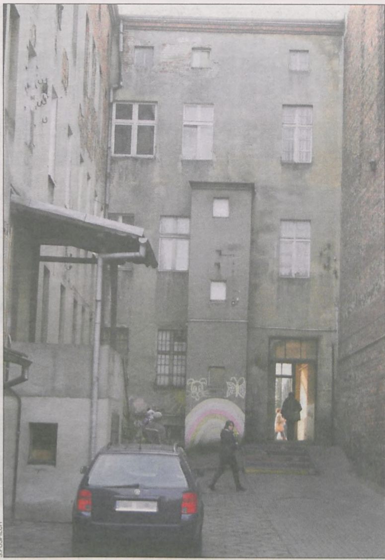
Przejsie jest popularnym skrótem do Rynku