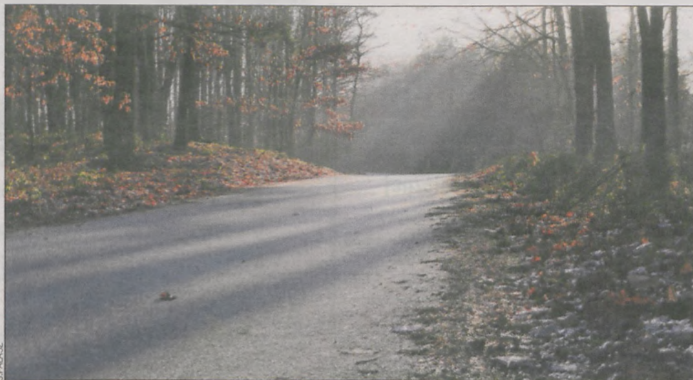
Droga przez las prezentuje się znakomicie

Droga była zniszczona, dziurawa, nierówna, a przy opadach