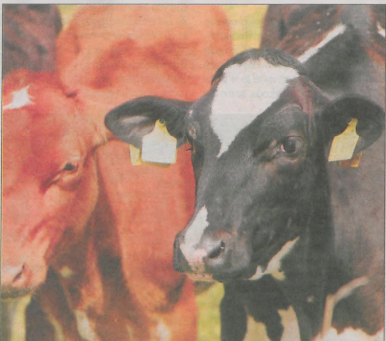
Każda sztuka bydła musi mieć dwa kolczyki i paszport