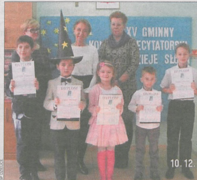
Laureaci z organizatorami konkursu