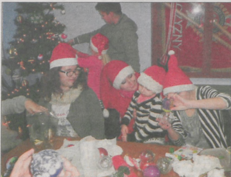
Wspólne dekorowanie bombek