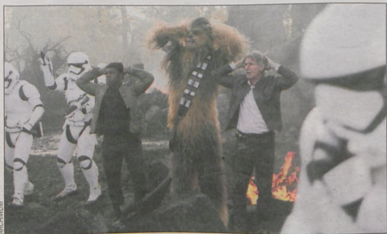
Kadr z najnowszych „Gwiezdných wojen”