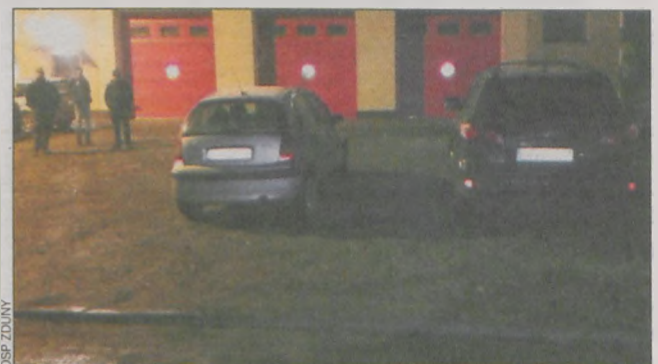
Niestety, taki widok nie należy do rzadkości