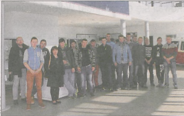
Może któryś z młodych kobylinian będzie kiedyś pracował w tej firmie?

21 uczniów Zasadniczej Szkoły Zawodowej z Kobylina wzięło udział w szkoleniowym wyjeździe do fabryki samochodów koncernu Volkswagen k. Poznania.