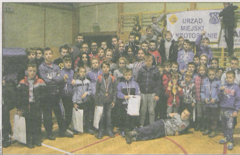
Szkolenie dzieci po raz kolejny zaprezentowało świetnymi wynikami na zawodach