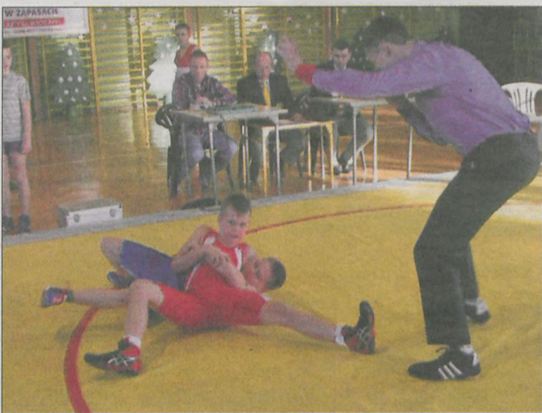
Na macie nie zabrakło zaciętych pojedynków

W dobrych humorach, bez kontuzji oraz z tradycyjną wyciągą w McDonalddie wszyscy wrócili do domu. (popi)