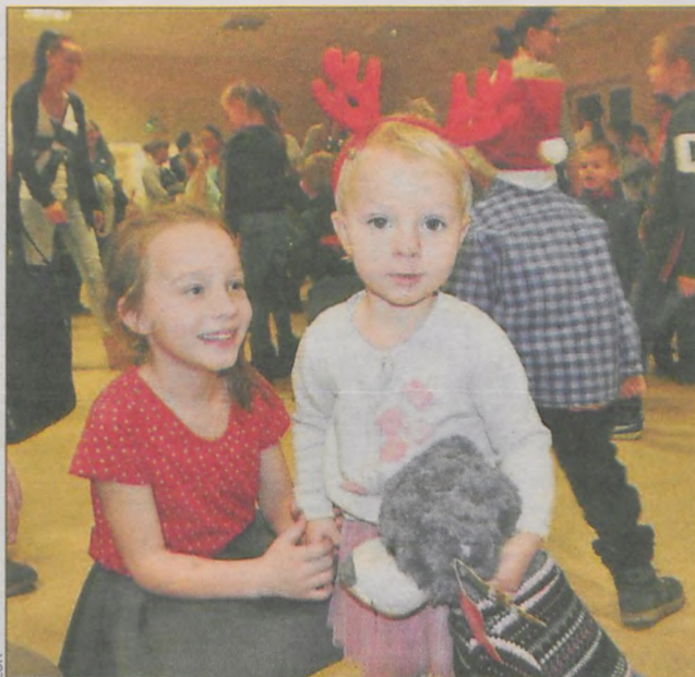
Dla dzieci przygotowano wiele atrakcji