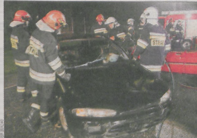
Podczas wieczornych ćwiczeń

Na placu manewrowym przeprowadzono następnie ćwiczenia praktyczne. Doskonano obsługę sprzętu hydraulicznego, ćwiczone wykorzystanie podręcznego sprzętu ratowniczego. Uczono się również jak za pomocą drabin doprowadzić do stabilizacji wywróconych pojazdów. (spm)