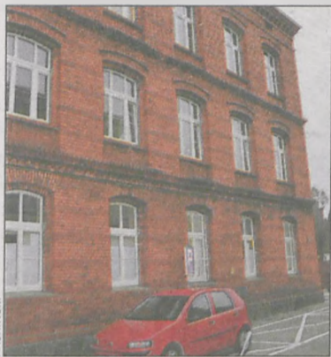
Książki zasila szkolną bibliotekę

Biblioteka szkolna w Zespole Szkół Publicznych w Sulmierzycach otrzymała pieniądze na realizację rządowego programu Książki naszych marzeń .