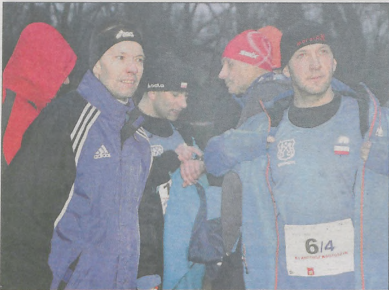
Bieg, zdaniem uczestników, nie należał do łatwych