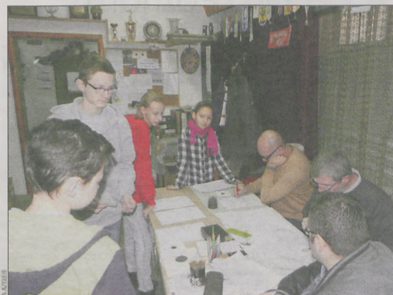
W sekretariacie mistrzostw pracowano pełną parą

Podczas mistrzostw rozegrano również turniej jednego strzału. Wzięto w nim udział 13 zawodników. Naj-