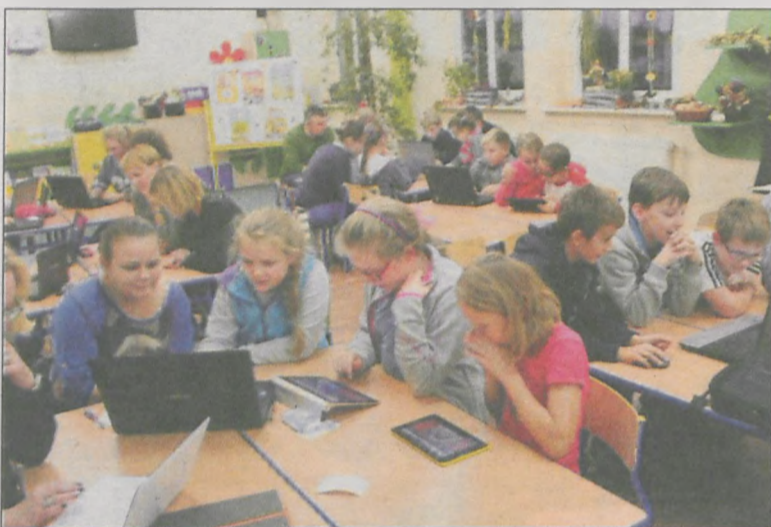
Zadania do wykonania wraz z rodzicami okazują się świetną zabawą