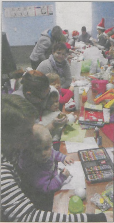
Najmłodszy mieszkańcy Czarnego Sadu wyczekują Mikołaja