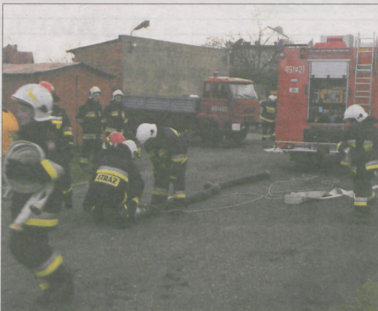
Strażacy pozytywnie zaliczali zadania

41 druhow, członków jednostek ochotniczych straży pożarnych z powiatu krotoszyńskiego przystąpiło 12 grudnia do egzaminu kończącego w zakresie kursu podstawowego, dzięki któremu mogą oni uczestniczyć w akcjach gaśniczych i pożarniczych.