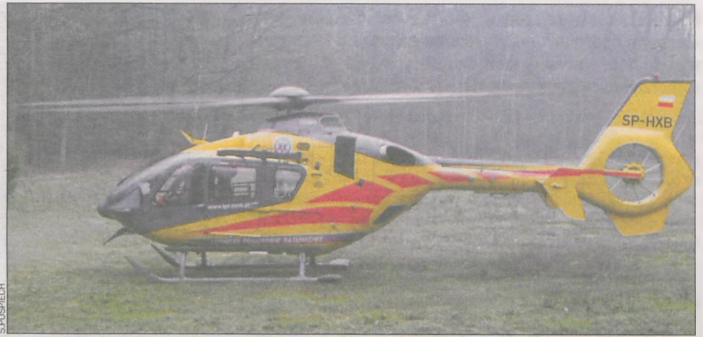
Transport śmigłowcem LPR po wypadku na ul. Sulmierzyckiej w Krotoszynie