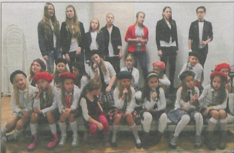
Kolędy i pastoralki w wykonaniu zespołów działających przy ośrodku wprawiły wszystkich w świąteczny nastrój