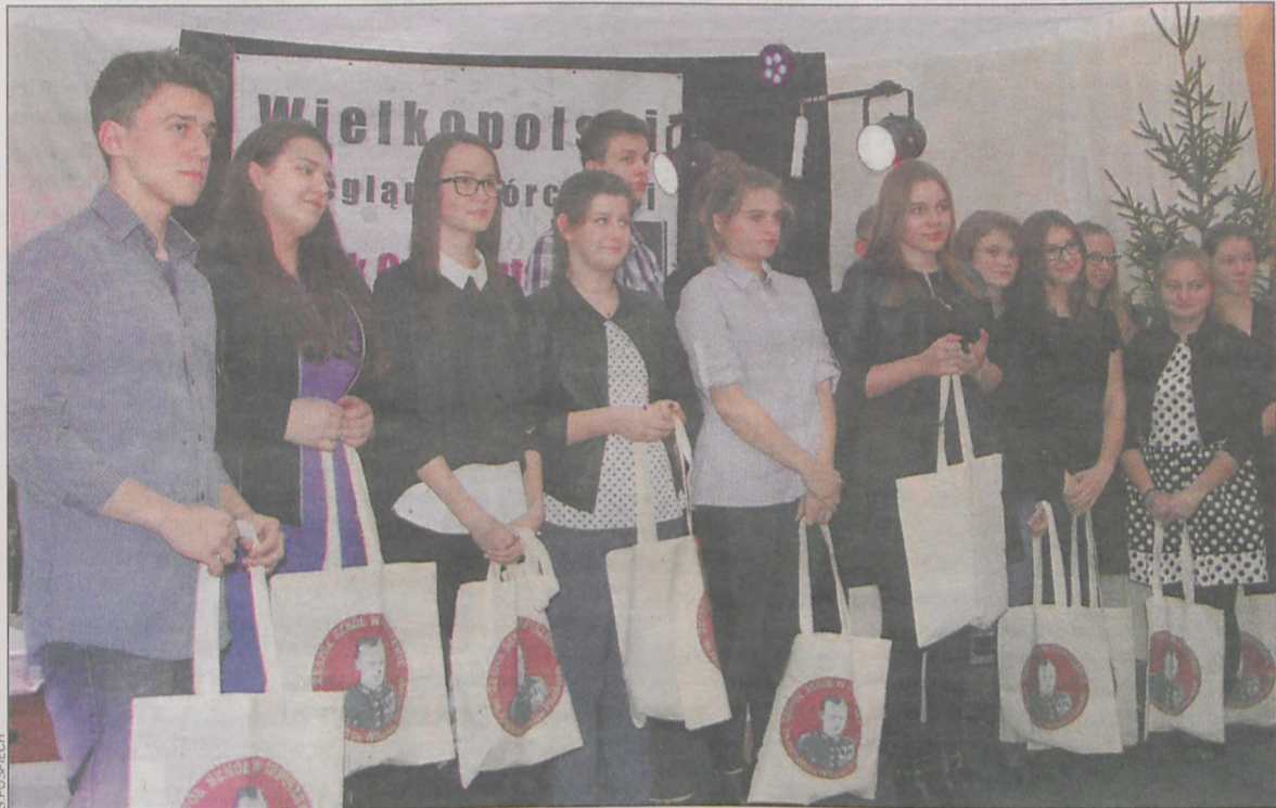
Na konkurs nie dojechało 6 uczestników