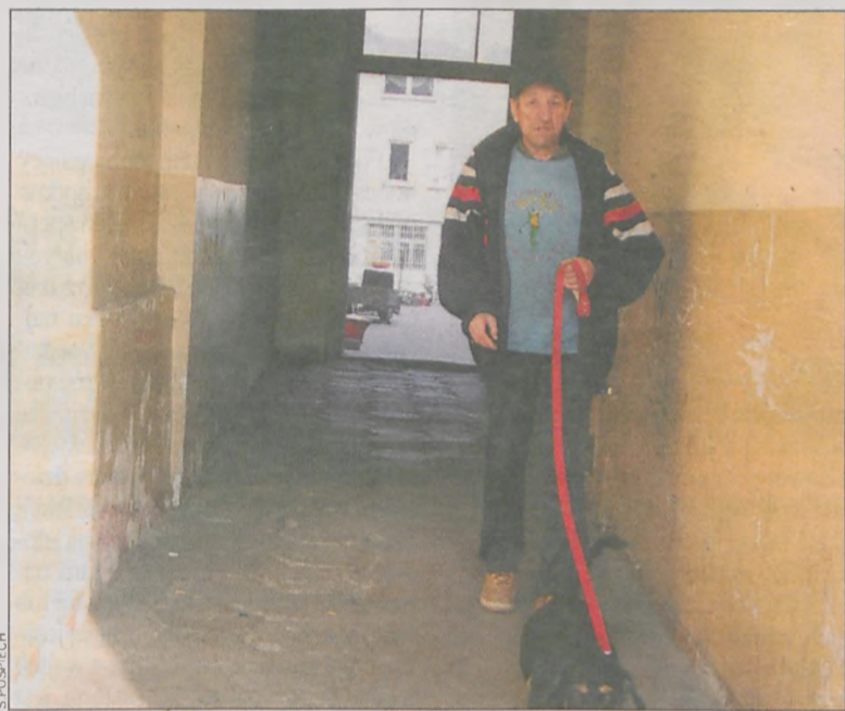
Lokatorzy narzekają na odór moczu w bramie