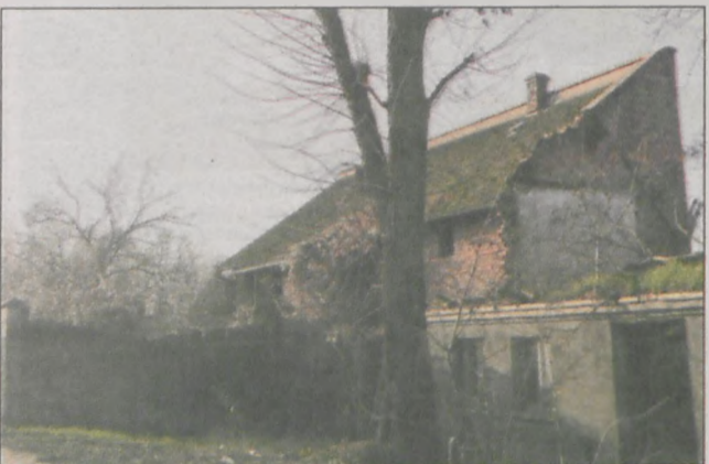
Zaniedbany budynek przy Krotoszyńskiej nie dodaje uroku