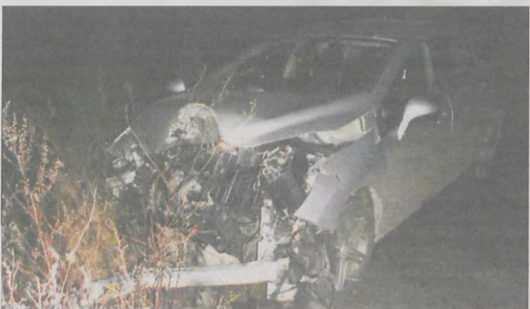
Poszkodowana to pasażerka samochodu, mieszkanka Koźmina

Przeprowadzono sekcję zwłok, ale śledczy czekają jeszcze na opinię biegłego z medycyny sądowej. (seb)