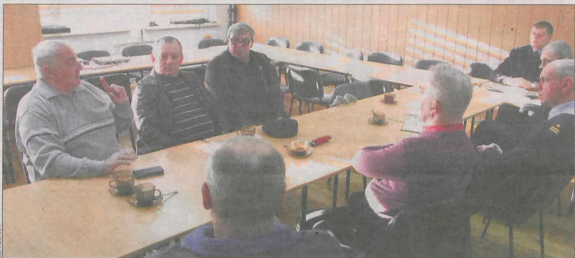
Spotkanie strażaków z kominiarzem na temat podstawowych zasad czyszczenia przewodów kominowych w okresie grzewczym

Przypomnijmy: 25 marca funkcjonariusze wrocławskiej delegatury CBA zatrzymali Piotra K. w sulmierzyckim urzędzie – w związku z podejrzeniem przyjęcia łapówki. Śledztwo w tej sprawie prowadziła ostrowska prokuratura. 28 marca zapadła decyzja o areszcie tymczasowym. 2 czerwca burmistrz wyszedł na wolność. Za łapówkarstwo grozi mu od 1 do 10 lat pozbawienia wolności. Sławek Pałasz