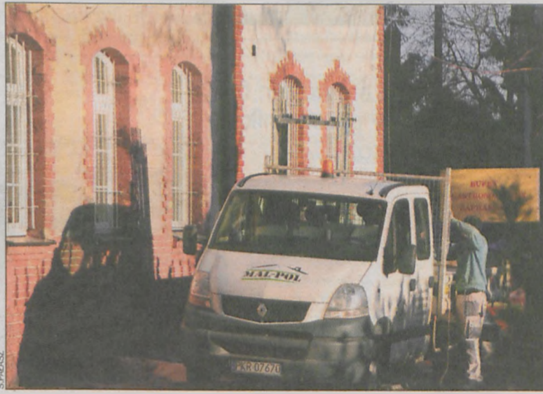
10 grudnia, pracownicy firmy zabierają swój sprzęt