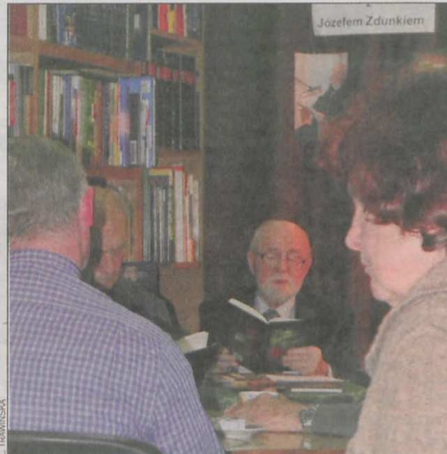
Czytelnicy słuchali wierszy w interpretacjach samego autora