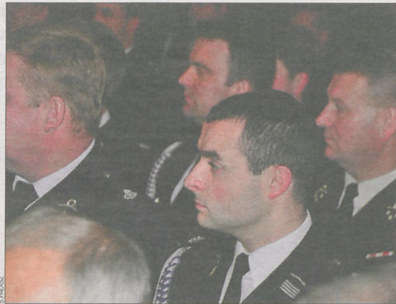
Strażacy przyszedli w galowych mundurach

Oprócz strażaków w uroczystości wzięli udział samorządowcy z Krotoszyna i Sulmierzyc, przedstawiciele straży zawodowej i straży miejskiej. W części artystycznej wystąpiła młodzież z Gimnazjum nr 4, przedstawiając fragment programu zatytułowanego Koncert na dwa świerszcze i wiatr w kominie (19 listopada młodzi artyści pokazali go w kinie Przedwiośnie). Występ w ratuszu zakończył się wspólnym