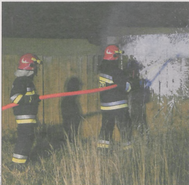
Ugasili ogień pianą