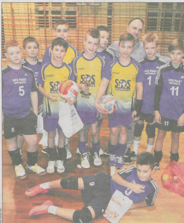
Młodzi siatkarze szkoły na Parcelkach