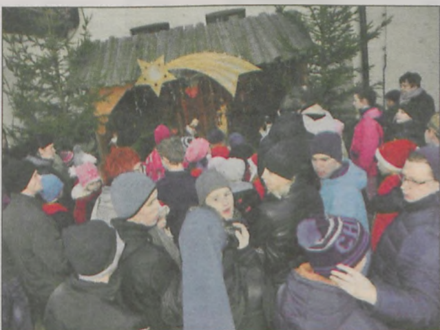
Szopka stanęła tradycyjnie na rynku przy ratuszu