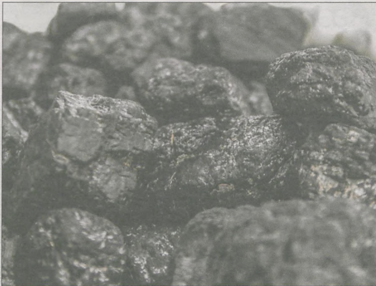
Kupując węgiel trzeba zwracać uwagę na jego kaloryczność i wilgotność

staje po nich mniej popiołu. W przypadku taniego, małokalorycznego opału oszczędności są tylko pozorne. Trzeba będzie znacznie więcej wrzucić do pieca i napracować się przy wynoszeniu tego, co pozostanie po wygaśnięciu.