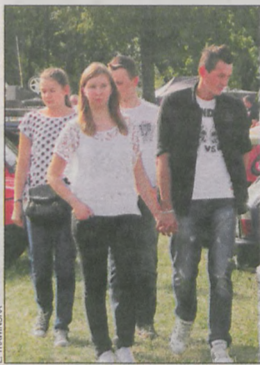
Mieszkańcy Koźmina i okolic podziwiali auta