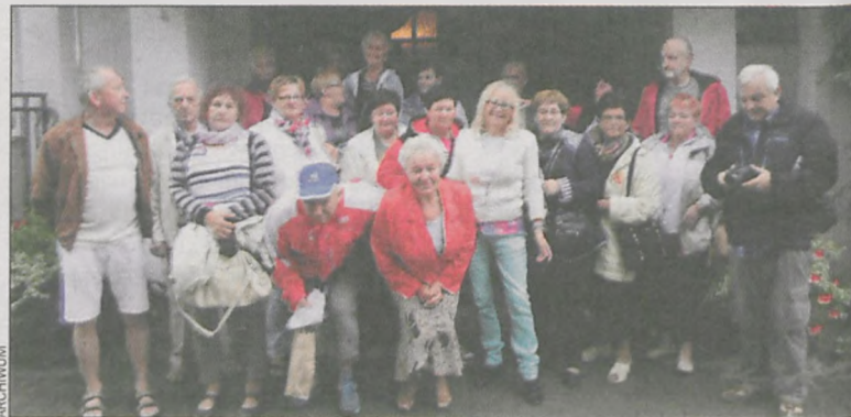
Przed wejściem do Prawdźca

28 osób z krotoszyńskiego stowarzyszenia Razem spędziło 6 dni w Niechorzu. Wszyscy byli bardzo zadowoleni z wyjazdu, żałują jedynie, że trwał tak krótko.