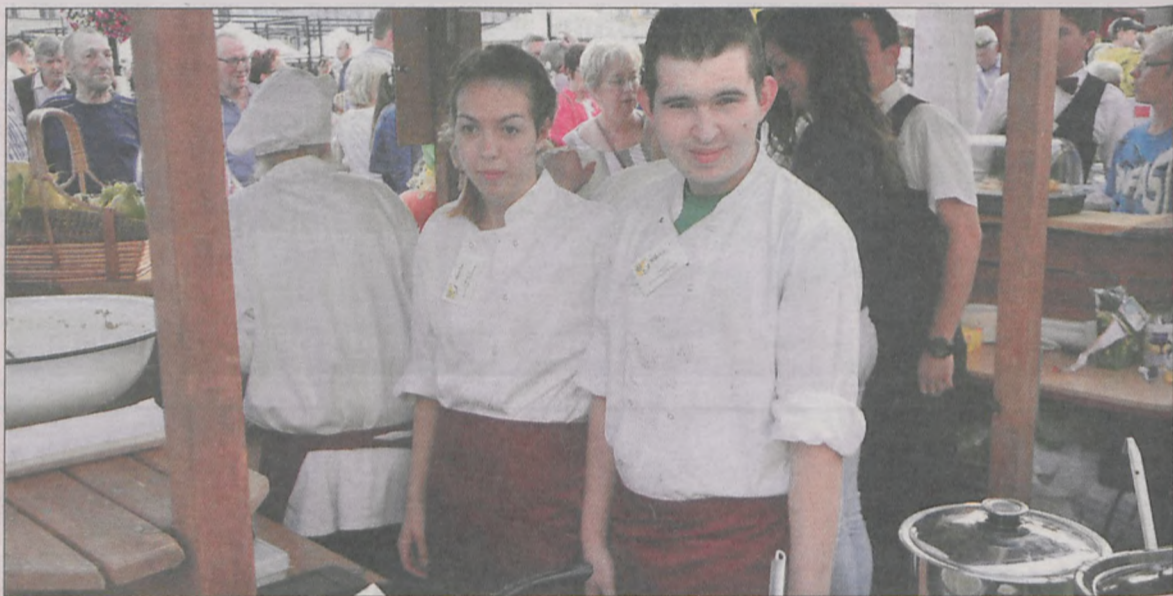
Drużyna ZSP nr 3 w Krotoszynie