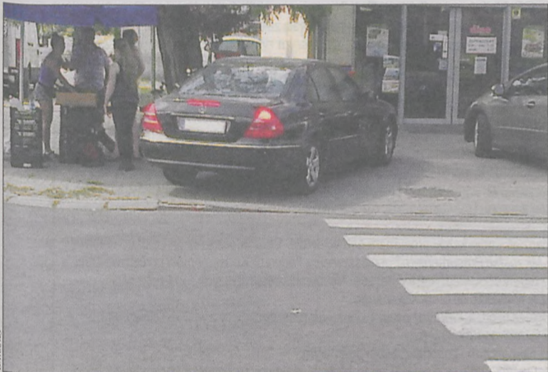
Kierowca mercedesa zaparkował na całej szerokości chodnika przy markecie Dino na ul. Zacisze

I wreszcie skrzyżowanie w najbardziej ruchliwym punkcie miasta – ul. Mickiewicza z ul. Benicką. Wyjazd z tej drugiej w godzinach szczytu graniczy z cudem, jednak nie przeszkadza to kierowcom korzystającym z usług przychodni bądź apteki w pozostawianiu aut z mrugającymi światłami. Sam byłem