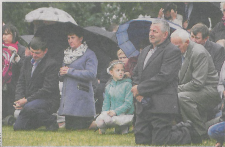
Na uroczystości przyjeżdżają wierni z odległych miejscowości

Uczestnictwo w uroczystościach odpustowych w Serafinowie jest dla