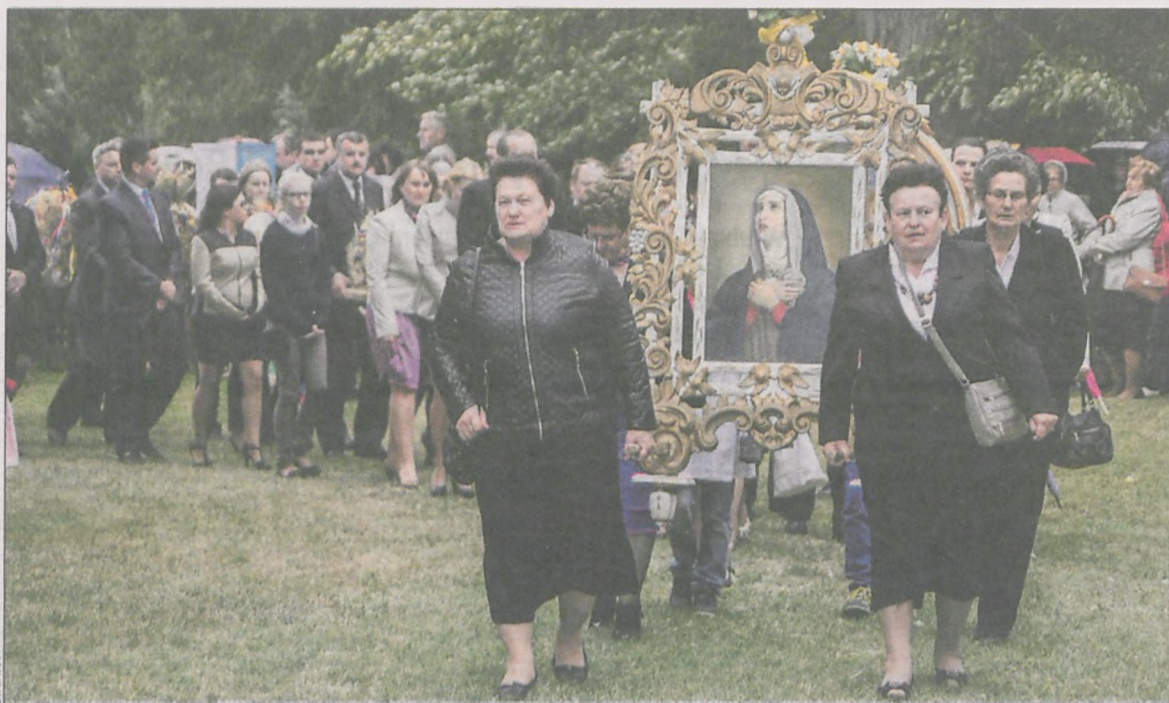
Uroczysta procesja wokół kościółka