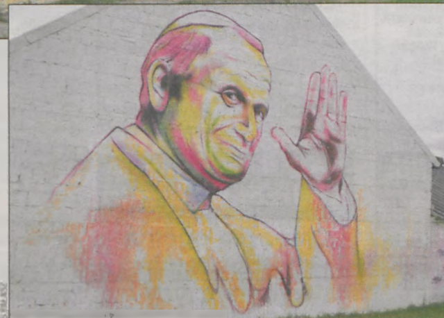
... i uśmiechnięty papież w planie bliskim

szą, mniejszą część murala, na temat dzieciństwa Karola Wojtyły, zawierająca m.in. wizerunek kościoła w Wadowicach. W tym roku młody artysta domalował kolejne elementy. Widzimy tzw. papieską kremówkę, bazylikę św. Piotra w Watykanie, tabliczkę z nazwą ul. Franciszkańskiej w Krakowie oraz wejście do siedziby tamtejszych arcybiskupów. Na ścianie kolejnego budynku uwieczniono papamobile. Obok są daty i nazwy krajów, do których pielgrzymował papież. Zmiciły się jedynie te najważniejsze. Największy element