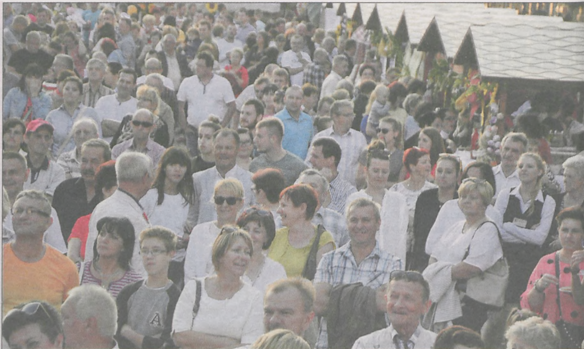
Na festiwal przyszły prawdziwe tłumy