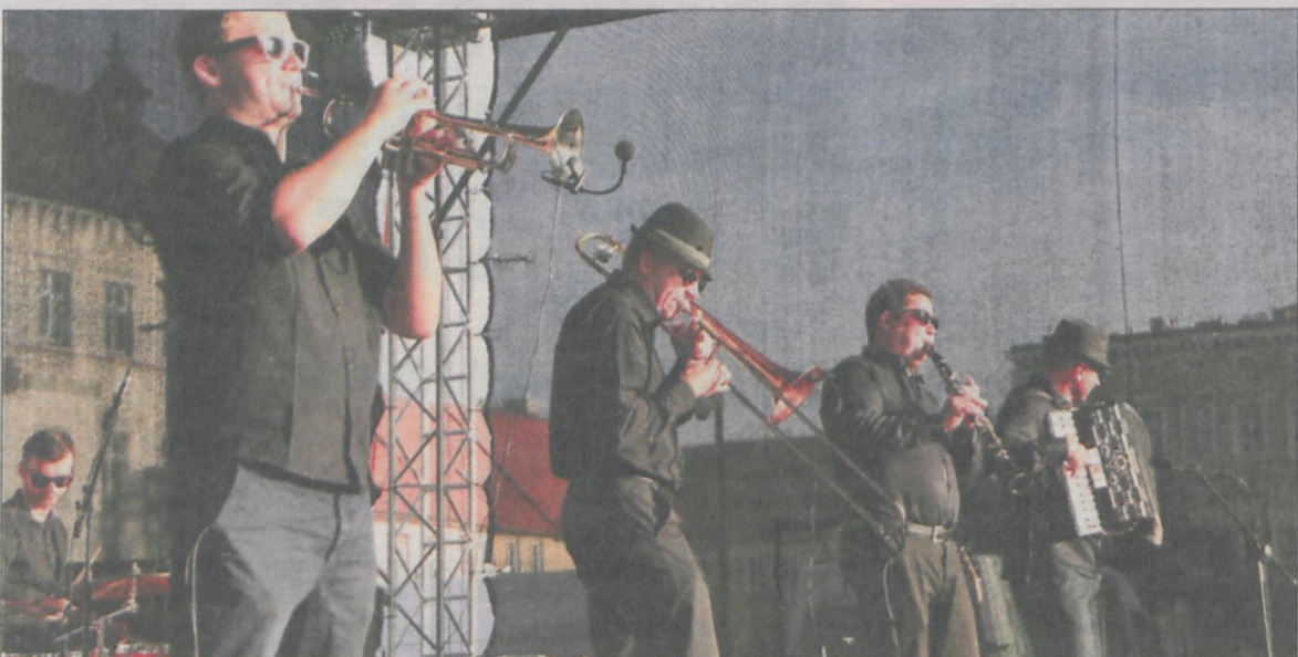
Przygrywał Sul Jazz Band