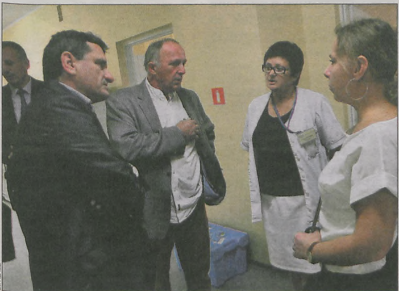
Radni w centralnym laboratorium na ul. Bolewskiego

21 września, podczas zamykania tego wydania Rzeczy , odbyło się posiedzenie wspólne komisji powiatowych w sprawie zmian, jakie mają być podjęte w szpitalu. Szczegóły – w następnym numerze. (mal)