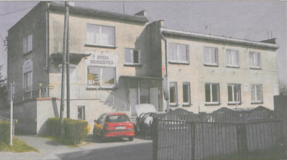
W przychodni rozpoczął się już remont