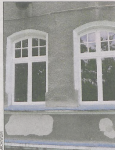
Poszło o takie trzy okna

Przypomnijmy: pod koniec 2014 r. dyr. Grobelny wystawił fakturę na blisko 14 tys. zł za 3 okna dla szkoły. Okna zostały jednak kupione dopiero w 2015 r. Dyrektor tłumaczył, że zrobił to, by na końcu roku wykorzystać dostępne fundusze. Rezygnując z nich w 2014 r. nie miałby pewności, czy będzie mógł z tej samej kwoty skorzystać w roku następnym. (mal)