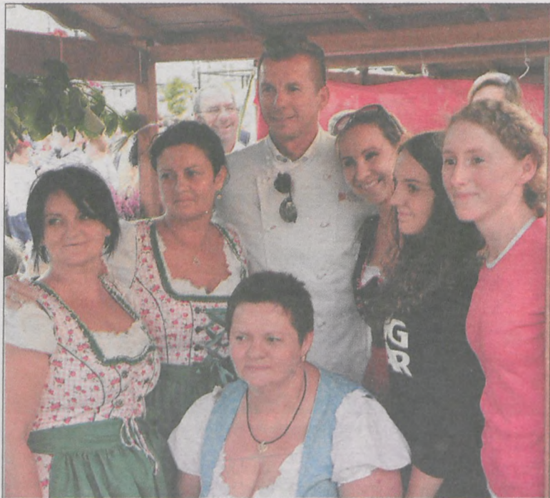
Zdjęcie z mistrzem kuchni Karolem Okrasą