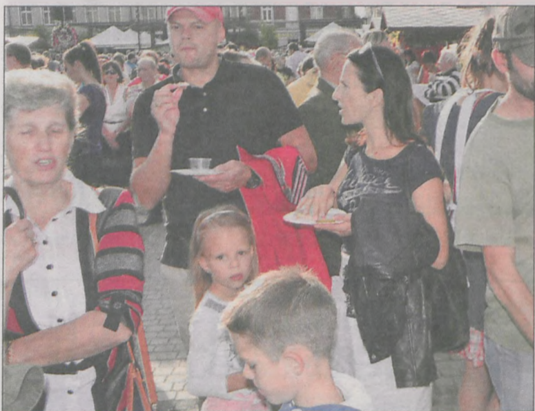
Smaczne jedzonko – mniem, mniem