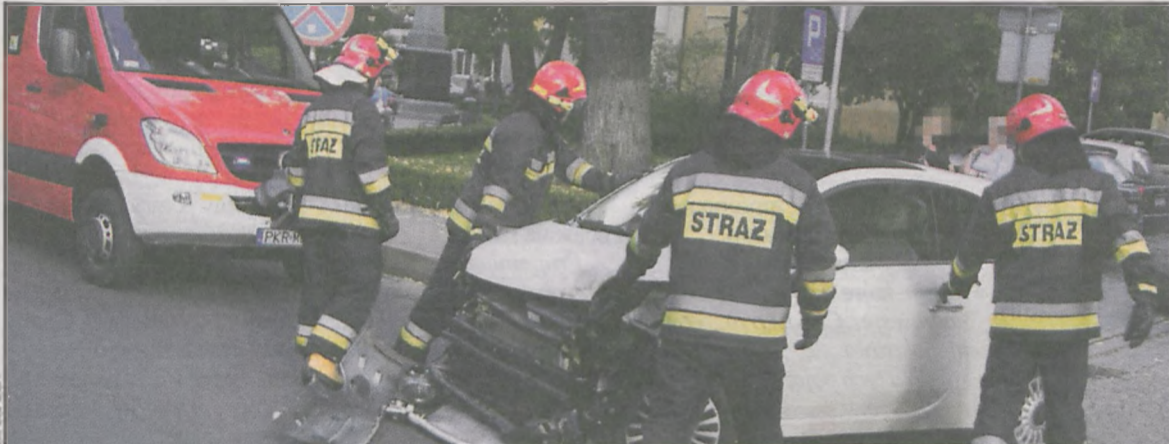
Kolizja spowodowała utrudnienia w ruchu na ul. Piastowskiej

Policja ukarała sprawczynię mandatem. Strażacy usunęli skutki kolizji, posprzątały plastikowe elementy i zneutralizowali płyny eksploatacyjne z pojazdu. (popi)