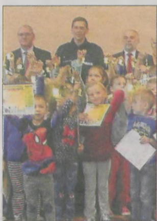
Pierwszaki wysłuchały również pogadanki