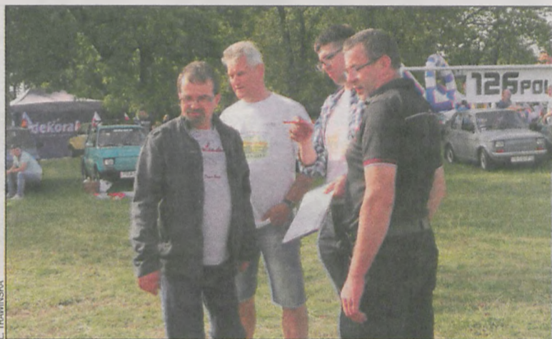
Komisja konkursowa oceniała samochody w kilku kategoriach

ul. Floriańskiej rozegrano mecz piłki nożnej pomiędzy uczestnikami zlotu. Posiadacze maluchów z parzystymi numerami rejestracyjnymi rywalizowali z tymi, którzy są właścicielami aut z numerami nieparzystymi. Wieczorem na scenie przy I LO zagrały kapela Mjut i The Beatlemen.