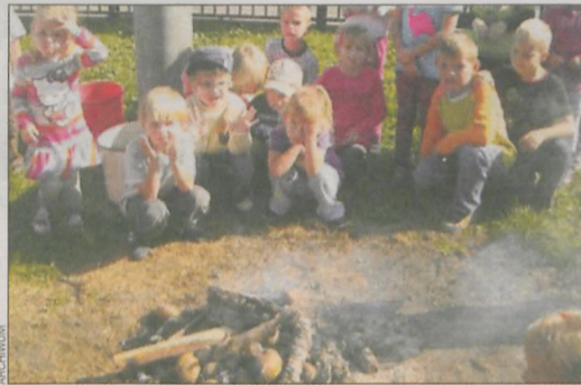
Fotografia z imprezy w 2011 r.

Uczestnicy imprezy zostaną zaproszeni na ziemniaki z gziką oraz do udziału w ciekawych konkursach. Na 19.00 zaplanowano występ cheerleaderek Leszna – grupy Happy Ladies 50+. Pół godziny później rozpocznie się zabawa tańeczna. (mal)