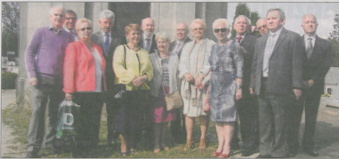
Przynajmniej raz na dwa lata odbywają się spotkania klasowe, a grupa absolwentów mieszkająca w Koźminie i okolicy spotyka się raz w miesiącu