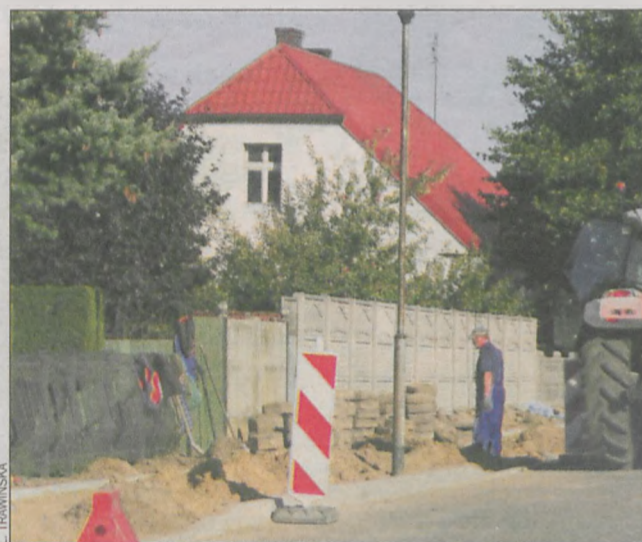
Trwają prace budowlane

Przy okazji utwardzony zostanie wjazd na cmentarz. Prace mają zostać wykonane