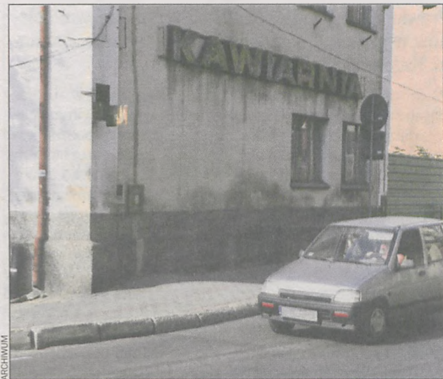
Czy dawna restauracja znajdzie w końcu nabywcę?