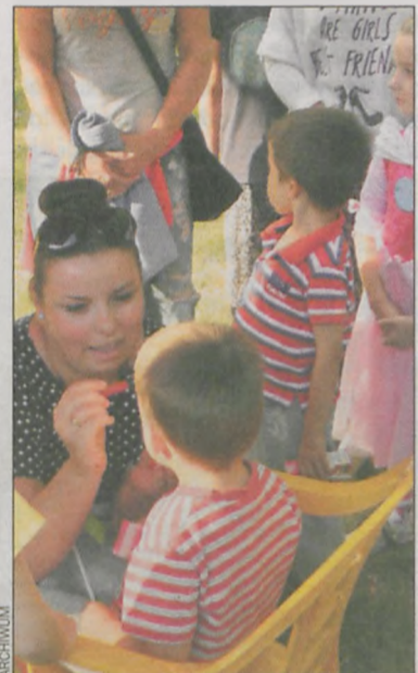
Dzieciom malowano buzie

Imprezę wsparł samorząd gm. Zduny, pomogły też miejscowe firmy. Na zakończenie spotkania założyciele Razem dla Konarzewa ofiarowali zarządowi Motylka Drzewko Współpracy. Już pojawiło się kilka kolejnych pomy-