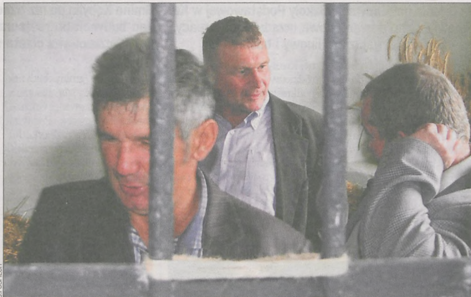
Radni podczas wizytacji dawnej masztalarni