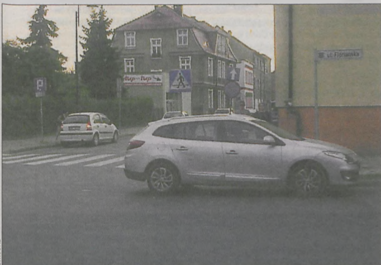
Auto zaparkowane przy skrzyżowaniu ul. Słodowej z Floriańską