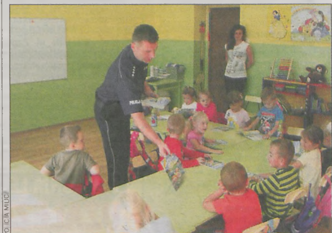
Książeczka na pamiątkę spotkania

mi bezpieczeństwu najmłodszych. Mówili więc, co zrobić w razie ataku psa. Przestrzegali, by nie kontaktować się z osobami obcymi.