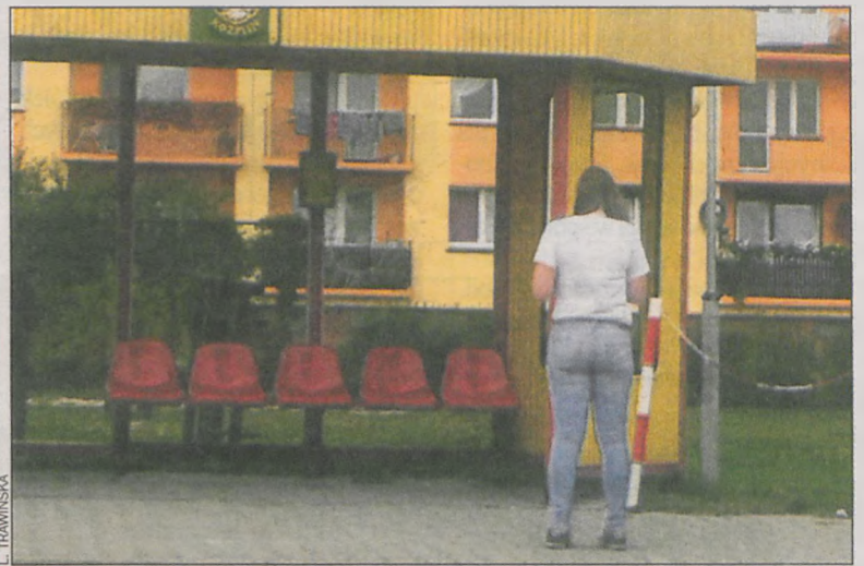
Popękane szyby wyglądają nieestetycznie

Przystanki autobusowe na ul. Jana Pawła II w Koźminie zostały uszkodzone. Najprawdopodobniej celowo.