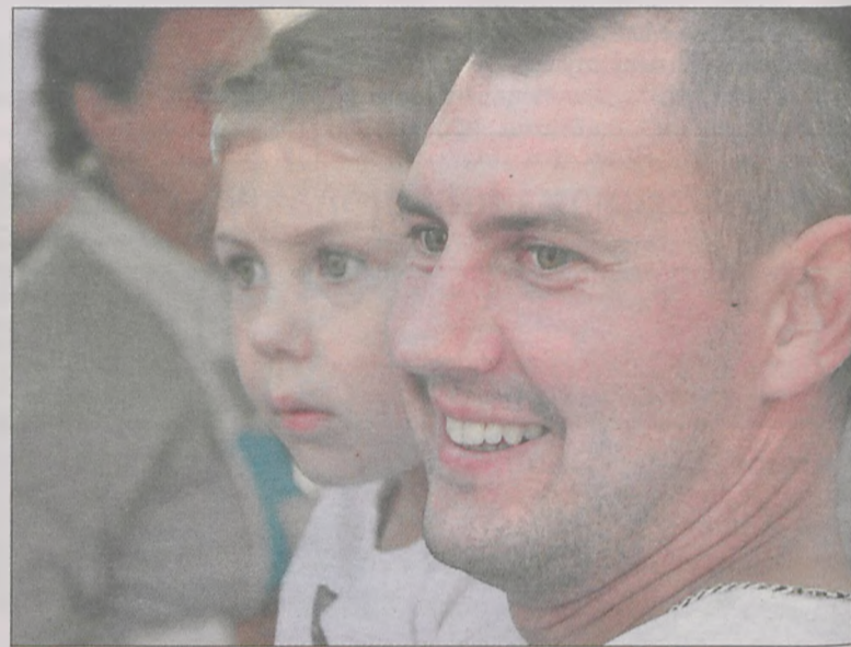
Impreza wzbudzała radość i podziw