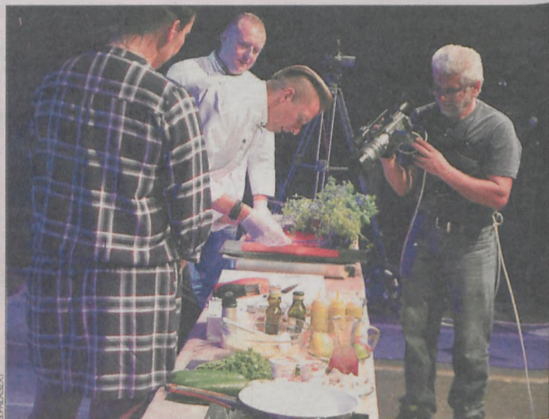
Punkt kulminacyjny – wieczorny pokaz gotowania