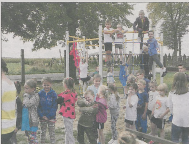
W oczekiwaniu na zjazd linowy