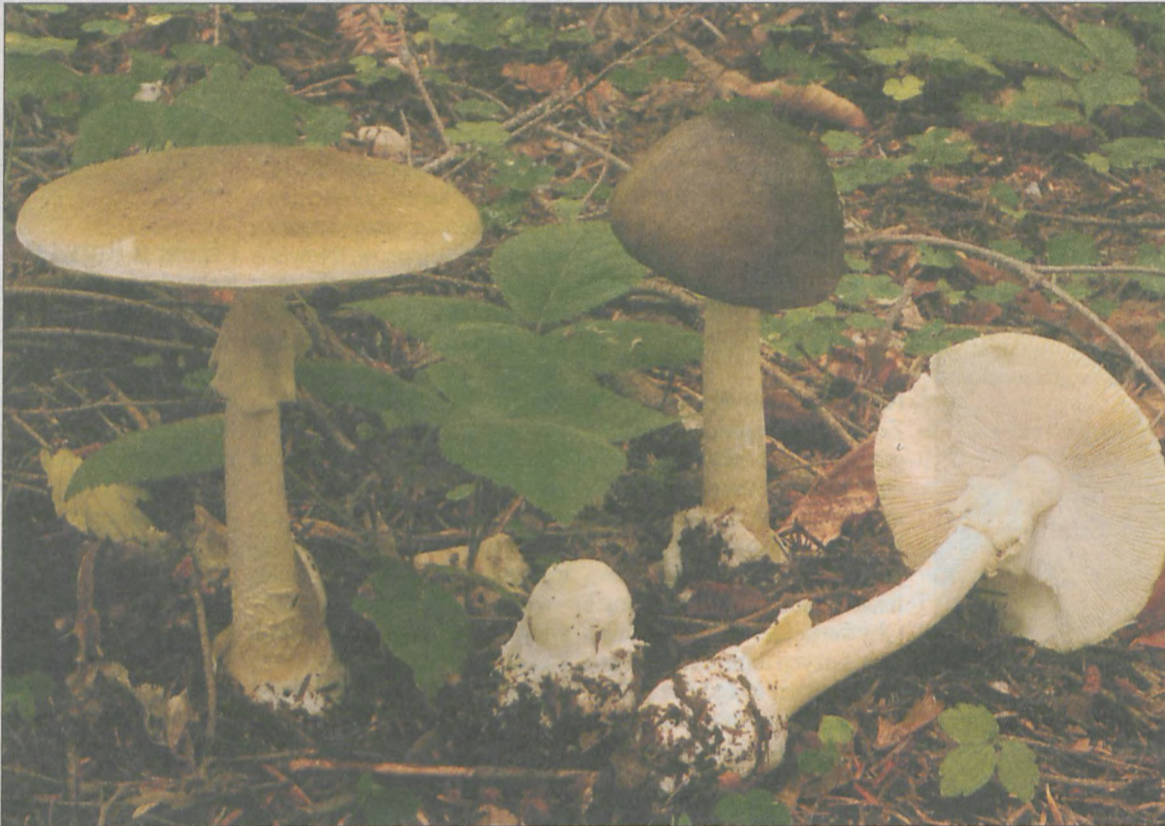
Muchomor sromotnikowy – Amanita phalloides

W grzybach trujących występuje aż pięć toksyn, których spożycie prowadzi do śmierci. Atakują one nerki,