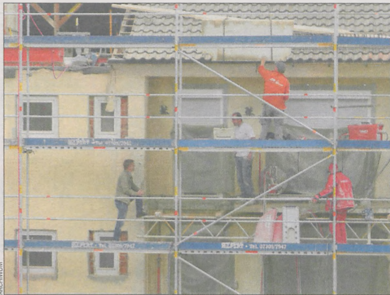
Wybór okien to ważna decyzja podejmowana na wiele lat

Parametrem, który określa szczelność okien, jest współczynnik infiltracji. W pomieszczeniach z wentylacją mechaniczną lub klimatyzacją okna po-