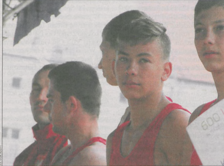
Szkolenie zapaśników LKS Ceramic Krotoszyn przynosi wymierne efekty

Gm. Krotoszyn wyprzedziły tylko duże miasta, które mają znacznie więcej klubów i młodych sportowców pod swoją opieką. Na pierwszych trzech miejscach znalazły się: Poznań, Konin i Leszno. Jarocin był o jedną pozycję wyżej od Krotoszyna, ale już znacznie większy Ostrów Wlkp. sklasyfikowano na 14. miejscu. (popi)