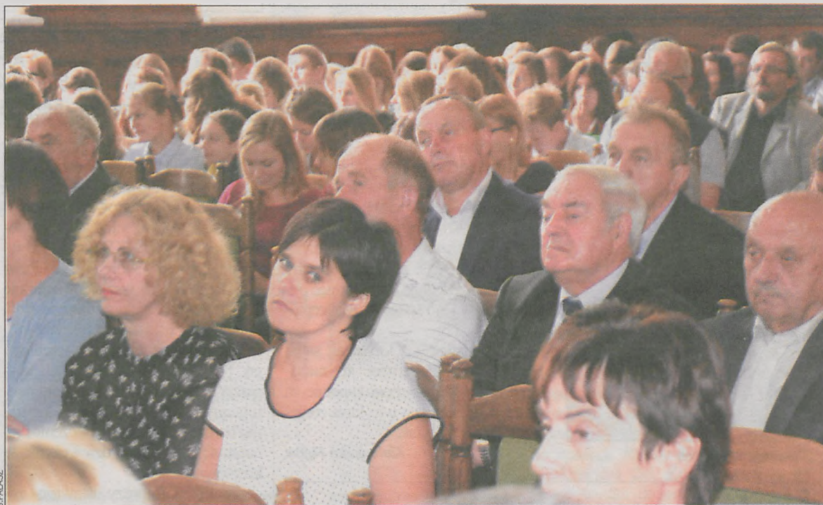
Na sali obecni byli historycy, nauczyciele, goście spoza Krotoszyna, uczniowie liceum