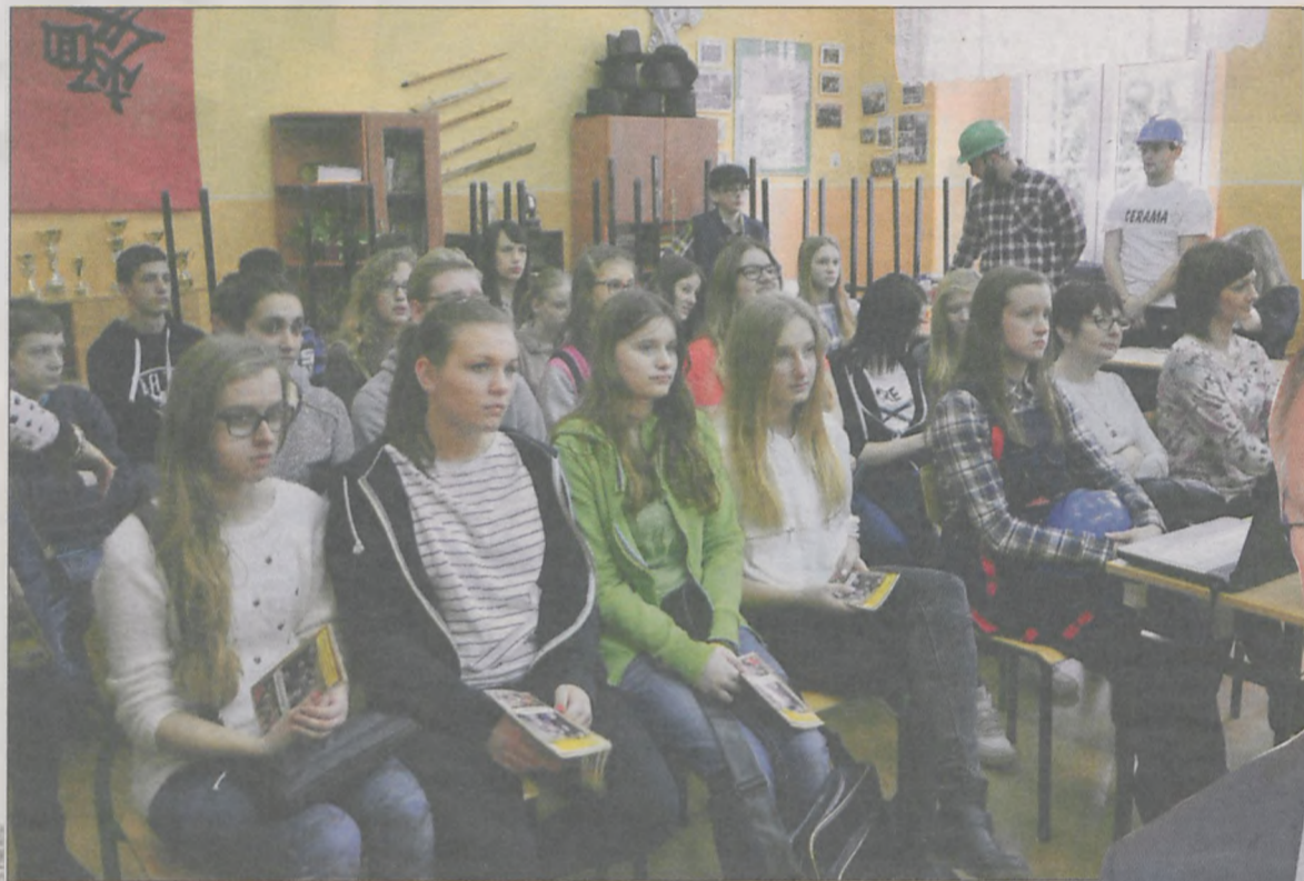
Gimnazjaliści na powiatowych targach edukacyjnych w tym roku

Do szkół prowadzonych przez starostwo trafiło 1 września mniej pierwszoklasistów niż planowano. Planowano bowiem przyjęcie 810 uczniów do 27 klas, gdy tymczasem zgłosiło się 686 absolwentów gimnazjów, którzy będą się uczyć w 25 klasach.