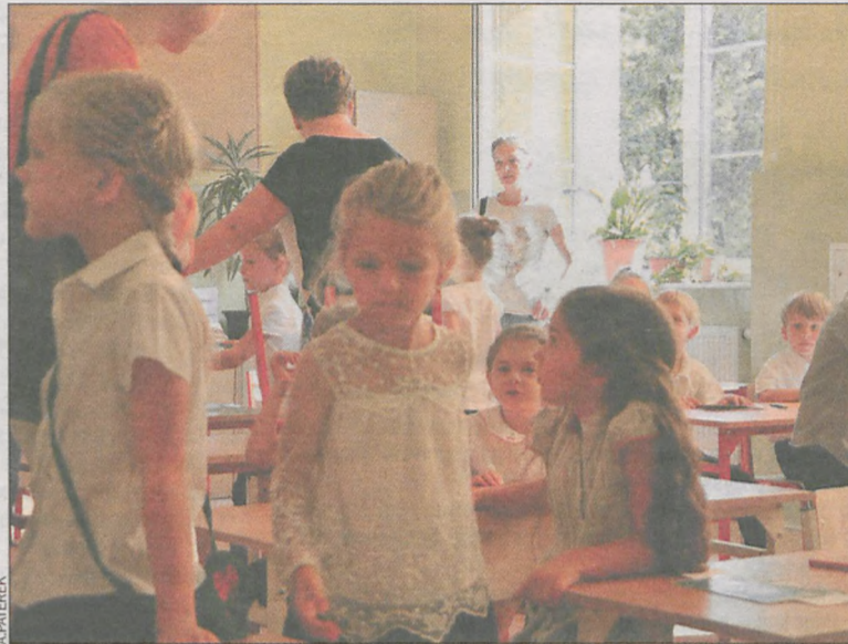
Większość 6-latków bardzo dobrze radzi sobie w pierwszej klasie

Prawie 650 dzieci poszło 1 września do klas pierwszych szkół podstawowych w gminie Krotoszyn. 101 decyzji odraczających obowiązek szkolny wydano w krotoszyńskiej Poradni Psychologiczno-Pedagogicznej. W wielu wypadkach to rodzice nie byli gotowi na posłanie 6-latków do szkoły.