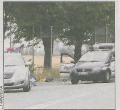
Policja dwukrotnie postrzeliła agresywnego uciekiniera

11 sierpnia 2014 roku 51-letni mieszkaniec Milicza przyjechał do komis maszyn rolniczych przy ul. Poznańskiej w Jarocinie. Kilkakrotnie oddał strzały do właściciela komis. Jak uznała Prokuratura Rejonowa w Jarocinie, usiłował go zabić. Właściciel komis zdążył uciec przed napastnikiem, dzięki czemu przeżył atak. 51-latek wsiadł do swojej terenowej toyoty i ruszył w kierunku Krotoszyna. Funkcjonariusze ruszyli w pościg, który zakończył się w Wałkowie. 51-latek nie zamierzał się poddawać, oddał kilka strzałów w kierunku policjanta. – Działając z zamiarem pozbawienia życia funkcjonariusza Komendy Powiatowej Policji w Jarocinie, wykonującego czynności służbowe, z wnętrza samochodu Toyota Land Cruiser (...) oddał do niego strzał przez przednią szybę pojazdu, a następnie próbował oddać do niego kolejny strzał przez okno prawych przednich drzwi samochodu, czym usiłował dokonać jego zabójstwa – mówi akt oskarżenia. Policjant dwukrotnie postrzelił agre-