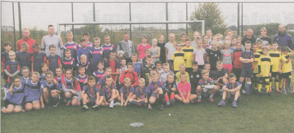
W zmaganiach uczestniczyły głównie dzieci z Sulmierzyc i Krotoszyna

11 września na sulmierzyckim Orliku odbył się VI Turniej o Puchar Premiera RP. W piłkarskiej rywalizacji wzięło udział ponad 100 dzieci.