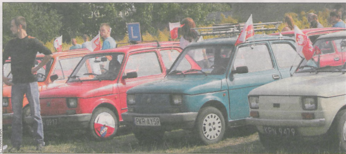
Maluchy, czyli główni bohaterowie zjazdu

W spacerach chodzi o promowanie i propagowanie zdrowego stylu życia i aktywności fizycznej. Trzeba pamiętać, że każdy ruch, każdy spacer ma dla naszego organizmu duże znaczenie i pomaga nam dbać o zdrowie serca. (alex)