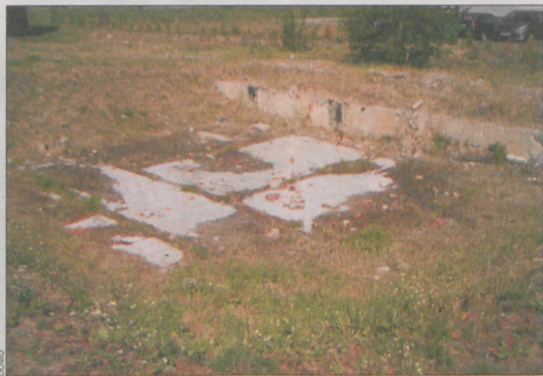
Dół nie jest ogrodzony i może stwarzać zagrożenie

Teren ten, pozostałość po infrastrukturze rzeźni, choć bardzo niebezpieczny, nie jest ogrodzony, nie ma również stosownych tablic ostrzegawczych. O ile za dnia można się zorientować, że mamy przed sobą przeszkodę, o tyle wieczorem ocena sytuacji jest już zupełnie inna.