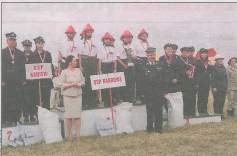
Dekoracja drużyn kobiecych

Trzy pierwsze miejsca w klasyfikacji kobiecych drużyn pożarniczych zajęły ekipy z naszego rejonu. Rywalizację z udziałem 8 teamów wygrała jednostka Ochotniczej Straży Pożarnej z Dąbrowy w gm. Rozdrażew. Na drugim miejscu uplasowały się panie z OSP Kaniew (gm. Koźmin), trzecie