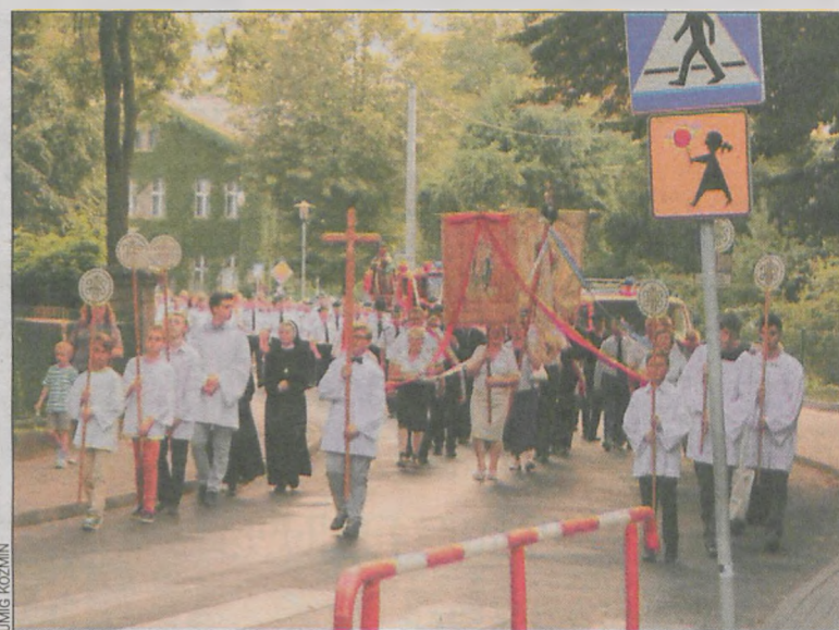
Procesja przechodzi ulicami miasta

Koźminianie, tradycyjnie już, bardzo licznie uczestniczyli w święcie patrona swego miasta, św. Wawrzyńca.