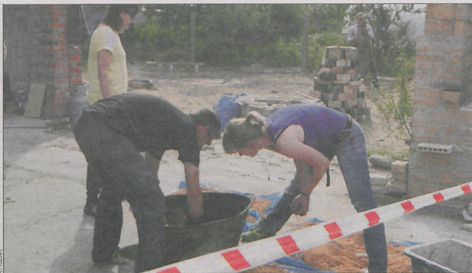
Plener ceramiczny w kaflarni jest nieodłączną częścią „Pogranicza Kultur”

Do tej pory kaflarnia otrzymywała od gminy, a dokładniej od Zdunowskiego Ośrodka Kultury, wsparcie – głównie promocyjne. Wynika ono ze