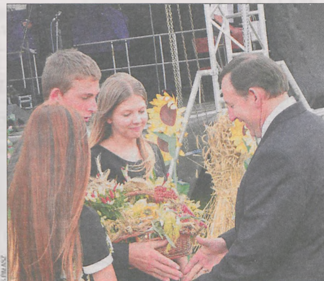
Wybrani rolnicy otrzymywali wieńce

stoisk gastronomicznych, dmuchanych zamków, trampolin i zjeżdżalni dla dzieci.