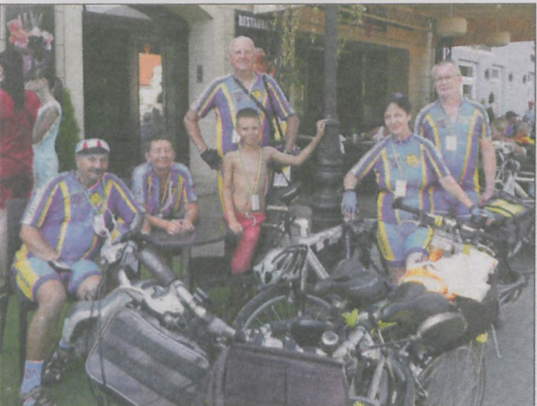
Na rynku w Pszczynie, przed otwarciem zlotu

Od 8 do 15 sierpnia trwał w Pszczynie 64. Centralny Zlot Turystów Kolarzy PTTK. Uczestniczyło w nim 420 cyklistów, w tym 6 osób z Klubu Turystyki Rowerowej Peleton w Krotoszynie.