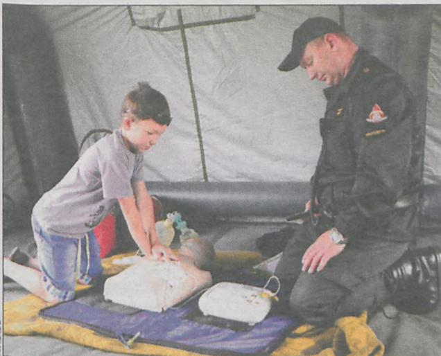
Dzieci uczyły się udzielania pierwszej pomocy