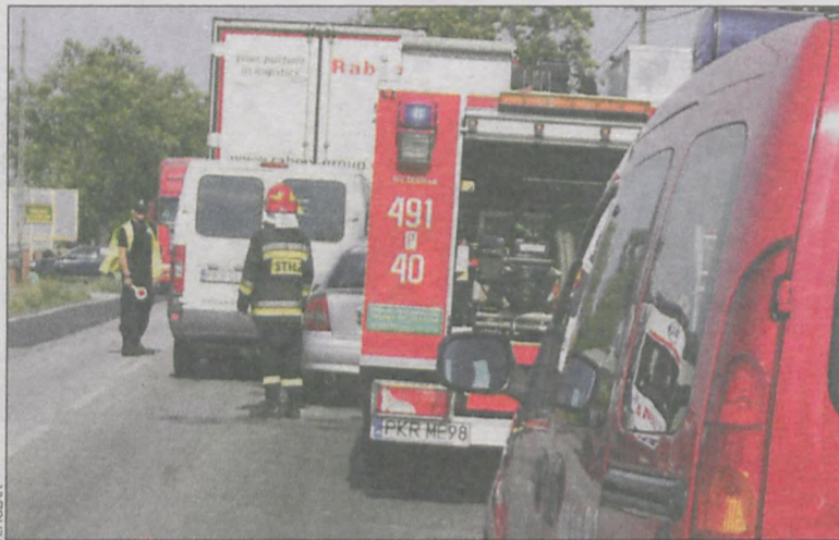
Przez kilkanaście minut droga była zamknięta

Na drodze krajowej nr 36 koło Lutogniewa doszło do wypadku. Do szpitala zabrano dwie kobiety i dziecko.