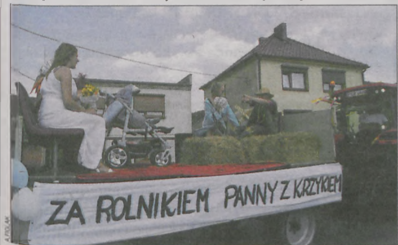
Był też casting na żonę rolnika