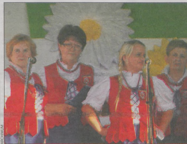
Wystąpi zespół Viatori z Pakosławska