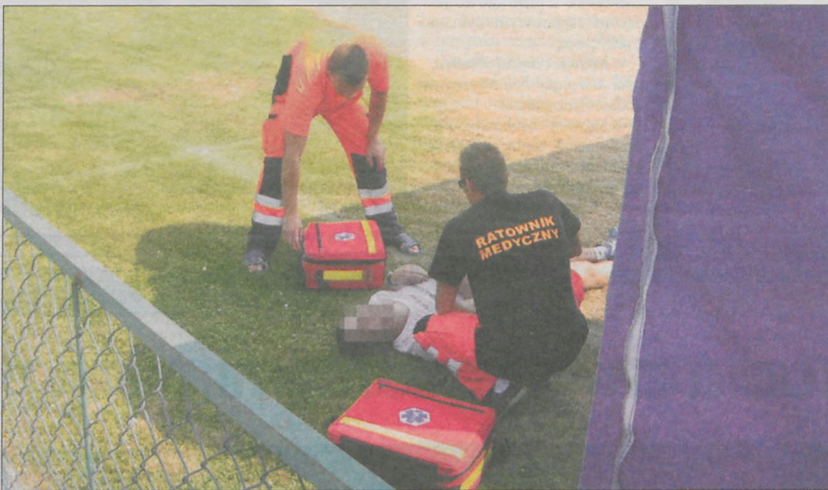
Sluzba medyczna udziela pomocy biegaczowi, który prawdopodobnie uległ udarowi słonecznemu w czasie niedawnego Biegu im. Marszałka Józefa Piłsudskiego w Kobylinie