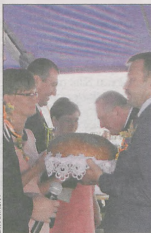
(ft) Wójt Rozdrażewa odbiera chleb dożynkowy

23 sierpnia w Budach obchodzono dożynki gminy Rozdrażew oraz święto parafii Matki Bożej Królowej Korony Polskiej w Nowej Wsi. Uroczystości rozpoczęła msza św., podczas której dziękowano za tegoroczne plony. Następnie trasą do placu przy świetlicy w Budach przejechały udekorowane bryczki konne i maszyny rolnicze, za którymi szli mieszkańcy gminy, by po dotarciu na miejsce uczestniczyć w dalszej części świętowania. Relacja – w przyszłym wydaniu RK.