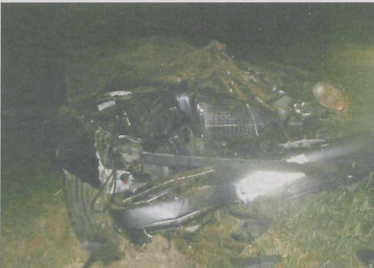
Mercedes uległ poważnym uszkodzeniom

19 sierpnia o godz. 22.17 Państwowa Straż Pożarna w Krotoszynie powiadomiona została o kolizji na drodze krajowej nr 15 w Perzycach. Na prostym odcinku mercedes zjechał do rowu i dachował. Kierował nim mieszkaniec Zdun.