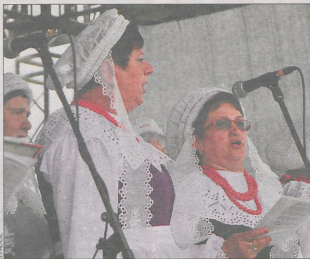
Na scenie wystąpiły m.in. Łagiewniczanie

Poszczególnym rolnikom z wiosek gminy Kobylin wręczono powstałe w ich sołec-