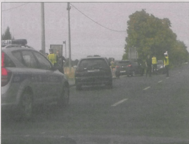
Oba auta zjechały na lewy pas drogi, a policja kierowała ruchem