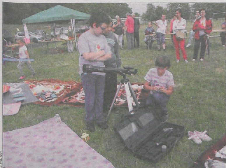
Przygotowania do obserwacji niebosktonu

Nad najsmaczniejszą i najbarwniejszą częścią pikniku, czyli konkursami na Niebiański wypiek i Kosmiczny