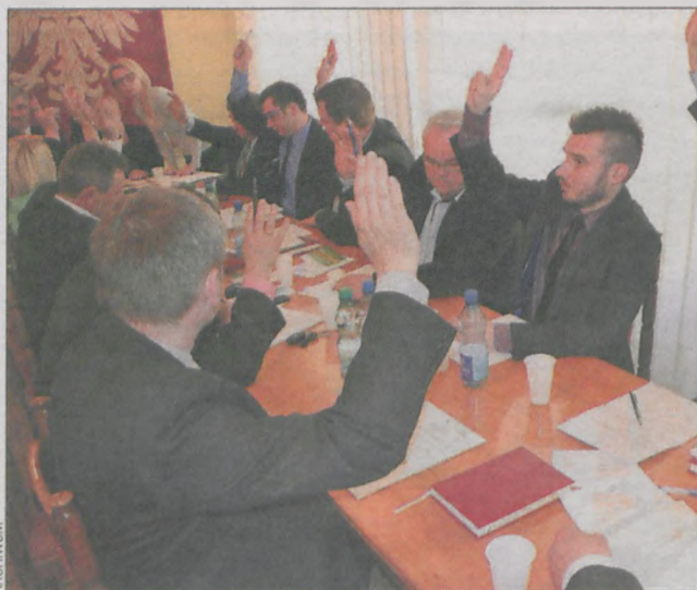
Radni zajmować będą się bieżącymi sprawami