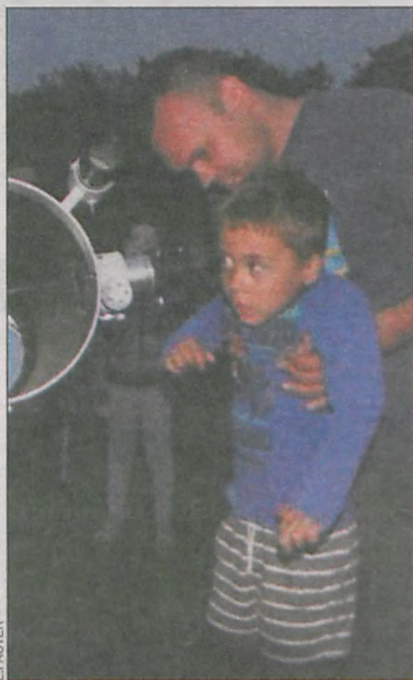
Dla dzieci kontakt z astronomią to wielka atrakcja