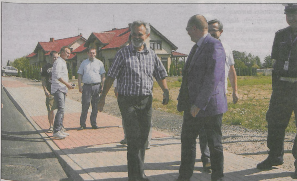
Burmistrz Krotoszyna i urzędnicy w czasie odbioru drogi