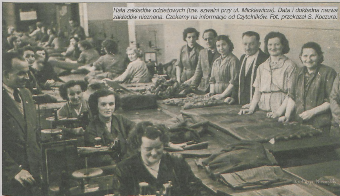
Hala zakładów odzieżowych (tzw. szwalni przy ul. Mickiewicza). Data i dokładna nazwa zakładów nieznaną. Czekamy na informacje od Czytelników.