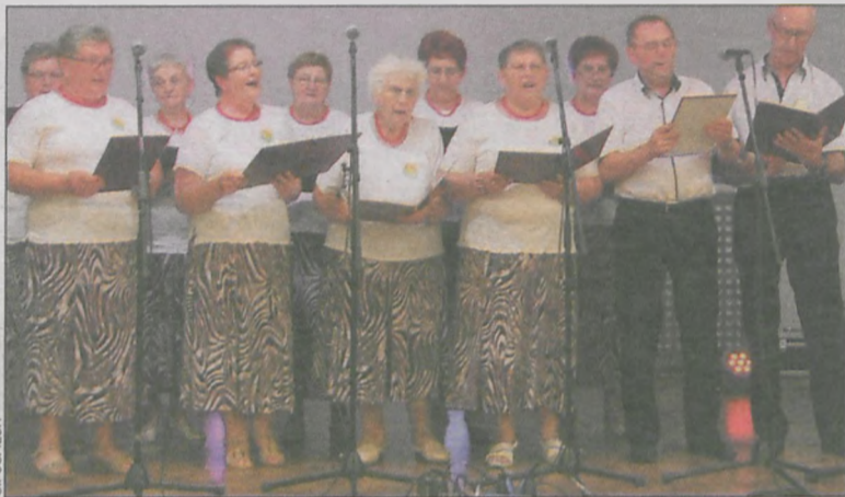
Chór Familia z Kuklinowa