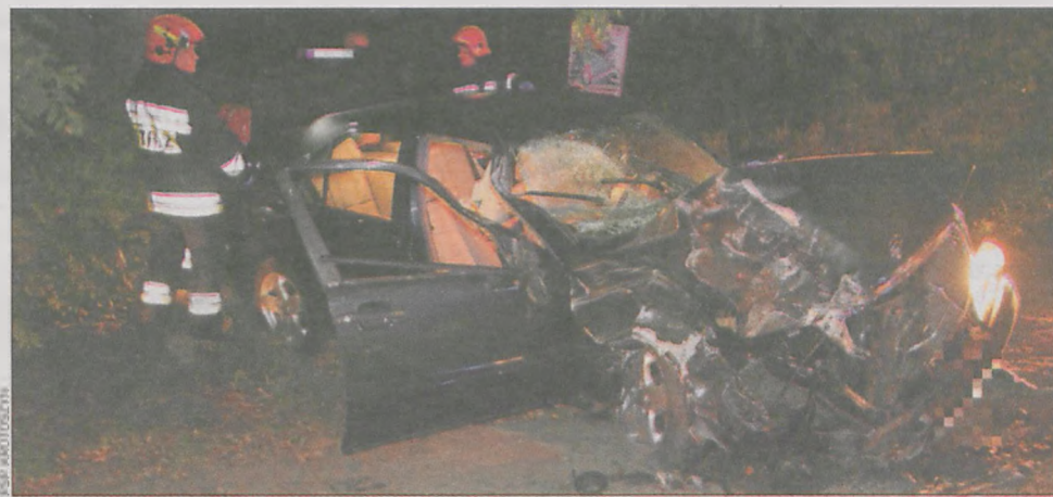
Mercedes raczej już nie będzie nadawał się do naprawy