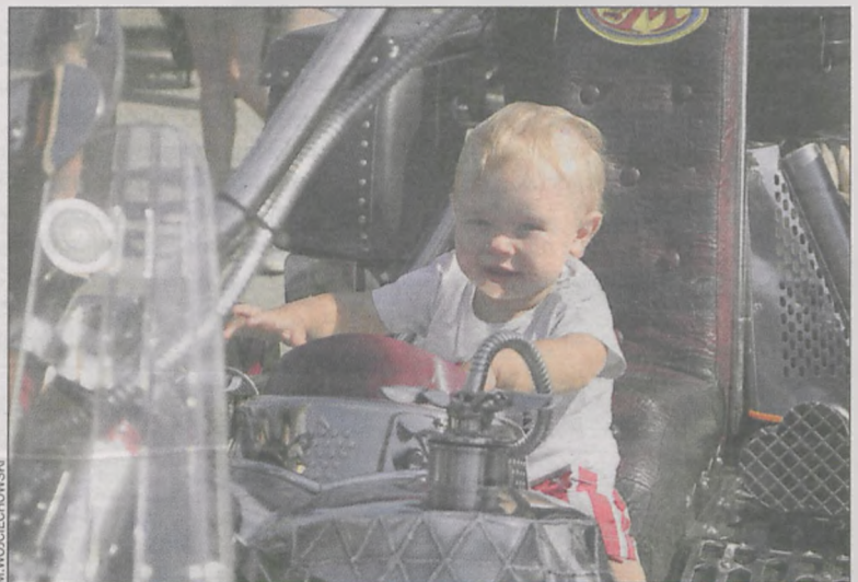
Jazda, do przodu!