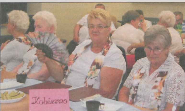
To był wyjątkowo gorący dzień. Panie z kobierskiego chóru Seniorki