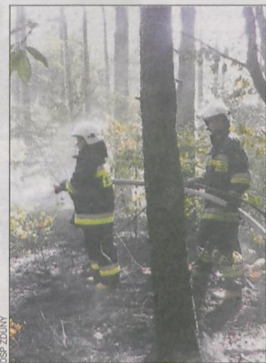
Gaszenie pożaru lasu