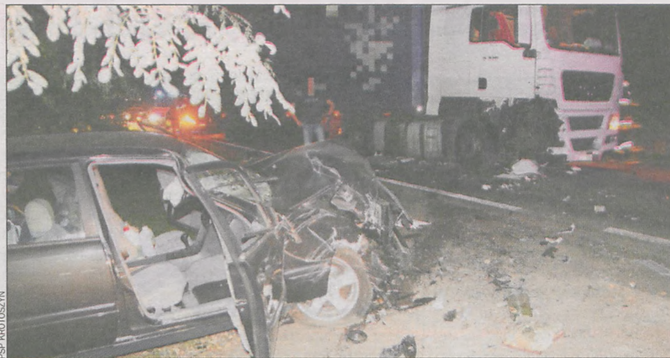
Oba auta zostały poważnie uszkodzone

Kierowca osobówki będzie musiał zapłacić 500 zł mandatu. Auto zostało znacznie uszkodzone.