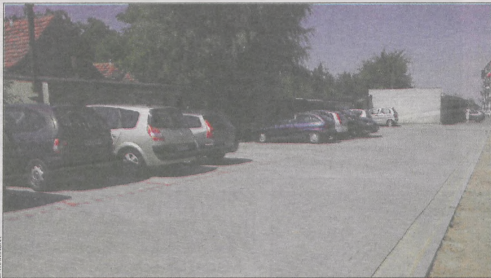
Mieszkańcy os. Tysiąclecia zyskali więcej miejsc do parkowania

Na koźmińskim osiedlu Tysiąclecia, pomiędzy blokami nr 7 i 8, powstał nowy parking.