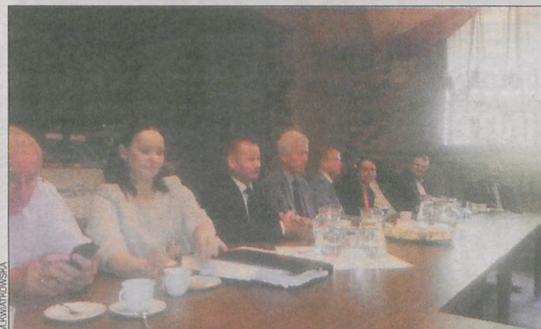
Kandydaci zapewniali, że nie zawiodą wyborców