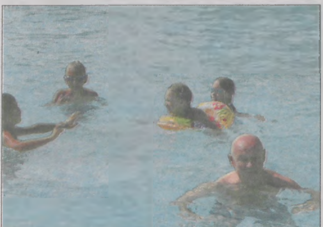
Wizyta na basenie to świetny relaks