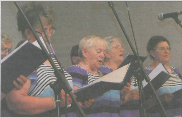
Festiwal rozpoczęła piosenka „Ojczyzna moja” w wykonaniu chóru Harfa z Kobylina