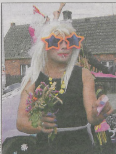
Samanty rozdawały bukietki kwiatów

Napis na ich dożynkowej platformie zapewniał, że nie sprzedadzą niczego do Rosji, tylko przerobią na bimber. Na potwierdzenie tych słów kilku starszych mieszkańców Chwaliszewa dostało po butelce markowego koniaku. Później przyszła pora na msze św., którą odprawiono na placu przy miejscowej remizie Ochotniczej Straży Pożarnej. Było dzielenie się chlebem wypieczonym z zebranego niedawno zboża. Ta część uroczystości zgromadziła wiele osób nie tylko z Chwaliszewa, ale także z innych miejscowości. (alex)