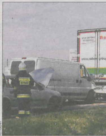
Obecni byli także strażacy

wahadłowym na krajówce, by później na kilkanaście minut zamknąć go całkowicie. Gdy poszkodowane osoby zostały przewiezione do szpitala, strażacy ochotnicy uprzątnęli miejsce zdarzenia. (ola)