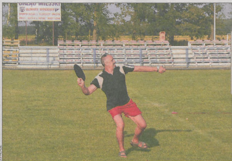
Każdy miał swoją metodę rzutów