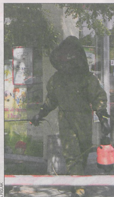
W takiej sytuacji zawsze należy zachować szczególną ostrożność