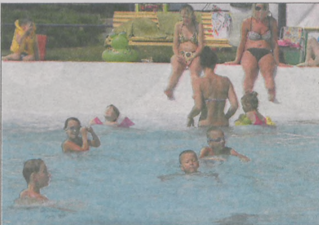
Kąpielisko odwiedzały osoby w różnym wieku

ści – o głębokości 1,25 m, 1,80 m oraz 2,20 m. Na największej głębokości, w wyznaczonych miejscach, dopuszczalne są skoki do wody. Kąpielisko ma też plac zabaw, boisko do piłki siatkowej oraz