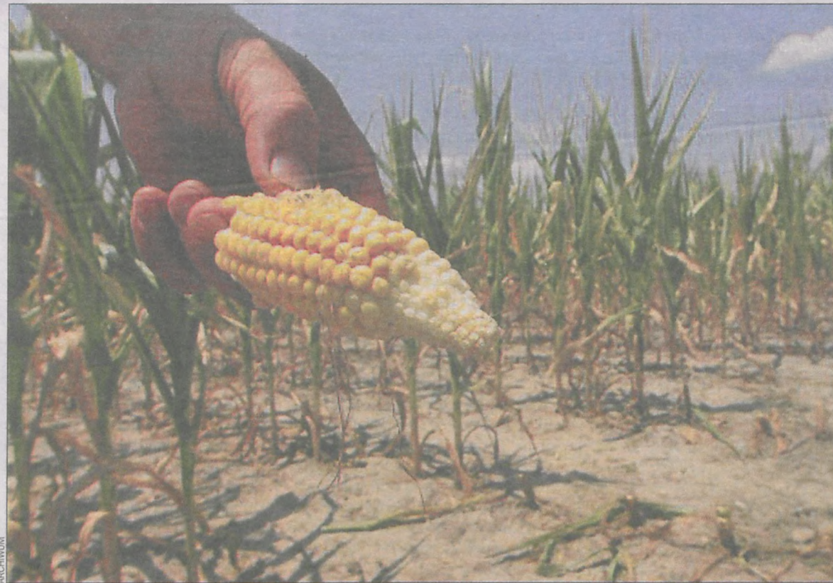
Susza najbardziej dotknęła kukurydzę, buraki i użytki zielone

Zgodnie z definicją określoną w ustawie o ubezpieczeniach upraw rolnych i zwierząt gospodarskich suszę oznaczają szkody spowodowane wystąpieniem w dowolnym sześciodekadowym okresie od dnia 1 kwietnia do dnia 30 września danego roku