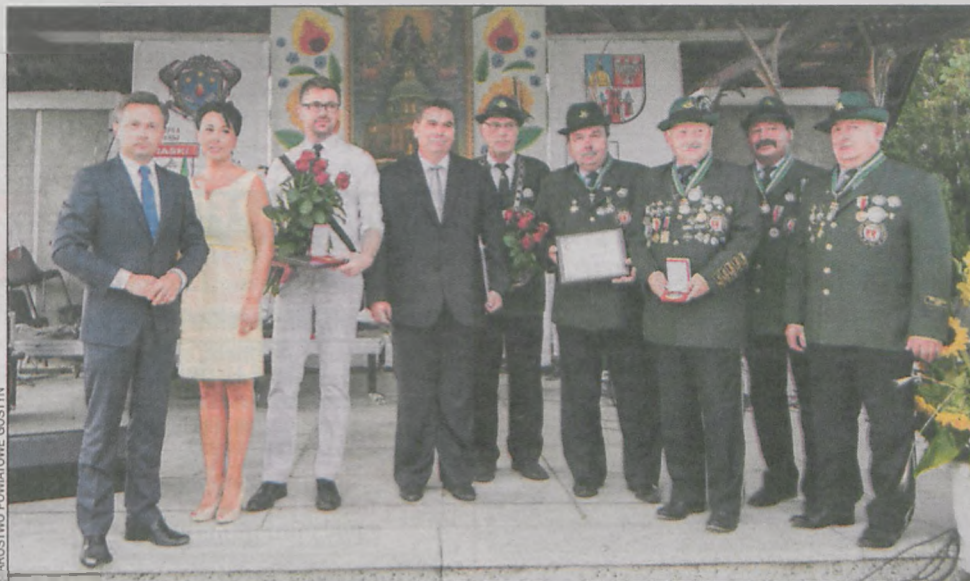
Kurkowi bracia podczas uroczystości wręczenia odznaczeń na Świętej Górze pod Gostyniem

– Serdecznie gratuluję i dziękuję za ambitną, owocną – daleko wykraczającą poza podstawowe obowiązki – pracę, dzięki której powiat i gmina zyskują wciąż nowe i piękniejsze oblicza – powiedział Alfred Siama. – Dziękuję za imponujące zaangażowanie, bezinteresowność i ciągłą gotowość do służby społecznej. Pogorzelscy bracia kurkowi od 25 lat w wolnej Polsce aktywnie i skutecznie prowadzą działalność społeczno-kulturalną, wychowawczą i edukacyjną, a także promują zarówno gminę Pogorzela, jak i powiat