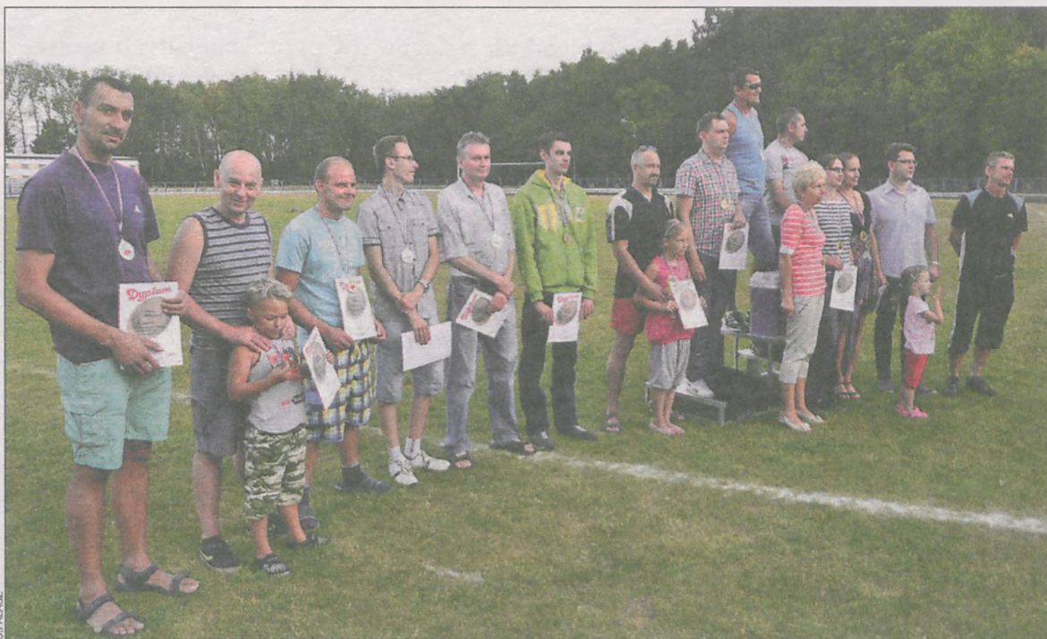
Najlepsi uczestnicy mistrzostw