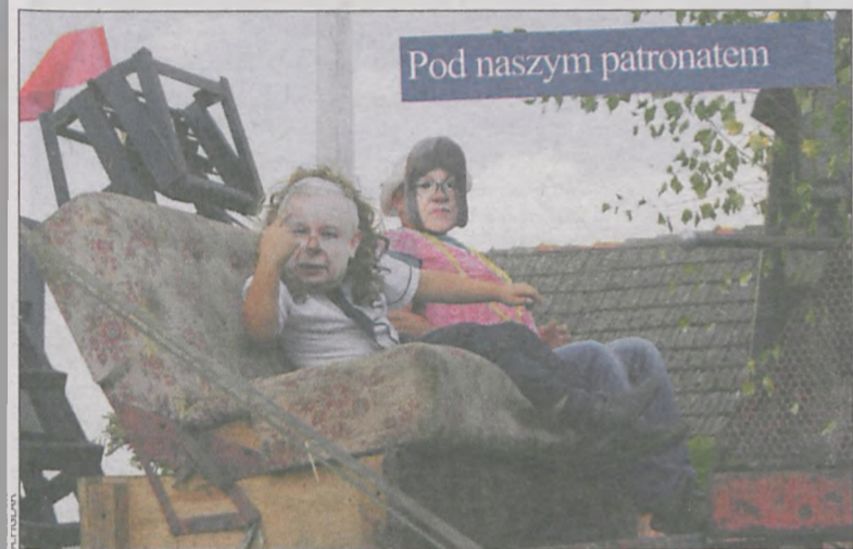
Przyjechał nawet Jarosław Kaczyński i Anna Grodzka

W niedzielę 23 sierpnia mieszkańcy Chwaliszewa świętowali dożynki. Nie zabrakło im poczucia humoru i pomysłów na przyozdobienie swoich maszyn rolniczych.