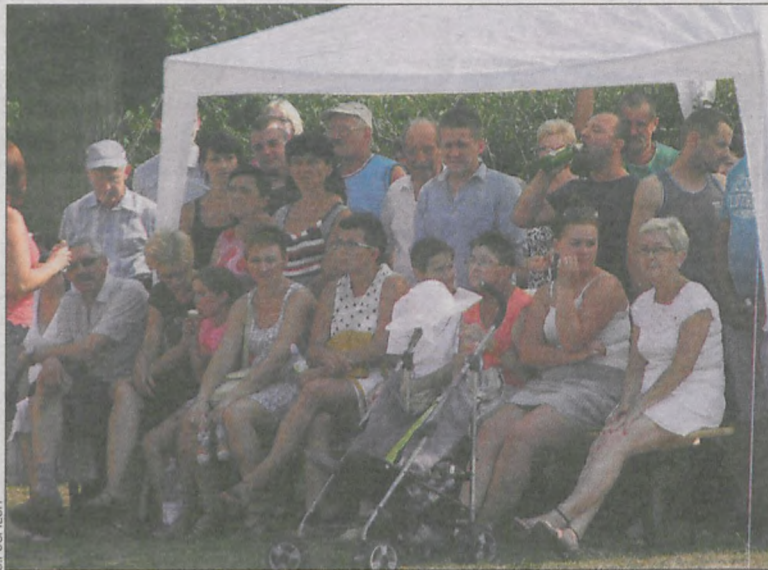
Nie zawiedli mieszkańcy z całymi rodzinami

Zespół ludowy Łagiewniczanie o każdej z wyróżnionych osób ułożył krótką, dowcipną przyspiwkę.