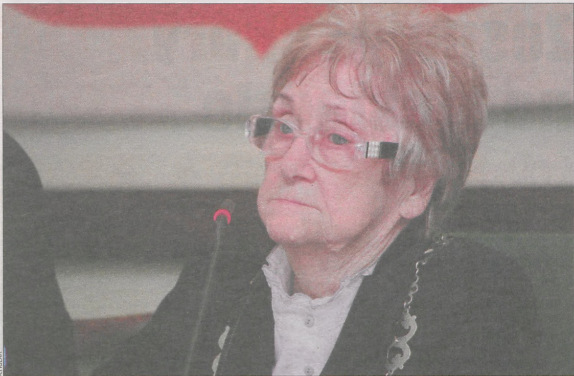
O pieniądzach na kulturę wiejską dyskutowano na posiedzeniu komisji społecznej Rady Miejskiej

Krotoszyński Ośrodek Kultury powinien się bardziej zaangażować we wspieranie działań kulturalnych na wsiach – uważa część radnych.