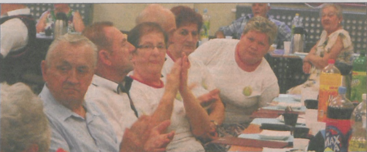
Brawami nagradzano każdy występ