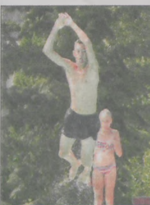
Skoki do wody to frajda dla młodzieży