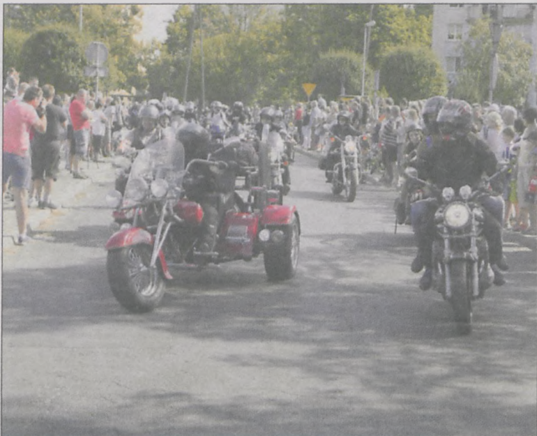
Parada wzbudziła spore zainteresowanie krotoszyńców