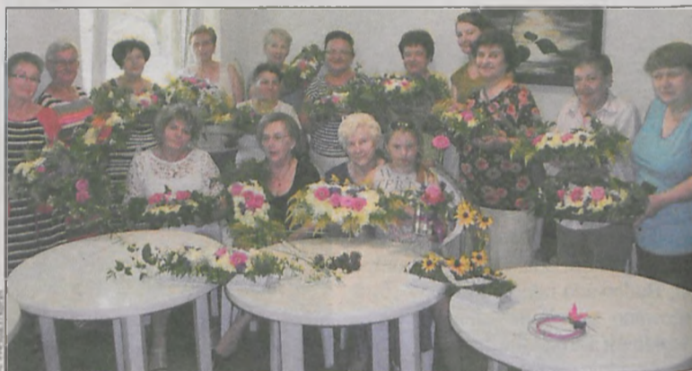
Uczestniczki kursu bukicciarstwa z instruktorką