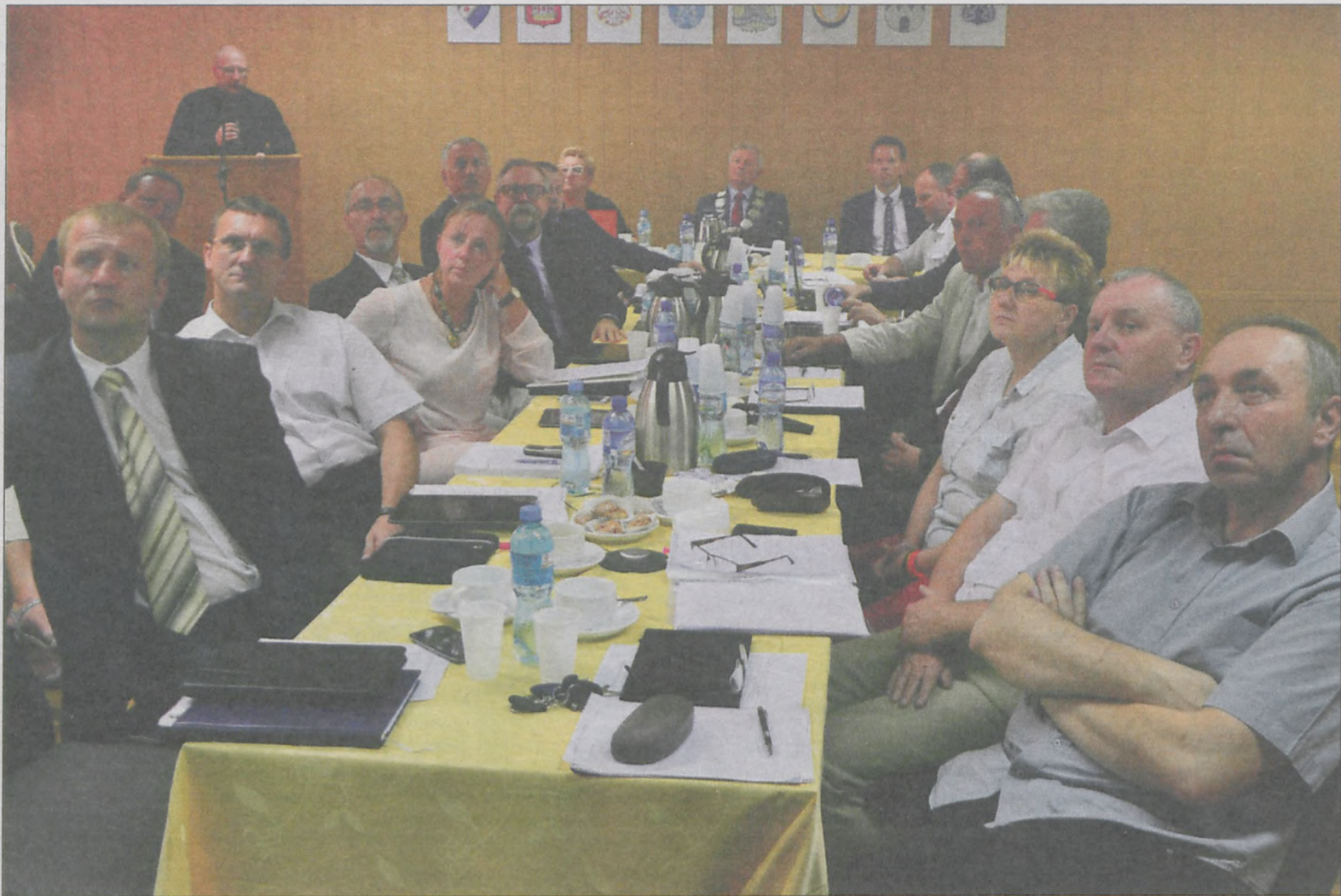
Radni podczas prezentacji raportu

Zdaniem audytorów na trudną sytuację finansową ma wpływ m.in. rozlokowanie oddziałów i przychodni w aż 10 budynkach. Nie należy się spodziewać, by wysokość kontraktów podpisywanych z NFZ uległa zwiększeniu. Szpital w Krotoszynie nie wygląda jednak źle, w zestawieniu z ościennymi powiatami, gdy chodzi o pozyskiwaną w ramach kontraktu ilość pieniędzy na jednego mieszkańca powiatu. Wg audytorów nasza placówka posiada potencjał, który przy odpowiednim wprowadzeniu zmian może umocnić jej pozycję medyczną. Chodzi np. o możliwość utworzenie pododdziału nefrologii oraz geriatry na internie, prowadzenie rehabilitacji kar-