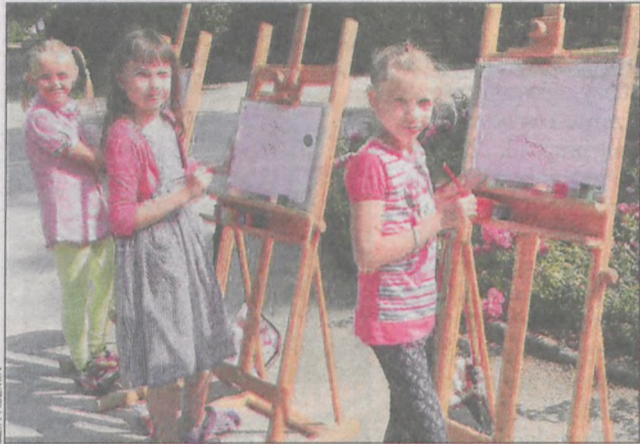
Malowanie przypadło do gustu szczególnie dziewczynkom

18 sierpnia najmłodszy mieszkańcy gminy Koźmin spotkali się w miejskim parku, by po raz kolejny tworzyć pod opieką instruktorki malowane dzieła.