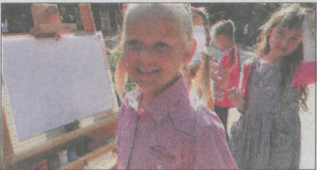
Małe artystki w koźmińskim parku