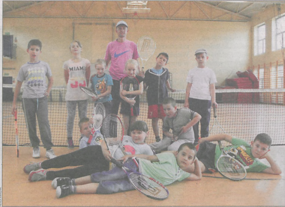
Najmłodsi uczestnicy tegorocznych zajęć