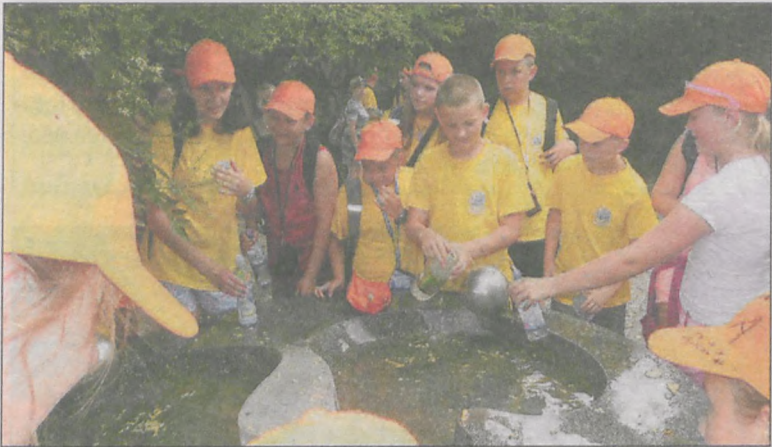
W trakcie jednej z wycieczek