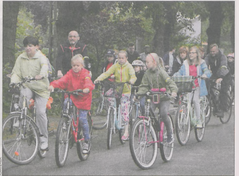
Ruszyli na trasę 15-kilometrowego rajdu rowerowego

Na festynie można było skorzystać z wielu darmowych atrakcji, takich jak malowanie twarzy, zbiorowe tworzenie pracy artystycznej, gra w kręgle, rzuty piłką oraz wiele innych. Dzieci chętnie korzystały z dmuchanego zamku i suchego basenu. Dorośli mogli sobie zmierzyć ciśnienie i poziom cukru we krwi. Dużym urozmaicheniem były przejażdżki bryczką, którą udostępnił klub jeździecki Krotoszyńska Kawalkada. Przy stoisku policji funkcjonariusze znakowali rowery. Do festynu dołączyli również uczestnicy z trwającej w ten sam weekend milickiej imprezy American Cars Mania, oferując przejażdżki swoimi wyprodukowanymi w USA samochodami.