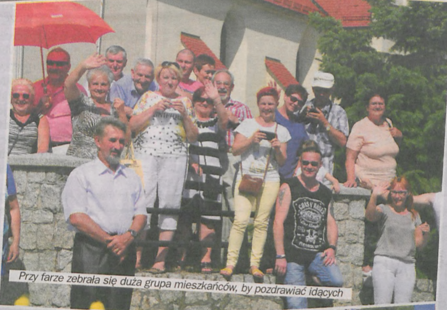
Przy farze zebrała się duża grupa mieszkańców, by pozdrawić idących