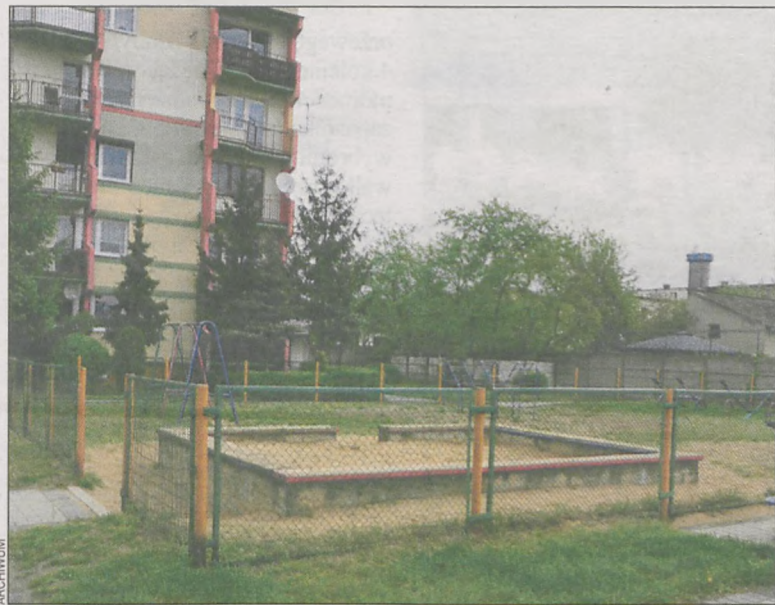
Czy miasto ma budować place zabaw na terenie należącym do spółdzielni?

Gmina mogłaby wybudować plac zabaw, jednak teren ten należy do spółdzielni mieszkaniowej. Ostatecznie, jak mówi W. Sołtysiak, ustalono, że obie instytucje będą musiały wspólnie rozwiązać problem ze