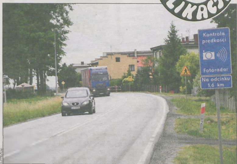
Według GDDKiA strefa została wyznaczona prawidłowo

Często widzę, jak niektórzy kierowcy pokonują zakręt koło sklepu z zawrotną prędkością. A tam przecież przechodzą dzieci do szkoły. Wyjazd z ul. Wiejskiej jest utrudniony przez słabą widoczność, o wypadek nie trudno. A czelny, który to napisał, niech jeździ przepisowo, to mu ani policja, ani straż nie będzie przeszkadzać.