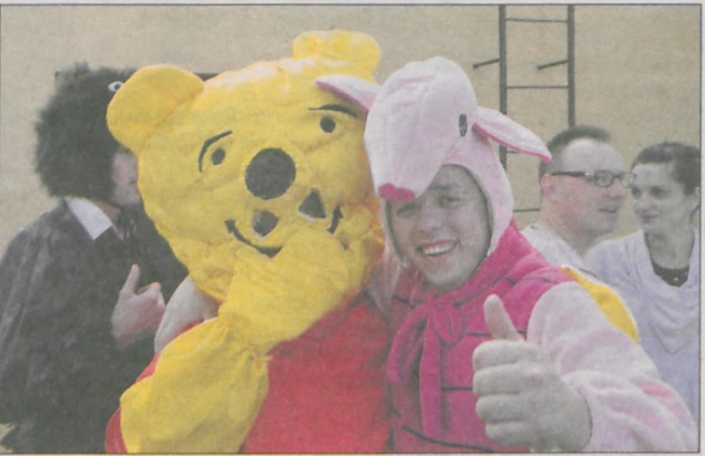
Postaci z bajek rozdawały upominki