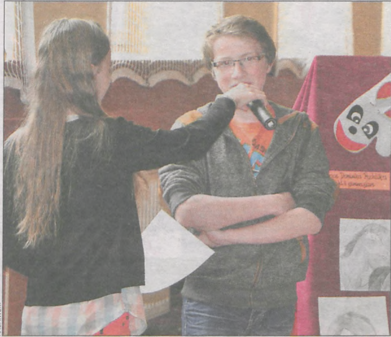
Młodzież prezentowała m.in. umiejętności plastyczne

19 czerwca uczennice i uczniowie Zespołu Szkół im. ks. Jana Twardowskiego w Chwaliszewie zaprezentowali swoje umiejętności podczas Święta Talentów.