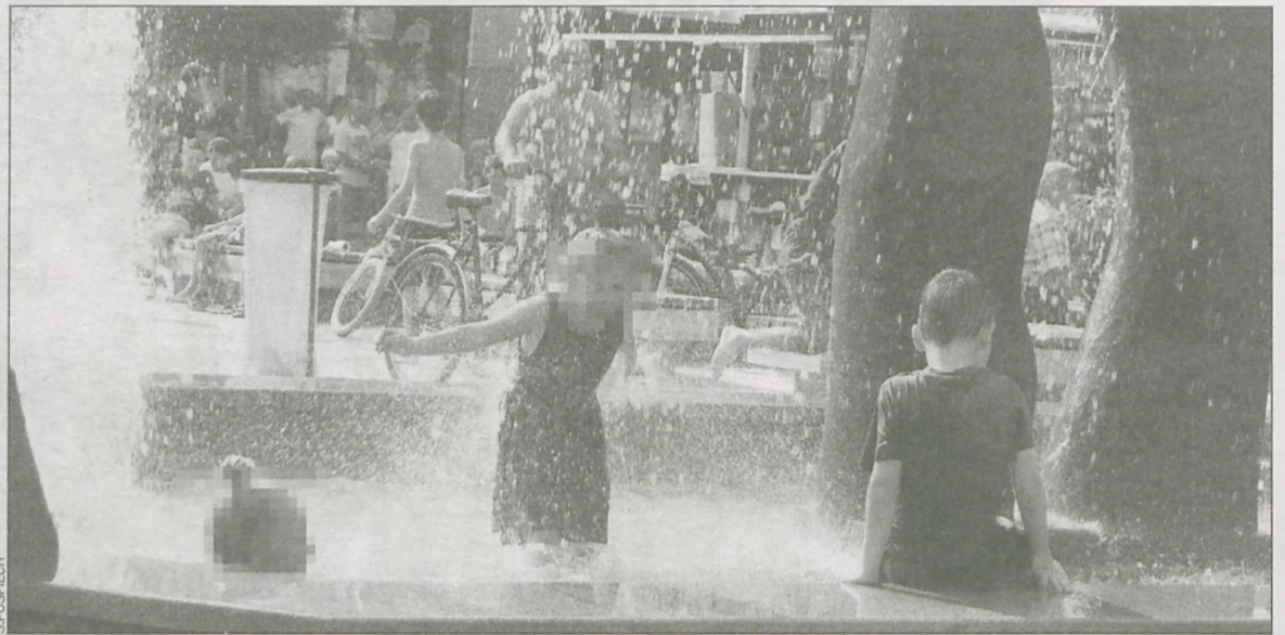
W upalne dni dzieci kąpią się w fontannie

Wynajmujący zastrzega sobie prawo do odwołania lub unieważnienia przetargu bez podawania przyczyn.