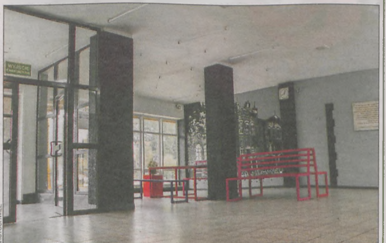
To miejsce – zdaniem wielu krotoszyńian – zmieniło się nie do poznania

Warto przypomnieć, że w tym roku do zdobycia są granty w wysokości 4, 7 i 10 tys. zł. Wnioski przyjmowane będą do 26 lipca, a już 21 sierpnia komisja ogłosi listę beneficjentów programu. W ubiegłym roku znalazło się na niej 247 pozycji z całej Polski. W tym roku przewidziano dofinansowanie 250 projektów. Ich łączna kwota to 1,5 mln zł.