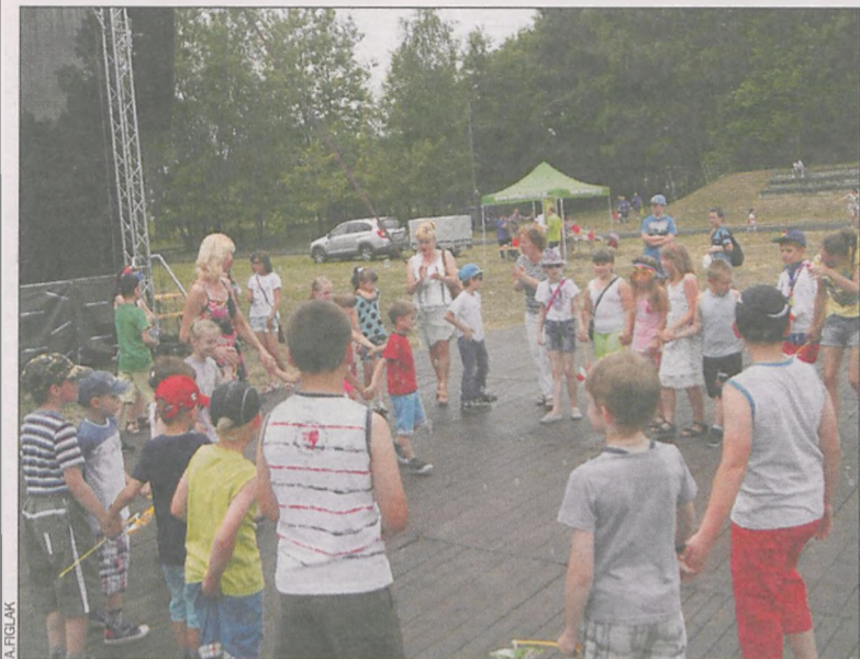
Najmłodszy tańczyli pod sceną