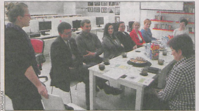
W dyskusji uczestniczyli przedstawiciele stowarzyszeń i kół wiejskich

Członkowie stowarzyszenia Aktywny Konarzew zorganizowali zapowiadane szkolenie na temat działania i finansowania stowarzyszeń.