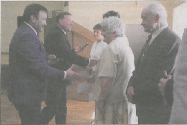
Medale otrzymali także emerytowani pracownicy Urzędu Gminy