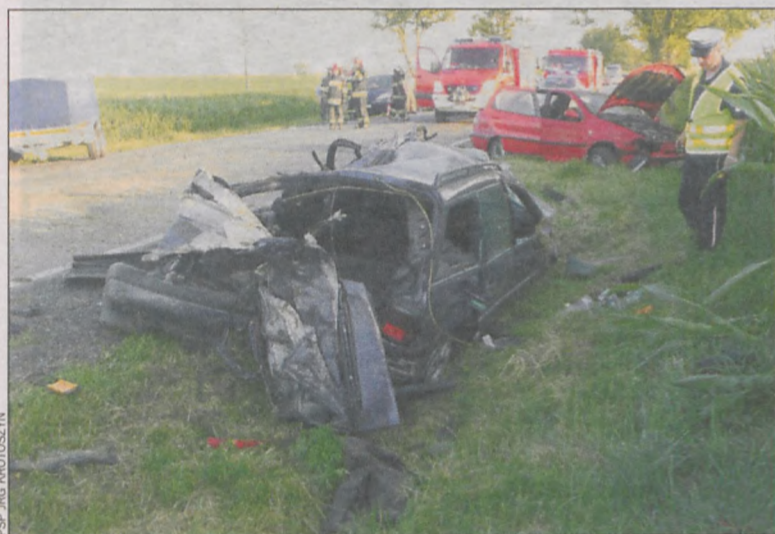
Kierowca volkswagena przebywa w szpitalu

Ciężki wypadek miał miejsce na drodze krajowej nr 15 w Bożacinie. Volkswagen passat z przyczepką zderzył się z fiatem sieną. Kierowca passata trafił z poważnymi obrażeniami do szpitala w Krotoszynie. W szpitalu znalazł się także kierowca fiata, którego nagle rozbolała głowa.