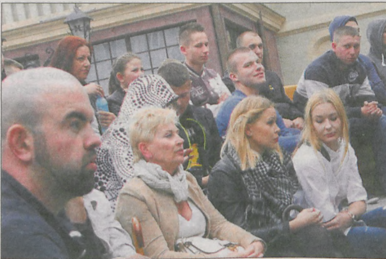
Zmagania zapaśników na rynku obserwowała duża grupa kibiców