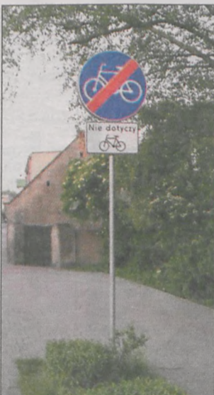
Znak na ul. Boreckiej sam się wykluczał, ale po naszej interwencji przestał wprowadzać zamęt

ta odnosi się do znaku C-16 na tym samym słupku, na rewersie sfotografowanego znaku, w celu umożliwienia rowerzystom skorzystania z szerokiego chodnika, lecz pod warunkiem zachowania ostrożności i ustąpienia pierwszeństwa pieszym. Obracanie znaków drogowych jest