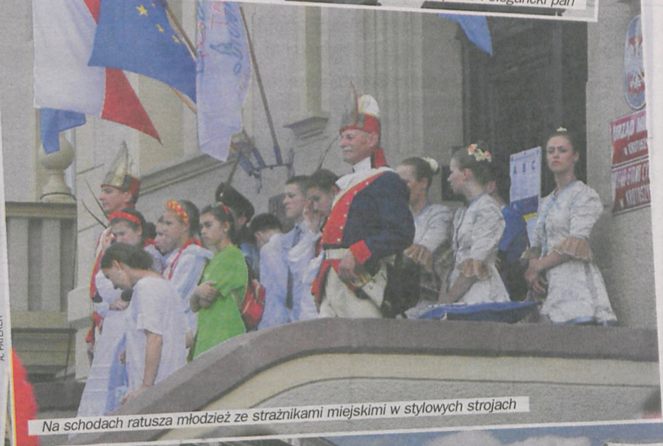
Na schodach ratusza młodzież ze strażnikami miejskimi w stylowych strojach