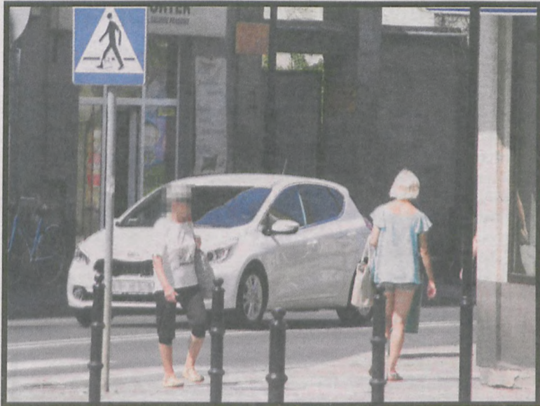
Codziennie przemierza ulice w centrum Krotoszyna

du, w którym siedzi inna kobieta. Puka w jej szybę. Ta nie otwiera. – Przepraszam – mówi i odchodzi.