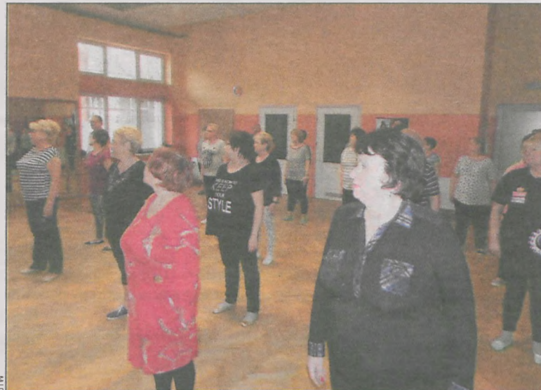
W zajęciach tanecznych uczestniczyły głównie panie, ale byli też nieliczni panowie

Dzięki pieniądzą od Starostwa Powiatowego krotoszyńskiego stowarzyszenie Uniwersytet Trzeciego Wieku mogło zorganizować kolejne kursy.