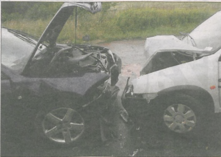
Samochody zostały poważnie uszkodzone

28 czerwca ok. godz. 4.30 w Czarnogózdnicach (gm. Krośnice) doszło do czołowego zderzenia dwóch samochodów osobowych. Oplem corsą kierowała 21-letnia mieszkanka pow. krotoszyńskiego.