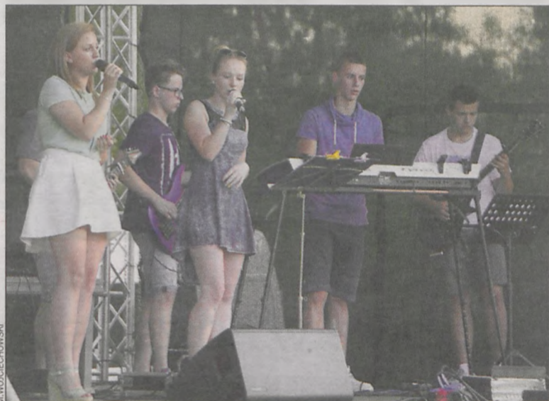
Zespół Bez Sensu pokazał, że potrafi śpiewać z sensem