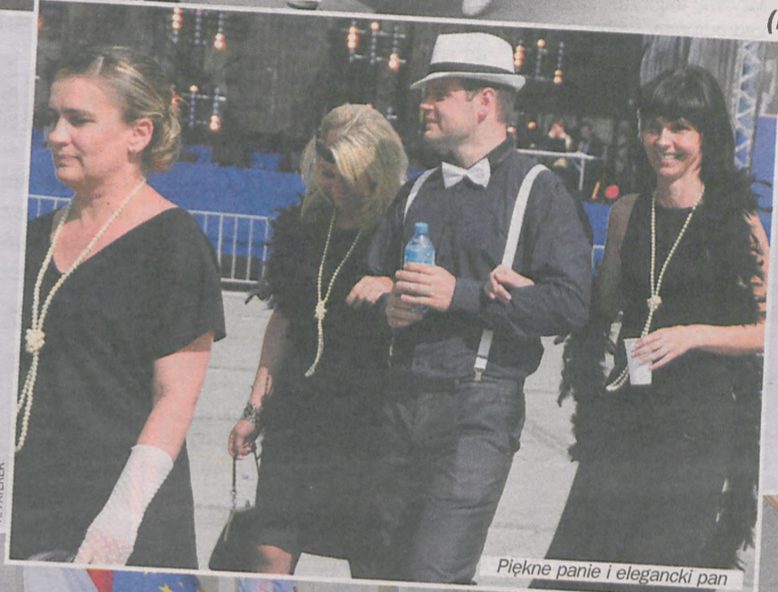
Piękne panie i elegancki pan