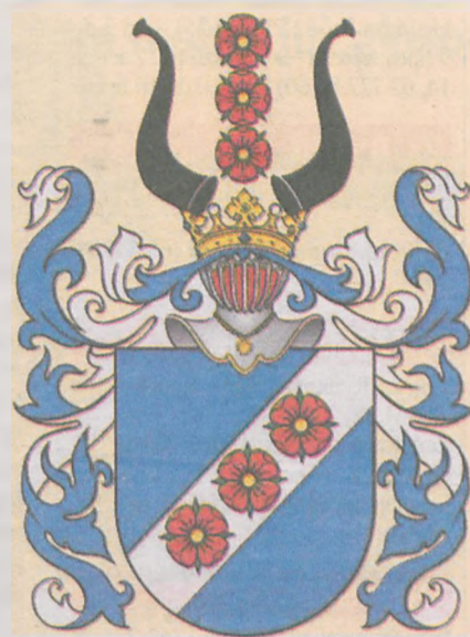
Ród Rozdrażewskich posługiwał się herbem Doliwa