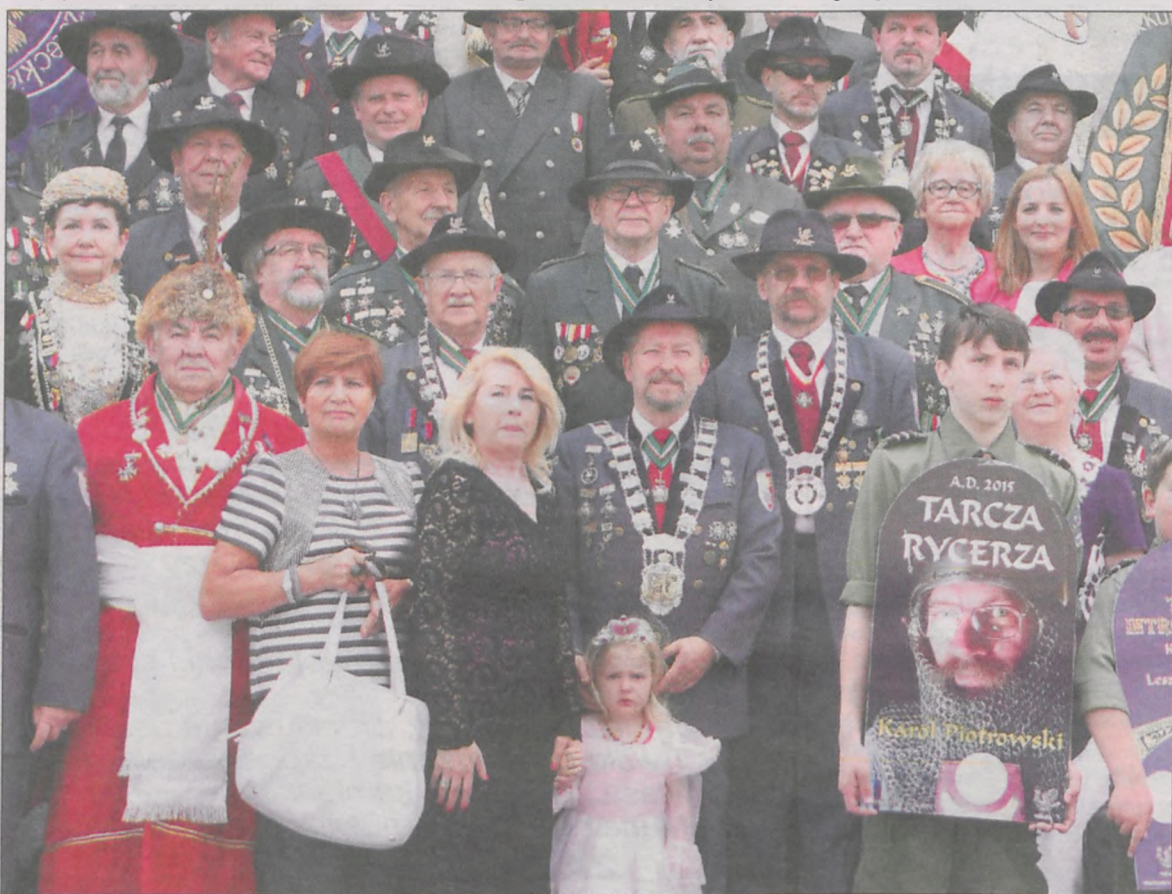
Na uroczystość przybyli bracia kurkowi z okolicznych miast