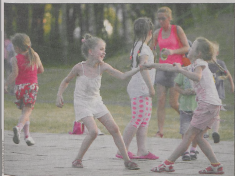
Dzieci bawiły się świetnie