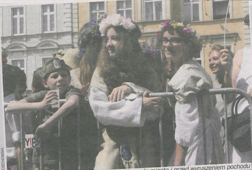
Chwila oczekiwania po przekazaniu kluczy do miasta i przed wyruszeniem pochodu