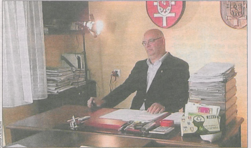
W trakcie nagrywania wypowiedzi wójta do programu telewizyjnego „Interwencja”

W internecie gmina Cieszków upubliczniła pismo do telewizji