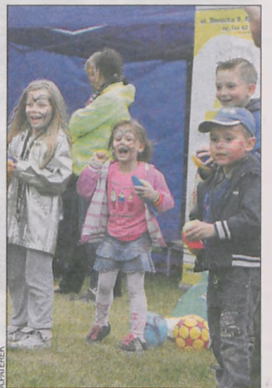
Gry i zabawy dla dzieci miały powodzenie

Dzięki sponsorom zorganizowano loterię, w której każdy los wygrał.