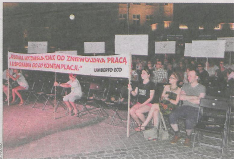
Finałowe zdjęcie „demonstrujących”

Hasło koncertu i wieczu brzmiało Kultura wyzwala ciało od zniewolenia pracą i usposabia je do kontemplacji (Umberto Eco). Kiedy przyszedł czas na wiecowanie i szykowanie tablic, na których miały być wypisane hasła, szukanie kandydatów do wyrażenia swoich myśli szło opornie. W końcu chwycono za flamastry. Publiczność zaczęła wypisywać swe postulaty. Oto niektóre z nich: Więcej czadu! K. Prońko. W kulturze są książki i granie. Więcej kultury codziennej! – Zdjęcie, który odnaleźliśmy w internecie, a które przedstawia protestujących przeciwko obecności Żydów w Polsce z lat sześćdziesiątych ubiegłego wieku, stało się graficznym moty-