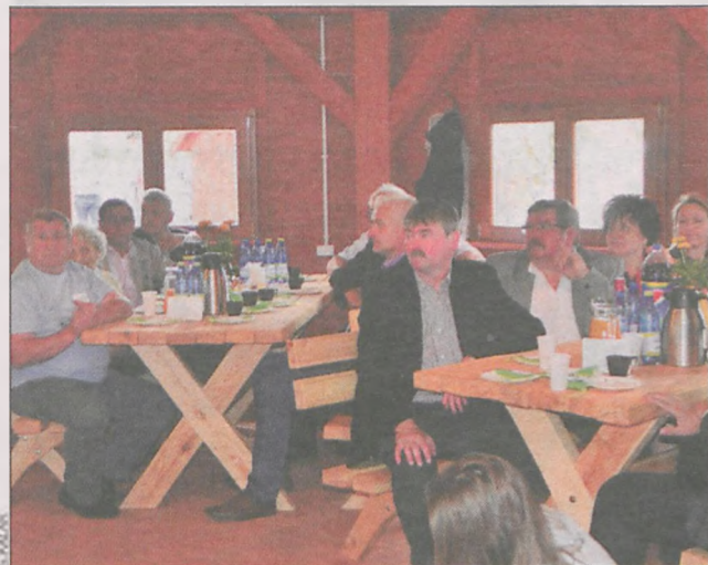
Uroczystość zgromadziła wielu gości