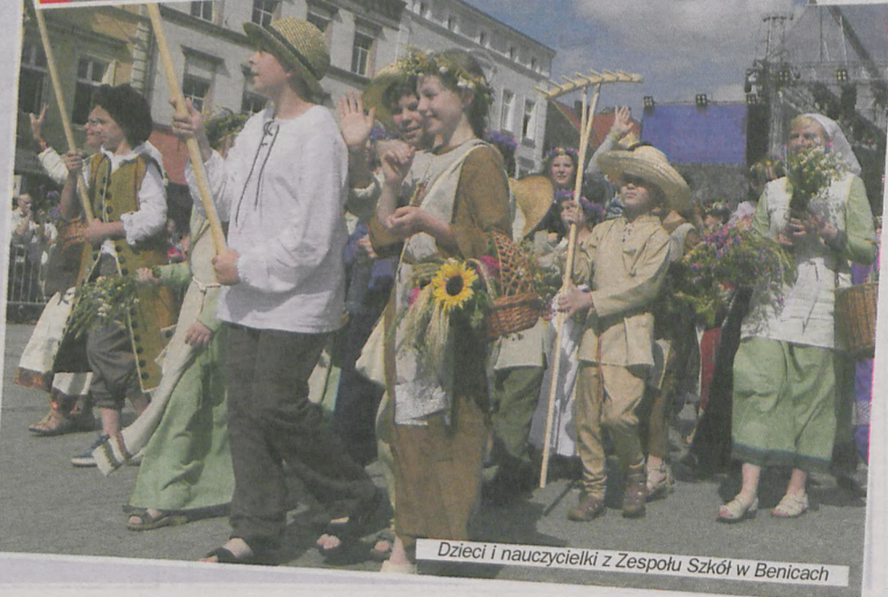
Dzieci i nauczycielki z Zespołu Szkół w Benicach