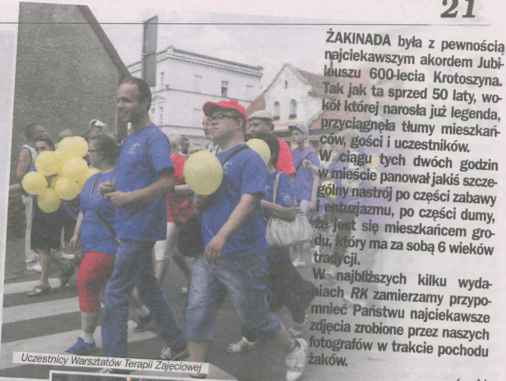
Uczestnicy Warsztatów Terapii Zajęciowej

ŻAKINADA była z pewnością najciekawszym akordem Jubileuszu 600-lecia Krotoszyńska. Tak jak ta sprzed 50 laty, wokół której narosła już legenda, przyciągnęła tłumy mieszkańców, gości i uczestników. W ciągu tych dwóch godzin w mieście panował jakiś szczególny nastrój po części zabawy i entuzjazmu, po części dumy, że jest się mieszkańcem grodu, który ma za sobą 6 wieków tradycji. W najbliższych kilku wydaniach RK zamierzamy przypomnieć Państwu najciekawsze zdjęcia zrobione przez naszych fotografów w trakcie pochodu żaków.