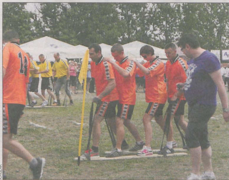
Wyścig na nartach. Zawodnicy z sołectwa Wyki

W sobotę można było usłyszeć discopolową grupę Two Boys oraz młodzieżowy Lorem z popem, rockiem czy funky. W niedzielę licznie przybyli mieszkańcy gminy i okolic obejrzeli występy lokalnego młodzieżowego zespołu Bez Sensu, kabaretu Formacja Chatelet i miejscowej Helki. Gwiazdą dwudniowej imprezy był rockowo-folkowy zespół Redlin. (alex)