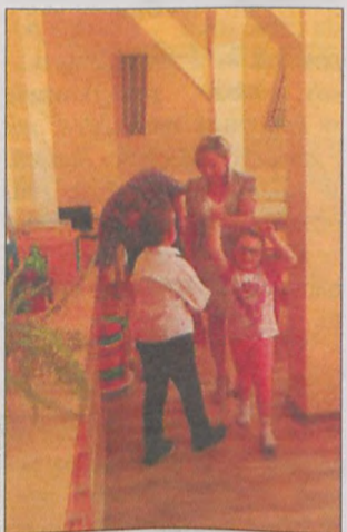
Zwiedzano nowe klasy

Przebudowa budynku ZSP możliwa była dzięki pożyczce z unijnego programu Jessica, zaciągniętej przez magistrat w Banku Gospodarstwa Krajowego. Koszt inwestycji wraz