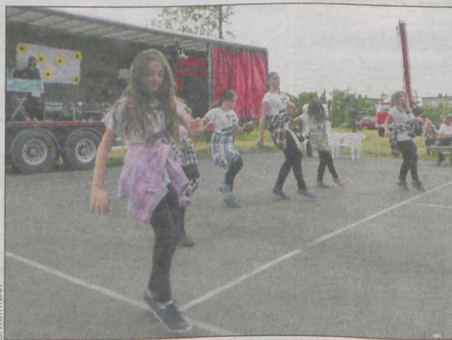
Festyn rodzinny był wspaniałą okazją do integracji mieszkańców wsi