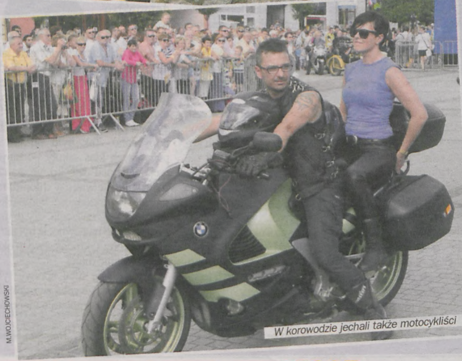
W korowodzie jechali także motocykliści