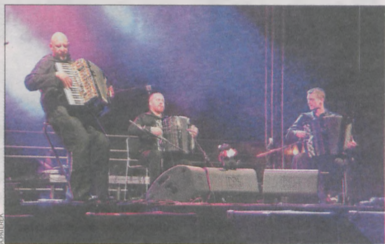
Motion Trio kolejny raz w Krotoszynie

wem naszego cyklu. Weźcie, proszę, swoje tablice, usiądźcie tak, jak oni niegdyś. Zrobimy sobie teraz podobne zdjęcie i nadajmy mu zupełnie inny wymiar. Wiecujemy w sprawie kultury! – powiedział dyrektor. Zdjęcie zostało zrobione.