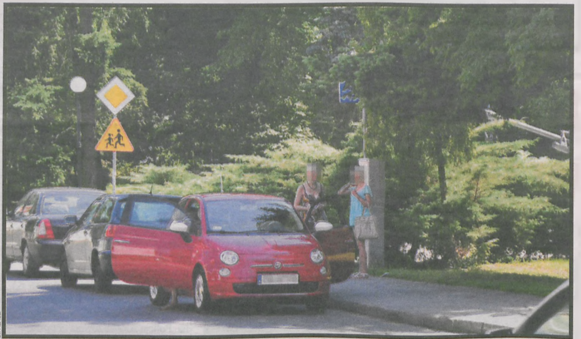
Od tej kobiety mieszkanka Gorzupi dostała drobną sumę

i nie płaciła. Wzywano policję, ale interwencja nie kończyła się nawet mandatem. – To znowu ty – mieli mówić policjanci. Chodząc po cen-