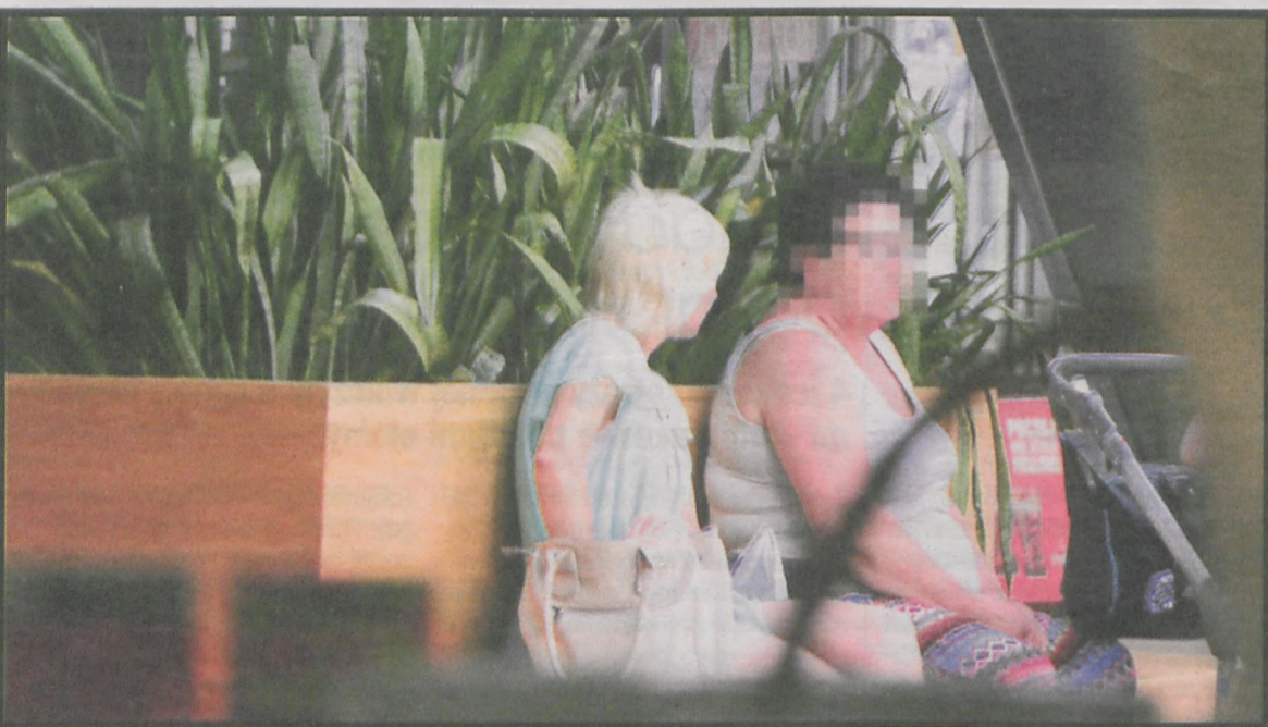
Na ławeczce w Galerii Krotoszyńskiej potrafi przesiedzieć kilka godzin