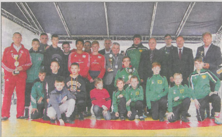
Po zakończonych walkach wszyscy ustawili się do pamiątkowego zdjęcia