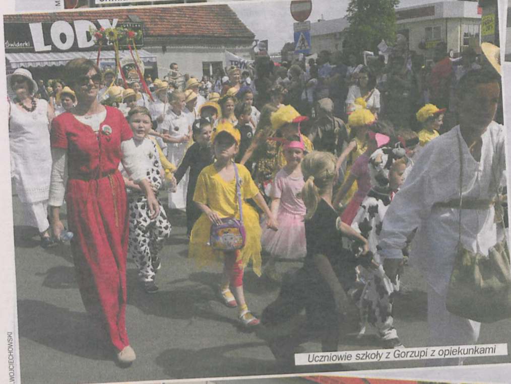
Uczniowie szkoły z Gorzupi z opiekunkami