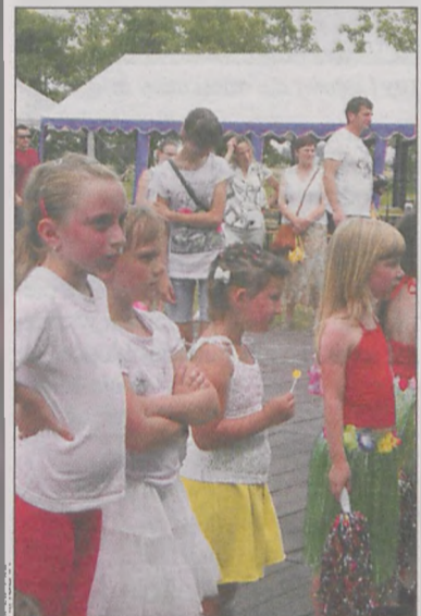
Na występach koleżanek i kolegów

Wynajmujący zastrzega sobie prawo do odwołania lub unieważnienia przetargu bez podawania przyczyny.