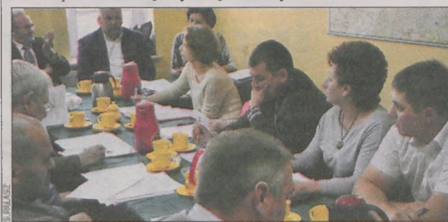
Radni głosowali za absolutorium

o 16,62 proc. (3 mln 632 tys. zł). Niższe dochody i większe wydatki musiały doprowadzić do zwiększenia deficytu, który wyniósł 3 mln 143 tys. zł. Zadłużenie gminy z tytułu kredytów to na końcu 2014 r. 1 mln 571 tys. zł. (mal)