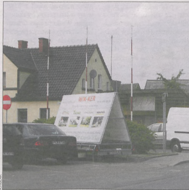
Reklama co jakiś czas pojawia się to w Rozdrażewie to w Koźminie

Na rozdrażewskim rynku od dłuższego czasu pojawiają się przyczepki lub samochody z reklamami. Zabierają one miejsca parkingowe w tej i tak małej przestrzeni w centrum miejscowości.