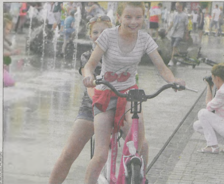
Do zabawy przy wodotryskach nikt nie ma zastrzeżeń

Upały sprawiają, że fontanna na krotoszyńskim rynku traktowana jest przez najmłodszych jak źródło chłodu. Jednak to nie miejsce do kąpieli. Czy moczenie nóg i zanurzanie się w fontannie jest bezpieczne?