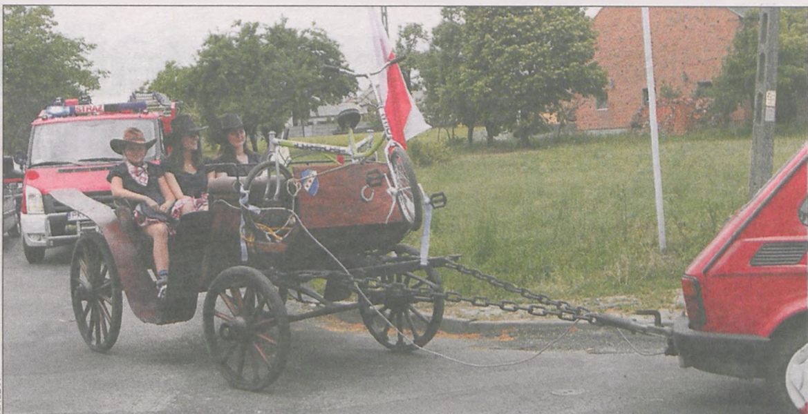
Jeden z najciekawszych pojazdów tegorocznej parady