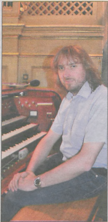
Jest również dyrygentem chóru