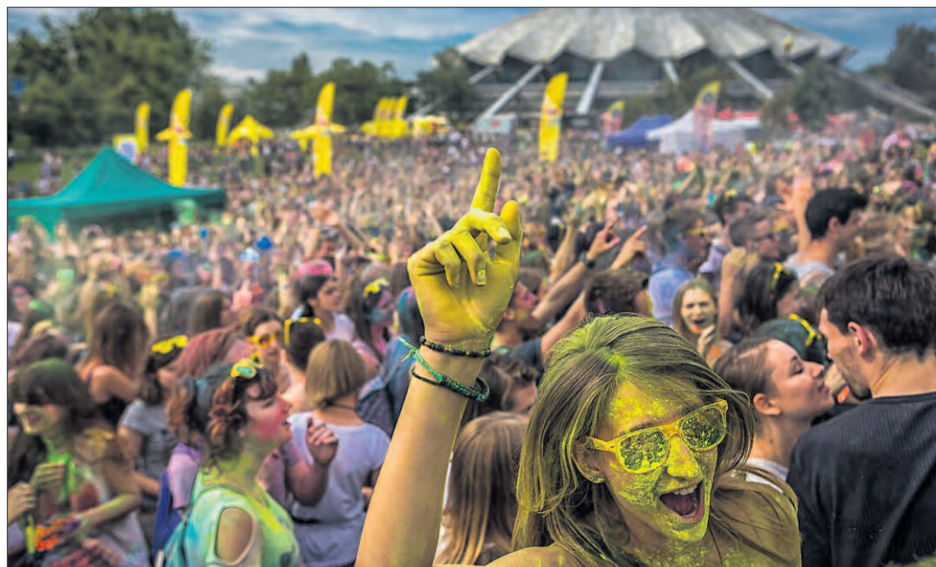
Jury zdecydowało o umieszczeniu na pokonkursowej wystawie zdjęcia „Festiwal Kolorów 5”, które na konkurs zgłosił Marcin Drab.