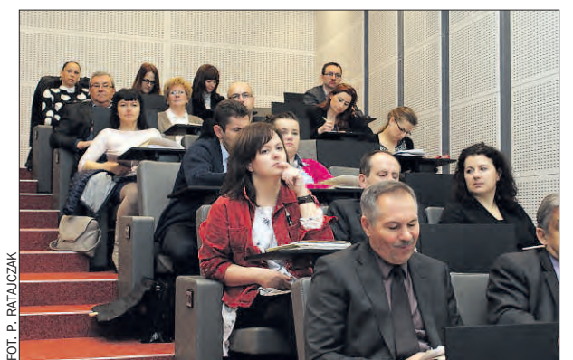
Samorządowcy dyskutowali o programach ochrony powietrza w Wielkopolsce.

Problem ten dostrzegają też samorządowcy z Wielkopolski. W październiku sejmik przyjął programy ochrony powietrza dla Poznania i Kalisza, zmierzające do ograniczenia emisji do atmosfery szkodliwych substancji. Dokumenty wskazują na przykład na konieczność wymiany kotłów wę-