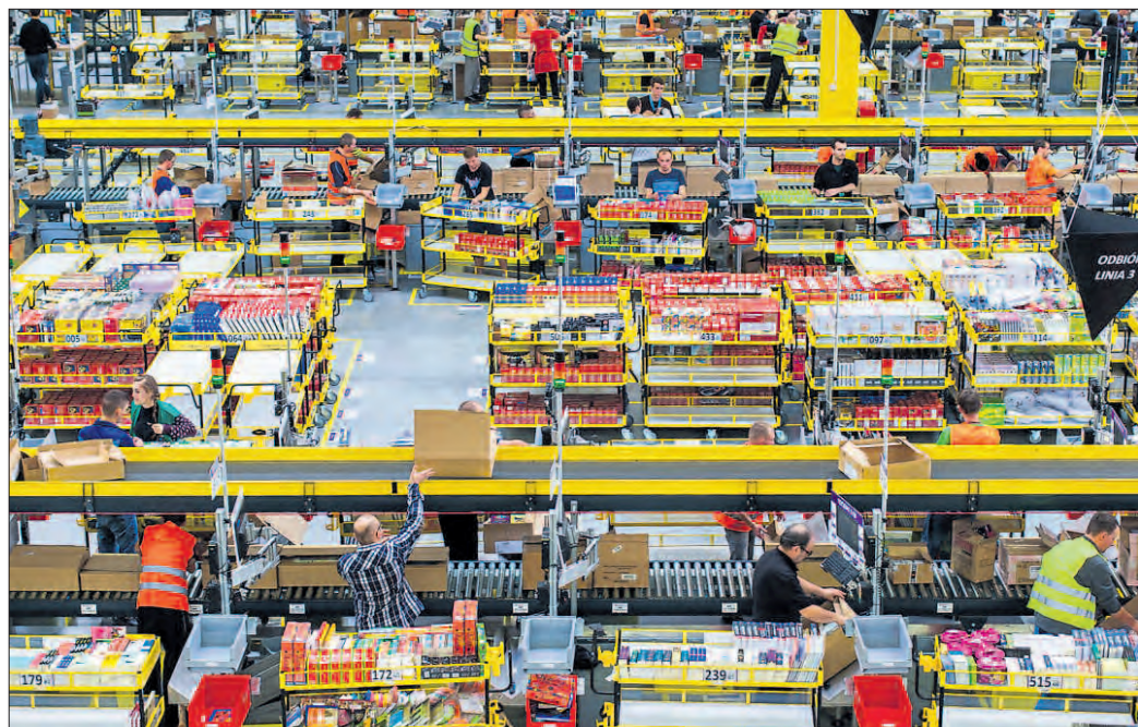
Fotografię Pawła Jaskółki „W pracy” można do 31 grudnia oglądać w holu Wielkopolskiego Urzędu Wojewódzkiego w Poznaniu.

w formie objazdowej wystawy, są przejmującą obrazkową dokumentacją otaczającego nas świata.