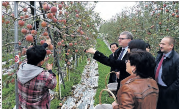
Członkowie wielkopolskiej delegacji podczas wizyty w Eun-seong Apple Farm.

Wizyta studyjna w regionie partnerskim Chungcheongnam-do oraz na targach Food Week Korea 2015 była celem wyjazdu wielkopolskiej delegacji w dniach 19-25 listopada.