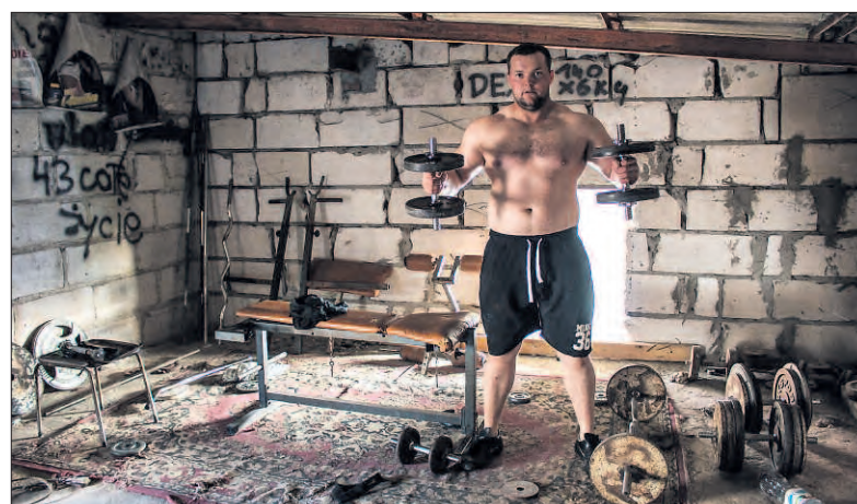
Zestaw zdjęć „Kulturyści” Artura Kucharczaka zdobył I nagrodę w kategorii „Człowiek i jego pasje”.