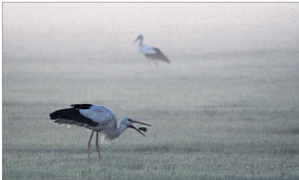
Zdjęcie Romana Mencela „Bocian z myszką” zakwalifikowano do wystawy „Wielkopolska Press Photo”.