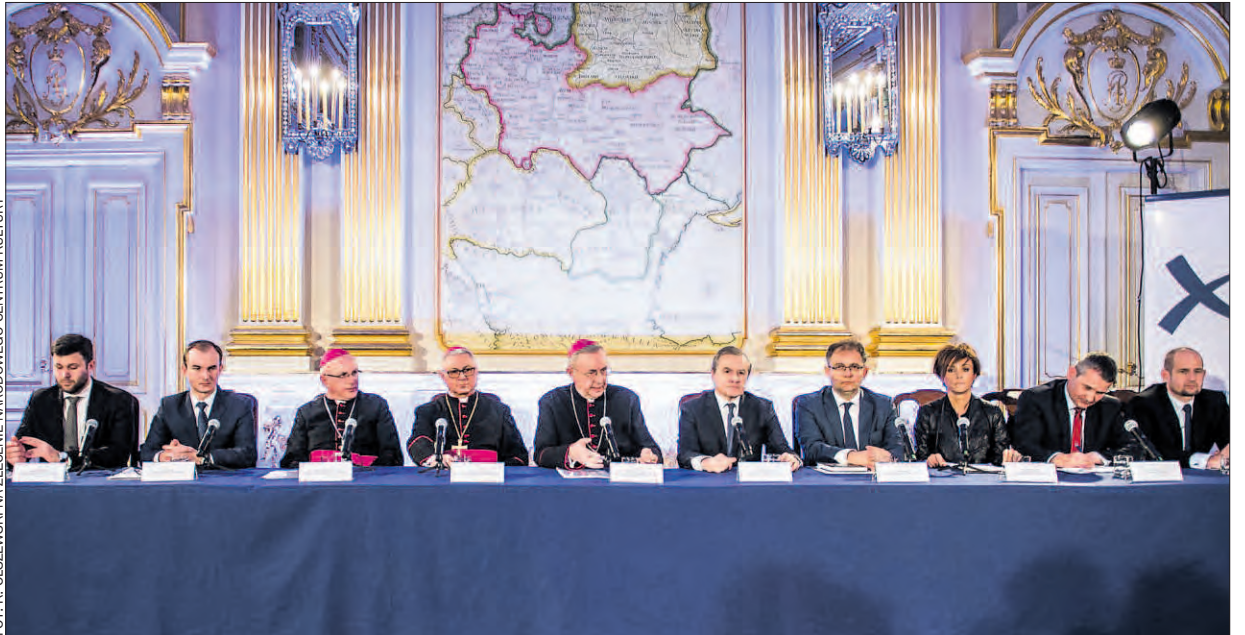
Konferencję prasową o rocznicowych wydarzeniach zorganizowano w pięknych wnętrzach Zamku Królewskiego w Warszawie.

Samorząd województwa wśród współorganizatorów obchodów 1050. rocznicy Chrztu Polski.