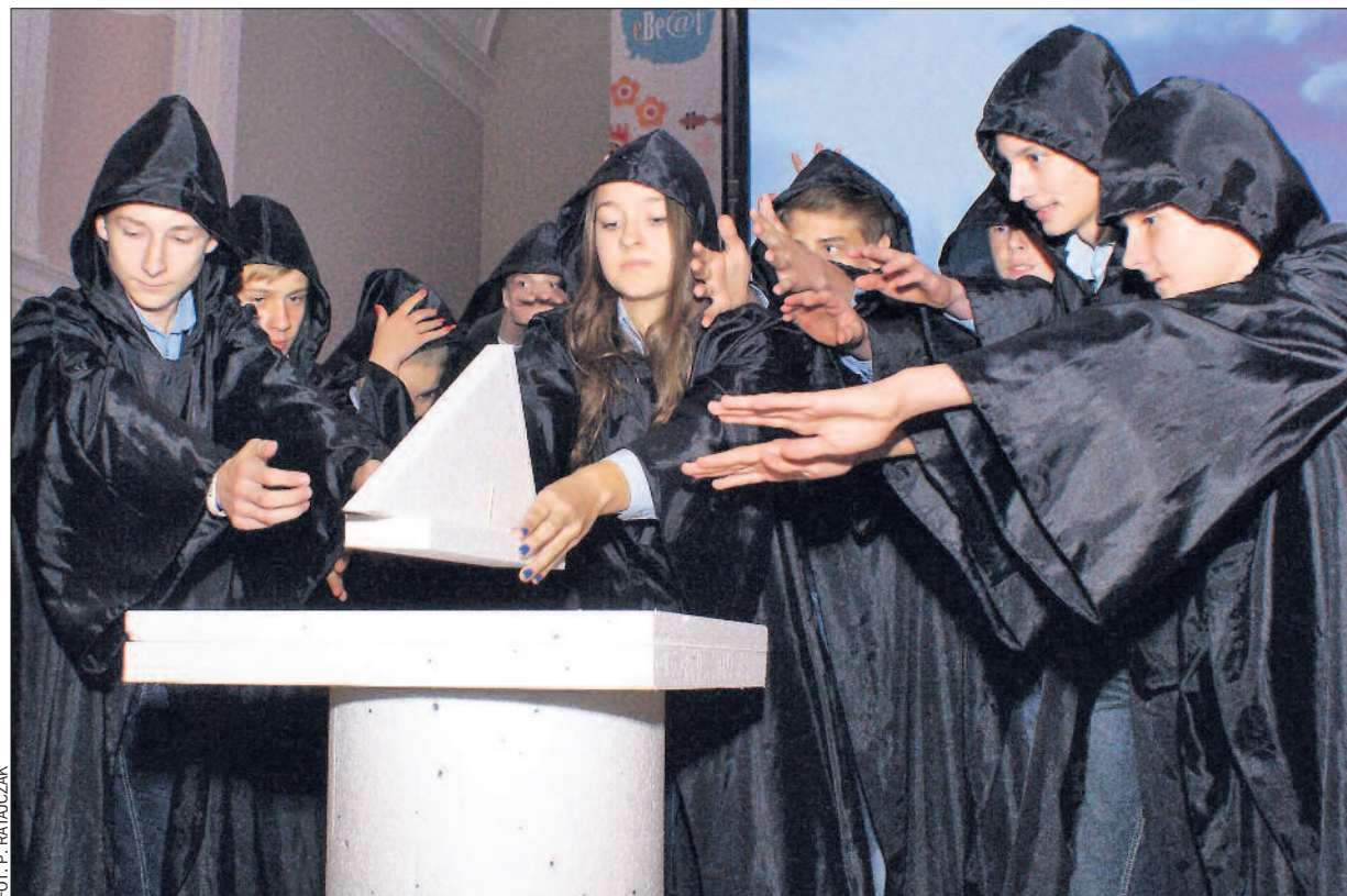
Podczas finału „eSzkoły” w Auli UAM uczniowie pokazali efekty swojej pracy. Na zdjęciu młodzież z Gimnazjum im. Mikołaja Kopernika w Golinie buduje zegar słoneczny.

Dzięki „eSzkołom” do placówek trafił nowoczesny sprzęt, m.in. tablety, tablice interaktywne i komputery. Połączono je siecią internetową, umożliwiającą np. wykłady on-line. Nauka metodą projektową pozwoliła uczniom rozwijać umiejętności komunikacji i współpracy w grupie, przyczyniła się do większego zainteresowania przedmiotami matematyczno-przyrodniczymi (ich absolwenci są obecnie poszukiwani na rynku pracy) i doprowadziła do zdobycia umiejętności praktycznych. Istotna jest też zmiana relacji nauczyciel-uczeń, bo pedagog stał się przewodnikiem, mentorem i doradcą.