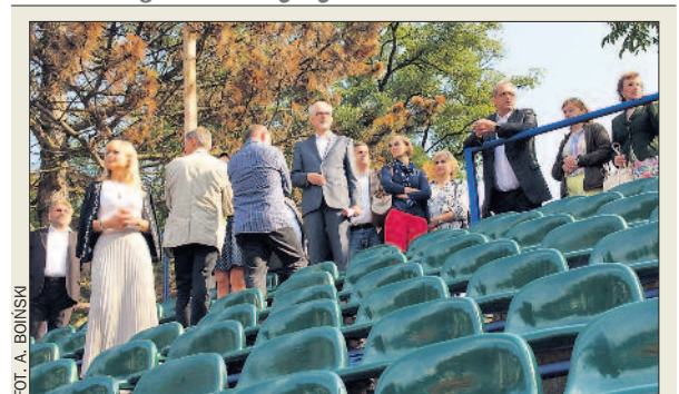
O przyszłości północno-zachodniego klina zieleni w Poznaniu – w szczególności terenów Woli, Gołęcina i Rusałki – rozmawiali 16 września na wspólnym posiedzeniu radni województwa i miasta Poznania. Samorządowcy zwiedzili obiekty sportowe na Gołęcinie (górne zdjęcie) i nieruchomości należące do Centrum Wyszkoła Jędrzejckiego Hipodrom Wola. Z kolei głównym tematem wyjazdowego posiedzenia Komisji Ochrony Środowiska i Gospodarki Wodnej w dniu 17 września było zapoznanie się z koniarską infrastrukturą służącą ochronie środowiska (dolne zdjęcie). Radni byli m.in. w Oczyszczalni Lewy Brzeg w Koninie oraz na placu budowy spalarni odpadów. ABO