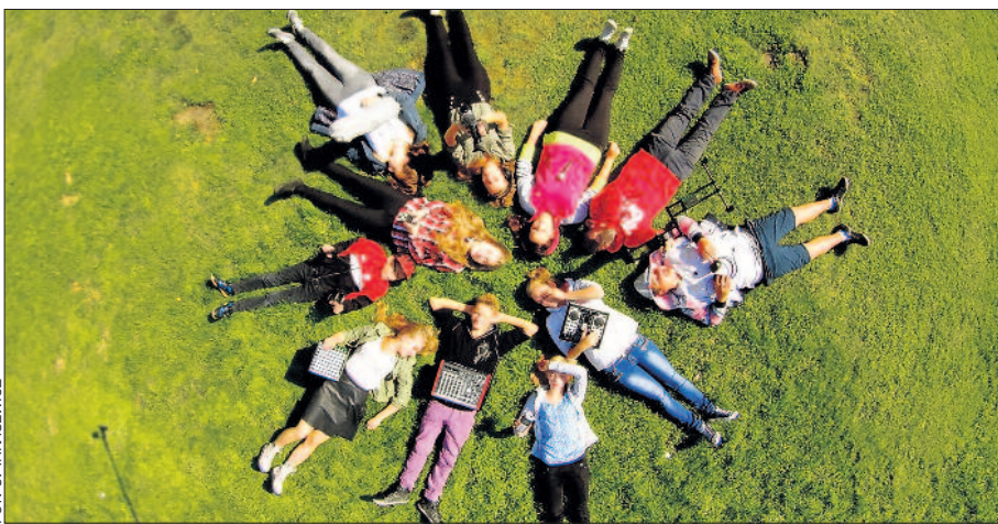
Projekt „My, dzieci z projektu Ziemia” w Prusimiu został przygotowany we współpracy z młodzieżą z pobliskich szkół.