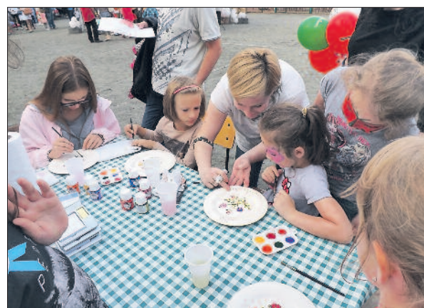
Dzieci polubiły zwłaszcza warsztaty ręcznego malowania na porcelanie.