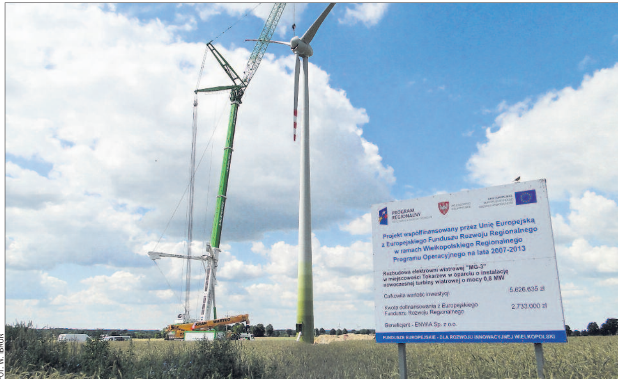
Mimo braku ustawy o OZE, wielu inwestorów stawia kolejne elektrownie wiatrowe. Na zdjęciu montaż wiatraka o mocy 0,8 MW w miejscowości Tokarzew w Wielkopolsce.