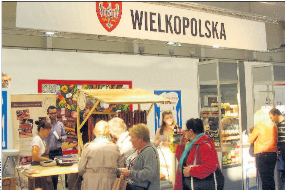
Smaki dzieciństwa, o których mówił prezydent Komorowski, można sobie było przypomnieć także na wielkopolskim stoisku.

Regionalne potrawy królowały w Poznaniu na przełomie września i października.