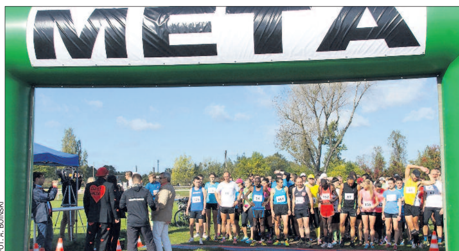
Uczestnicy biegu na 5 kilometrów tuż przed startem.

Przykładem aktywnie dbających o zdrowie i kondycję mogą być ci, którzy wzięli udział w kilku zorganizowanych w ramach festynu biegach, w tym w głównym na dystansie 5 kilometrów. Dla innych magnesem przyciągającym na Wolę była możliwość skorzystania z bezpłatnych badań profilaktycznych i porad lekarskich, dotyczą-