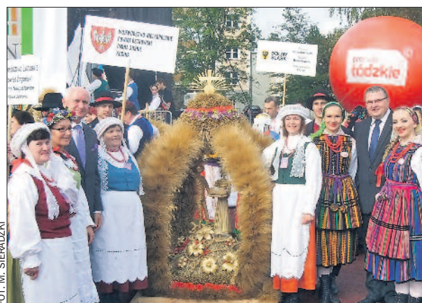
Wielkopolska zdobyła drugie miejsce w konkursie na „Najładniejszy wieniec dożynekowy”.

Po raz kolejny okazało się, że prezentacja województwa wielkopolskiego wzbudziła w Spale ogromne zainteresowanie, zarówno wśród dożynekowych gości, jak i mieszkańców regionu łódzkiego.