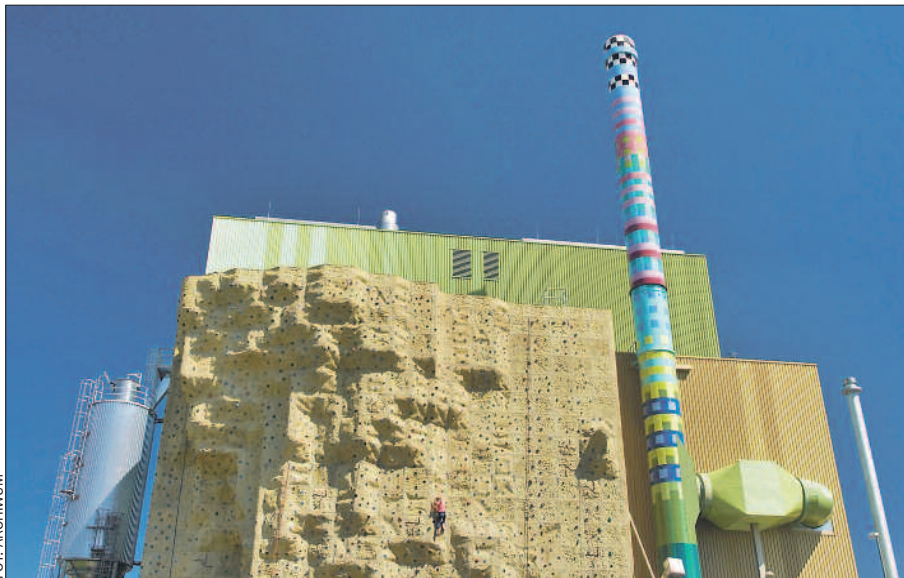
Elektrownia na biomasę w Flörsheim koło Frankfurtu nad Menem, z widoczną na pierwszym planie ścianką wspinaczkową, stanowi element parku energetycznego House of Clean Energy i przykład integracji projektu środowiskowego z funkcjami rekreacyjnymi.

Także heskie rozwiązania instytucjonalne w tym zakresie warte są podpatrzania. Funkcjonuje tam wiele instytucji badawczych zajmujących się technologiami środowiskowymi. Współpraca pomiędzy gospodarką i nauką sprawia, że nowe technologie, te-