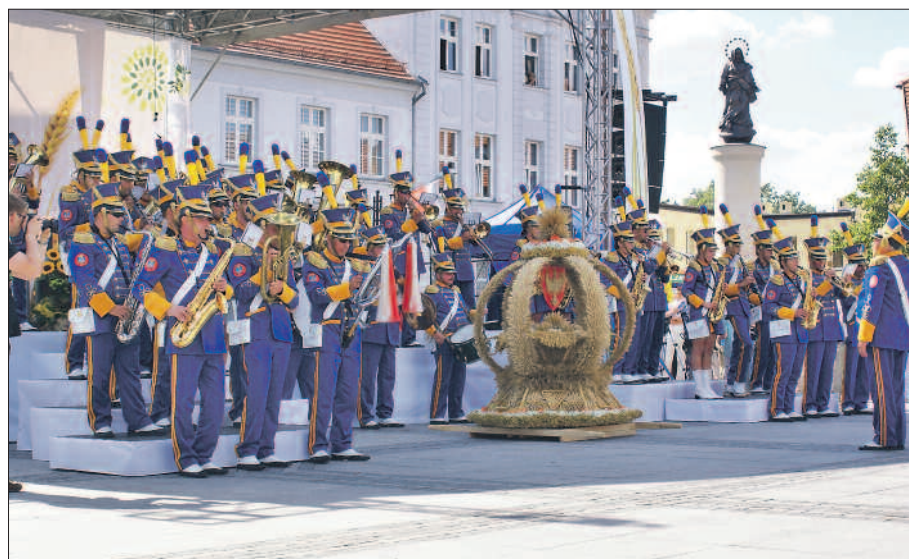
Przy wojewódzkim dożynkowym wieniec zagrała orkiestra dęta Ochotniczej Straży Pożarnej w Środzie Wielkopolskiej.