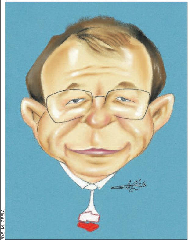
RYS. M. GRELA