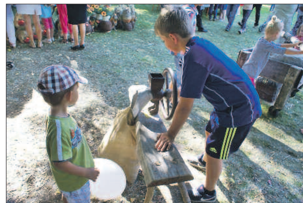
Organizatorzy wystawy sprzętu rolniczego przygotowali też liczne atrakcje dla najmłodszych.