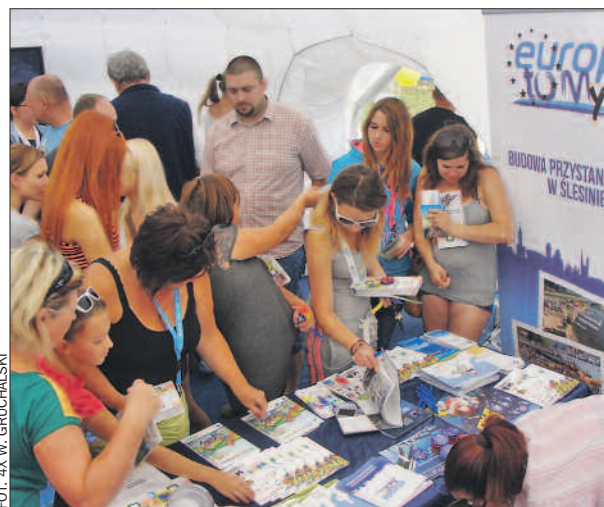
Punkt Informacyjny Funduszy Europejskich odwiedziło kilkaset osób.

W samo południe na plaży przy przystani w Ślesinie otwarto miasteczko, w którym swe stoiska miały m.in. miejscowości będące finalistami konkursu. W namiocie głównym na stoisku Ministerstwa Rozwoju Regionalnego i kornickiego Punktu Informacyjnego Funduszy Europejskich udzielano darmowych konsultacji na temat aktualnych możliwości sięgania po środki unijne. Organizowano mnóstwo konkursów z nagrodami. Dużym zainteresowaniem cieszyło się układanie megapuz-