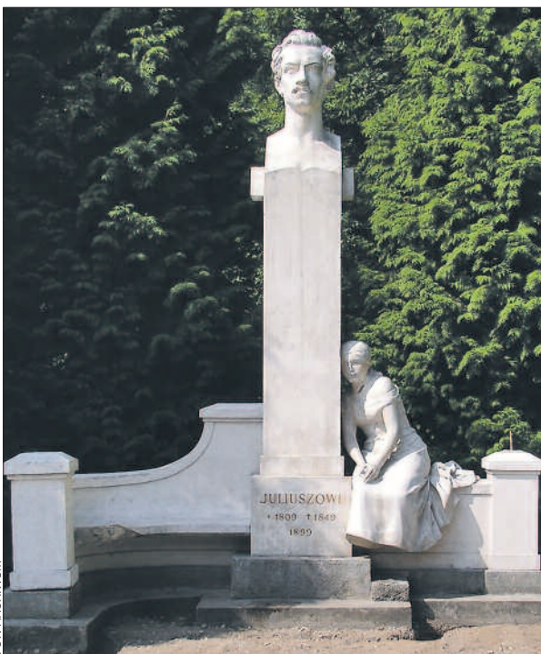
„Trzeba ten pomnik oglądać wieczorem, na tle dębów i świerków, przy oświetleniu księżycy, w uroczystym ustroju miłosławskiego parku...”.

Autorem pomnika został wybitny rzeźbiarz wielkopolski Władysław Marcinkowski, który potem wspominał: „Trzeba ten pomnik oglądać wieczorem, na tle dębów i świerków, przy oświetleniu księżycy, w uroczystym ustroju miłosławskiego parku, aby się przekonać, że go owie-