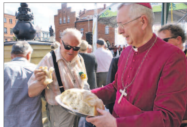
Dożynkowym chlebem dzielił się z uczestnikami uroczystości m.in. abp Stanisław Gądecki.

W dożynkowych uroczystościach wzięli udział m.in. przedstawiciele Kancelarii Prezydenta RP, Ministerstwa Rolnictwa i Rozwoju Wsi, wielkopolscy parlamentarzyści, wojewoda oraz samorządowcy z regionu, w tym m.in. radni sejmiku. RAK