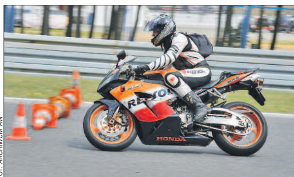
Po części teoretycznej motocykliści przystąpili do zajęć praktycznych.

Motocykliści to tzw. niechronieni uczestnicy ruchu drogowego. To, co dla samochodu kończy się stłuczką lub niegroźną kolizją, w przypadku motocykla staje się poważ-