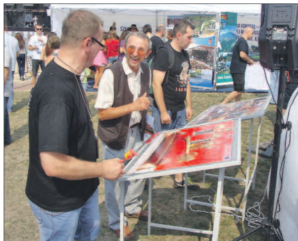
Dużym zainteresowaniem cieszyło się układanie megapuzli.

zli przedstawiających wybrane projekty zrealizowane przy wsparciu z pieniędzy pochodzących z Wielkopolskiego Re-