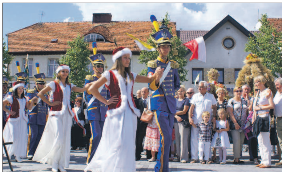
Polonez zatańczony na średzkim rynku spodobał się licznie zgromadzonym mieszkańcom miasta i zaproszonym gościom.