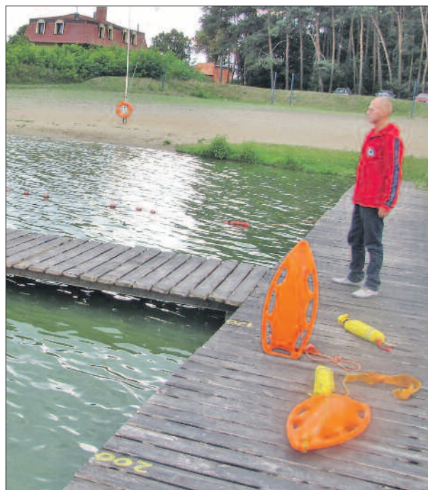
Praca ratownika WOPR na kąpielisku jest szansą na dodatkowe, choć sezonowe zatrudnienie.