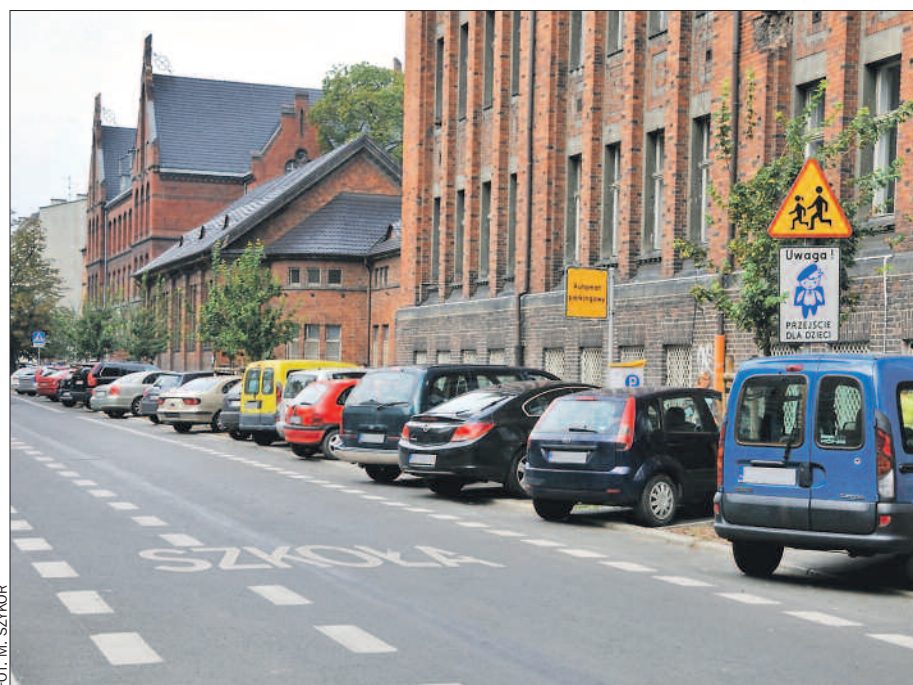
Zadbajmy o bezpieczeństwo uczniów szkół zlokalizowanych przy ruchliwych ulicach.

Duży wpływ na porządek i bezpieczeństwo uczestników ruchu ma również infrastruktura drogowa, dlatego sprawdzano m.in. oznakowanie drogowe (pionowe i poziome), stan techniczny urządzeń bezpieczeństwa ruchu, w tym barier