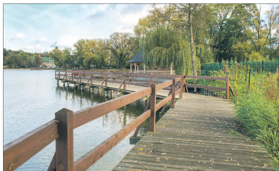
Szlak Żurawi w Wolsztynie jest jednym z projektów dofinansowanych z pieniędzy Wielkopolskiego Regionalnego Programu Operacyjnego.