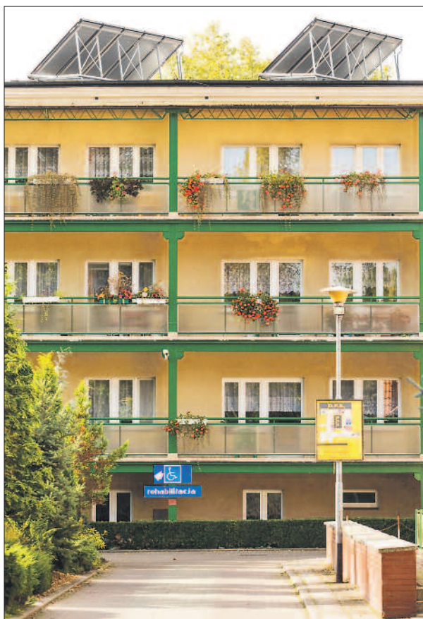
Systemy solarne wzmacniają sektor odnawialnych źródeł energii i poprawiają efektywność energetyczną obiektów. Na zdjęciu DPS w Kole.

P jak programy operacyjne – pomoc finansowa Unii Europejskiej jest prowadzona poprzez programy operacyjne. WFOŚiGW w Poznaniu, poza finansowaniem ze środków krajowych („krajówka”), obsługuje też niektóre programy operacyjne. Fundusz jest instytucją wdrażającą dla priorytetów I (gospodarka wodno-ściekowa) i II (gospodarka odpadami) Programu Operacyjnego Infrastruktura i Środowisko (POIiŚ), dla projektów do 25 mln euro (powyżej 25 mln euro są obsługiwane przez NFOŚiGW) oraz instytucją pośredniczącą dla priorytetu III Środowisko przyrodnicze Wielkopolskiego Regionalnego Programu Operacyjnego.