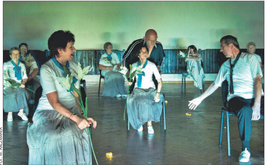
W przedstawieniu w Zakrzewie obok amatorów wystąpił też aktor Adam Ferency.

Teatr Wielki w Poznaniu intensywnie przygotowuje się do październikowej premiery „Parsifala” Wagnera. Opera z regularnymi spektaklami ze swojego repertuaru rusza natomiast 21 września.