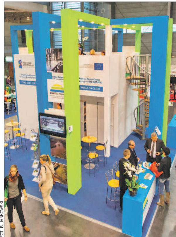
Stoisko WFOŚiGW podczas ubiegłorocznych targów POLEKO cieszyło się sporym zainteresowaniem.

Co roku WFOŚiGW w Poznaniu uczestniczy w Międzynarodowych Targach Ekologicznych POLEKO . Tym razem będą odbywać się one miesiąc wcześniej, w dniach 7-10 października.