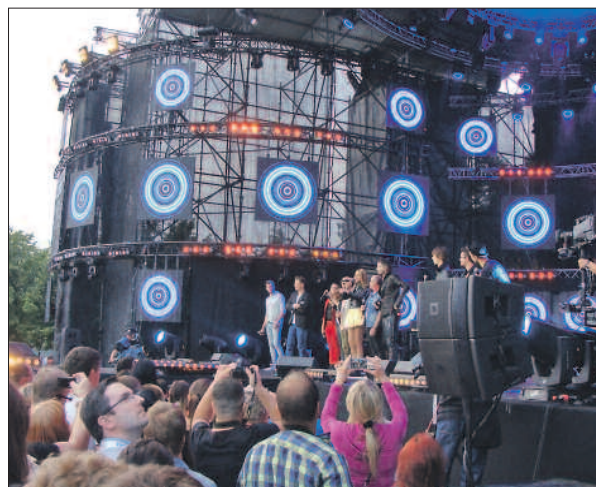
Koncert gwiazd polskiej sceny trwał aż trzy godziny.