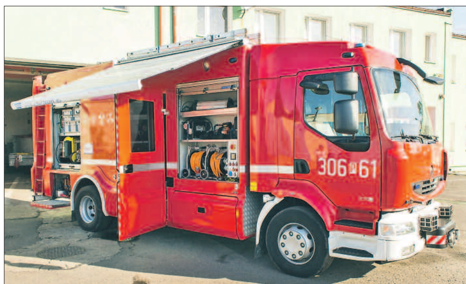
Straż pożarna (na zdjęciu mobilne laboratorium) często realizuje zadania z zakresu ochrony chemicznej i przeciwdziałania nadzwyczajnym zagrożeniom środowiska.

M jak monitoring – każde przedsięwzięcie współfinansowane ze środków WFOŚiGW jest