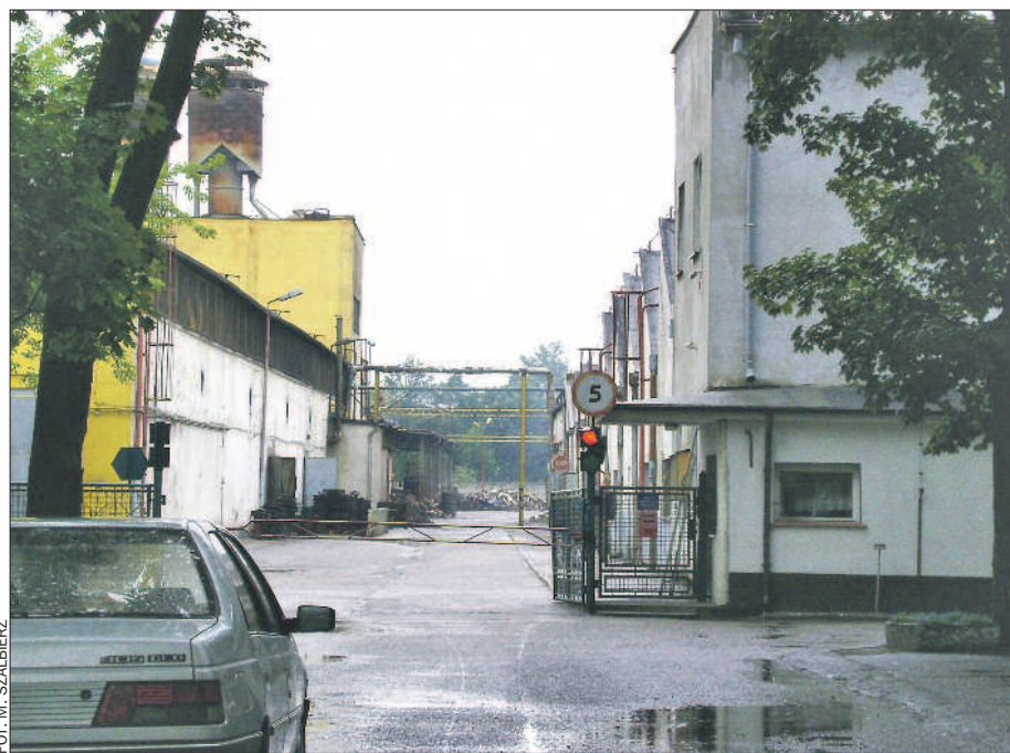
Tych budynków odlewni Gemar-Umech, która zatrudniała 135 osób, już nie ma. W przyszłym roku powstanie tu Galeria „Piła”.