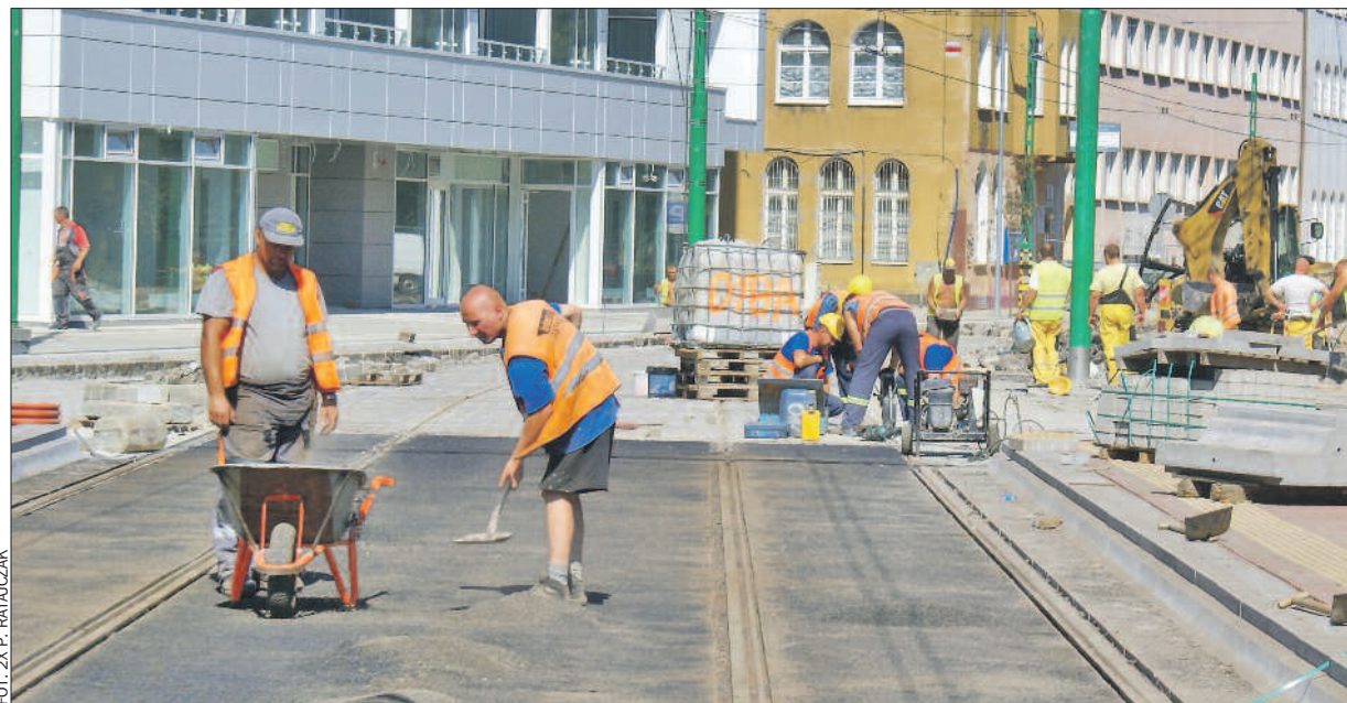
Przy łagodnej ziemi sezon budowlany może trwać niemal cały rok, ale najwięcej pracy w branży budowlanej jest w okresie od wiosny do jesieni.

W urzędach pracy w całym kraju pod koniec czerwca zarejestrowanych było 2,1 mln osób bezrobotnych. A jak wygląda ich sytuacja w Wielkopolsce? Z danych WUP wynika, że na koniec lipca w regionie zarejestrowanych było 143.450 osób bezrobotnych, tj. o 8 proc. więcej niż przed rokiem. Wskaźnik stopy bezrobocia dla Wielkopolski wyniósł 9,6 proc. i jest to najniższy poziom w regionach. Najwyższy wskaźnik, ponad 20 proc., zanotowano w województwie warmińsko-mazurskim.