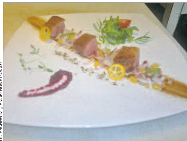
Salatka z kaczki z cykorią i orzechami przyrządzana w „Tamarynowej Osadzie”.