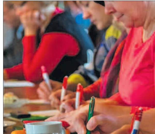
Uczestniczkę warsztatów w gospodarstwie agroturystycznym „Zacisze” w miejscowości Siemno.

Każdy z organizowanych dotychczas warsztatów podzielony był na cztery części. Ich uczestnicy otrzymali informa-