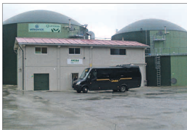
Biogazownia rolnicza firmy Biogaz Zeneris Sp.z o.o w Skrzatuszu.