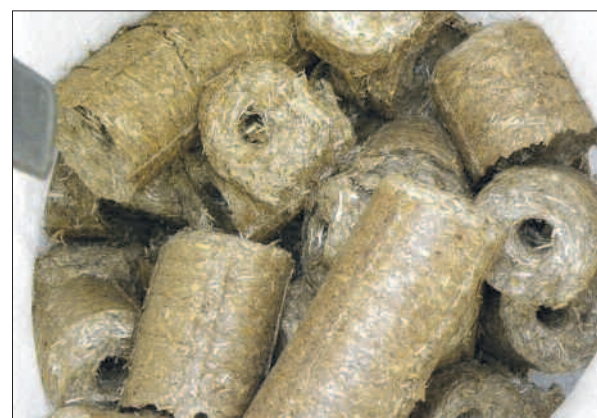
Brykiety materiał opałowy ze sprasowanych pod wysokim ciśnieniem odpadów roślinnych (np. słomy, biomasy trawiastej).