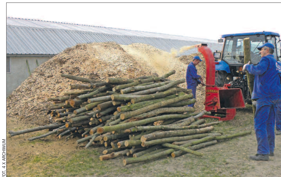
Produkcja trocin – jednej z form biomasy.

Z kolei w odniesieniu do słomy okazało się, że przekonanie o nadmiarze tego surowca w Wielkopolsce jest niejednokrotnie błędne. Ilość pozyskiwanej słomy uzależniona jest od wielkości arealu uprawy, uzyskanych plonów oraz gatunku rośliny. Dużą rolę odgrywają również warunki atmosferyczne. Przyjmując, że w rolnictwie wykorzystuje się 25 proc. pozyskiwanej słomy, oznacza to, że ilość słomy, która bez negatywnego wpływu na produkcję rolniczą może być przeznaczana na cele energetyczne, zmienia się w czasie. Z przeprowadzonych przez ITP kalkulacji wynika, że są lata, w których występuje nadwyżka słomy do energetycznego wykorzystania w ilości około 350 tys. ton, ale są też i takie, w których jej nie ma, a nawet może brakować w rolnictwie.