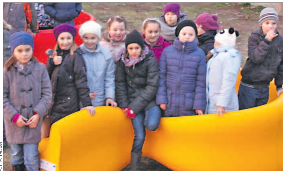
Meble WRPO stanęły na deptaku przy ul. Śródmiejskiej w Pile i na terenie kompleksu rekreacyjno-sportowego Piaski-Szczygliczka w Ostrowie Wlkp. (na zdjęciu).

– Nadeszło łącznie 6 zgłoszeń, które oceniano w oparciu o kilka kryteriów: reprezentacyjność i estetyka lokalizacji, powierzchnia miejsca i monitoring – powiedział Leszek Wojtasiak, przewodniczący kapituły konkursu. – W wyniku głosowania kapituły maksymalną liczbę punktów i meble