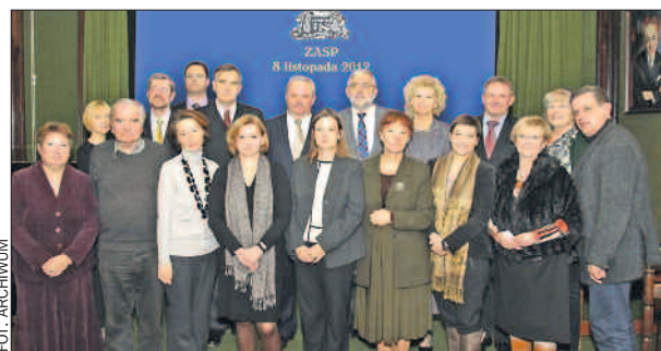
Uczestnicy warszawskiego posiedzenia.

Czy powstanie elektroniczna baza danych instytucji kultury prowadzonych przez samorządy?