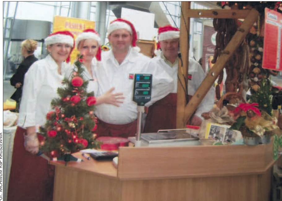
Jak są święta, musi być święty Mikołaj (a jeśli o wielkopolskich tradycjach mowa – to Gwiazdor), ale muszą też być tradycyjne wędliny.