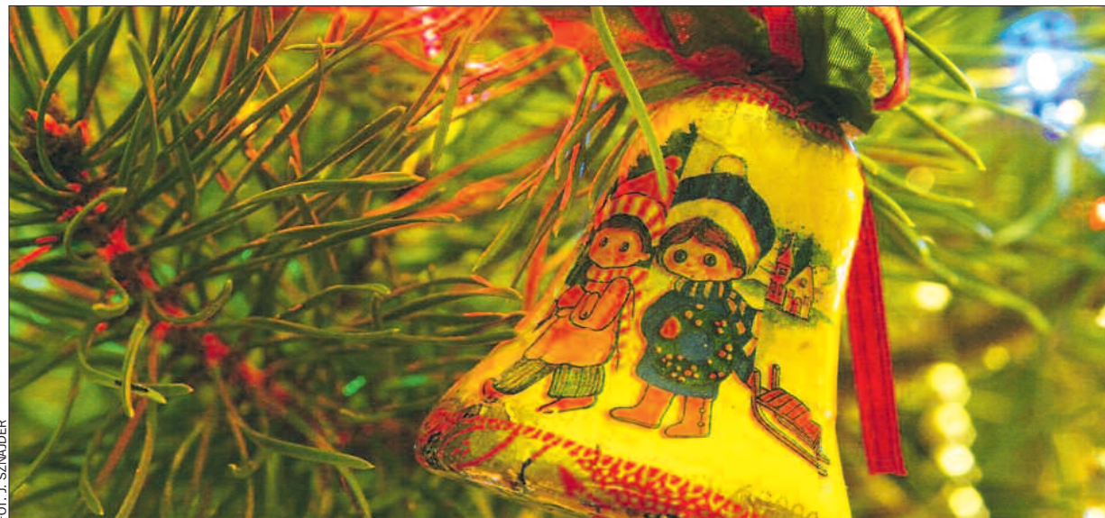
Choinkowe ozdoby i żywiczne zapachy to nieodłączne atrybuty grudniowych świąt.

A co, zgodnie z tradycją powinno pojawić się na wigilijnym stole?