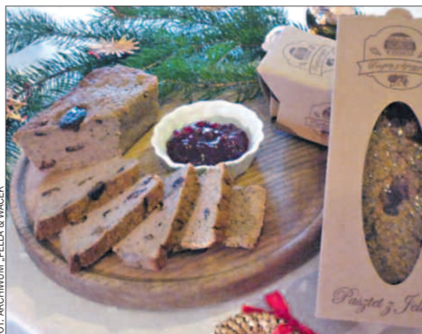
Paszty z pensjonatu „Pella & Wacek” w Borui.