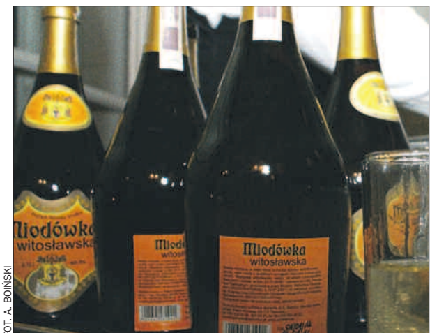
Staropolska miodówka z Witosławia.