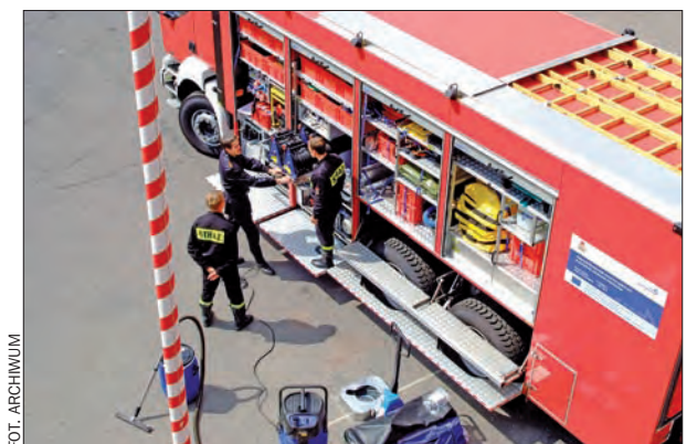
Komenda Wojewódzka Państwowej Straży Pożarnej buduje system bezpieczeństwa środowiskowego i ekologicznego.

Rezerwaty Archeologiczne dot. Początków Państwa Polskiego