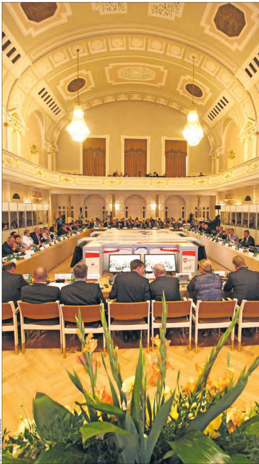
Przez dwa dni Aula Uniwersytecka spełniała nietypową dla siebie funkcję – wielkiej sali konferencyjnej, otoczonej kilkunastoma kabinami dla tłumaczy.

Ugoszczenie polityków i samorządowców z około dwudziestu europejskich krajów miało niewątpliwie walor promocyjny dla miasta i regionu. Wyjazdowe posiedzenia prezydium KR odbywają się dwa razy w roku (zazwyczaj w kraju sprawującym unijną prezydencję), a spotkania CORLEAP mają odbywać się raz w roku. – Wielkopolska wysoko zawiesiła poprzeczkę dla organizatorów kolejnych spotkań – można było usłyszeć w kulisach Auli Uniwersyteckiej pochwały od gości z zagranicy. >> strony 8-9