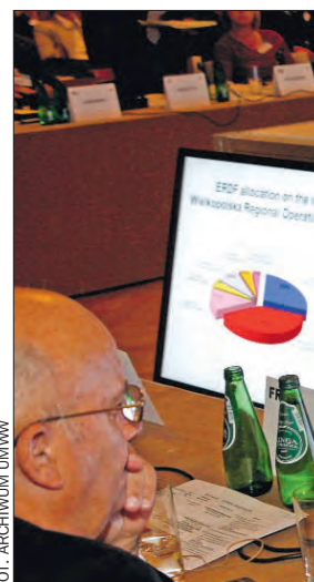
Przykład WRPO posłużył do pokazania pozytywnych efektów polityki spójności.

– Większość państw powinna poprzeć wizję przedsta-