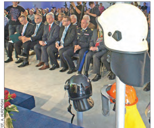
Kaliska firma miała wiele powodów, by hucznie świętować swoje 60-lecie.

– Stabilizacja właścicielska umożliwiła dokonanie transformacji zakładu z niewielkiej manufaktury z aspiracjami w liczącego się gracza