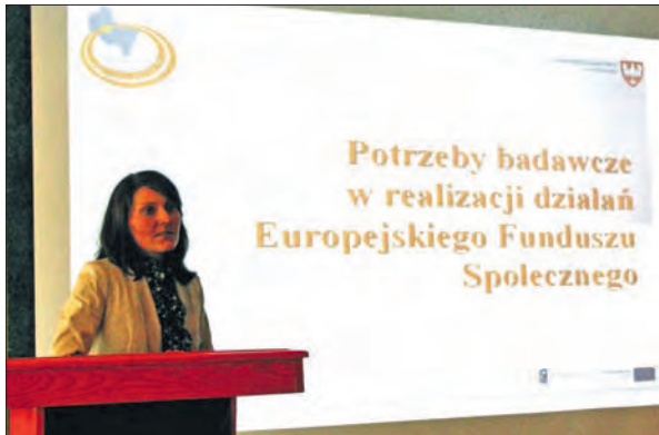
Seminarium na temat potrzeb informacyjnych podmiotów rynku pracy zorganizowane przez WUP w Poznaniu.

Pozyskane dane pozwoliły na wskazanie potencjalnych obszarów badawczych. Są to: analiza stanu najważniejszych branż w regionie; możliwości wsparcia oraz szanse i bariery rozwoju przedsiębiorczości w województwie; plany inwestycyjne; losy absolwentów szkół; kompetencje pracowników na rynku pracy (strona popytowa i podaży). Ponadto badanie zidentyfikowało pewne aspekty, niezbędne do uwzględnienia w zarządzaniu informacją o rynku pracy, jak zapotrzebowanie na cyklicznie i systematycznie prowadzone analizy czy postrzeganie przez badanych internetu jako najbardziej korzystnego sposobu