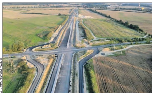
Zimą skończy się budowa obwodnicy Murowanej Gośliny.