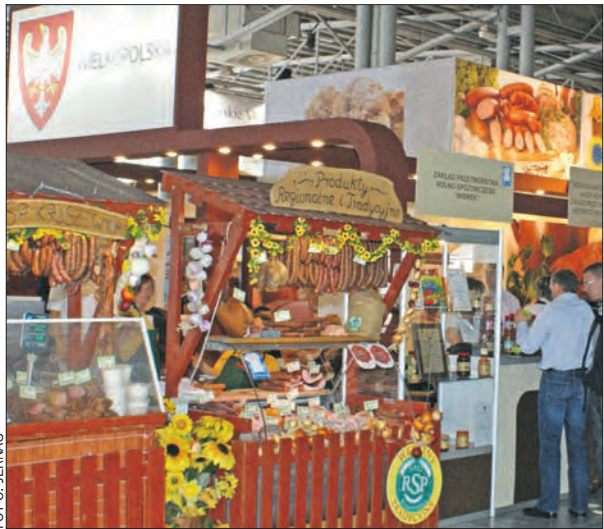
Wielkopolskie stoisko z wyrobami tradycyjnymi podczas towarzyszącej targom „Polagra” wystawy „Smaki Regionów”.

Władze regionu wspierają promocję tradycyjnej i ekologicznej żywności.