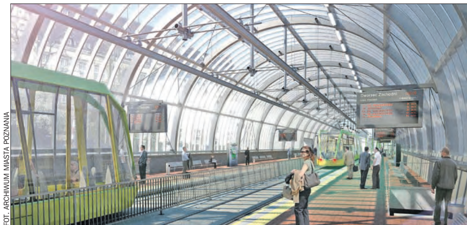
Za rok poznańską „Pestką” dojedziemy na 7. peron Dworca Głównego.

Infografika na stronie 13 „Monitora” pokazuje 33 kluczowe zadania, które otrzymają ponad 1,3 mld zł unijnych dotacji. Trzy z nich to tzw. duże projekty, wymagające akceptacji Komisji Europejskiej. Zgodę uzyskała już budowa trasy tramwajowej os. Lecha – Franowo (inwestycja za 269 mln zł i 108 mln zł dotacji UE). Na „zielone światło” z Brukseli czekają jeszcze: zakup 22 nowoczesnych pociągów (najdroższe zadanie – ponad 470 mln zł i 162 mln zł z Unii) oraz budowa szerokopasmowej sieci internetu.