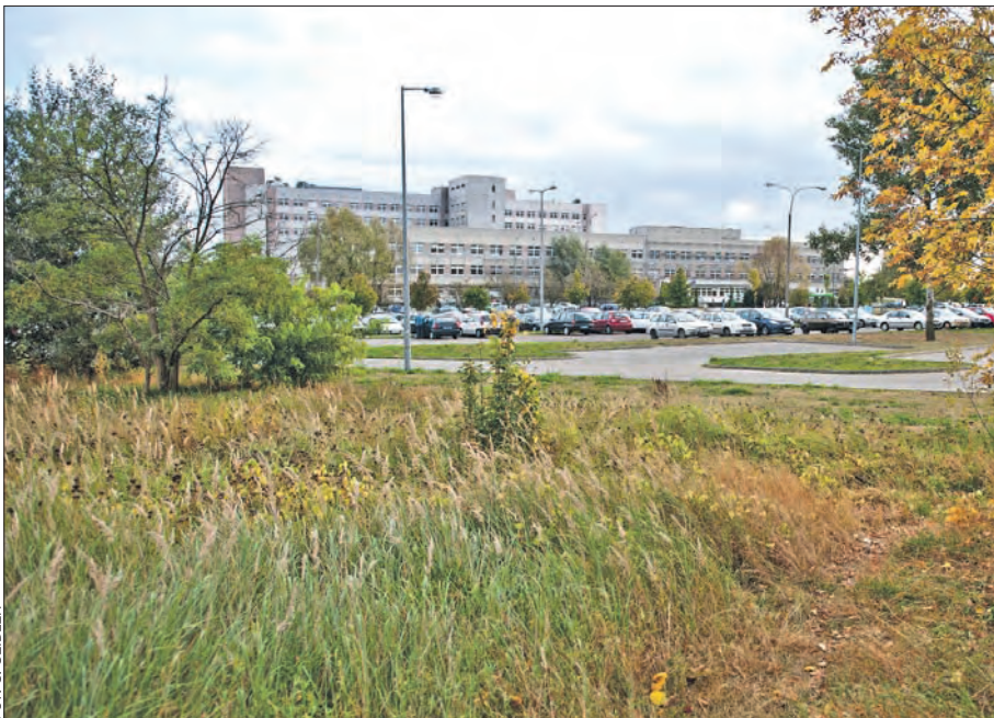
Radni wojewódzcy i miejscy są zgodni, że ul. Szwajcarska to dobre miejsce dla lokalizacji szpitala matki i dziecka.

Zarząd województwa planował początkowo, po ustaleniu z władzami miasta, budowę lecznicy dla dzieci przy frontowej ścianie szpitala przy ulicy Szwajcarskiej. Brano też pod uwagę lokalizację po drugiej stronie budynku. Zasadniczym argumentem była perspektywa obniżenia kosztów działalności dzięki możliwości zintegrowania niektórych usług okołoszpitalnych obu placówek. Na początku tego roku zaczęto rozważać także ewentualną lokalizację szpitala w rejonie ulic Koszalińskiej i Lutyckiej.