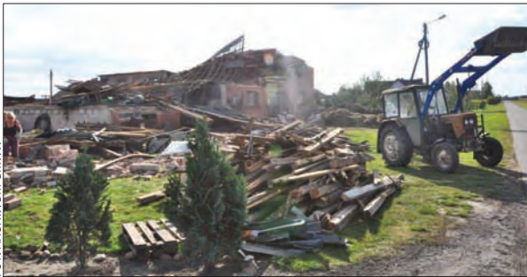
Zniszczone zabudowania gospodarcze w Blizanowie.

W gminie Blizanów 14 września wojewoda Piotr Florek zorganizował posiedzenie Wo-