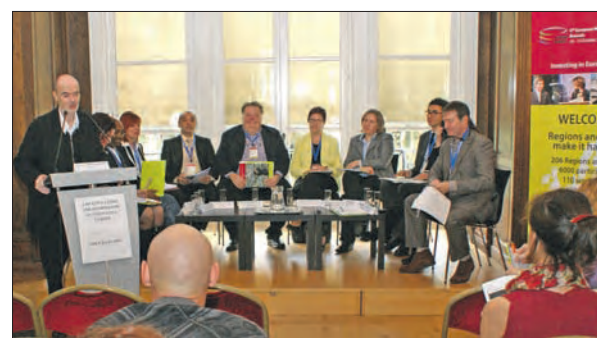
W trakcie warsztatu zorganizowanego w Biurze Informacyjnym Województwa Wielkopolskiego dyskutowali przedstawiciele dziesięciu regionów i Komisji Europejskiej.

W wydarzeniach OPEN DAYS, odbywających się równoległe z sesją Komitetu Regionów, uczestniczył marsza-