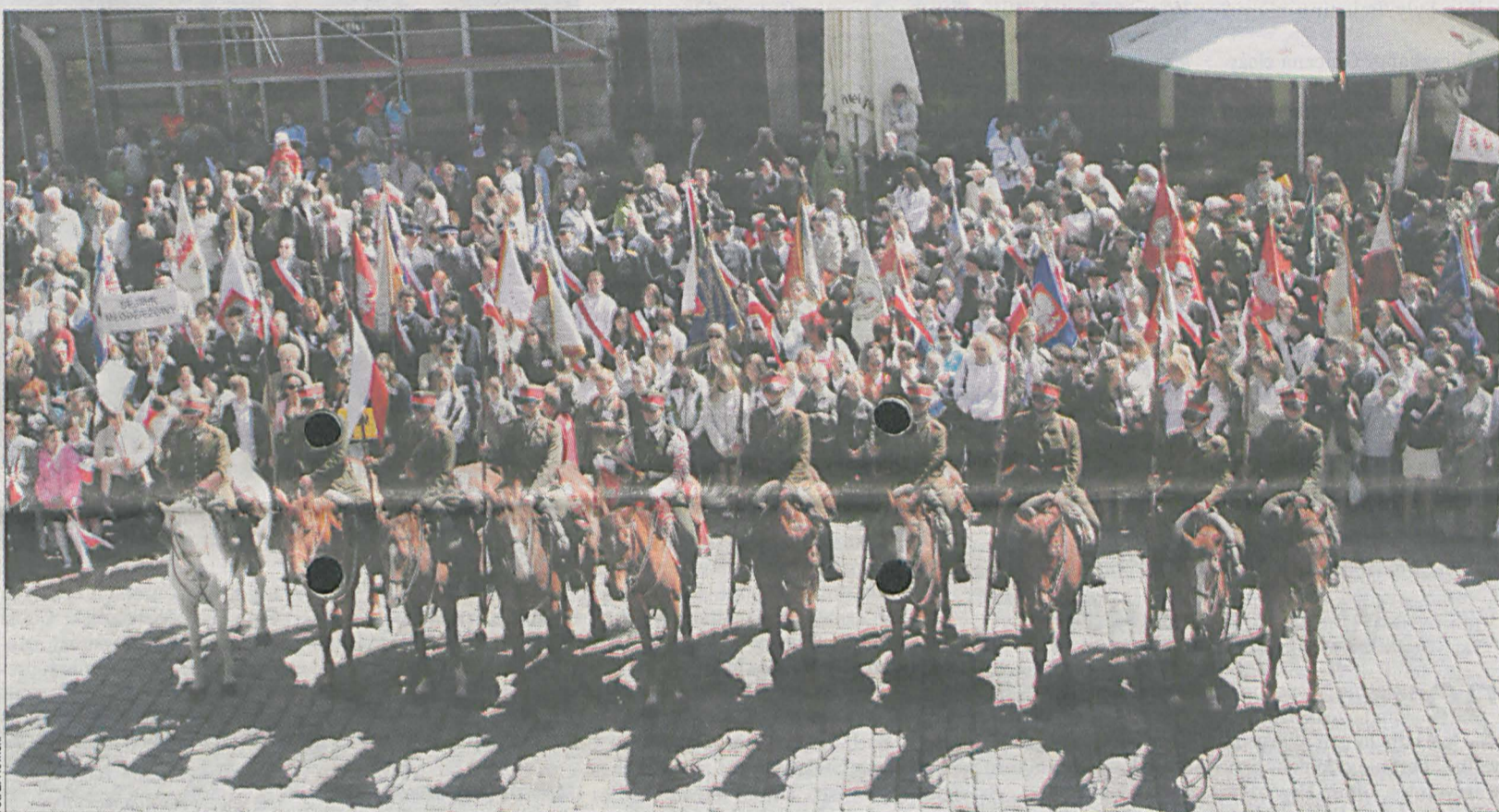
Obchody Święta Konstytucji 3 Maja na Starym Rynku w Poznaniu.

Po uroczystościach na Starym Rynku delegacje władz