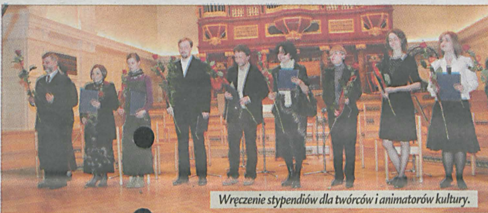
Wręczenie stypendiów dla twórców i animatorów kultury.

Chór Męski „Arion” w Poznaniu – działający nieprzerwanie od roku 1912 zespół wokalny, będący jedną z ważniej-