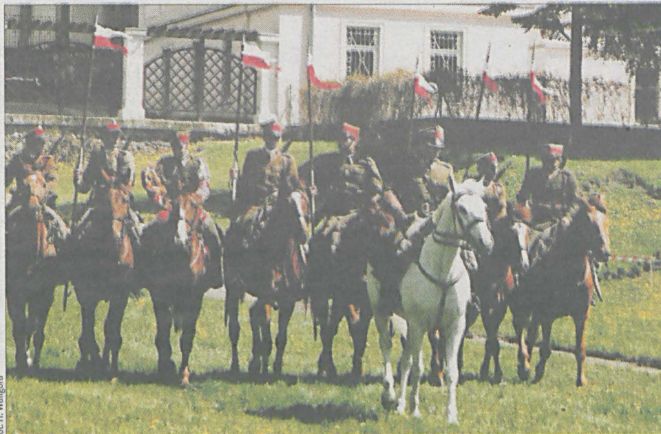
Asysta konna z Ochotniczego Reprezentacyjnego Oddziału Ułanów Miasta Poznania w barwach 15 Pułku Ułanów Poznańskich przed uroczystościami w Miłosławiu.

Intencją organizatorów jest to, aby w przyszłym roku, w 160 rocznicę omawianych wydarzeń, Miłosław stał się centralnym miejscem obchodów rocznicowych Wielkopolskiej Wiosny Ludów 1848 roku.