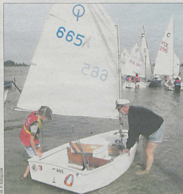
W Wielkopolsce są dobre warunki do uprawiania żeglarstwa. Na zdjęciu przystań żeglarska i łódki nad Jeziorem Rogozińskim.

To jeden z najstarszych klubów sportowych w Wielkopolsce, a jego reprezentanci mają na koncie wiele sukcesów międzynarodowych.