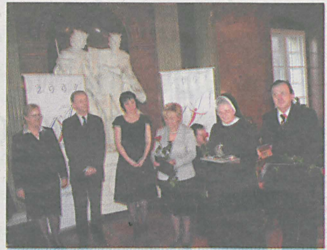
W kategorii Pracodawca Nieprzedsiębiorca nagrodę otrzymał Ośrodek Wychowawczo-Specjalny „Nasz Dom” z Gębic