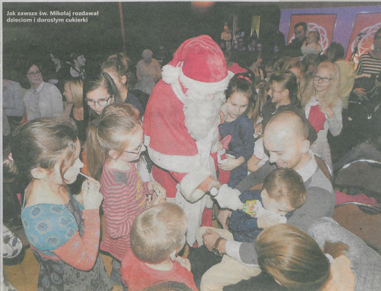
Jak zawsze św. Mikołaj rozdawał dzieciom i dorosłym cukierki