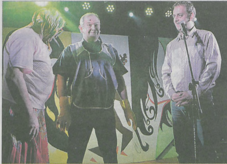
Kabaret EWG rozbawił publiczność