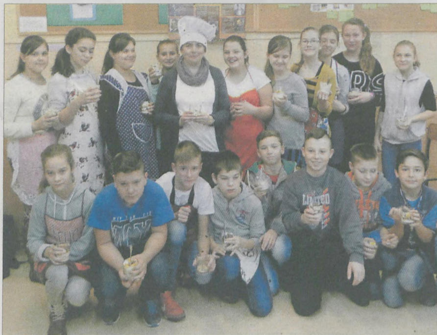
Zdrowe śniadanie przygotowali min. uczniów klasy VI