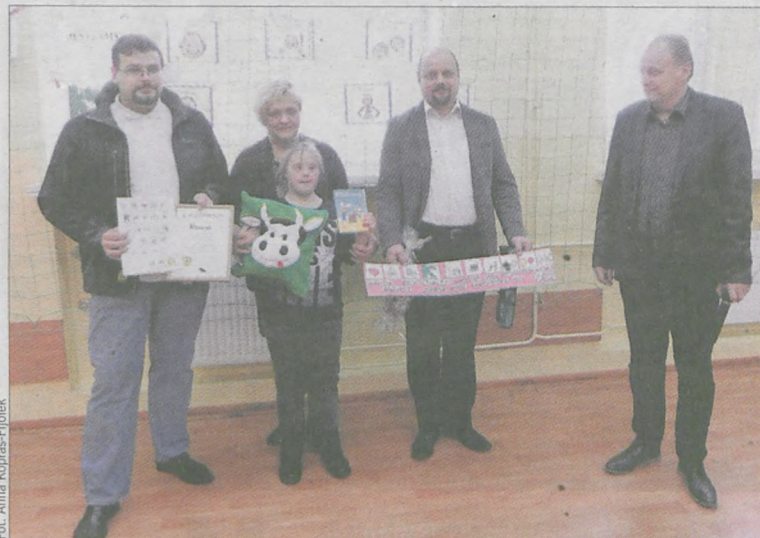
Przedstawicielom firmy „Konrad” wręczono poduszkę wykonaną ręcznie przez mamę jednego z uczniów z naszytą krową, która znajduje się w logo przedsiębiorstwa