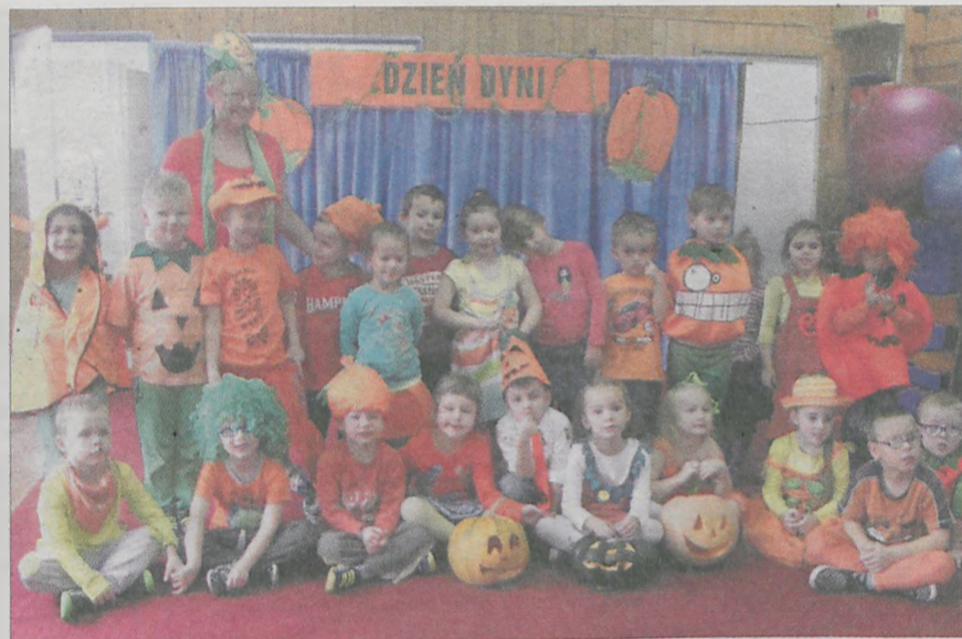
Nie mogło zabraknąć wspólnego zdjęcia z dyniami