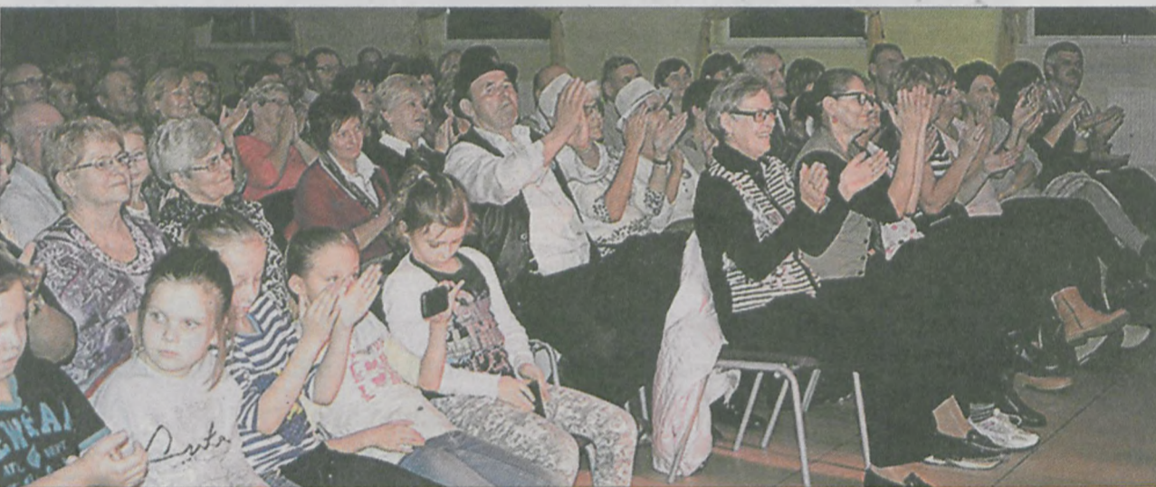
Widzowie wielokrotnie oklaskiwali artystów