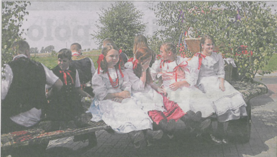
W przeddzień dożynek członkowie zespołu „Sławoszewiacy” rozwoził chlebki

Sławoszew po Twardowie był drugą miejscowością gminy Kotlin, w której odbyły się dożynki wiejskie.