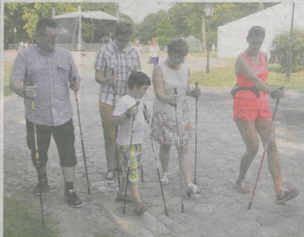
Każdy mógł sprawdzić swoją formę pod okiem trenerów i instruktorów