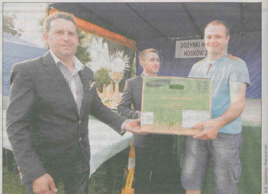
Zwycięzca loterii fantowej odbiera kuchenkę mikrofalową - główną nagrodę