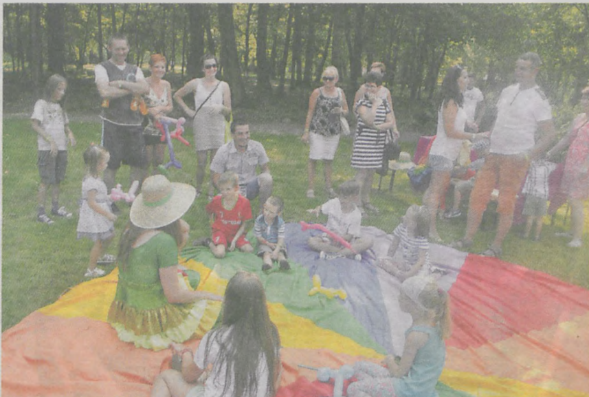
Najmłodszy, dzięki licznym zajęciom prowadzonym przez animatorów, nie mogli narzekać na nudę