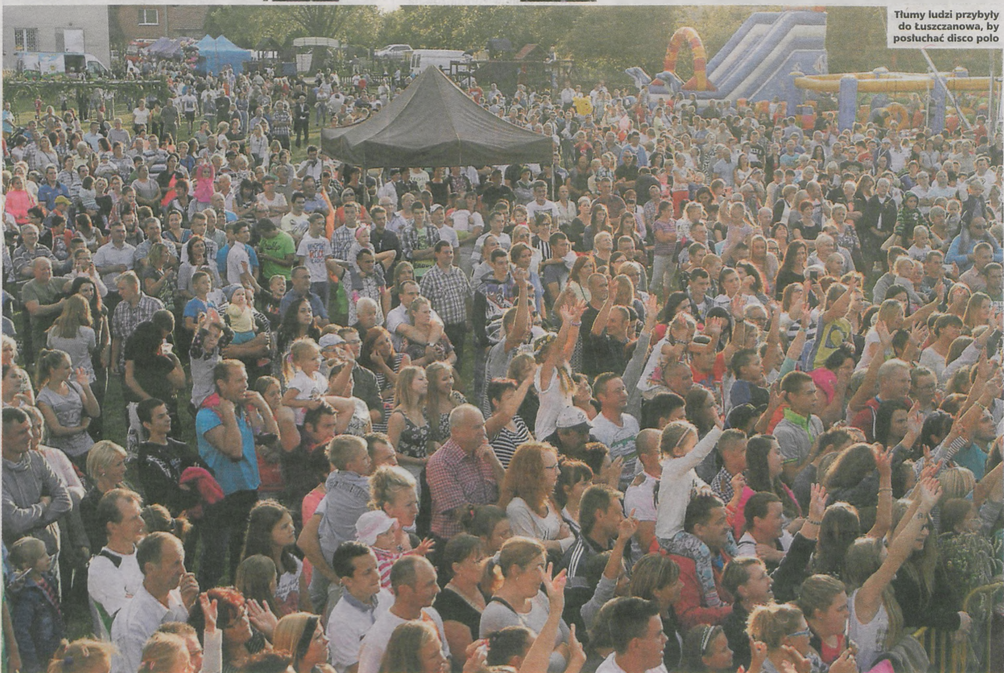
Tłumy ludzi przybyły do Łuszczanowa, by posłuchać disco polo