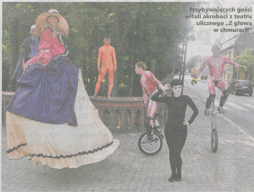
Przybywających gości witali akrobaci z teatru ulicznego „Z głową w chmurach”