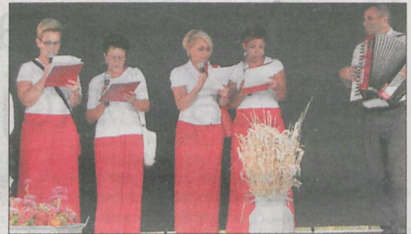
Nie brakowało tradycyjnych przyśpiewek dożynkowych