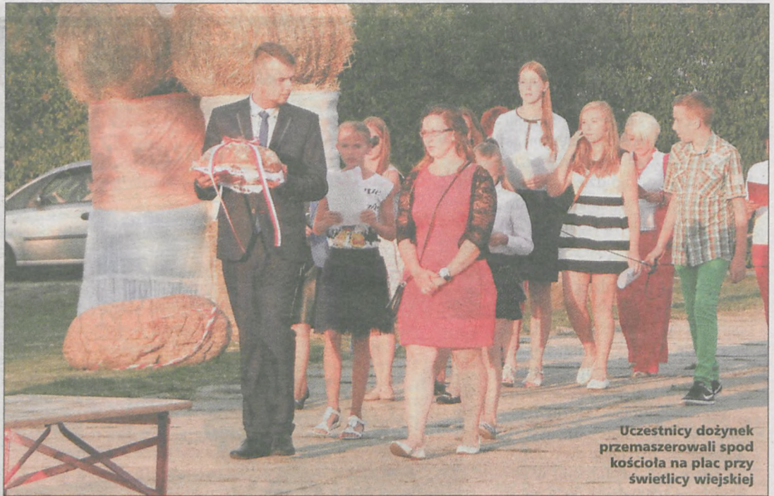
Uczestnicy dożynek przemaszerowali spod kościółka na plac przy świetlicy wiejskiej