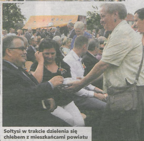
Sołtysi w trakcie dzielenia się chlebem z mieszkańcami powiatu