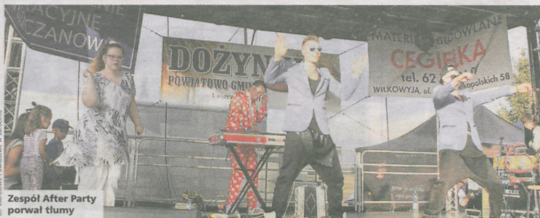
Zespół After Party porwał tłumy