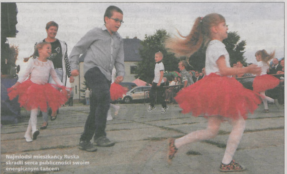
Najmłodszy mieszkańcy Ruska skradli serca publiczności swoim energicznym tańcem