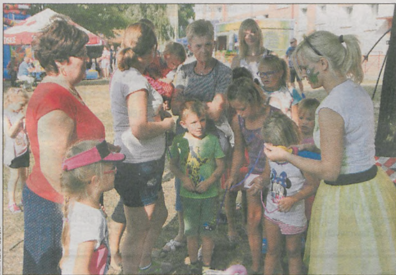
Fot. Karol Górecki