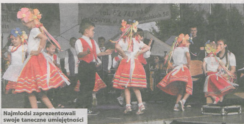
Najmłodzi zaprezentowali swoje taneczne umiejętności