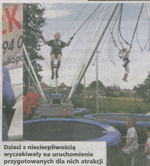
Dzieci z niecierpliwością wyczekiwały na uruchomienie przygotowanych dla nich atrakcji