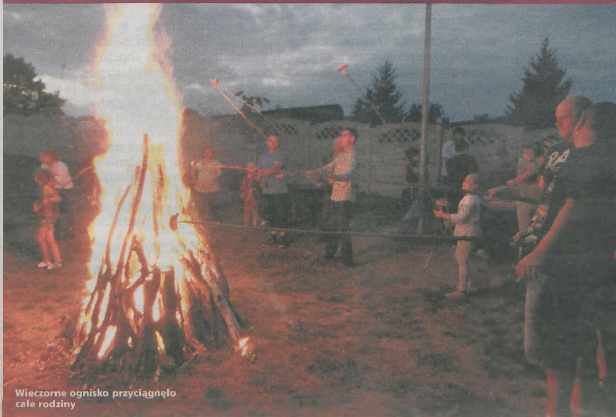
Wieczne ognisko przyciągnęło całe rodziny