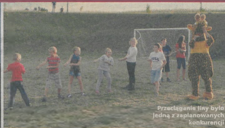
Przeciąganie liny było jedną z zaplanowanych konkurencji