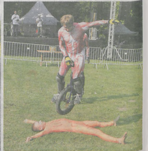
Akrobaci prezentowali mrożące krew w żyłach sztuczki