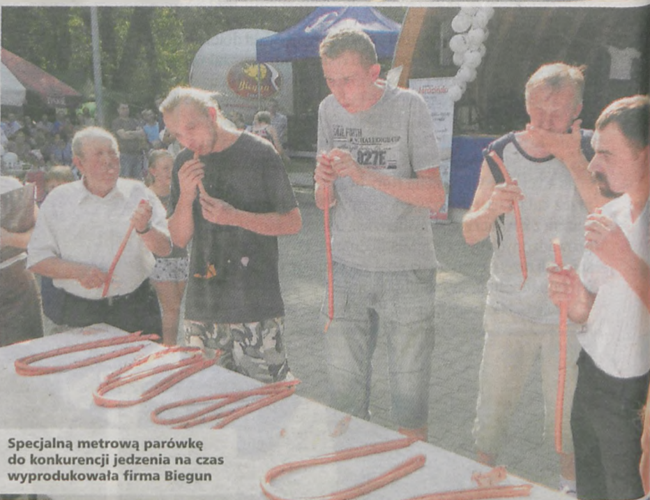
Specjalną metrową parówkę do konkurencji jedzenia na czas wyprodukowała firma Biegun