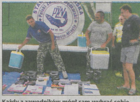
Każdy z zawodników mógł sam wybrać sobie nagrodę. Reprezentacja Żerkowa wyjechała z Siedlemina z łódkami turystycznymi