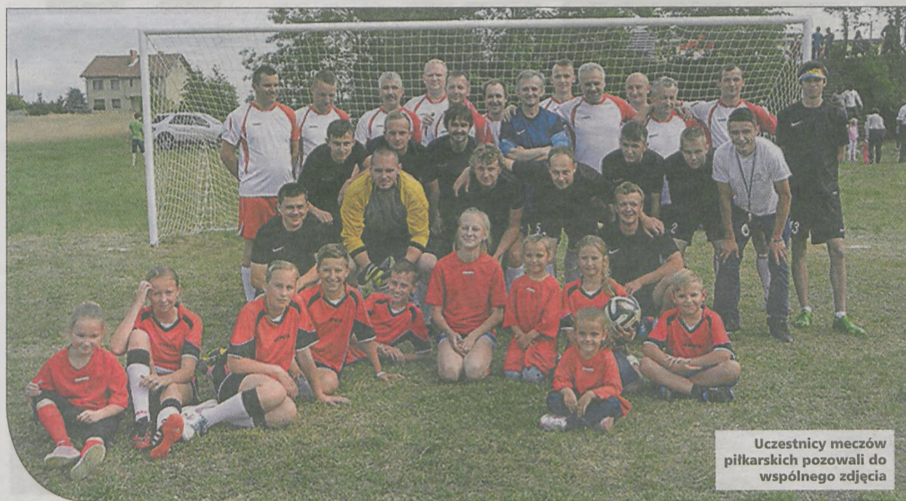
Uczestnicy meczów piłkarskich pozwali do wspólnego zdjęcia