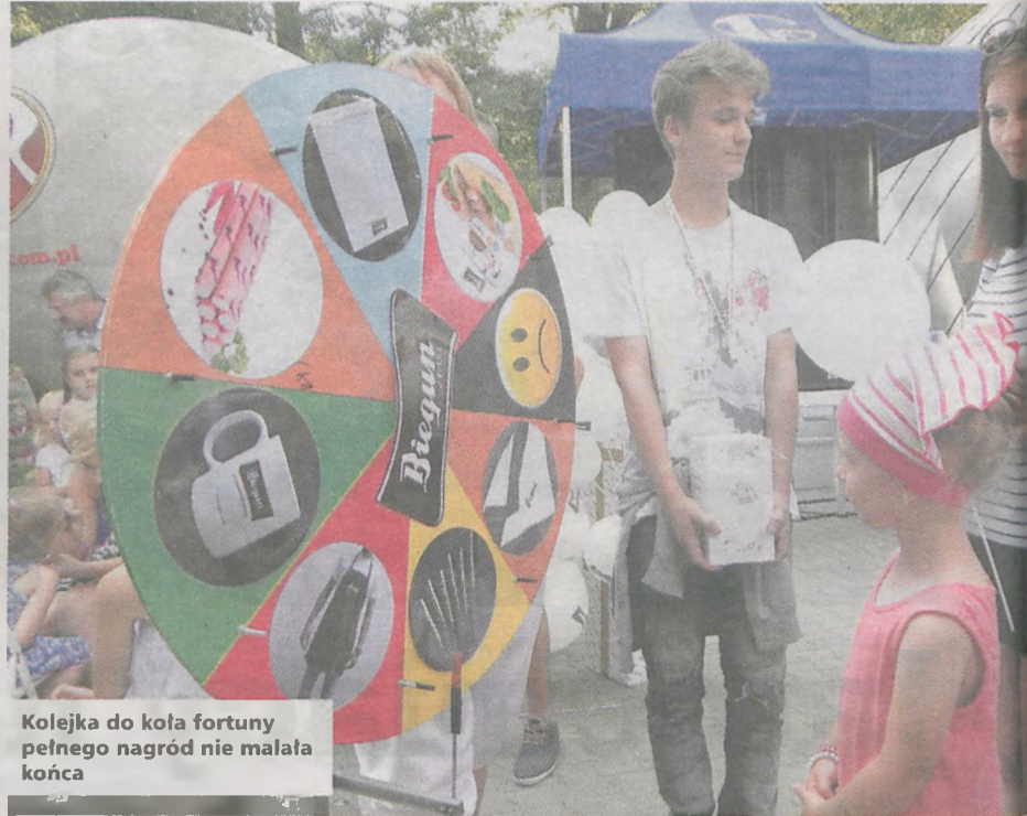
Kolejka do koła fortuny pełnego nagród nie miała końca