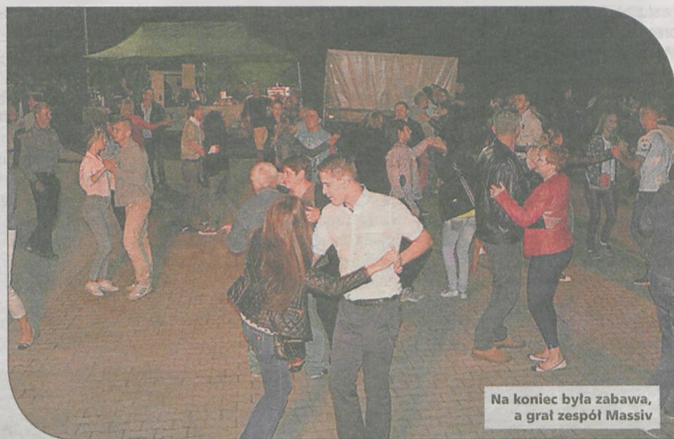
Na koniec była zabawa, a grał zespół Massiv