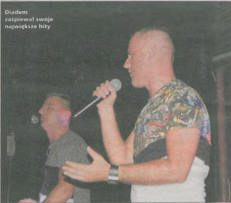
Diadem zaśpiewał swoje największe hity