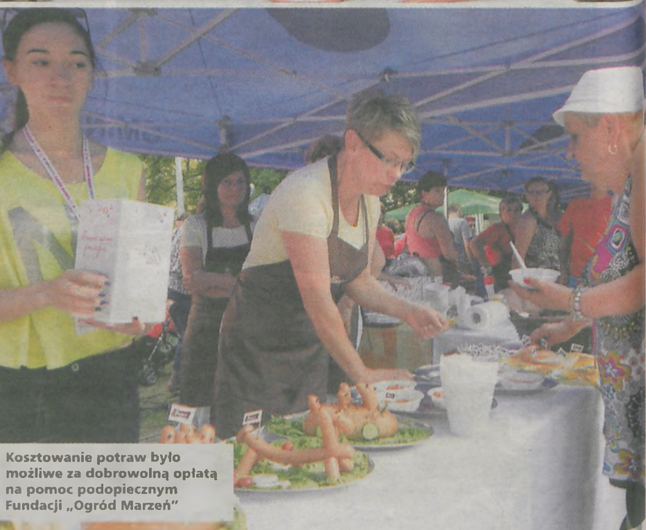
Kosztowanie potraw było możliwe za dobrowolną opłatą na pomoc podopiecznym Fundacji „Ogród Marzeń”