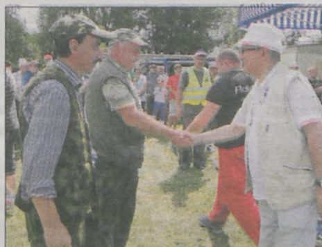
Drużyna z koła PZW Jarocin Miasto zakończyła rywalizację na siódmy miejscu