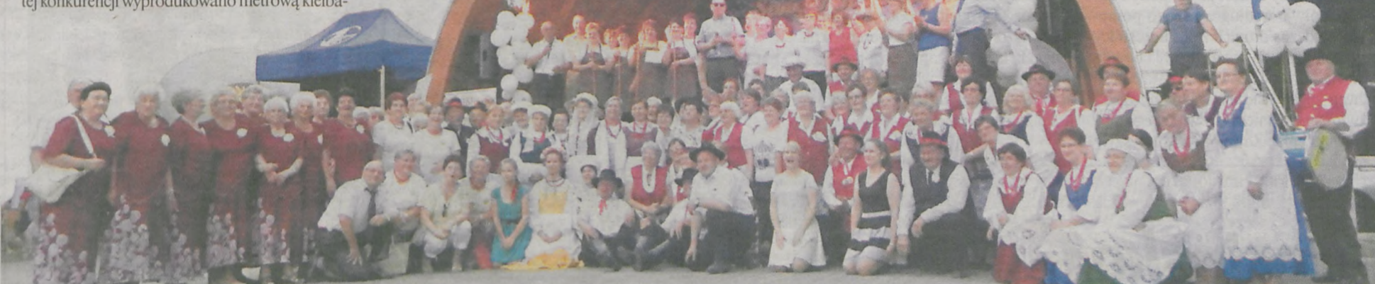
Na zakończenie organizatorzy i zespoły wraz z przedstawicielkami KGW pozowali do wspólnego zdjęcia