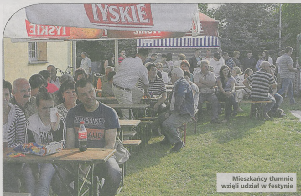
Mieszkańcy tłumnie wzięli udział w festynie