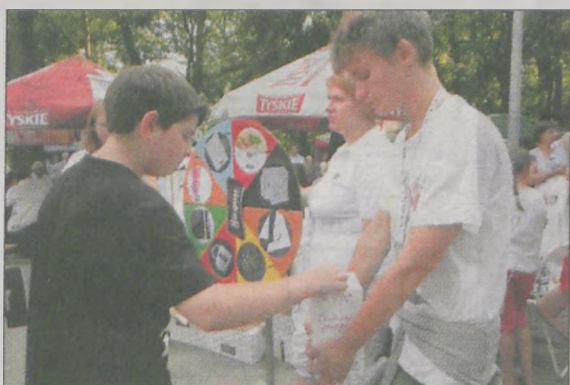
Czterech wolontariuszy zbierało pieniądze na Fundację „Ogród Marzeń”