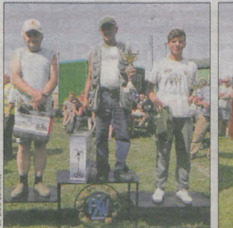
Pucharami wyróżniono tych, którzy złowili najcięższe ryby oraz najlepsze drużyny