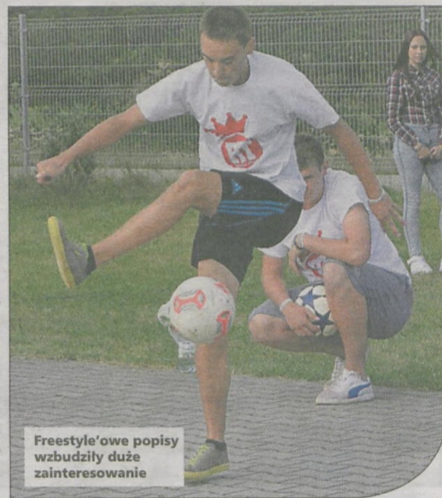
Freestyle'owe popisy wzbudziły duże zainteresowanie