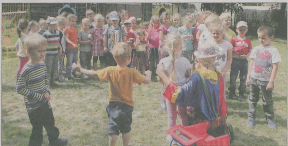
Na zakończenie półkolonii zorganizowano festyn, w czasie którego klaun zapoznawał dzieci z różnymi tańcami europejskimi