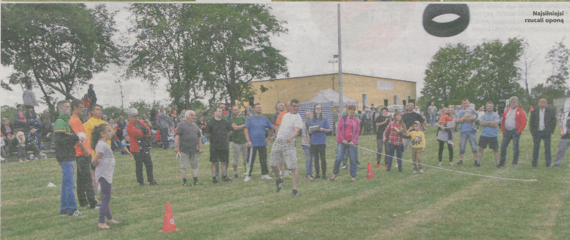
Najsilniejsi rzucali oponą