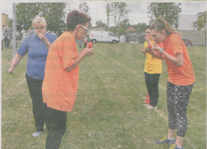
Na mecie pomidora należało zjeść