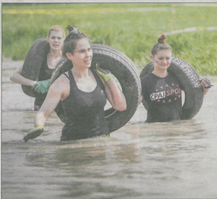
Dźwiganie opon w zbiorniku wodnym nie należy do najłatwiejszych przeszkód