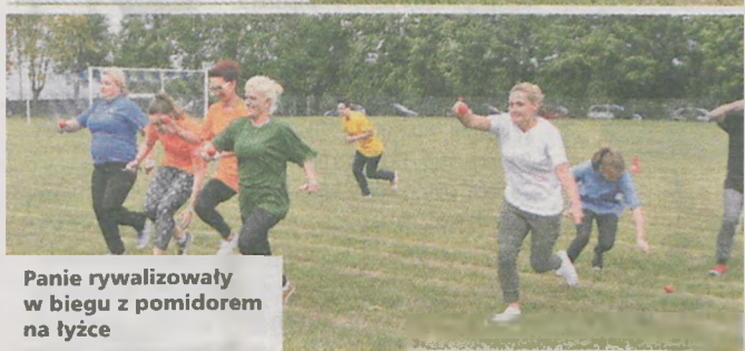
Panie rywalizowały w biegu z pomidorem na łyżce