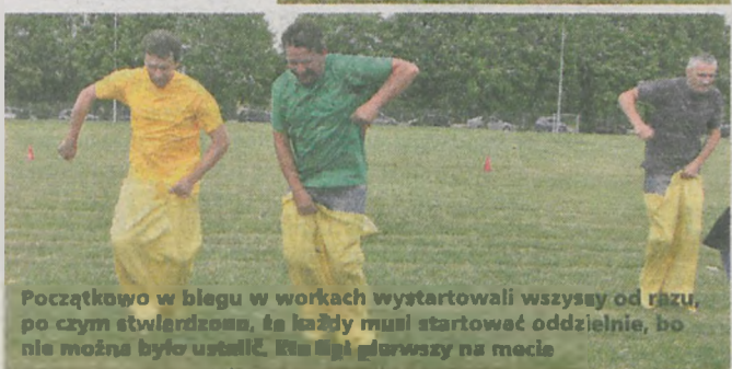
Początkowo w biegu w workach wystartowali wszyscy od razu, po czym stwierdzono, że każdy musi startować oddzielnie, bo nie można było ustalić, kto był gorszy na mecie