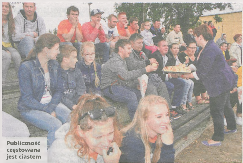
Publiczność częstowana jest ciastem