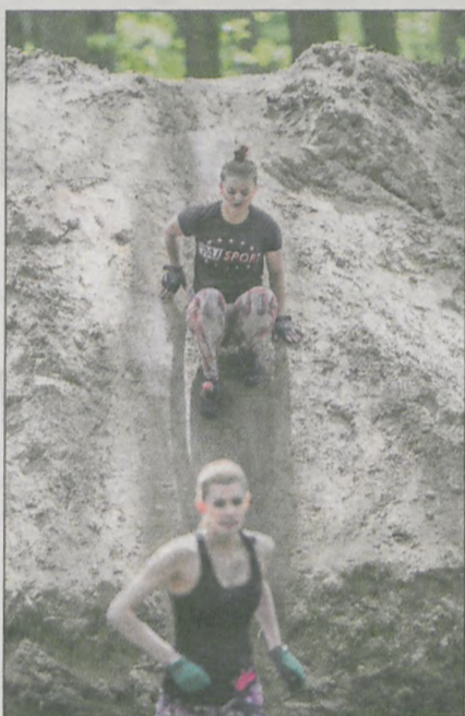
Piaszczyste skarpy też nie są łatwe do pokonania

Z częścią - można samemu, z innymi - rzeczywiście jest bardzo trudno. Dlatego na tych biegach panuje bardzo fajna atmosfera współpracy. Jeżeli się biegnie ze swoją ekipą, wiadomo, że ludzie sobie nawzajem pomagają, ale nie ma też takiej atmosfery konkurencji. Owszem, każdy rywalizuje o jak najlepszy wynik, ale kiedy ktoś utknie, na przykład w bagnie, jeden drugiemu wyciąga pomocną dłoń. I dzięki temu trasa jest do pokonania dla wszystkich.