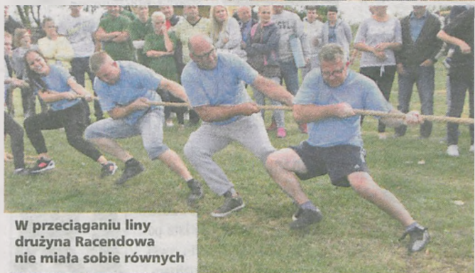
W przeciąganiu liny drużyna Racendowa nie miała sobie równych