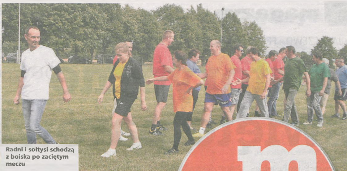
Radni i sołtysi schodzą z boiska po zaciętym meczu