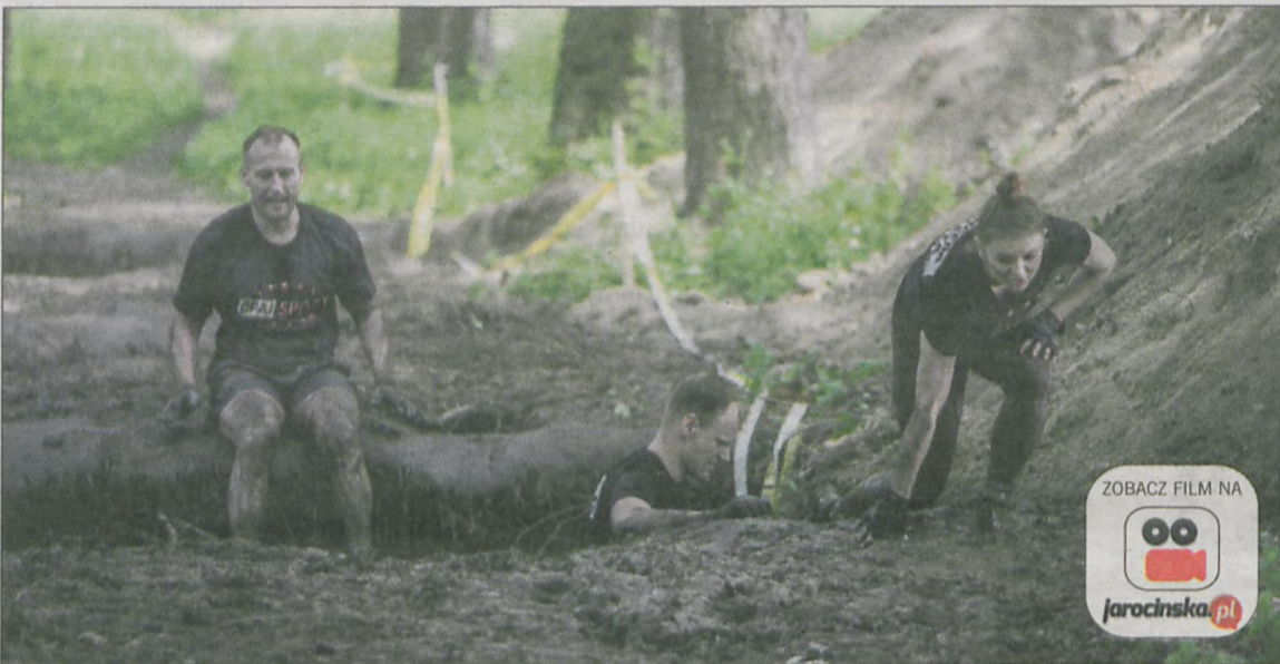
Biegi tego typu zdecydowanie nie są dla czystochołów

Ile przeszkód można spotkać na trasie takich biegów i jak długi dystans trzeba pokonać?