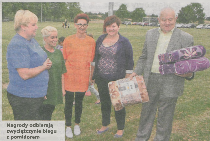
Nagrody odbierają zwyciężczynie biegu z pomidorem