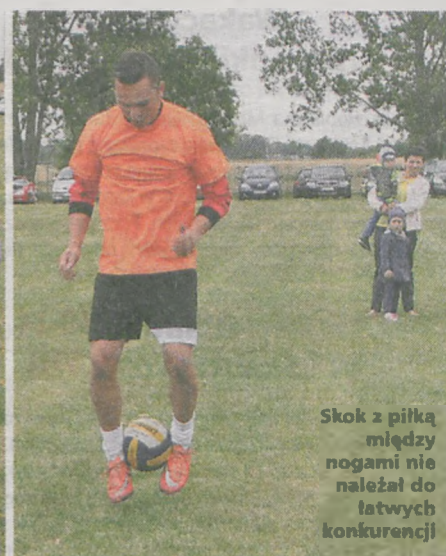
Skok z piłką między nogami nie należał do łatwych konkurencji