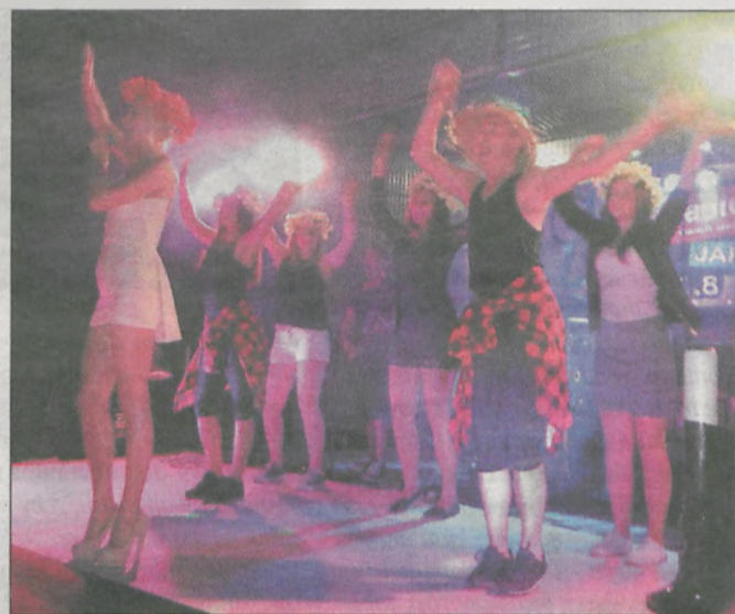
Trzy fanki miały okazję zatańczyć na scenie razem z zespołem

W listopadzie zespół Mejk wystąpił w Jarocinie, osiem miesięcy później jesteście w Parzęczewie. Można odnieść wrażenie, że lubicie tu wracać.