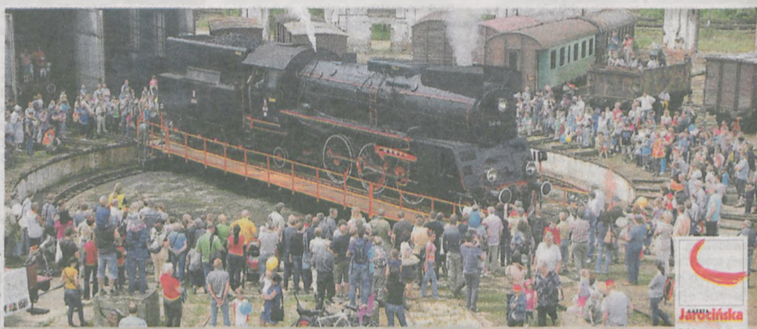
Program Festynu Kolejowego - 21 czerwca, godz. 14.00-18.00

Rok 2015 został ogłoszony przez radę miejską Rokiem Jarocińskich Kolejarzy. W ramach obchodów zaplanowano trzy imprezy. Pierwsza miała miejsce w maju, w ramach Nocy Muzeów. W niedzielę 21 czerwca odbędzie się Festyn Kolejowy w Parowozowni w Jarocinie.