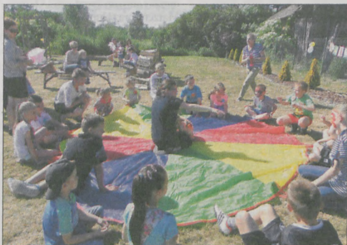
Maluchy podczas zabawy