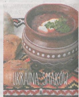
Aniela Redelbach „Ukraina smaków” Wydawnictwo Poznańskie Poznań 2015