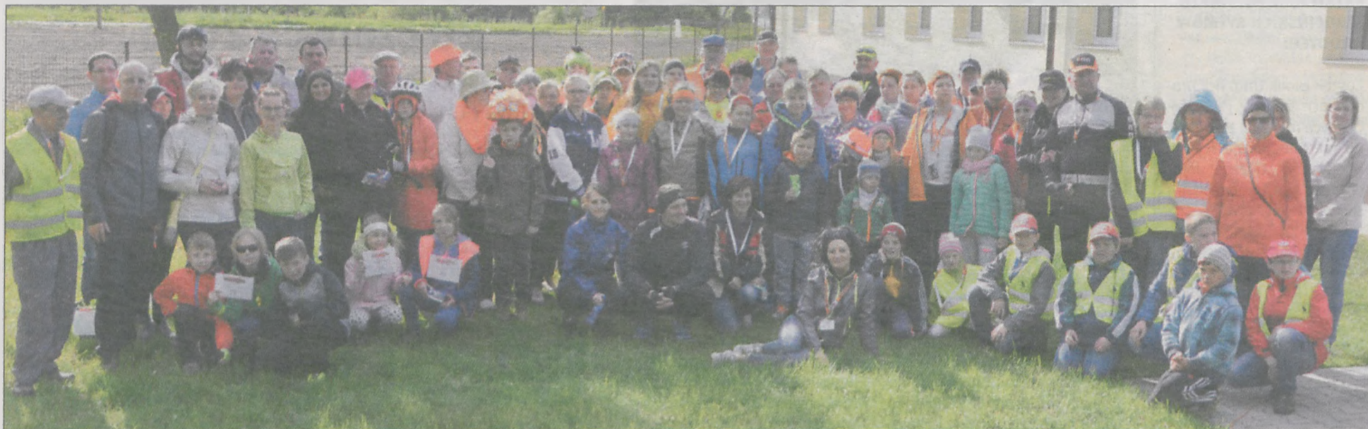
Przy ognisku rowerzyści ustawili się do wspólnego zdjęcia