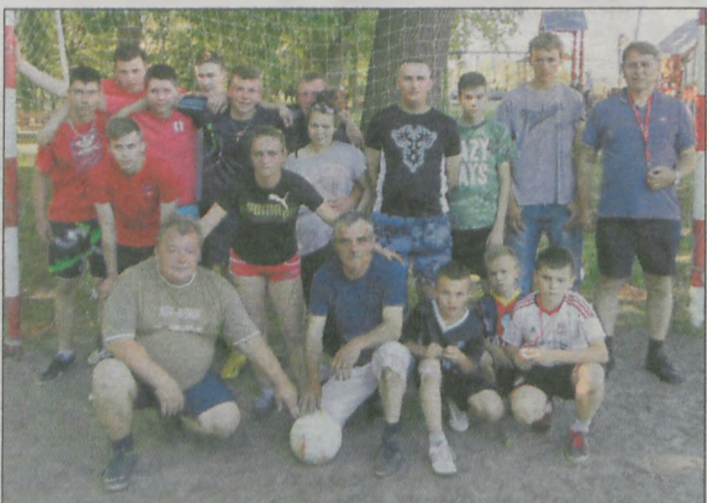
Obydwie drużyny wraz z radnym, który wystąpił w roli sędziego