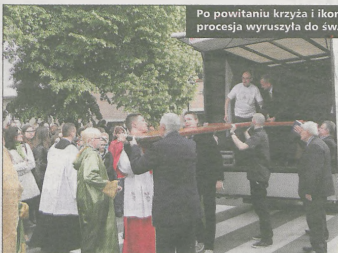
Po powitaniu krzyża i ikony przy kościele św. Jerzego, procesja wyruszyła do św. Marcina