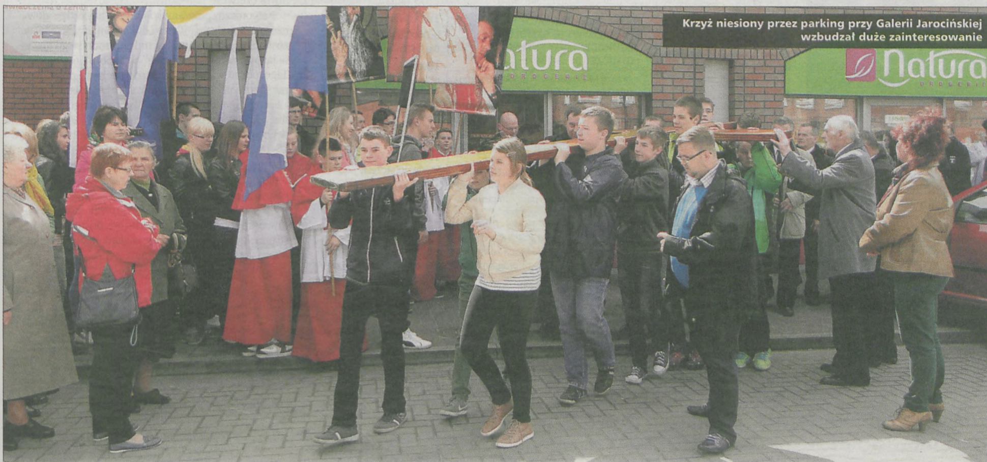
Krzyż niesiony przez parking przy Galerii Jarocińskiej wzbudzał duże zainteresowanie