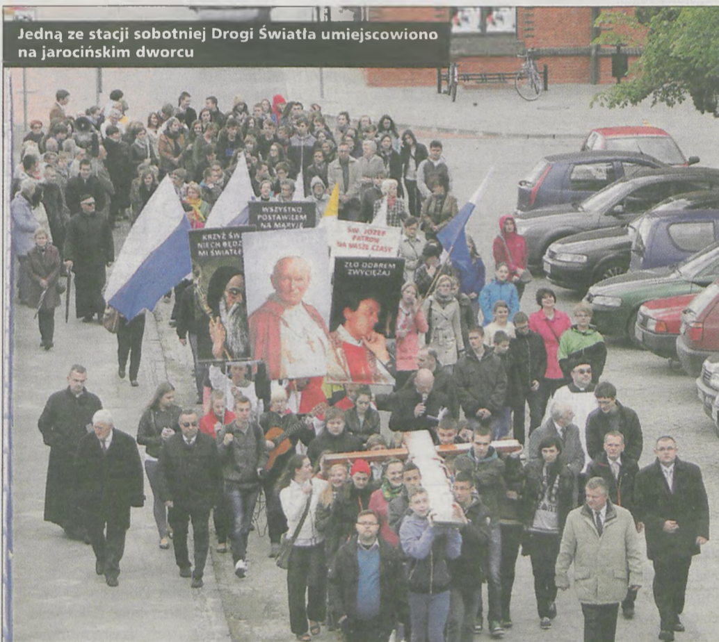
Jedną ze stacji sobotniej Drogi Światła umiejscowiono na jarocińskim dworcu

Symbole Dni Młodzieży w procesji nieśli także uczniowie gimnazjum w Kotlinie