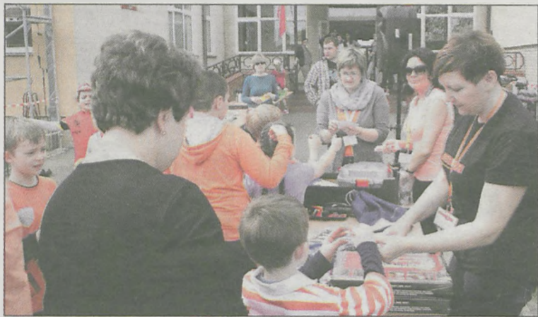
Podczas postoju w Rusku rozlosowano m.in. nagrody książkowe