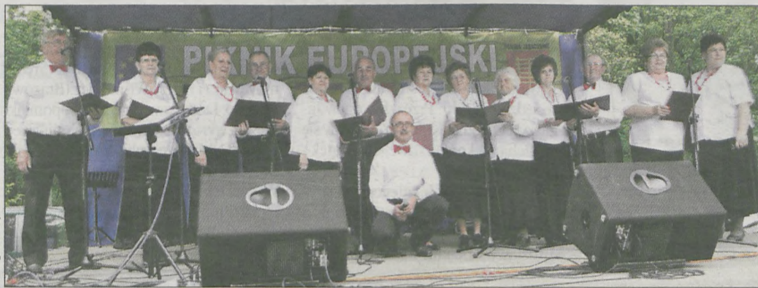
„Złota Jesień” podczas występów w trakcie świąt majowych w Jaraczewie