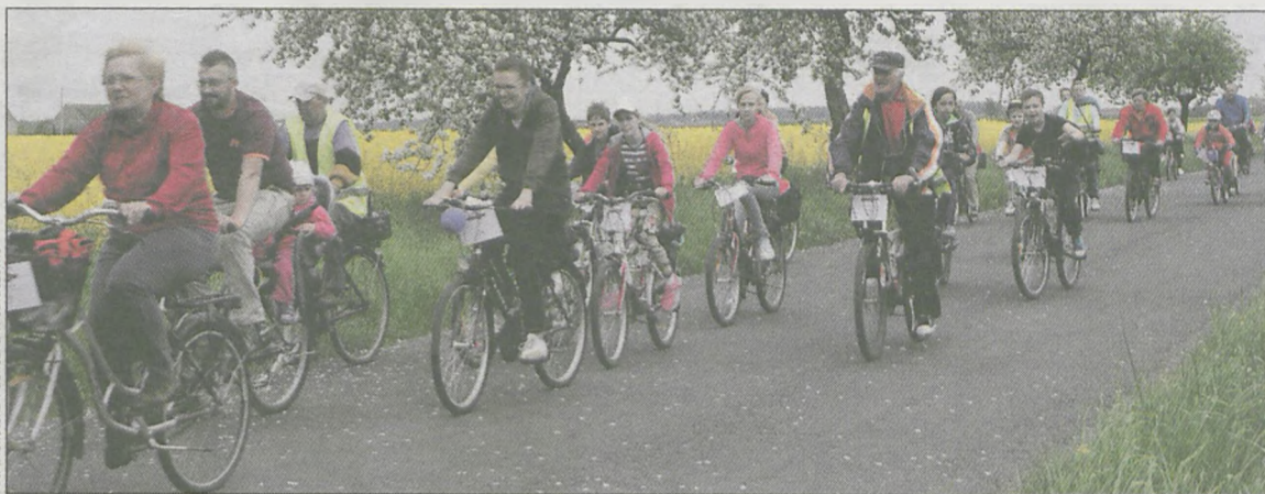
W tegorocznym rajdzie jechało 97 uczestników