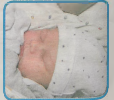
KAMIL WRÓBLEWSKI Z JAROCINA ur. 10 maja o godz. 20.25 wazy 4.180 g, mierzy 57 cm