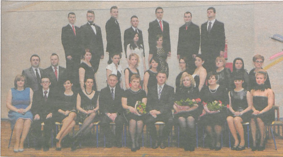
klasa IV technikum hotelarskiego i elektronicznego