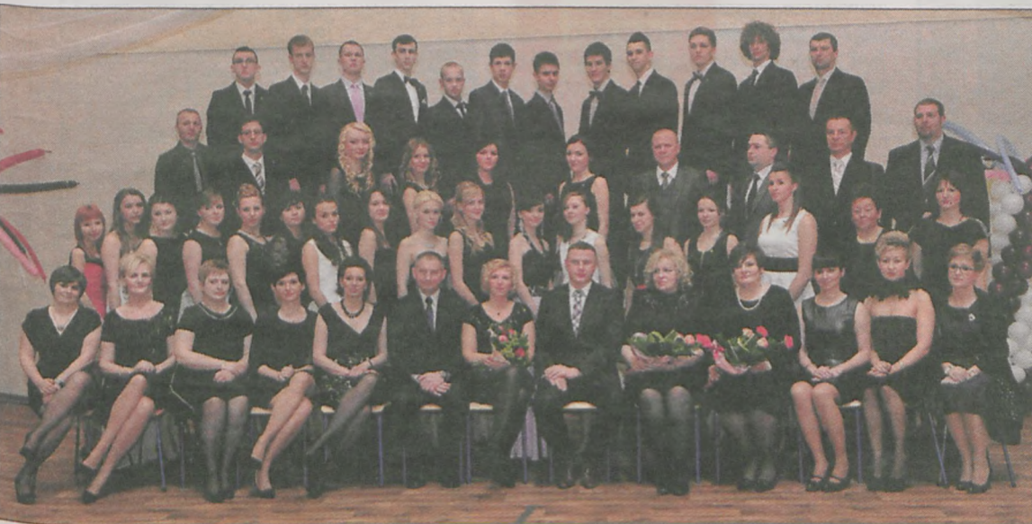
klasa III liceum ogólnokształcącego z rozszerzeniem policyjno-prawnym