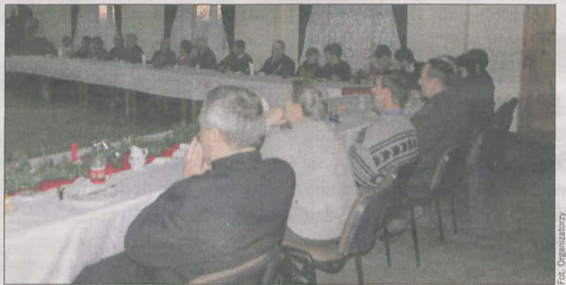
Mieszkańcy Stęgoszy chętnie skorzystali z zaproszenia na spotkanie oplatkowe do miejscowej sali wiejskiej