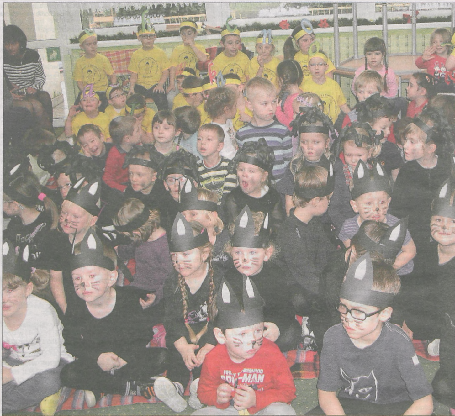
W przedszkolu „Marcinek” odbyło się „Wielkie Wierszykowanie”, które rozpoczęło uroczyste przecięcie wstęgi przez członków jury. Dzieci „przenieśli się” do krainy wierszy Juliana Tuwima, recytowały: „Zosie Samosię”, „Bambo”, „Kotka”, „Spóźnionego Słowika”, „Grzesia”, „Abecadło” i „Okulary”. Nie zabrakło ciekawych i pomysłowych rekwizytów, co uatrakcyjniło występy. Na zakończenie maluchy otrzymały dyplomy oraz słodką niespodziankę.

Czy nie za dużo wzięłaś na swoje barki? Prognozy były i są pomyślne, lecz skrupulatne wypełnianie wszystkich punktów postanowień jest absorbujące i niebotycznie trudne. Zweryfikuj swoje plany. W pracy pojawiają się nowe możliwości, lecz nie licz na łatwy sukces. Sama też wszystkiemu nie poradzisz. Dyplomatycznie rozdziel obowiązki, którymi już dawno powinnaś się podzielić. Otoczenie będzie Cię szanowało za wiele innych rzeczy.