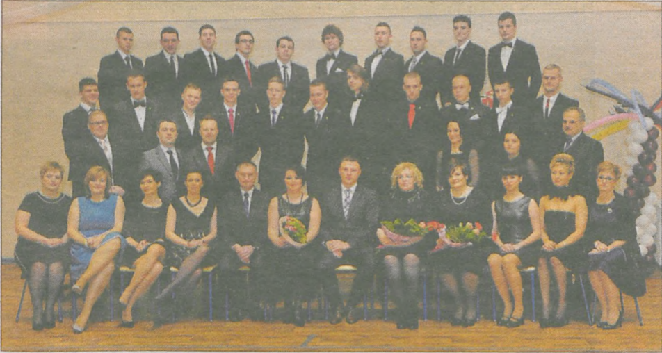
klasa IV technikum pojazdów samochodowych i elektronicznego