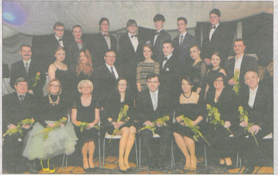
Maturzyści z gronem pedagogicznym...

Na studniówce tegorocznych maturzystów z liceum społecznego bawiło się około 60 osób. Tradycyjnie w balu uczestniczyli rodzice. Zabawa trwała do 3.30.