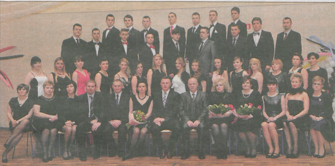
klasa III liceum ogólnokształcącego z rozszerzeniem wojskowym