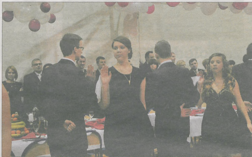
Na parkiecie bawiło się prawie 300 osób