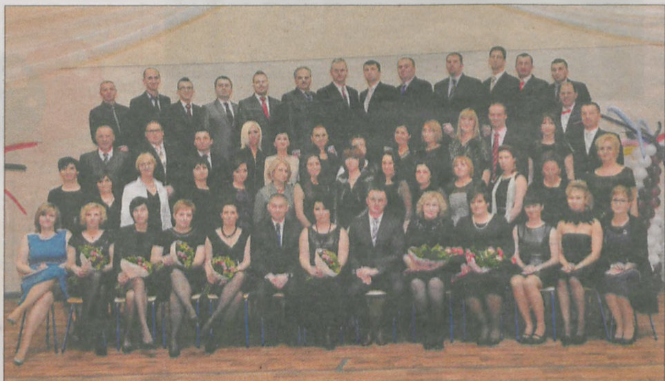
Grono pedagogiczne ZSP nr 2