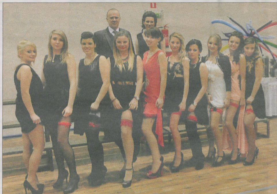
Czerwona podwiązka była obowiązkowa