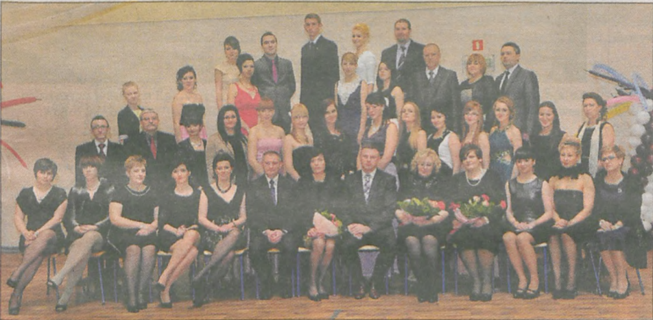
klasa IV technikum hotelarskiego