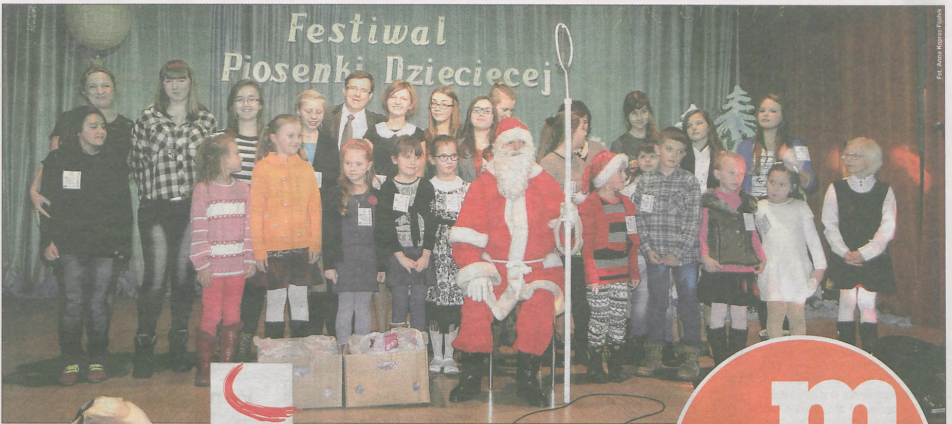
Fot. Anna Kopras-Fijolek