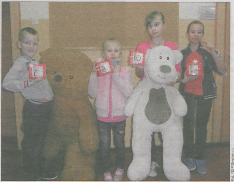
Fot. NSP Siedlemin

znanych niedźwiadków z bajek. Dużym zainteresowaniem cieszył się konkurs na największą i najmniejszą pluszową maskotkę, zorganizowany przez uczniów klasy czwartej. Zwycięzcy otrzymali świąteczne kubeczki, a każdy, kto tego dnia przyniósł pluszaka, słodki upominek. (Is)