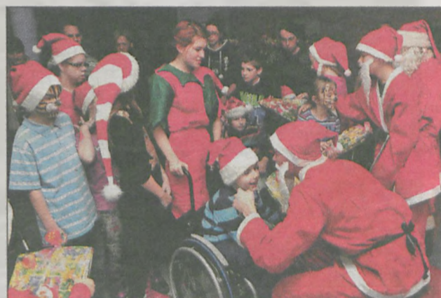
Wszystkie dzieci czekały na „prawdziwego” św. Mikołaja z prezentami. Przybyło aż trzech