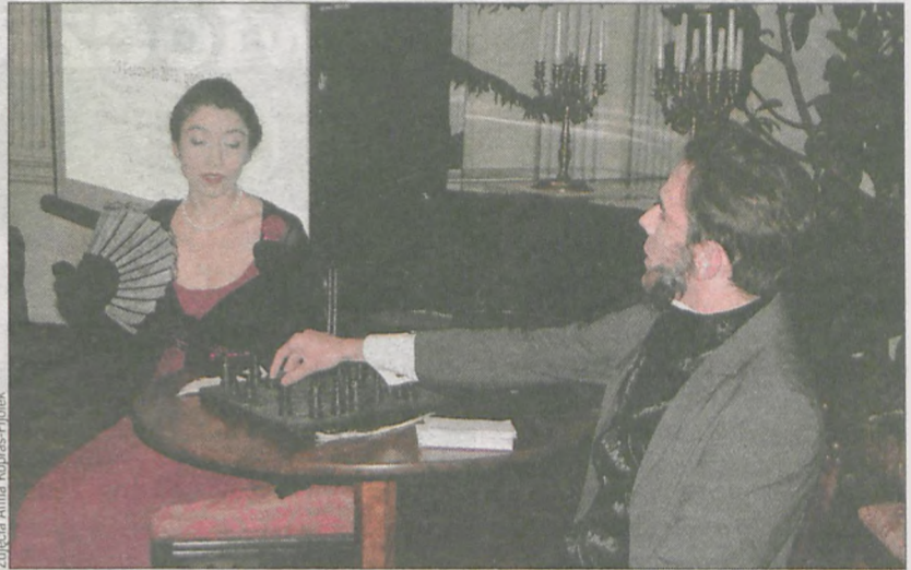
Publiczność z zaciekawieniem obserwowała rozgrywki szachowe w wykonaniu aktorów