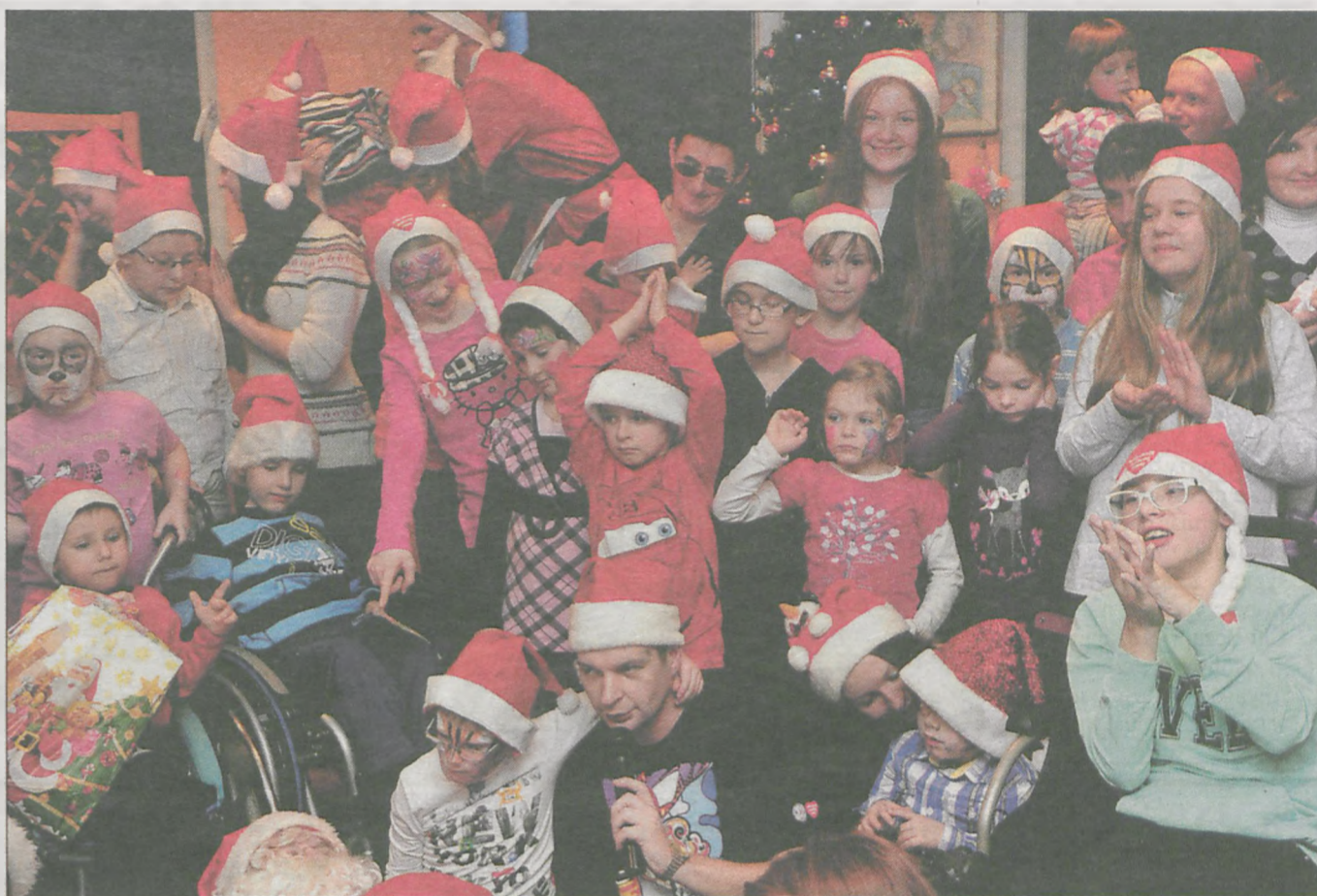
Każdy mógł zostać św. Mikołajem