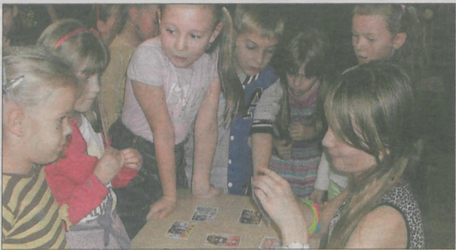
Uczniowie z niecierpliwością czekali, co im wyjdzie z andrzejkowego wróżenia

Tradycyjnie już w jarocińskiej „trójce” najmłodsze dzieci z klas I - III razem ze swoimi wychowawczyniami uczestniczyły w zabawie andrzejkowej. W przeprowadzeniu imprezy pomagali członkowie Szkolnego Koła PCK.