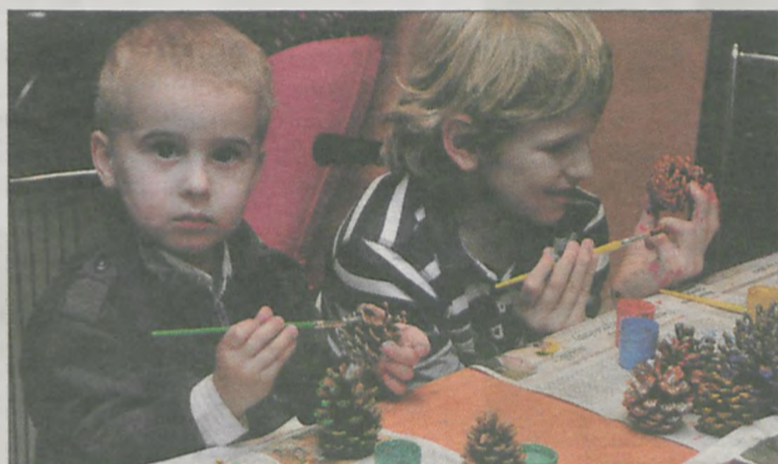
Podczas andrzejek dzieci przygotowywały ozdoby, które trafią do darczyńców