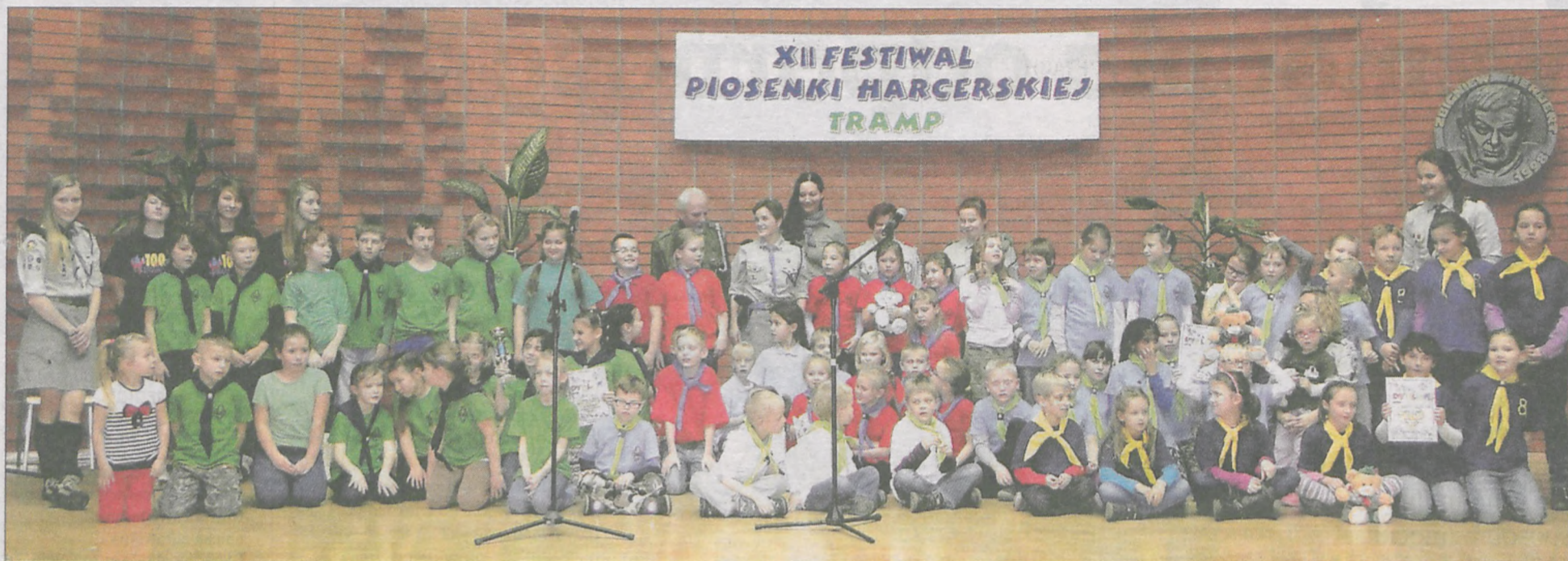
Na festiwalu piosenki harcerskiej w tym roku wystąpiło pięć gromad zuchowych z Jarocina, Kotlina i Witaszyc

SOLENIZANCI: 10 wtorek: Daniela, Judyty, 11 środa: Waldemara, Damazego, 12 czwartek: Adelajdy, Aleksandra, 13 piątek: Łucji, Otylii, 14 sobota: Alfreda, Izydora, 15 niedziela: Celiny, Eydty, 16 poniedziałek: Aliny, Euzebiusza