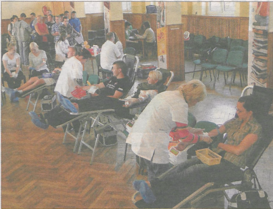
Na cztery godziny aula Zespołu Szkół Ponadgimnazjalnych nr 1 w Jarocinie zamieniła się w ogromny punkt krwiodawstwa

► 567 krwiodawców oddało krew w czasie sześciu edycji „Lekcji Agaty”