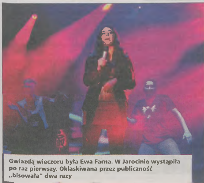
Gwiazdą wieczoru była Ewa Farna. W Jarocinie wystąpiła po raz pierwszy. Oklaskiwana przez publiczność „bisowała” dwa razy