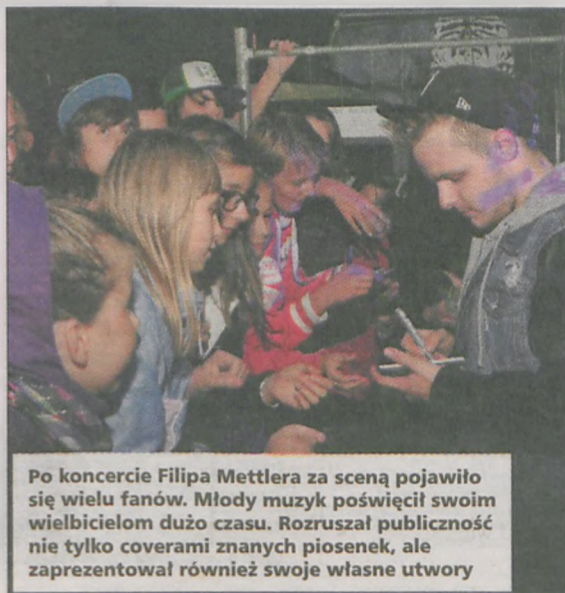
Po koncercie Filipa Mettlera za sceną pojawiło się wielu fanów. Młody muzyk poświęcił swoim wielbicielom dużo czasu. Rozruszał publiczność nie tylko coverami znanych piosenek, ale zaprezentował również swoje własne utwory