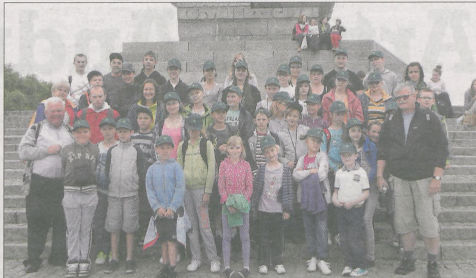
Uczestnicy drugiej wycieczki odwiedzili m.in. Westerplatte