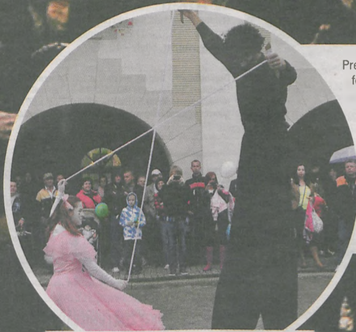
Podczas imprezy wolontariusze Fundacji „Ogród Marzeń” i członkowie grupy Empir Ognia wystąpili w pokazie pantonimiczno-szczudlarskim