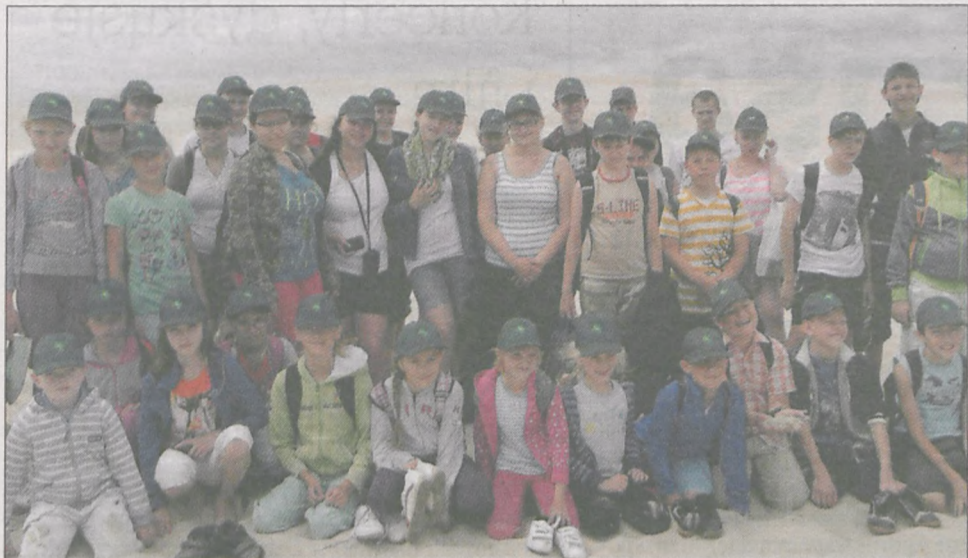
Pierwsza wycieczka pojechała do Białki Tatrzańskiej