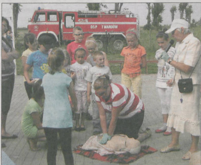
PCK Jarocin uczyło udzielania pierwszej pomocy