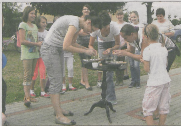
Panie rywalizowały w ubijaniu biańka