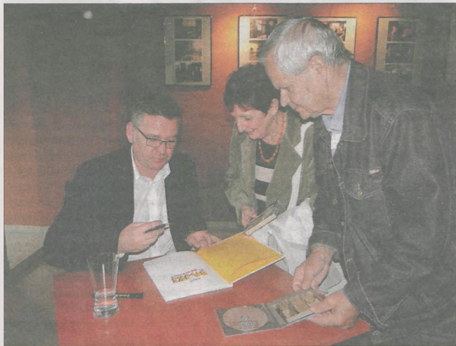
Po spotkaniu w kinie ustawila się długa kolejka - wiele osób skorzystało nie tylko z możliwości kupienia książek i płyt Artura Andrusa, ale również uzyskania pamiątkowego wpisu

■ - Łooooo - rozległo się w kinie, kiedy Artur Andrus powiedział, że nigdy nie był w Jarocinie. - Ale jestem! Kiedyś musi być ten pierwszy raz!