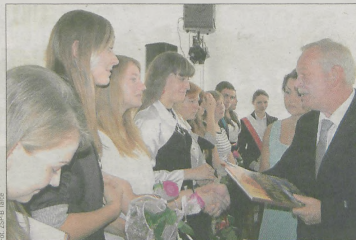
Wyróżnieni uczniowie otrzymali nagrody książkowe z rąk starosty Mikołaja Szymczaka