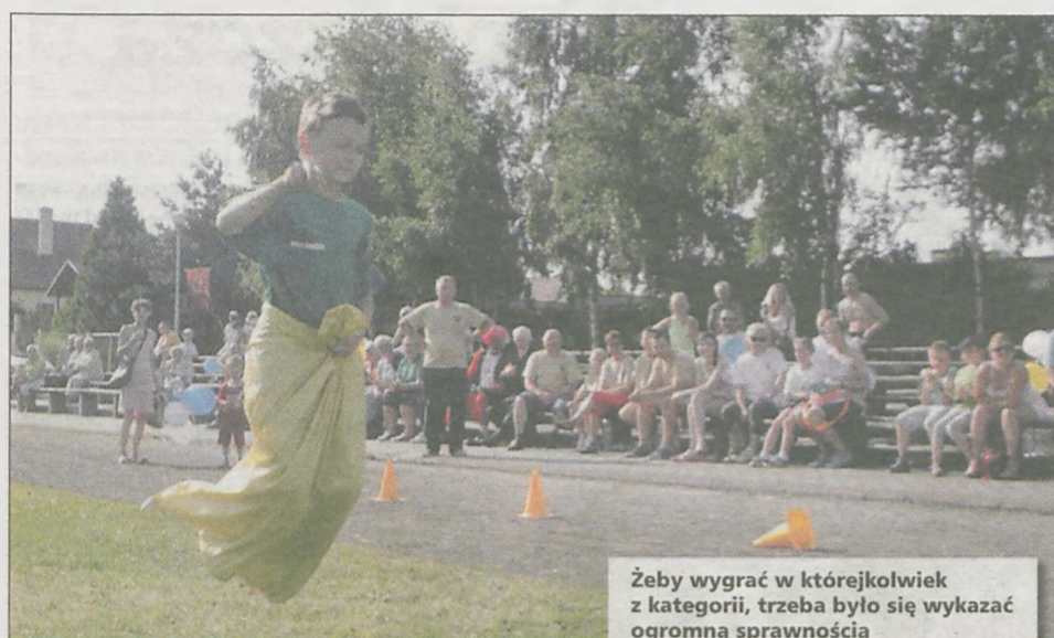
Żeby wygrać w którejkolwiek z kategorii, trzeba było się wykazać ogromną sprawnością