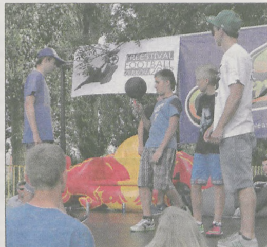
W przerwie przed półfinałami w kat. Battle, organizatorzy przeprowadzili konkurs dla publiczności. Trzech chłopców wygrało pamiątkowe koszulki

Choć pogoda nie dopisała, organizatorzy tegorocznego Freestivalu Football w Żerkowie i tak mogą uznać go za swój sukces. Poziom sportowy był niezwykle wysoki, godny nawet mistrzostw świata. Można być pewnym, że zwycięzca w najważniejszej kategorii - Szymon Skalski z Wolbromia - będzie godnie reprezentował Polskę na światowym finale Red Bull Streetstyle w Japonii.