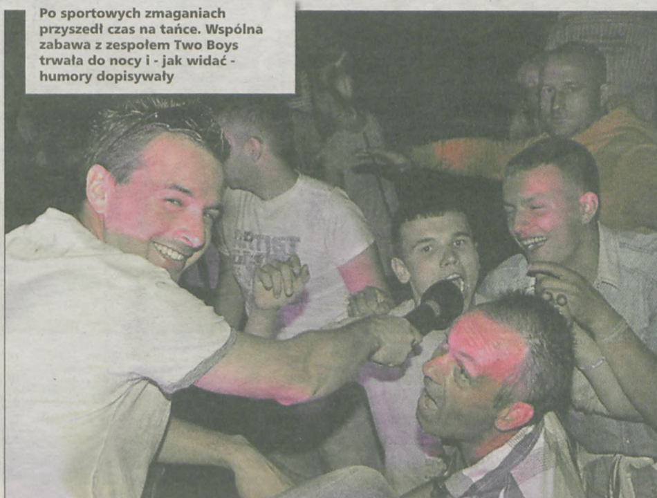
Po sportowych zmaganiach przyszedł czas na tańce. Wspólna zabawa z zespołem Two Boys trwała do nocy i - jak widać - humory dopisywały