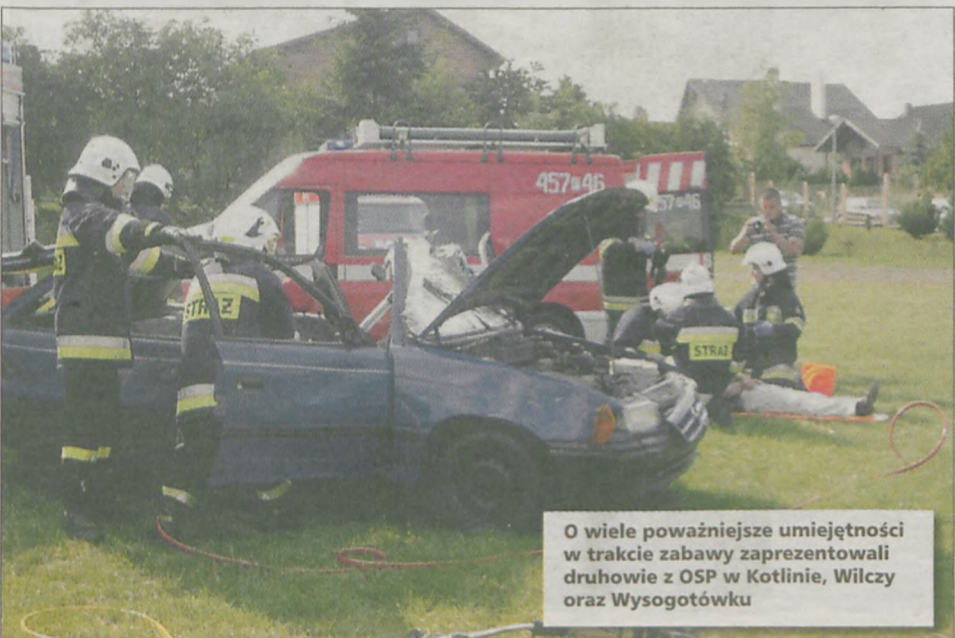
O wiele poważniejsze umiejętności w trakcie zabawy zaprezentowali druhowie z OSP w Kotlinie, Wilczy oraz Wysogotówku