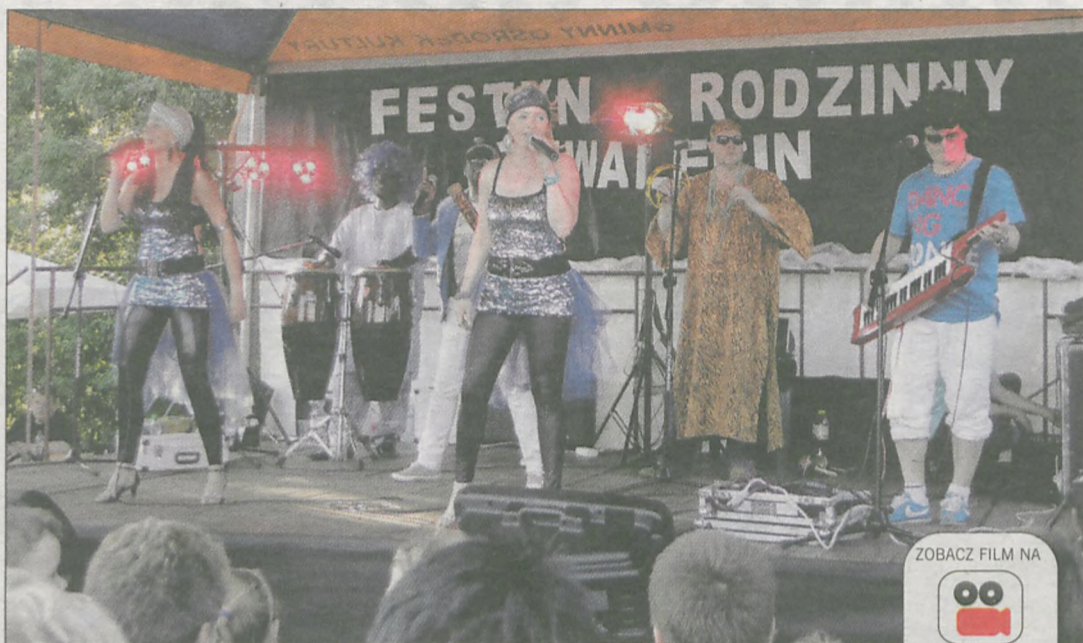
„Babylon” zrobił furorę