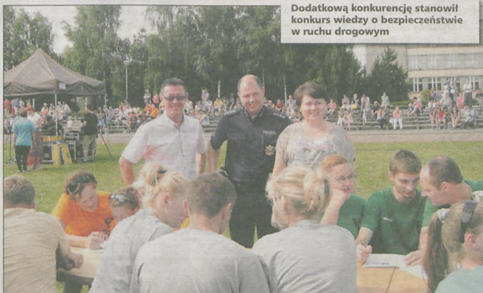
Dodatkową konkurencję stanowił konkurs wiedzy o bezpieczeństwie w ruchu drogowym