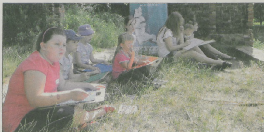
Jednym z miejsc, które malowały dzieci, był park w Boguszynie