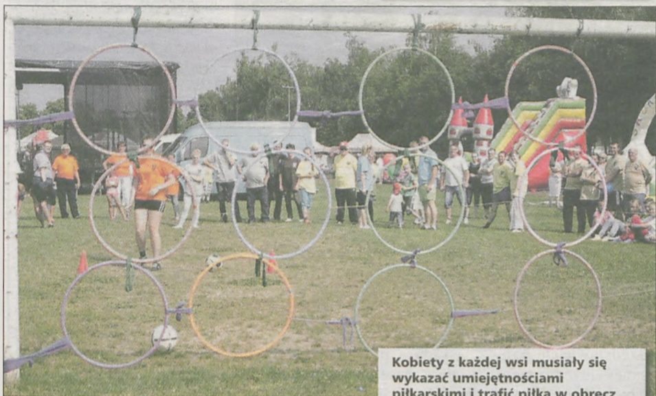
Kobiety z każdej wsi musiały się wykazać umiejętnościami piłkarskimi i trafić piłką w obręcz o jak najwyższej liczbie punktów