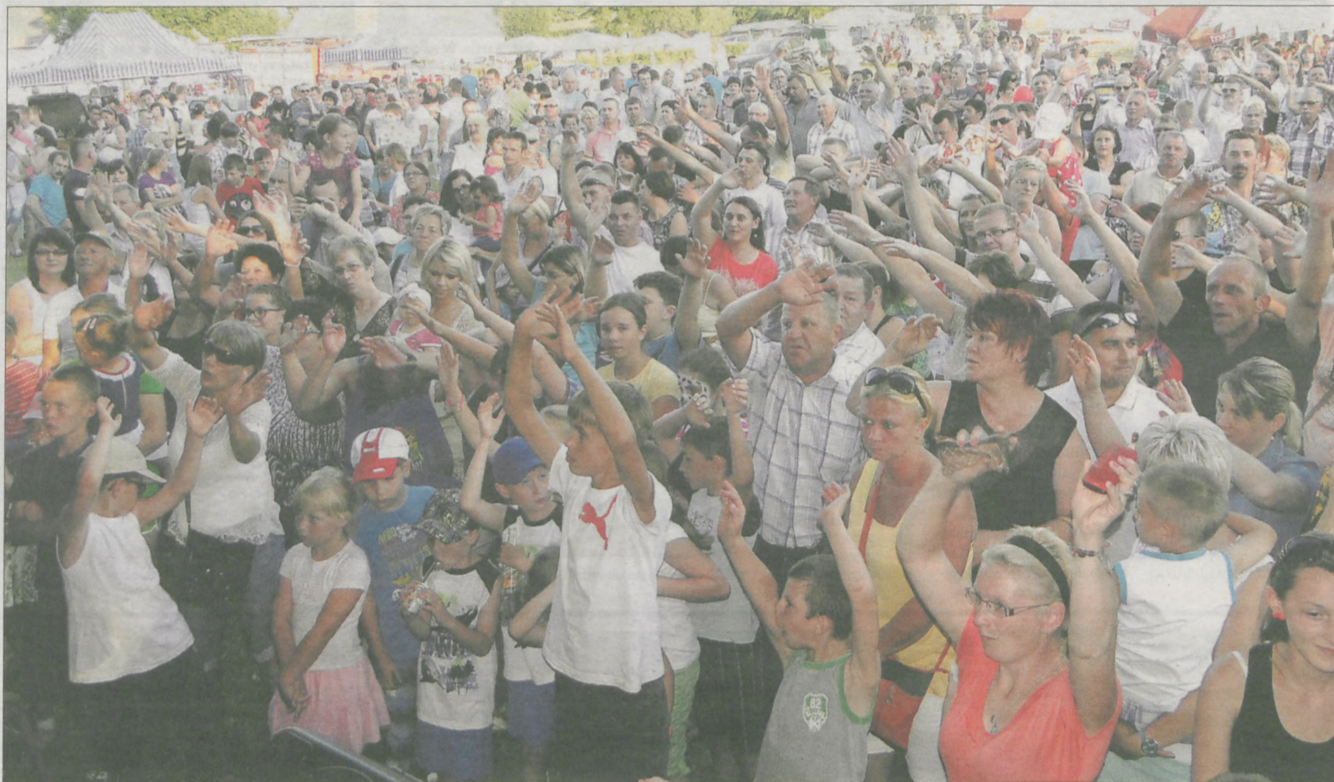
Podczas koncertu świetnie bawili się wszyscy - i mali, i duzi