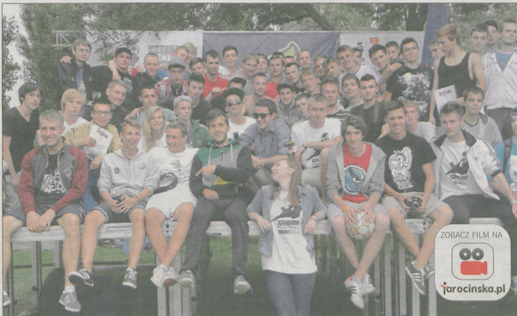
W tym roku w zmaganiach w Żerkowie wzięło udział ponad 80 freestylerów