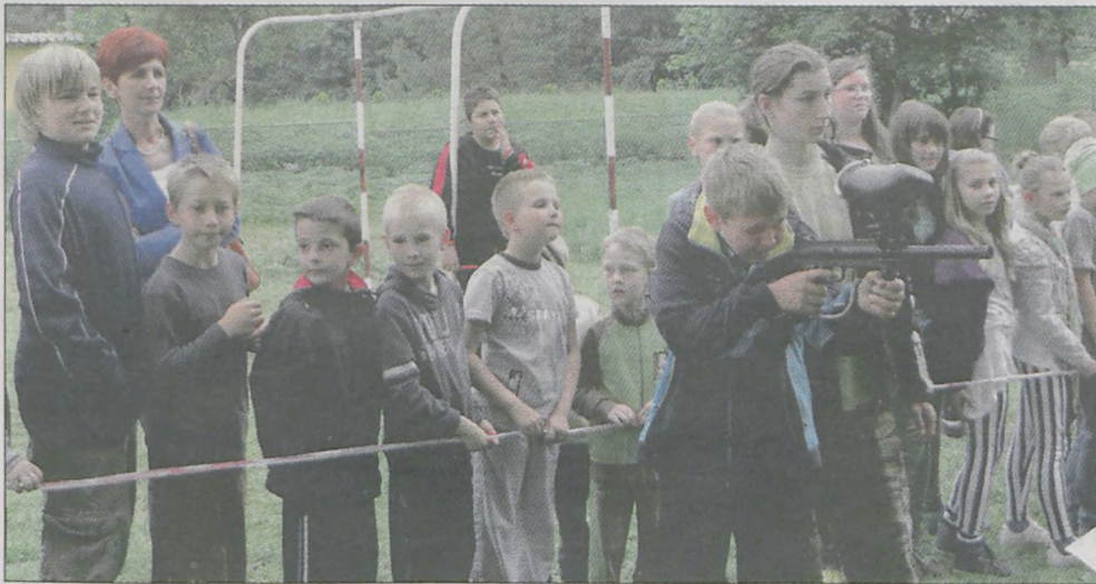
Podczas finału dzieci, także z innych szkół gminy Kotlin, mogły skorzystać z dmuchanej zjeżdżalni, ścianki wspinaczkowej i paintballu