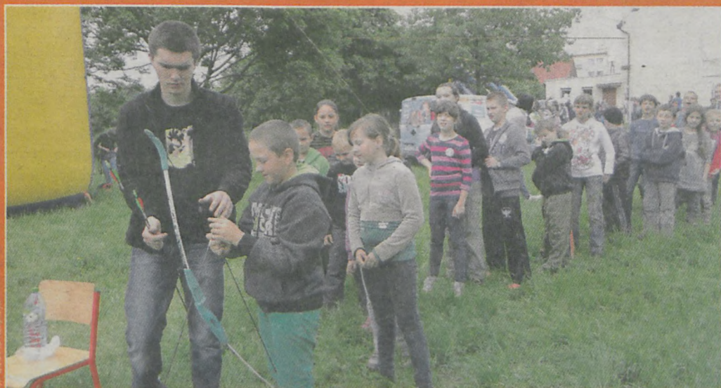
Strzelanie z łuku to jedną z atrakcji przygotowanych dla uczniów w Magnuszewicach w czasie festynu, który towarzyszył IV finałowi „Piątka dla Gazety”

• 2.303 kupony napłynęły na tegoroczną edycję „Piątka dla Gazety” • 320 kuponów nadesłali uczniowie Szkoły Podstawowej z Noskowa • Ze Szkoły Podstawowej w Woli Książęcej napłynęły 203 kupony