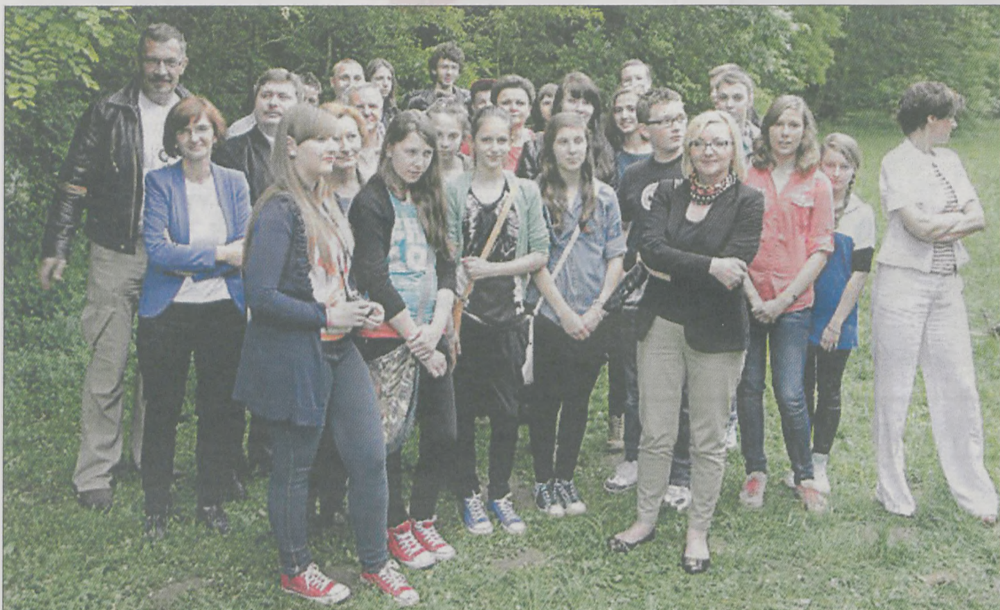
Najpierw były warsztaty, później dużo pracy, teraz - okazja do zaprezentowania jej efektów

► Młodzież pokazała, co potrafi. Podczas festynu z okazji Dnia Dziecka zakończył się projekt „Zgrany Jarocin”.