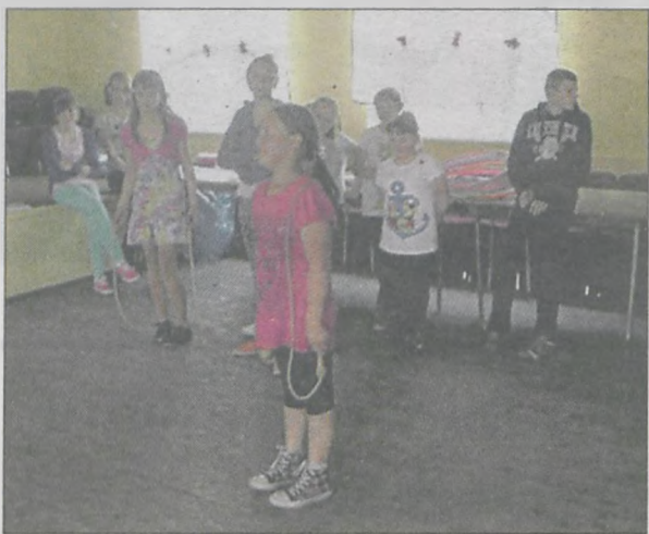
Jedną z dziesięciu konkurencji był skok przez skakankę