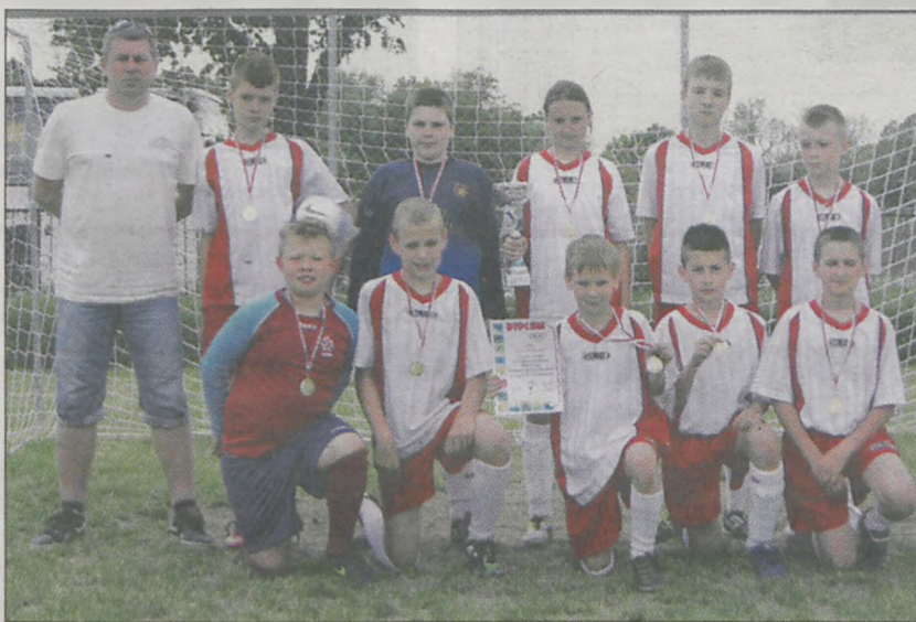
Pierwsze miejsce zajęli piłkarze z Wilkowyi