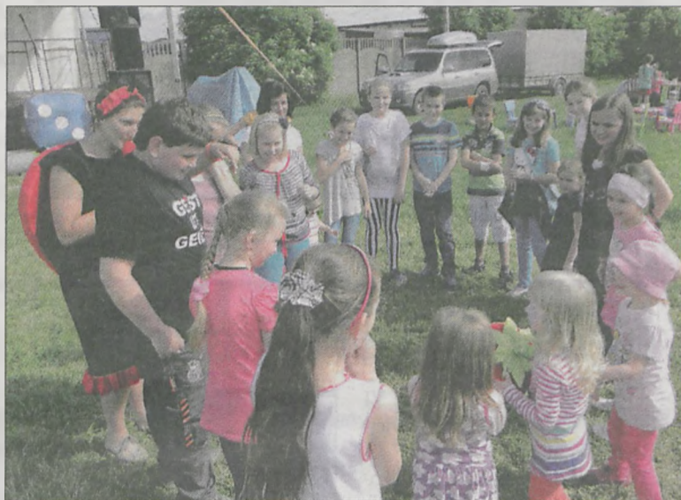
Maluchom spodobała się m.in. zabawa z poziomką