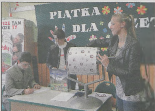
Sponsorów zapraszaliśmy do losowania nagród