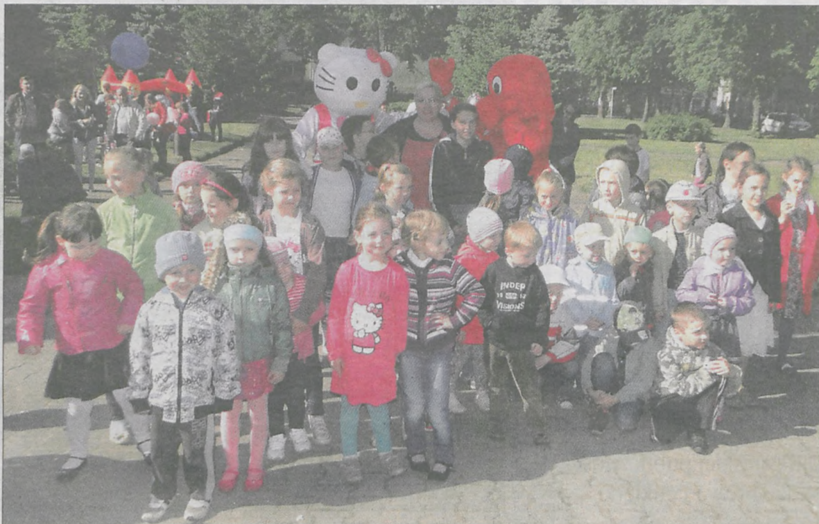
Maluchy bawiły się z bajkowymi postaciami i stanęły z nimi do wspólnego zdjęcia