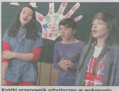
Krótki przerywnik artystyczny w wykonaniu uczennic szkoły w Magnuszewicach