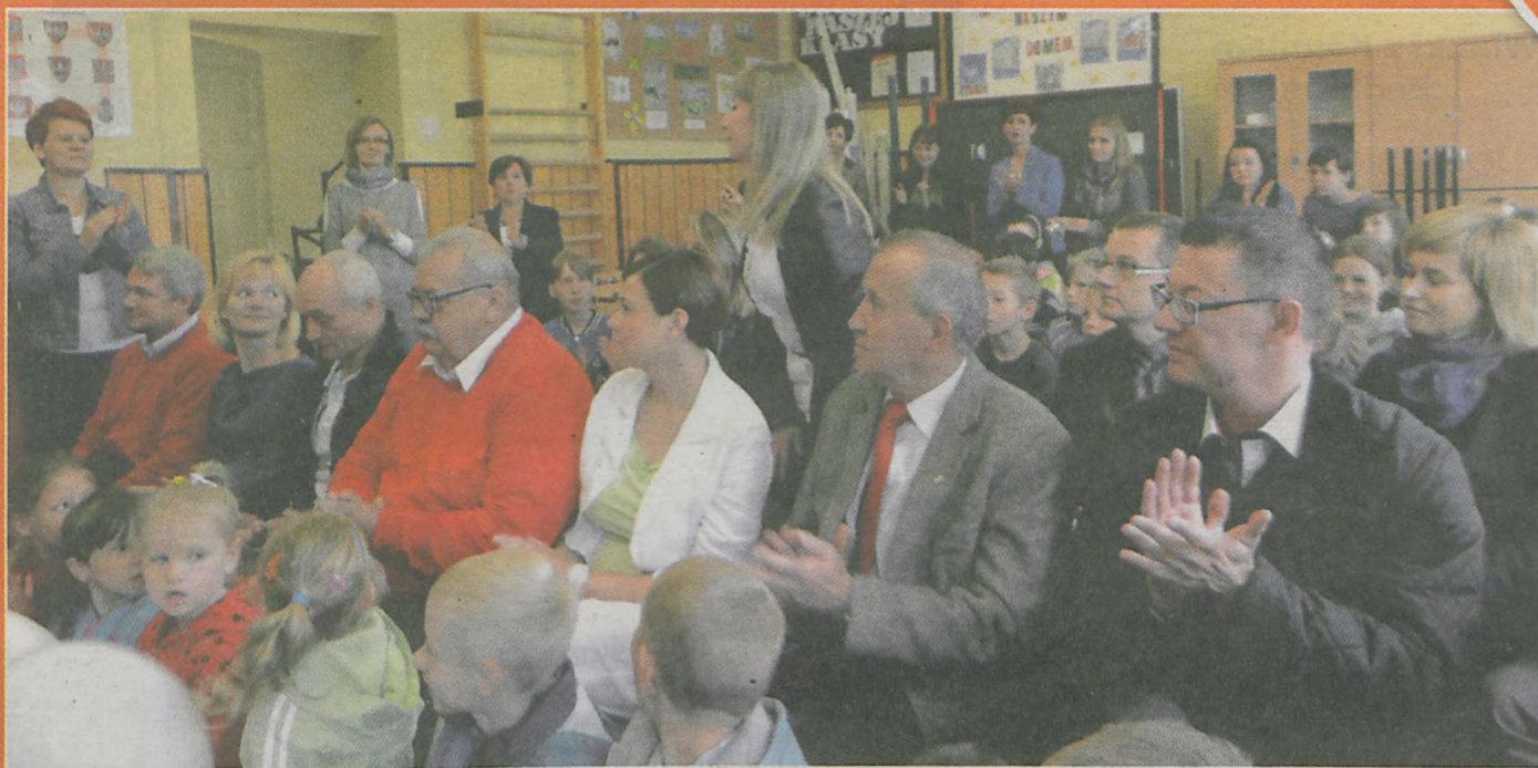
Na rozstrzygnięciu akcji „Piątka dla Gazety” nie zabrakło sponsorów