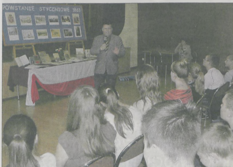
Gimnazjaliści mieli okazję poszerzyć swoją wiedzę na temat powstania z 1863 r.