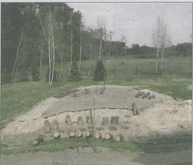
Wszystkie rośliny będą oznakowane i opisane

Kosztorys szacowany jest na ok. 10 tys. zł. Szkoła pozyskuje rośliny od osób prywatnych, sympatyków placówki w Kłęce, od gminy, ze starostwa powiatowego, od rodziców, z firmy „Phytopharm”. (akf)