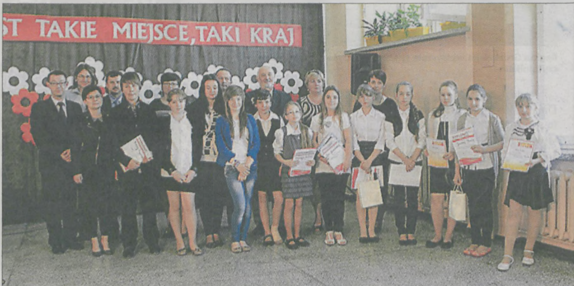
Uczestnicy ze szkół podstawowych, organizatorzy oraz jury