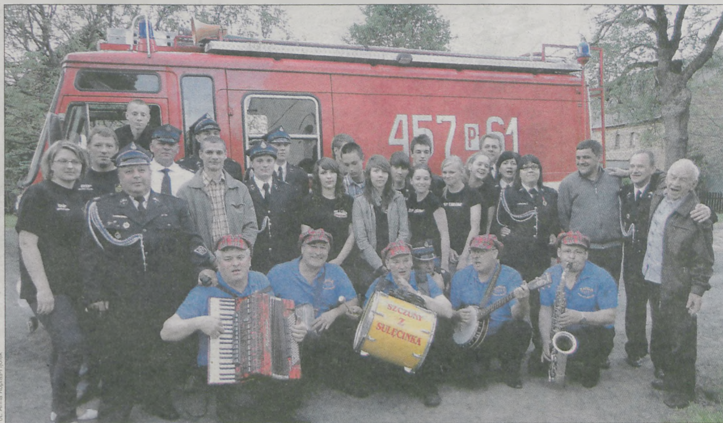
Druhowie ochotczo stanęli do pamiątkowego zdjęcia