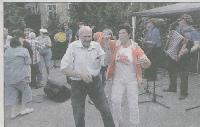
Zabawa trwała od południa do wieczora. Kapela niestrudzenie przygrywała do tańca

Impreza pod hasłem „Razem w „Kregu” zorganizowana została w Dębnie.