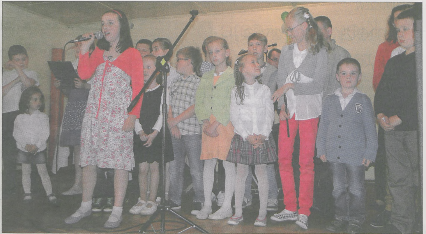
(akf) Ze sceny padały w stronę mam serdeczne słowa podziękowań

Mamo, jak ci dziękować za miłość twą? Mamo, jak ci dziękować za ciepło twoich rąk? (...) Mamo, Kocham cię! - śpiewały dzieci. Wystąpiły z przygotowanym specjalnie z tej okazji programem, za co otrzymały od zgromadzonej w sali wiejskiej publiczności gromkie brawa i cukierki.