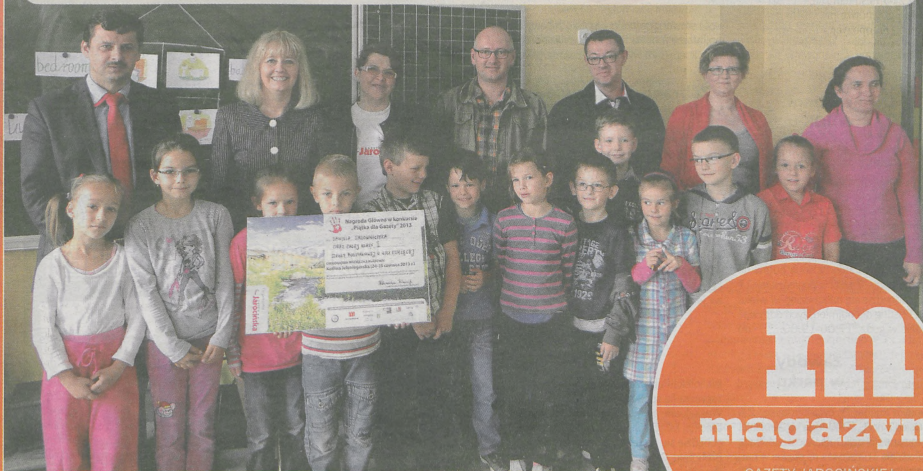
Klasa I SP z Woli Książęcej z przedstawicielami „Gazety Jarocińskiej”, szkoły i władz gminy Kotlin