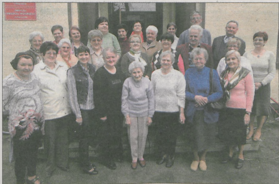
Członkowie „Płomienia nadziei” spotykają się w świetlicy w Boguszynie. Tym razem najważniejszym punktem obrad był wyjazd