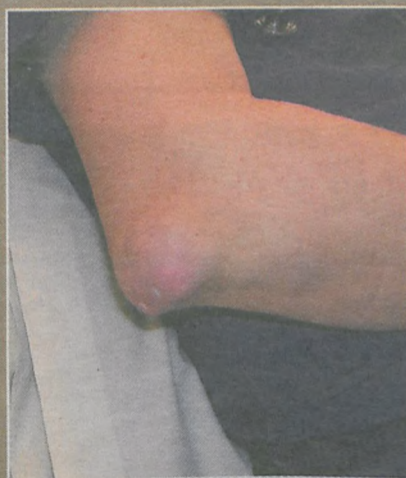
Duży guzek dnawy na łokciu mężczyzny

Kluski śląskie, surówka z marchwi i porów, kefir