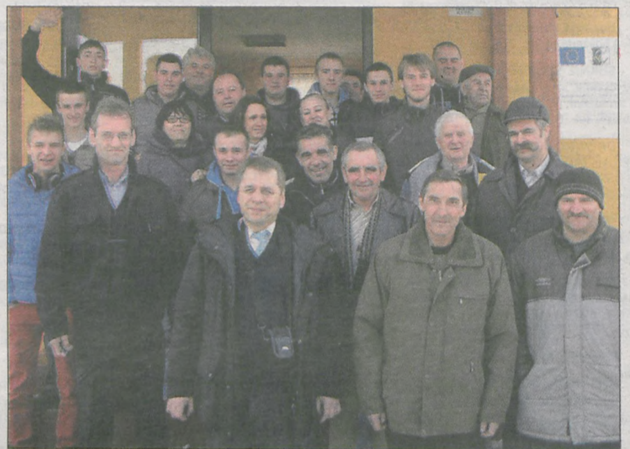
Druhowie podkreślają, że takie turnieje to dobra okazja do integracji