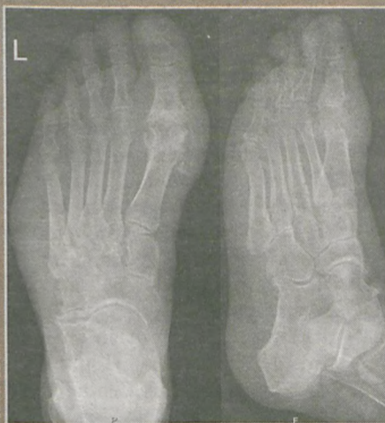
Zmiany dnawe stopy lewej widoczne na zdjęciu RTG

pacjentów i może pomagać w zwiększeniu spożycia błonnika pokarmowego i magnezu.