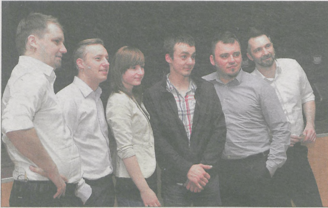
Zdjęcia Stanisław Dziekański