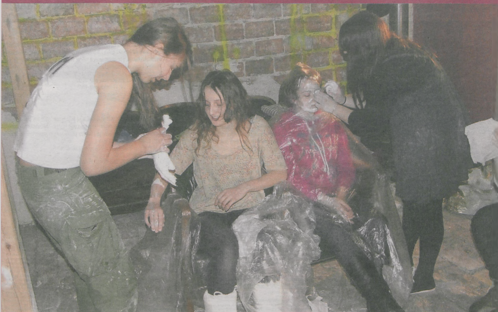
Podczas drzwi otwartych odbywały się lekcje pokazowe. Chętni mogli zrobić gipsowe odlewy różnych części swojego ciała