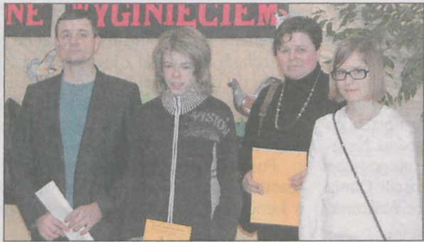
Zwycięzcy konkursu i ich opiekunowie

Okręgowy Konkurs Przyrodniczy „Ptaki Polski zagrożone wyginięciem” odbył się w Żerkowie. Wzięli w nim udział gimnazjaliści z Kotlina, Jarocina, Gizalek i Krotoszyna oraz uczniowie podstawówki w Komorzu. Gospodarze mieli swoje reprezentacje w obu grupach wiekowych.