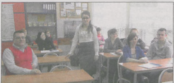
Zajęcia w ramach projektu „Młodzi wiedzą o funduszach” odbyły się między innymi w Zespole Szkół Przyrodniczo-Biznesowych w Tarcach

Ponad 300 uczniów z 6 powiatów uczestniczyło w „Lekcjach Europejskich”.