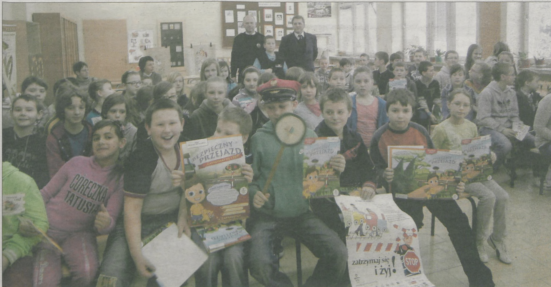
Uczniowie kotlińskiej podstawówki uczyli się zasad bezpieczeństwa na przejazdach kolejowo-drogowych