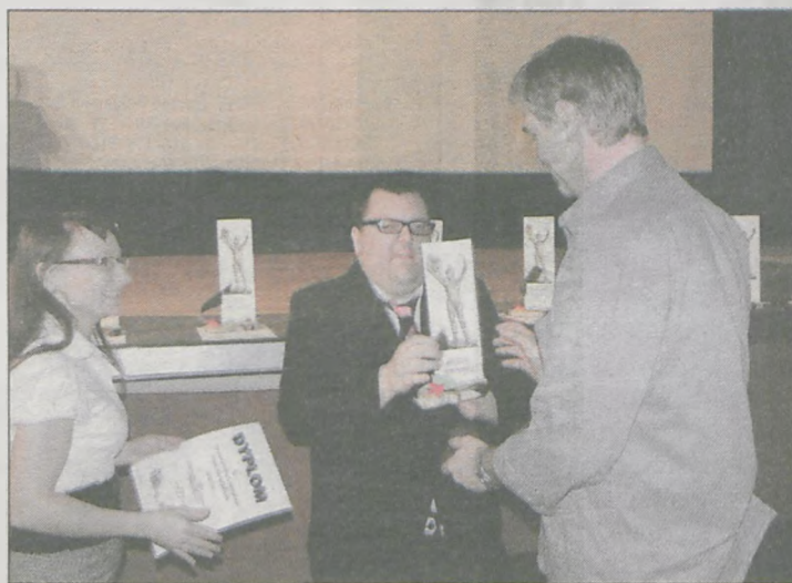
Dla wszystkich ośrodków biorących udział w pierwszej edycji festiwalu filmowego były pamiątkowe statuetki

Inicjatywa zorganizowania imprezy wyszła od klubu filmowego działającego od kilku lat w Środowiskowym Domu Samopomocy. - Często chodzimy do kina i dużo rozmawiamy o filmie. Nasi podopieczni