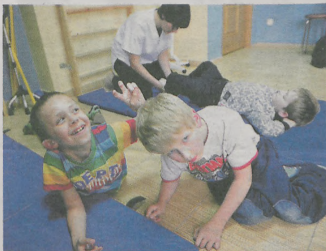
Dzięki turnusom rehabilitacyjnym, które fundacja zorganizowała w ubiegłym roku, dzieci mogły korzystać ze znakomitej opieki w Jarocinie

a) na pomoc chorym dzieciom i młodzieży - na dofinansowanie do turnusów rehabilitacyjnych (4 osoby), zakup środków medycznych (2 osoby), zakup aparatu słuchowego (1 osoba), zakup roweru rehabilitacyjnego (1 osoba), zakup okularów korekcyjnych (1 osoba) wydano w sumie 10.377,60 zł . b) na dofinansowanie do turnusów rehabilitacyjnych współorganizowanych przez Fundację wydano w sumie 6.454,49 zł .