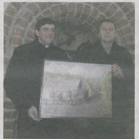
Proboszcz dębińskiej parafii podarował do świetlicy wiejskiej jeden ze swych obrazów przedstawiających uroki Ziemi Nowomiejskiej