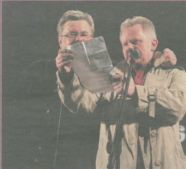
Poznański kabaret „Mechaniczna Pyra” rozbawił publiczność zgromadzoną w Jarocińskim Ośrodku Kultury