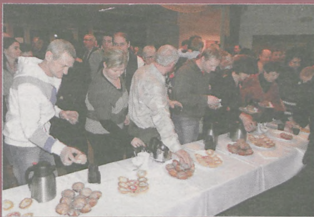
Pączki i babeczki rozeszły się w bardzo szybkim tempie