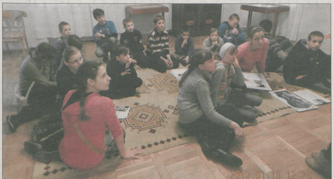
Uczniowie szkoły w Lubini Małej z zainteresowaniem słuchali opowieści o życiu Adama Mickiewicza