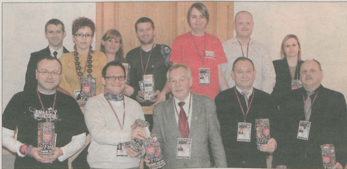
Powiatowa ekipa wolontariuszy tuż przed wyruszeniem na zbiórkę