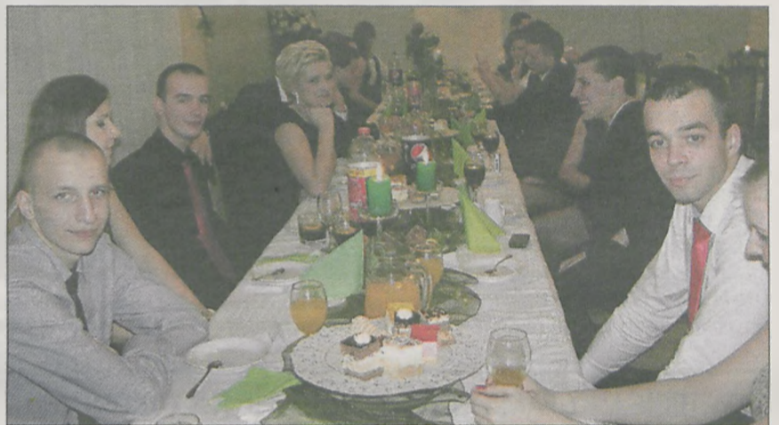
W przerwach między tańcami był czas na rozmowy i poczęstunek