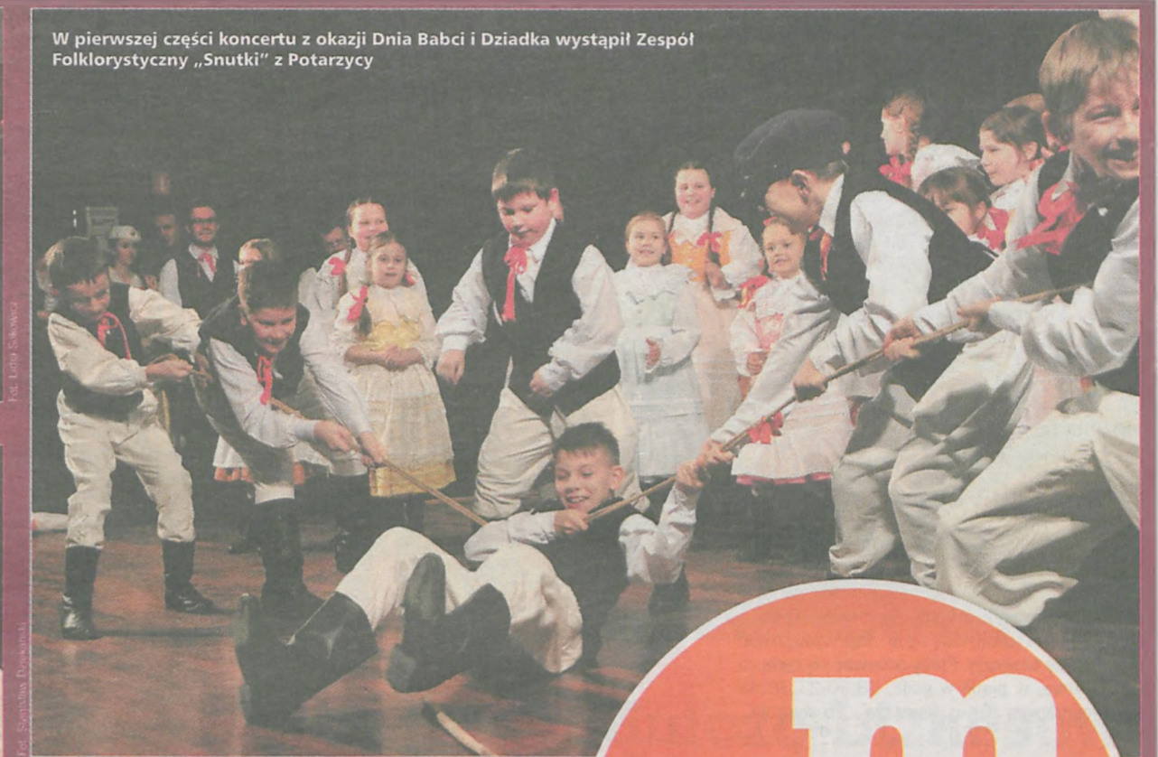
W pierwszej części koncertu z okazji Dnia Babci i Dziadka wystąpił Zespół Folklorystyczny „Snutki” z Potarzycy