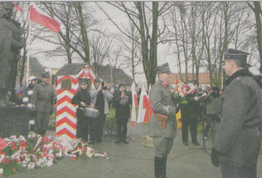
Główna część uroczystości odbyła się przy pomniku generała Taczaka na mieszkowskim rynku