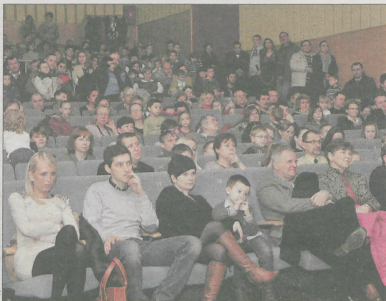
Kino „Echo” było podczas gali Białych Tygrysów wypełnione po brzegi