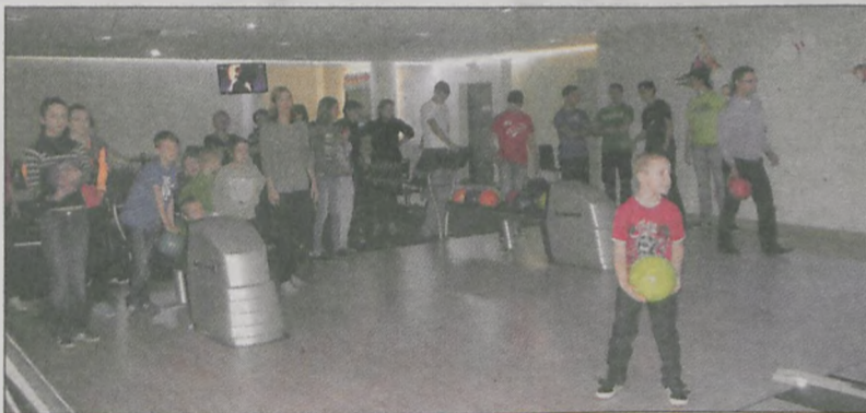
Dla większości uczestników wycieczka była to pierwsza wizyta w kręgielni. Mimo rywalizacji na punkty, wszyscy świetnie się bawili