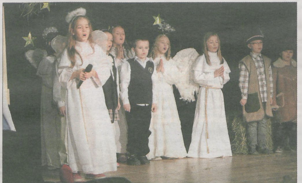
Bożonarodzeniowe prezentacje w Jaraczewie to jedna z cyklicznych imprez organizowanych przez GOK