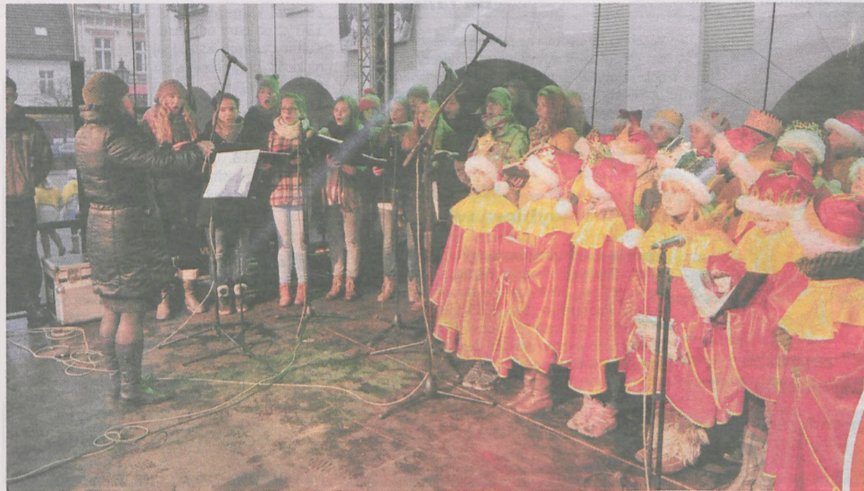
Na jarocińskim rynku kolędowni mali i nieco więksi