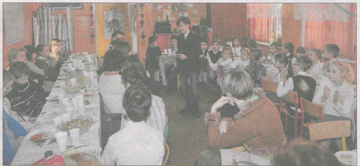
Szkolna wigilia w Lubini Małej zgromadziła przy stole kilkadziesiąt osób