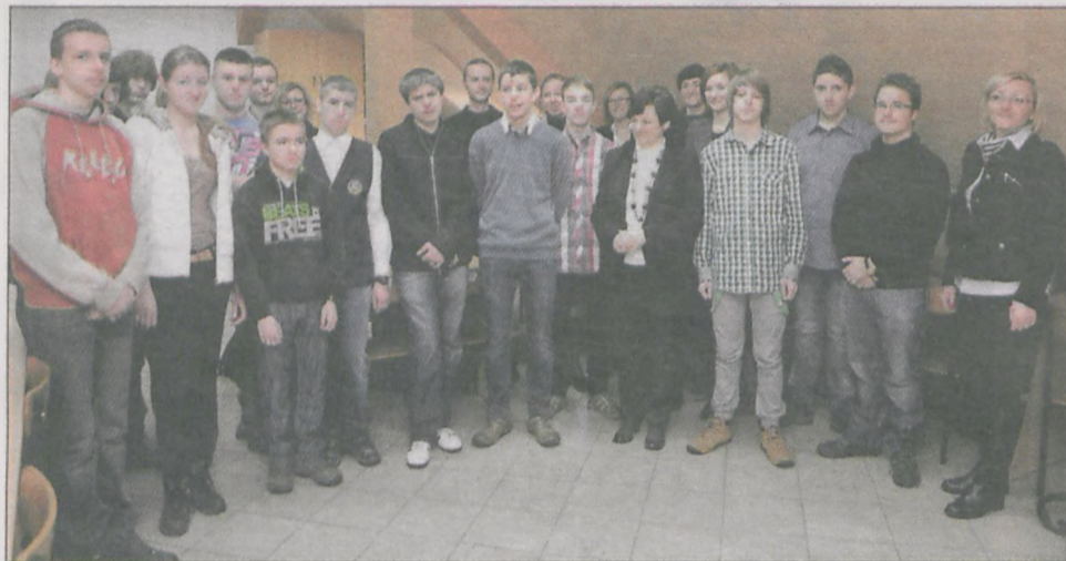
Reprezentanci gimnazjów z gminy Jarocin walczyli o miano najlepszego matematyka wykorzystującego internet