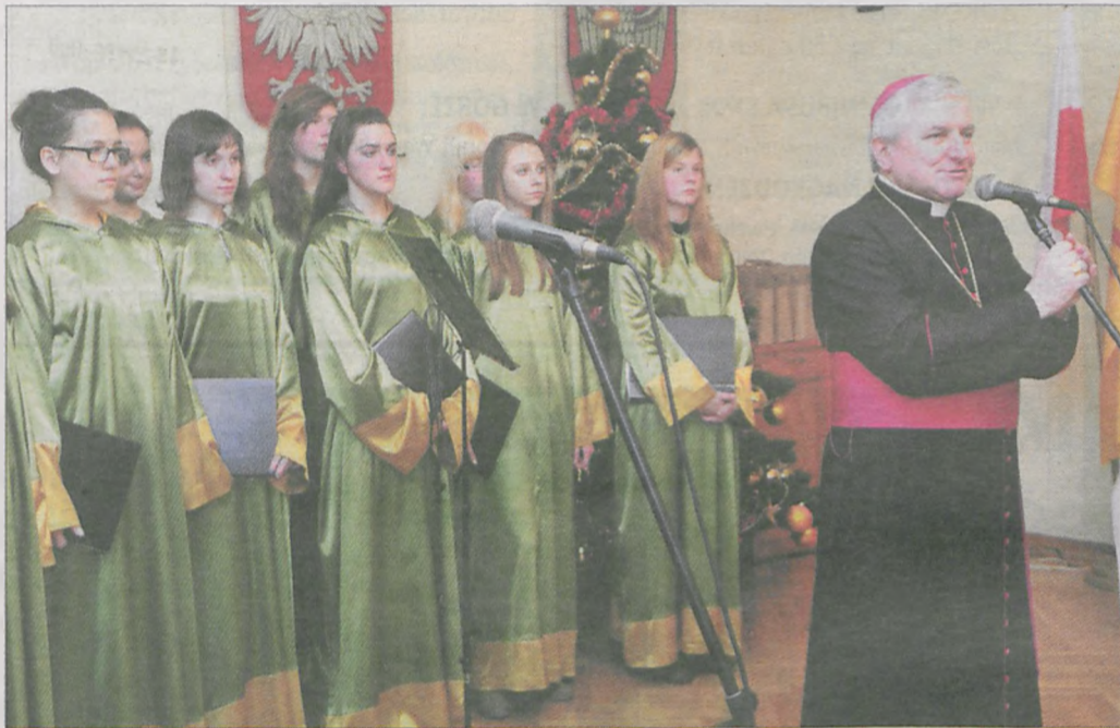
Biskup kaliski przyznał, że gości co prawda w Jarocinie po raz pierwszy, ale wiele do tej pory słyszał na temat miasta i festiwalu