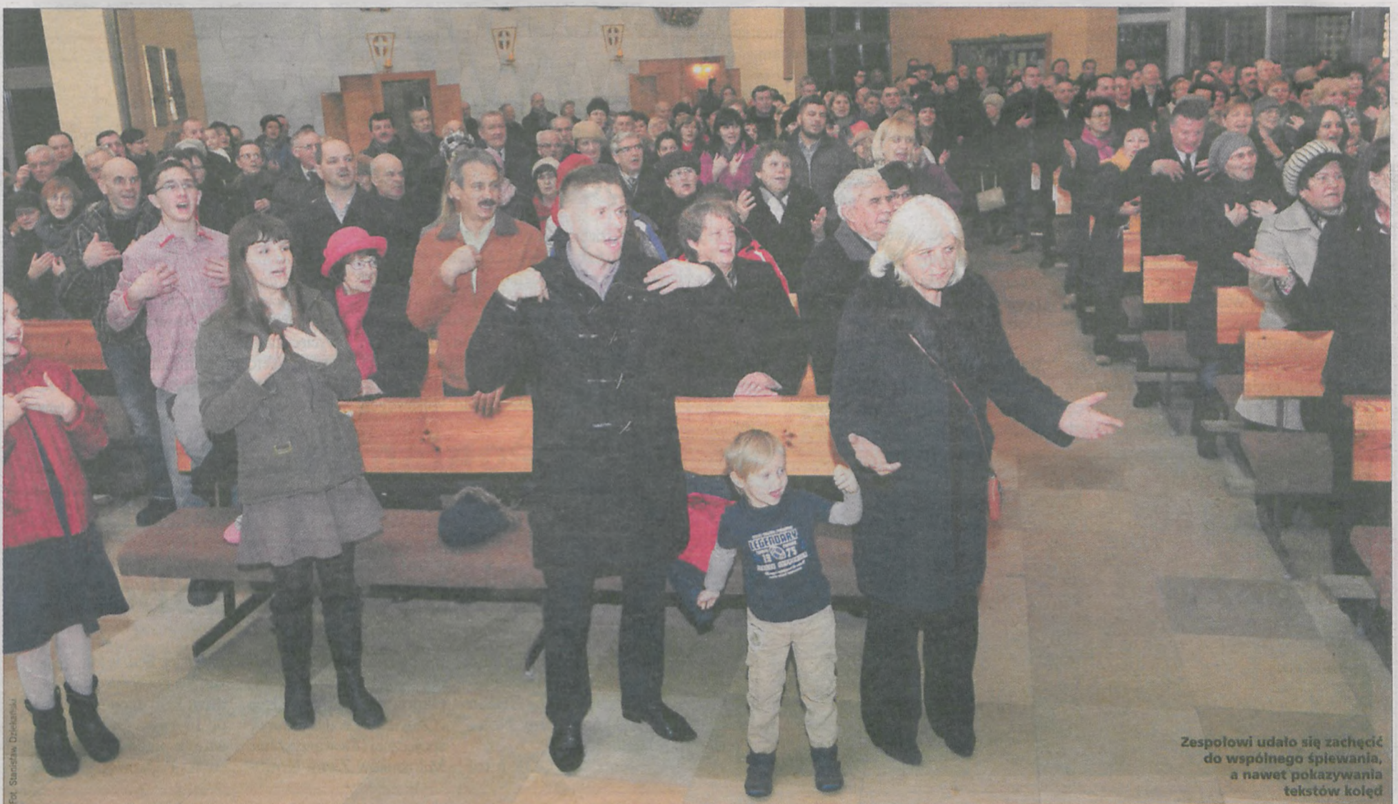
Zespołowi udało się zachęcić do wspólnego śpiewania, a nawet pokazywania tekstów kolęd