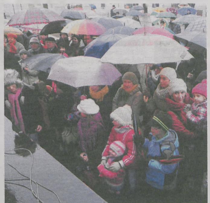
Mimo trudnych warunków pogodowych jarociniacy nie zawiedli. Większość stanowiły rodziny małych wykonawców