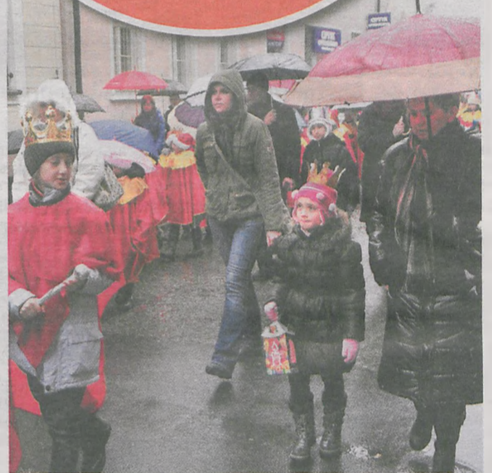
Wielu uczestników miało własnoręcznie przygotowane korony

oraz śpiewie kolęd, podobnie jak i to ubiegłoroczne, było udane i bardzo radosne. Biblioteka Publicznej w Jarocinie znów udało się zachęcić do działania wiele instytucji, przedszkoli oraz zespoły wokalne. Impreza stanowi ciekawą formę uczczenia święta Trzech Króli. Orszak zorganizowano w Jarocinie po raz pierwszy. (1s)