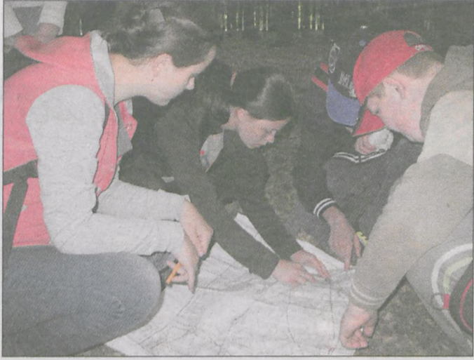
Uczniowie ćwiczyli umiejętności posługiwania się mapą