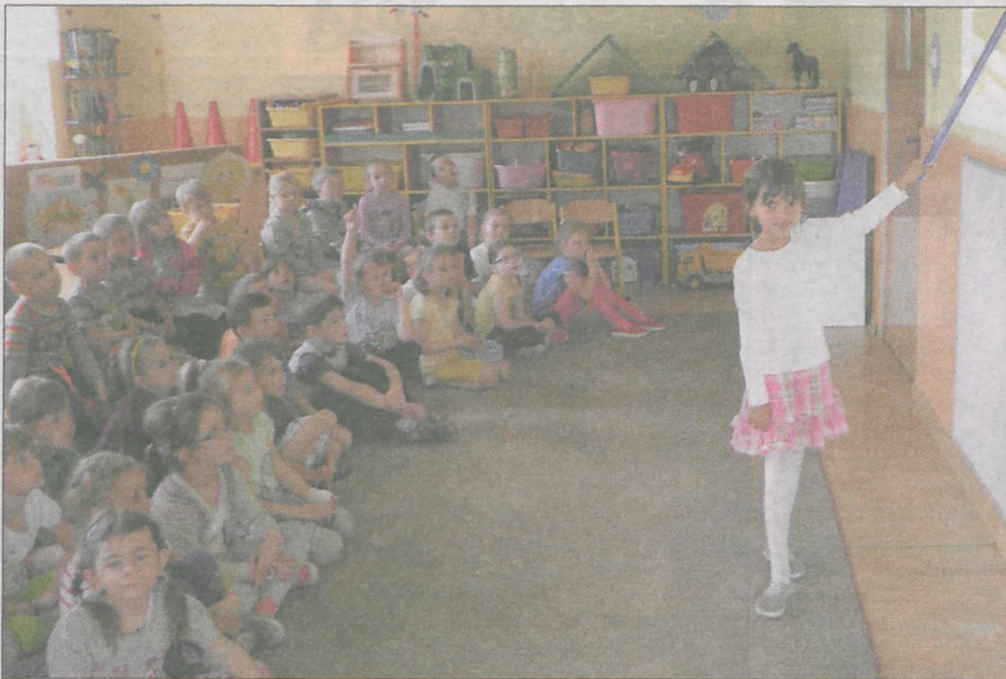
W pierwszym kwartale czerwca gościliśmy z wizytą w przedszkolu w Witaszycach. Spotkanie było okazją do wspólnego przygotowania się do wakacji. Uczyliśmy najmłodszych, kogo w lesie możemy spotkać i jak się należy zachować podczas letnich eskapad na łonie natury.

Jeżeli będziesz potrzebował pomocy, ale tylko w ważnych sytuacjach, możesz skorzystać z